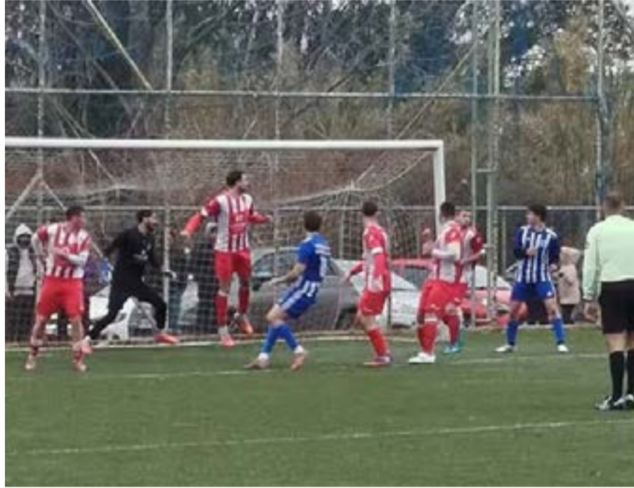
Από το ματς του Γενάρη για το Σούπερ Καπ ανάμεσα σε Ολυμπιάδα και ΑΕ Λευκίμμης

Να τονίσουμε ότι η Ολυμπιάδα σαν κυπελλούχος ΕΠΣΚ 2025 με την ΑΕ Λευκίμμης πρωταθλήτρια ΕΠΣΚ 2025, βρέθηκαν αντίπαλες το Γενάρη του 2026 για το Σούπερ Καπ, με την ΑΕ Λευκίμμης να