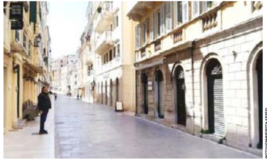
Κόντρα στην απόφαση του Υπουργείου Ανάπτυξης

Με αφορμή την λειτουργία των καταστημάτων την Κυριακή των Βαΐων (5 Απριλίου 2026), δηλώνουμε την κάθετη αντίθεσή μας σε κάθε προσπάθεια κατάργησης της Κυριακάτικης Αργίας, που αποδυναμώνει την μικρομεσαία επιχειρηματικότητα και διαταράσσει την κοινωνική συνοχή. Η λειτουργία των καταστημάτων τις Κυριακές: Δεν αυξάνει τον συνολικό τζίρο, αλλά ανακατανέμει την κατανάλωση, ευνοώντας κυρίως τις μεγάλες αλυσίδες εις βάρος των μικρών τοπικών επιχειρήσεων.