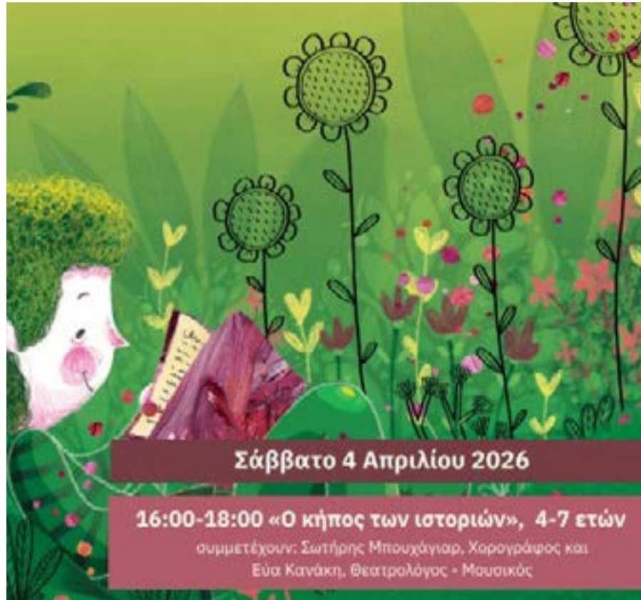
Η αφίσα της εκδήλωσης