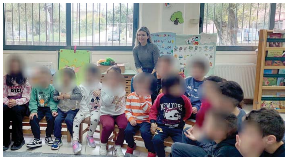
ΦΩΤΟ@ΔΗΜΟΤΙΚΟ ΑΓΙΟΥ ΜΑΡΚΟΥ

ΚΕΡΚΥΡΑ. Με αφορμή την Παγκόσμια Ημέρα Παιδικού Βιβλίου, πραγματοποιήθηκε μια ιδιαίτερη εκπαιδευτική δράση με τη συμμετοχή της Ε' Τάξης του Δημοτικού Σχολείου Αγίου Μάρκου και του Νηπιαγωγείου. Η ΕΛΕΝΗ ΚΟΡΩΝΑΚΗ. ΣΕΛΙΔΑ 12.