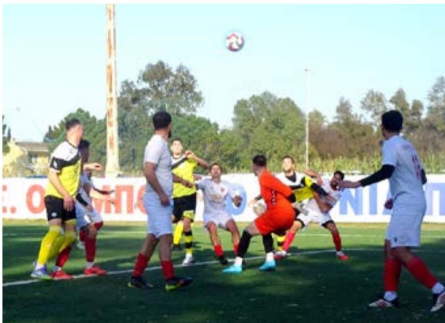
Από το ματς του α' γύρου Βολίδα - Οδυσσεάς

Αναλυτικά όλα τα αποτελέσματα της Γ' Φάσης, 1ο και 2ο ματς Κρόνος - Ολυμπιάδα 1-4 2-2 ΑΕ Λευκίμμης - Ο ΦΑΜ 0-0 κ.α. 0-0 (4-1 πεν.) Αστέρας Πετριτή - Θιναλιακός 1-2 0-6 Όλυμπος - ΑΟ Παξοί 1-1 1-2