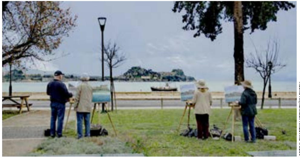
Η παραλία Γαρίτσας θα γίνει Σηκουάνας

Και όταν οι ευθύνες φτάνουν μέχρι την κορυφή της κυβερνητικής πυραμίδας, τα περιθώρια τελειώνουν. Ή θα αποδειχθεί στην πράξη ότι κανείς δεν είναι υπεράνω, ή θα επιβεβαιωθεί ότι η ατιμωρησία αποτελεί δομικό χαρακτηριστικό του συστήματος. Σε αυτή την περίπτωση, κρίνεται η ίδια η δημοκρατία. Και δεν είναι λίγες οι διεθνείς εμπειρίες που το επιβεβαιώνουν.