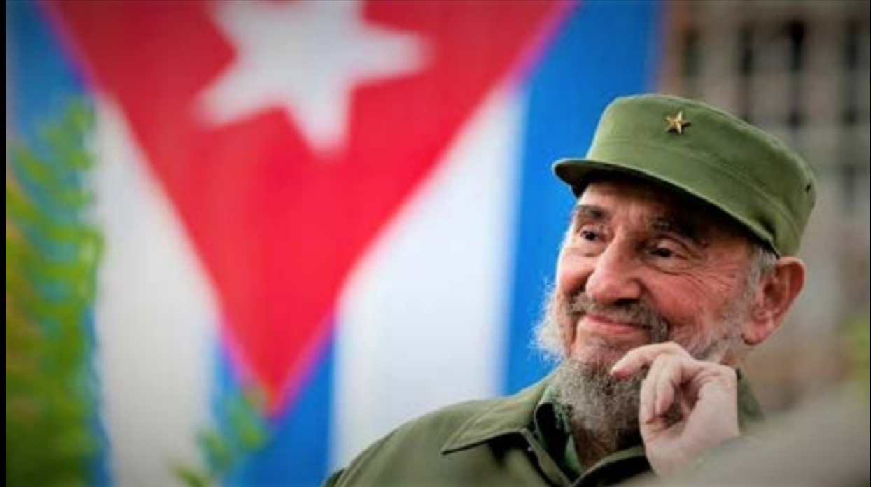
«Οι άνθρωποι πρέπει να οργανωθούν, να ενημερωθούν και να ασκήσουν πίεση στις κυβερνήσεις τους, προκειμένου να αποτραπεί η πολεμική «κλιμάκωση».

Ο Michel Chossudovsky είναι Καναδός οικονομολόγος, συγγραφέας και ομότιμος καθηγητής στο University of Ottawa. Είναι ιδρυτής και διευθυντής του Centre for Research on Globalization (Global Research), όπου δημοσιεύει αναλύσεις για την παγκόσμια οικονομία, τη γεωπολιτική και τους πολέμους. Το έργο του εστιάζει στην κριτική της παγκοσμιοποίησης, του ρόλου διεθνών οργανισμών και της εξωτερικής πολιτικής των ΗΠΑ και του NATO. Έχει συγγράψει βιβλία και πλήθος άρθρων, ενώ συμμετέχει ενεργά σε δημόσιες παρεμβάσεις και διεθνείς συζητήσεις για ζητήματα ειρήνης και παγκόσμιας ασφάλειας.