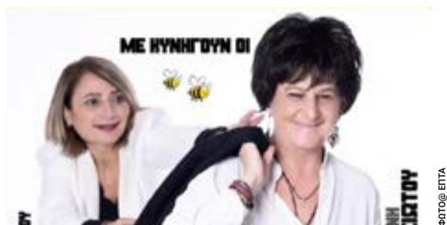
Η αφίσα της συναυλίας

Οι αντικρουόμενες αυτές εκδοχές αφήνουν μέχρι σήμερα αναπάντητα ερωτήματα για το τι ακριβώς συνέβη και ποιος φέρει την τελική ευθύνη.