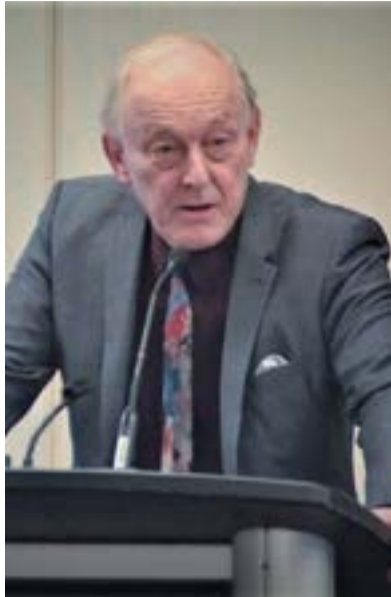
Ο Καναδός οικονομολόγος και καθηγητής του University of Ottawa, γνωστός για τις αναλύσεις του γύρω από την παγκοσμιοποίηση, τη γεωπολιτική και τους σύγχρονους πολέμους.