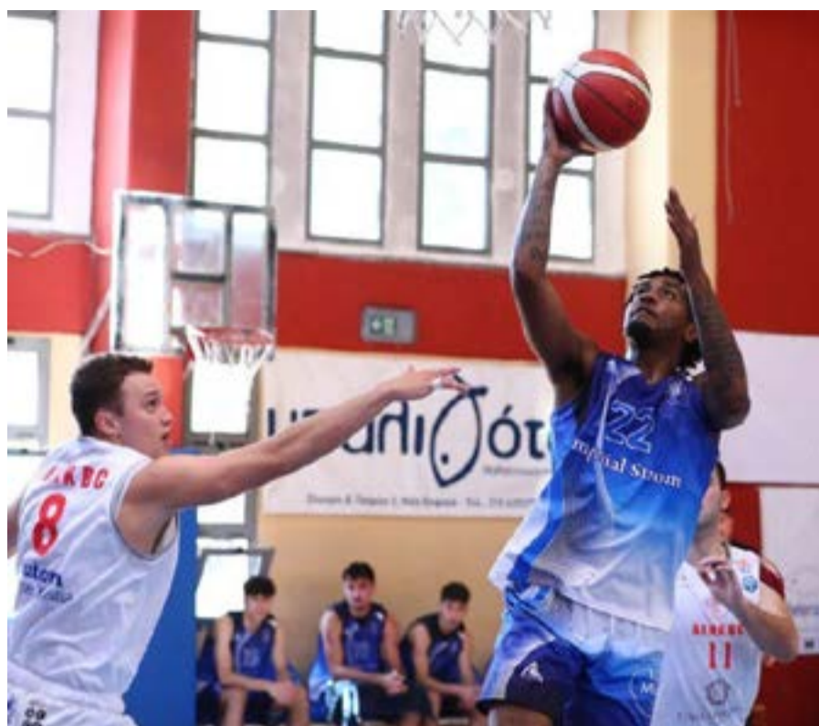
Από τον αγώνα Κηφισιά - Ιόνιος

ταίες ομάδες δηλαδή 10 με 13 και 11 με 12. Ο Ιόνιος που είναι 10ος (έχει καλύτερη διαφορά στα ματς με την Σαρωνίδα) θα αντιμετωπίσει τυπικά την Κηφισιά η οποία όμως αποχώρησε από το πρωτάθλημα, άρα μένει και υποβιβάζεται η αντίπαλός του, ενώ θα αναμετρηθούν Σαρωνίδα - Έσπερος Καλλιθέας και ο χαμένος θα υποβιβαστεί. Άρα ο Ιόνιος με νίκη «καθαρίζει» το θέμα παραμονής, αλλά ακόμη και με ήττα αν χάσει η Σαρωνίδα από το Παγκράτι, αλλά δεν σκέφτεται κάτι τέτοιο. Με γεμάτο το κλειστό ο πρεσβευτής του Κερκυραϊκού μπάσκετ και την επόμενη χρονιά θα παίξει στην National League 1.