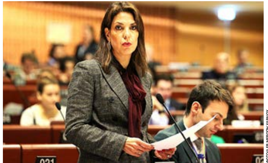
Η παράταξη της πρ. δημάρχου εκφράζει ανησυχία ότι η έλλειψη συντονισμού και η αδιαφορία θέτουν σε κίνδυνο την ομαλή διεξαγωγή του κερκυραϊκού Πάσχα.

Παράλληλα, γίνεται λόγος για υποβάθμιση του πολιτικού διαλόγου, με αναφορές σε απρεπείς και προσβλητικές εκφράσεις από πλευράς διοίκησης, οι οποί-