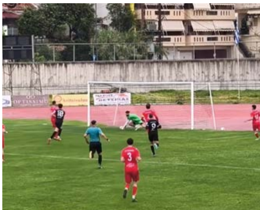
Από το τελευταίο ματς Αναγέννηση Άρτας - ΑΕ Λευκίμμης

Ένα από τα προβλήματα που αντιμετωπίζουν στα πρωταθλήματα υποδομών είναι η αδυναμία