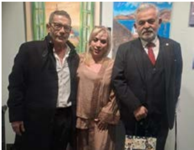
Η Στεφανία Καρύδη στα εγκαίνια της έκθεσης

ΚΕΡΚΥΡΑ. Ο Λούης Πατσαλίδης έρχεται με την ιδιόχειρη stand up comedy «ΠΛΗΝ 30», στον Ορφέα, το Σάββατο 4 Απριλίου στις 21:00. Ο Κύπριος κωμικός Λούης Πατσαλίδης, παρουσιάστηκε του δημοφιλέστερου σατιρικού show στην κυπριακή τηλεόραση με τον τίτλο «Λούης Night Show», φέρνει το εκρηκτικό του χιούμορ στον Ορφέα, την παράσταση του «ΠΛΗΝ 30».