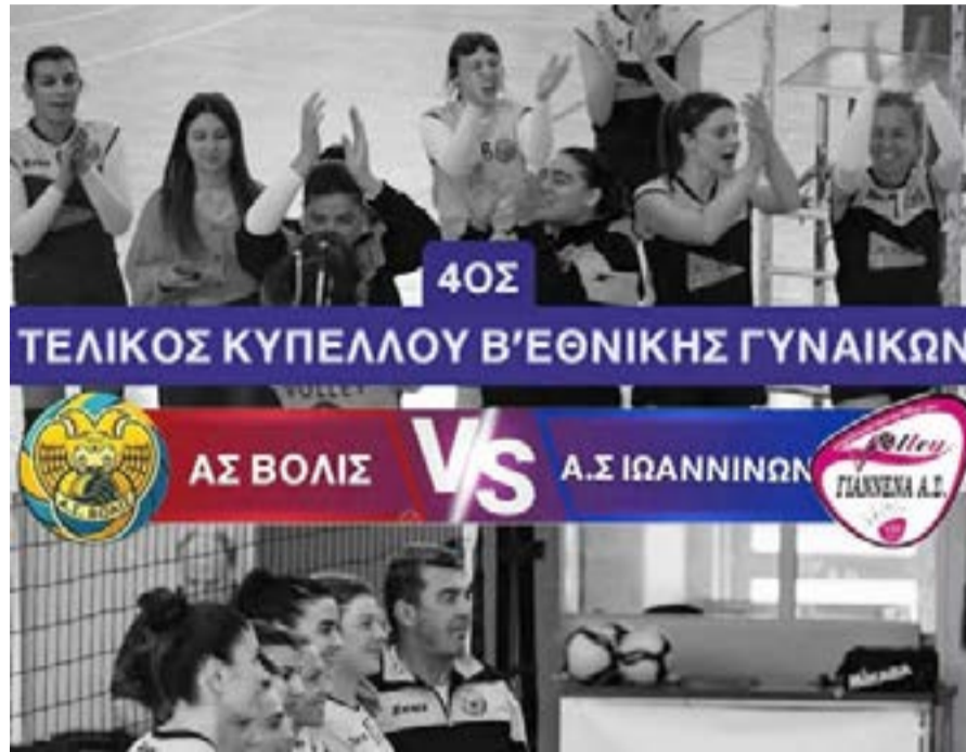
Η αφίσα της ομάδας για τον κρίσιμο αγώνα

Αυτό που θέλουν οι άνθρωποι της Βολίδας είναι μια διαιτησία σωστή και όχι μια σαν αυτή που τους ανάγκασε σε ήττα, με τις απίθανες αποφάσεις της, στο προηγούμενο ματς στα Γιάννενα. Παράλληλα τα κορίτσια της Βολίδας θέλουν τον κόσμο δίπλα τους, έστω και αν η μέρα και η ώρα δεν προσφέρεται.