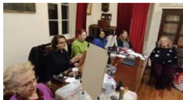
Κάθε Σάββατο (18:00 – 21:00) στην Ιατροχειρουργική Εταιρεία