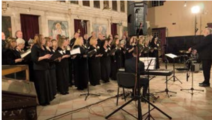
Η συναυλία θα φιλοξενηθεί στο χώρο του Μουσείου Ασιατικής Τέχνης