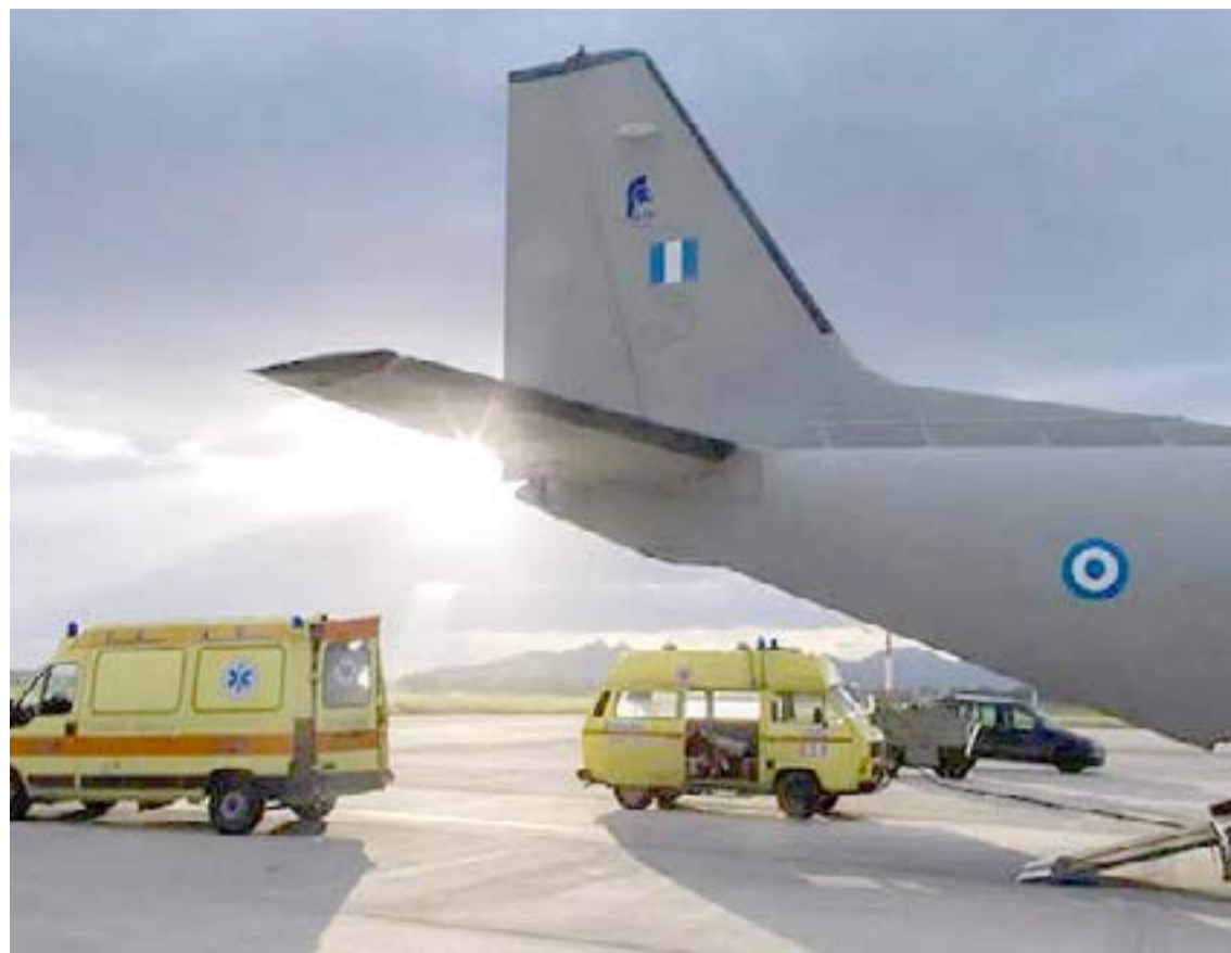
Ο βουλευτής επισημαίνει, άλλα λέει το υπουργείο άλλα λέει η εταιρεία. Το θέμα παραμένει ανοικτό.