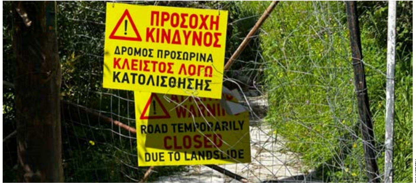
Κλειστό παραμένει το μονοπάτι προς τη γέφυρα και το Ποντικονήσι.

Έλλειψη φωτισμού: Το σημείο παραμένει σκοτεινό τις νύχτες. Καθαριότητα: Δεν υπάρχουν κά-