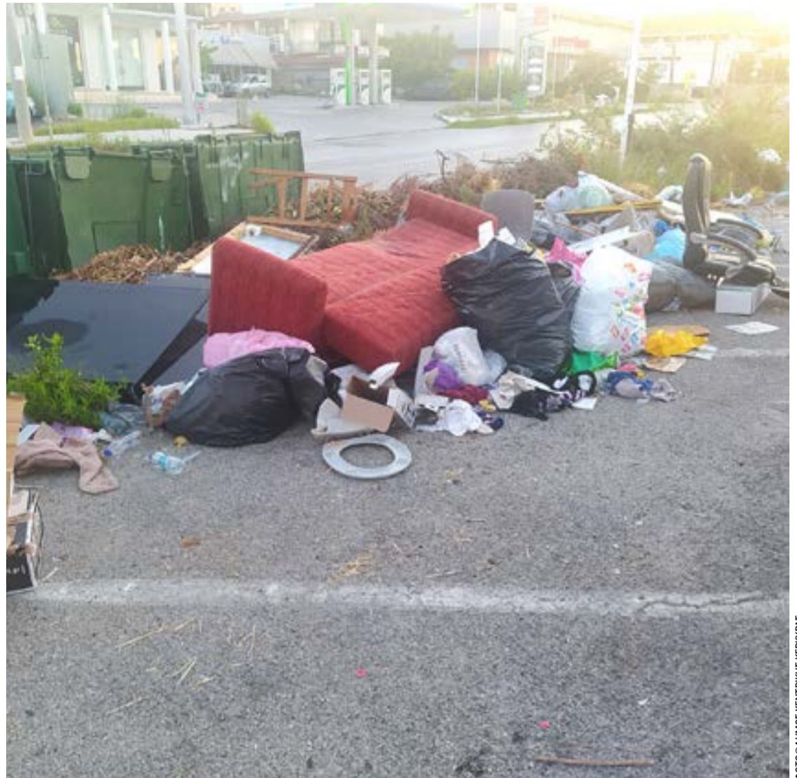
Ο δήμος ζητά τη συνεργασία των δημοτών για καθαρή πόλη

Ο Δήμος προχωρά στην κατάθεση μήνυσης κατ' αγνώστων.