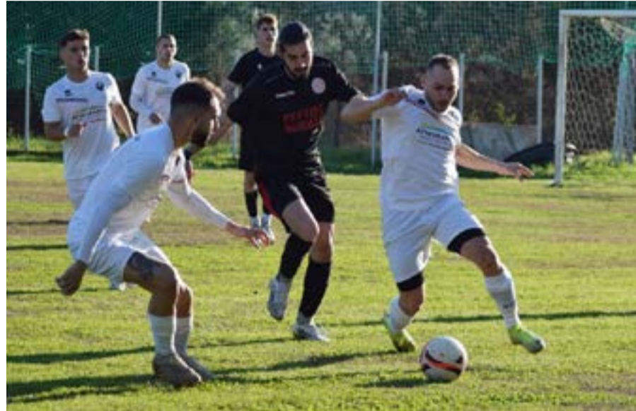
Από το ματς πρωταθλήματος στην Άρτα ανάμεσα σε Πρόοδο Ρωγών και ΑΕ Λευκίμμης