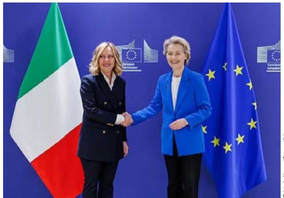
Christophe Licoppe / European Union

Οι ηγέτες υπογραμμίζουν ότι μια τέτοια εξέλιξη είναι κρίσιμη