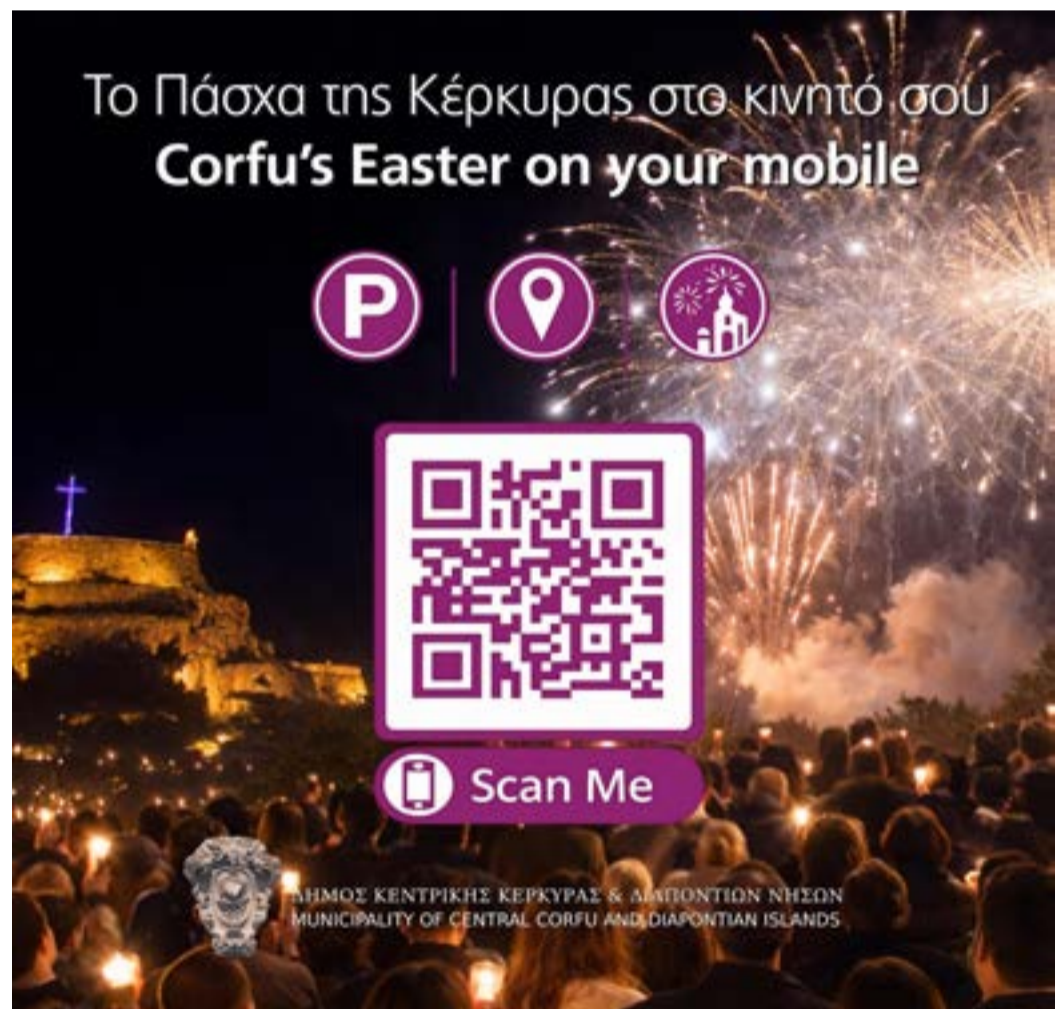
Το QR Code του δήμου για την ψηφιακή περιήγηση

Ίσως, τελικά, το ερώτημα δεν είναι αν η τελετή έχει χάσει το περιεχόμενό της, αλλά αν μπορεί ακόμη να το ανακτήσει χωρίς να απωλέσει την απήχηση που της εξασφαλίζει η αγορά. Διότι όσο η μορφή επιβιώνει και πολλαπλασιάζεται, τόσο περισσότερο απομακρύνεται από την κιβωτό για τις ανάγκες της οποίας κάποτε γεννήθηκε. Και όσο περισσότερο απομακρύνεται, τόσο πιο δύσκολο γίνεται να επιστρέψει — όχι επειδή δεν υπάρχει δρόμος, αλλά επειδή η ίδια η διαδρομή έχει μετατραπεί σε εμπόρευμα.