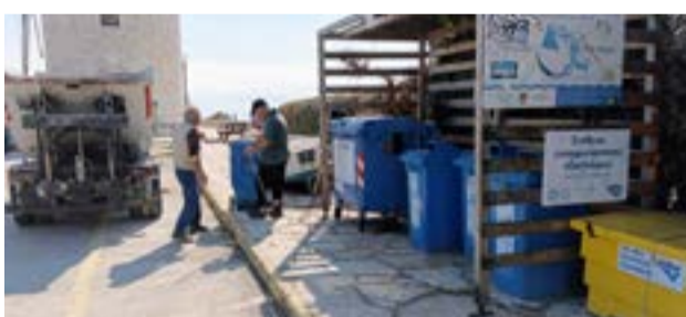
ΦΩΤΟ@ΔΗΜΟΣ ΚΕΝΤΡΙΚΗΣ ΚΕΡΚΥΡΑΣ

Περισσότερες πληροφορίες στο www.corfugardenfestival.com