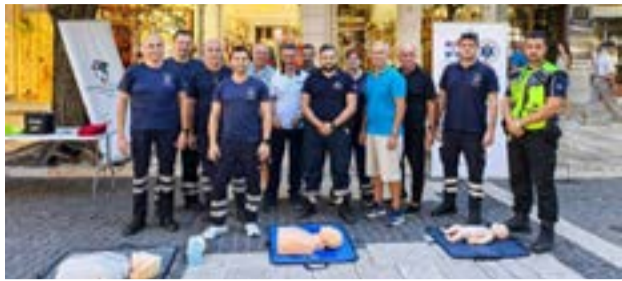
Από την εκπαίδευση του ΕΚΑΒ στις πρώτες βοήθειες