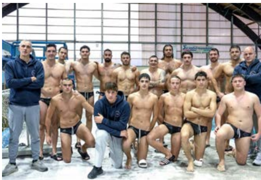
Η ομάδα του ΝΑΟΚ έτοιμη για το μεγάλο άλμα κάθε όμιλο και οι αγώνες θα είναι:

Με βάση την προκήρυξη φέτος στα play off θα παίξουν χιαστί οι τέσσερις πρώτες ομάδες από