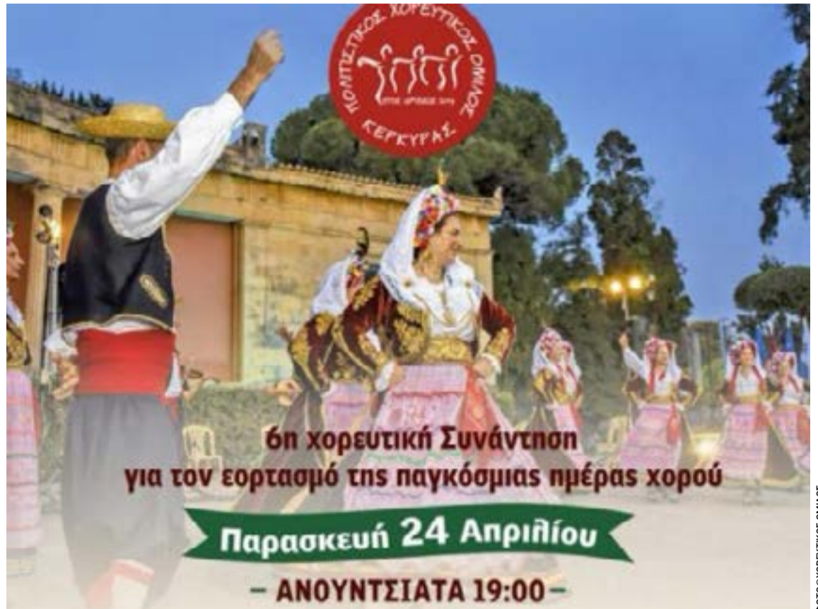
Η αφίσα της συνάντησης