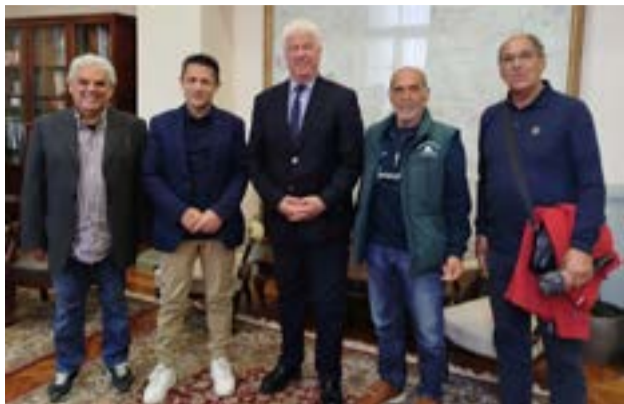
Από την συνάντηση στην Περιφέρεια