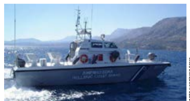
Ο 83χρονος νοσηλεύεται στο νοσοκομείο

Την ένταξη στο ΕΣΠΑ της Β' φάσης του έργου αντικατάστασης του εσωτερικού δικτύου ύδρευσης Ληξουρίου, ανακοίνωσε χθες ο περιφερειάρχης Γ. Τρεπεκλής. Το έργο με προϋπολογισμό 888.404,80 €, θα επιφέρει ουσιαστική βελτίωση στην ποιότητα και στην επάρκεια του πόσιμου νερού, καθώς και τη δραστητική μείωση των απωλειών του δικτύου.