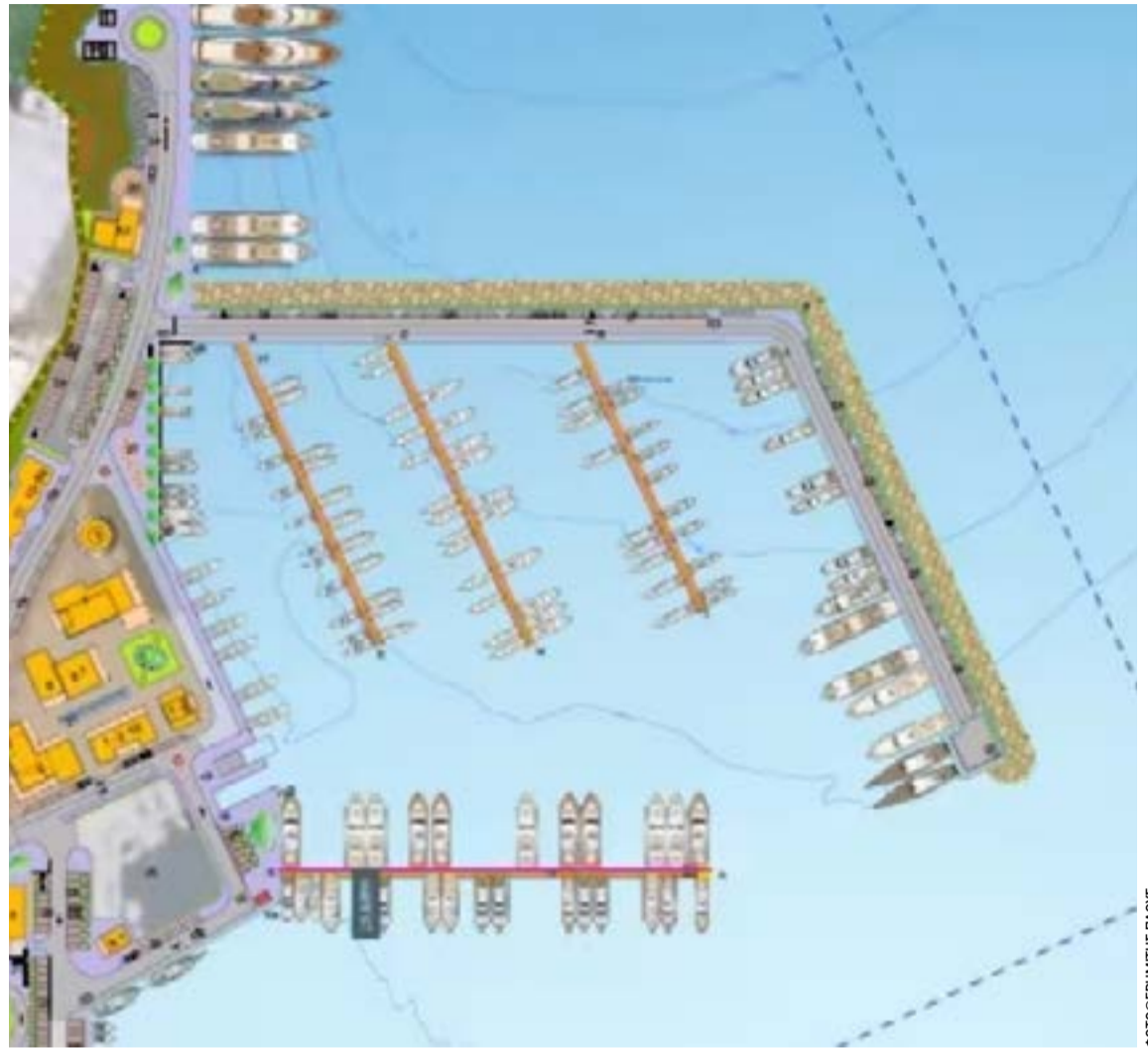
Το σχεδιάγραμμα της μαρίνας

https://www.fraport-greece.com/el/tecnognosia-kai-ypiresies/aerometafores/epibatiki-knisi.html