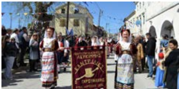
Από εκδήλωση του συλλόγου

Πανελλαδική απεργία για τις 24 Απριλίου, προκήρυξε η Ομοσπονδία Εργαζομένων Οργανισμών Τοπικής Αυτοδιοίκησης. Ζητούν «τη νομιμοποίηση όλων των εργαζομένων, την κατάργηση της «Διάταξης Βορίδη», πραγματικές αυξήσεις και άμεση επαναφορά του 13ου και 14ου μισθού». Τέλος ζητούν «να σταματήσει η ομηρία στους παιδικούς σταθμούς, Κ.Δ.Α.Π., Κ.Δ.Α.Π.-Μ.Ε.Α. και τις λοιπές δομές των ΟΤΑ».