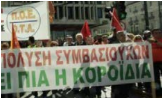
Από συγκέντρωση της ΠΟΕ ΟΤΑ