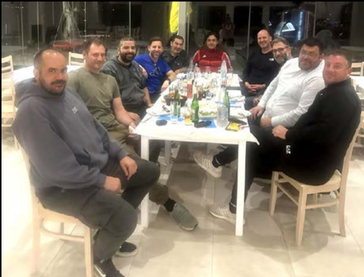
Από συνάντηση μελών της ομάδας