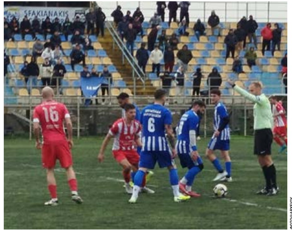
Από τον τελικό του Σούπερ Καπ Ολυμπιάδα - ΑΕ Λευκίμμης