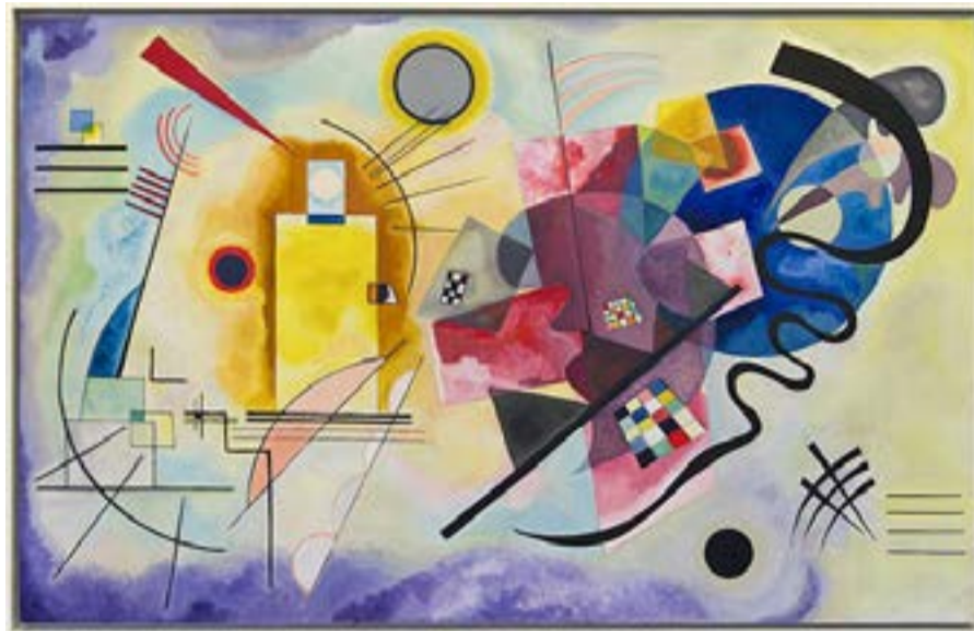
Λάδι σε καμβά (1925) του Vassily Kandinsky. Δωρεά της Nina Kandinsky, 1976. AM 1976-856.

ΑΘΗΝΑ. Η Εθνική Πινακοθήκη – Μουσείο Αλεξάνδρου Σούτσου, σε συνεργασία με το MOMUS – Μουσείο Μοντέρνας Τέχνης και τη Συλλογή Κωστάκη, παρουσιάζει από τις 15 Απριλίου έως τις 27 Σεπτεμβρίου 2026 την επετειακή έκθεση «Ο κόσμος της πρωτοπορίας. Πόλη, φύση, σύμπαν, άνθρωπος», σηματοδοτώντας τη συμπλήρωση τριάντα ετών από την πρώτη μεγάλη παρουσίαση της συλλογής στην Ελλάδα. Η έκθεση επανεξετάζει τη σημασία της ρωσικής πρωτοπορίας μέσα από τη σχέση ανθρώπου και περιβάλλοντος, φωτίζοντας τη μετάβαση από τη σύμβαση στο πείραμα και από τον κανόνα στην ουτοπία, σε μια περίοδο έντονων πολιτικών, ιδεολογικών και αισθητικών αναζητήσεων στις αρχές του 20ού αιώνα.