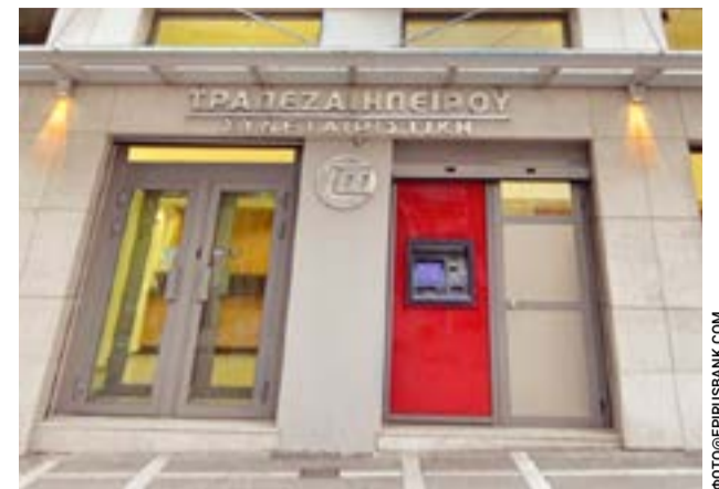
Ο έλεγχος συνεχίζεται σε όλες τις Τράπεζες

Μέσα σε αυτό το περιβάλλον, ξεκινούν οι εργασίες του Συνεδρίου, που θα διαρκέσουν από την Πέμπτη 16 έως και την Κυριακή 19 Απριλίου στο ξενοδοχείο «Creta Maris» στο Ηράκλειο. Θα πραγματοποιηθεί ο απολογισμός της δράσης της Συνομοσπονδίας και θα καθοριστούν οι βασικές προτεραιότητες για το επόμενο διάστημα, ενώ θα εκλεγούν τα νέα όργανα –το Διοικητικό Συμβούλιο, η Εξελεγκτική Επιτροπή και το Γενικό Συμβούλιο.