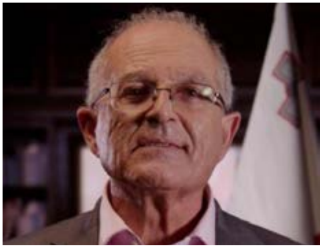
Ο συγγραφέας του βιβλίου Arnold Cassola