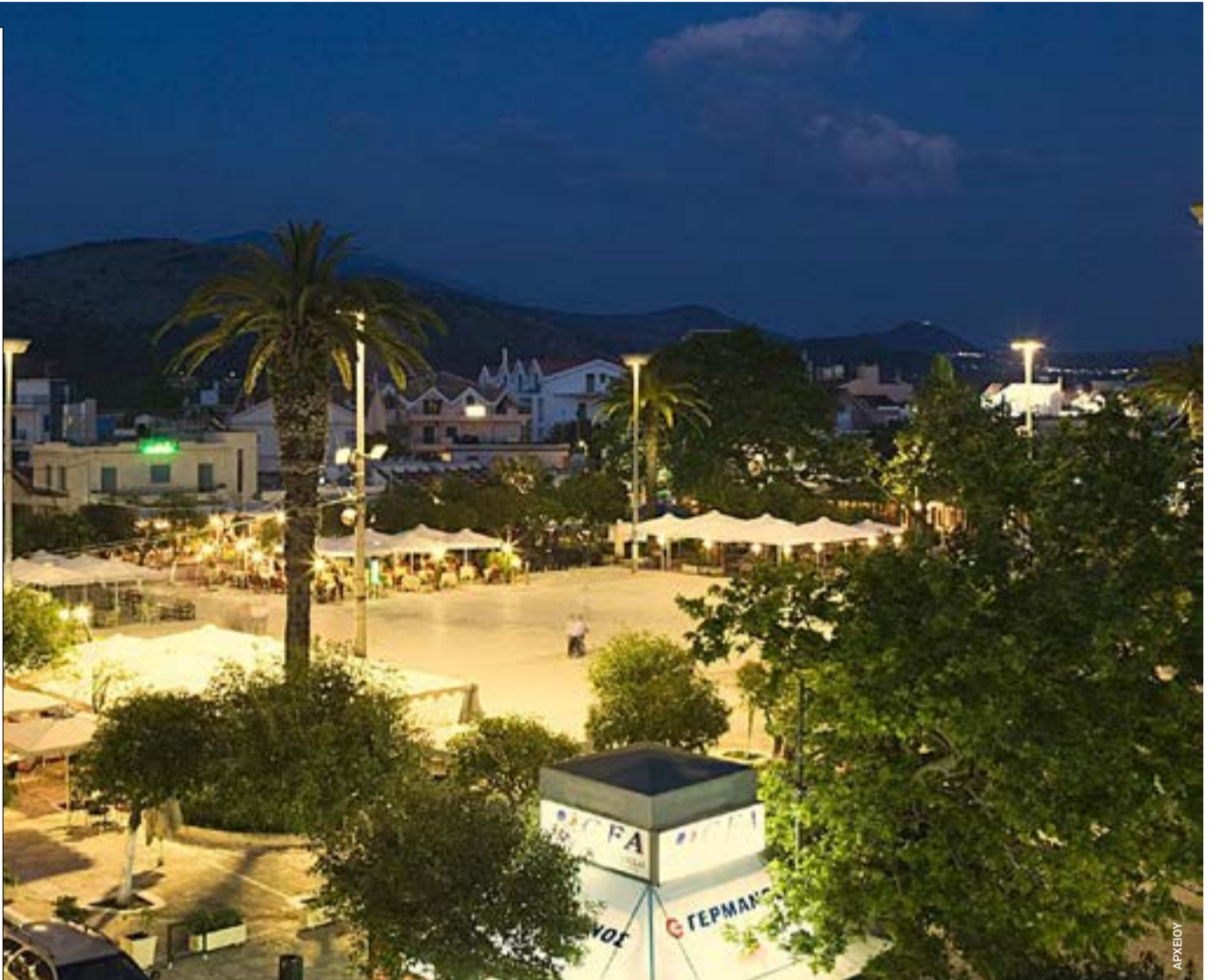
Η περιοχή όπου εντοπίστηκε η 19χρονη στον ευρύτερο χώρο της Πλατεία Βαλλιάνου, την κεντρική πλατεία του Αργοστολίου, που αποτελεί το βασικό σημείο συνάντησης στην πόλη.

ΠΕΚΙΝΟ. Ο συνολικός αριθμός των αρχικών προβλημάτων που σχετίζονται με την ποιότητα των ηλεκτρικών αυτοκινήτων αυξάνεται, ενώ ο ρυθμός ανάπτυξης έχει επιβραδυνθεί. Ο συνολικός μέσος όρος προβλημάτων που αντιμετώπισαν οι ιδιοκτήτες φέτος είναι 231 προβλήματα ανά 100 οχήματα, σημειώνοντας αύξηση 5 προβλημάτων (5 PP100) από το 2025, σύμφωνα με έρευνα της JD Power 2026 που πραγματοποιήθηκε στην Κίνα. Τα στοιχεία της έρευνας βασίστηκαν σε απαντήσεις 21.177 ιδιοκτητών οχημάτων που αγόρασαν ηλεκτρικό αυτοκίνητο μεταξύ των μηνών Μαΐου -Δεκεμβρίου 2025.