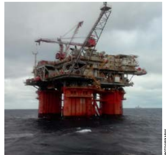
Η γεώτρηση θα κοστίσει 60-70 εκατομμύρια ευρώ και αν το κοιτάσμα είναι καλό, θα απαιτηθούν επενδύσεις 5 δις ευρώ

Αντίθετα, η Κέρκυρα δεν αναμένεται να υποδεχθεί άμεσα βαριά βιομηχανική δραστηριότητα, καθώς ο τουριστικός της χαρακτήρας και οι περιορισμοί υποδομών λειτουργούν αποτρεπτικά για κάτι τέτοιο. Ωστόσο, η επίδραση θα είναι υπαρκτή σε πιο έμμεσο επίπεδο. Η εγγύτητα σε μια ζώνη εξόρυξης μπορεί να επηρεάσει την εικόνα του νησιού ως «καθαρού» και φυσικού προορισμού, να δημιουργήσει ανησυχίες σε μέρος της αγοράς τουρισμού και να εντείνει τις περιβαλλοντικές ευαισθησίες της τοπικής κοινωνίας. Έτσι, ενώ η Κέρκυρα μπορεί να αποκομίσει κάποια οικονομικά οφέλη μέσω υπηρεσιών και υποστήριξης, το βασικό της διακύβευμα θα είναι η διατήρηση της ταυτότητάς της.