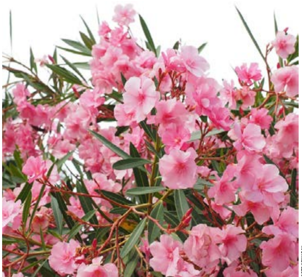
Μακριά από αυτήν καλού κακού

Τελικά, οι υδρογονάνθρακες λειτουργούν ως καταλύτης. Δεν είναι αυτοί που θα καθορίσουν μόνοι τους το μέλλον της Κέρκυρας. Είναι όμως εκείνοι που προειδοποιούν ότι το μέλλον δεν μπορεί να αφεθεί στην τύχη. Η δυνατότητα υπάρχει — και όσο πιο συλλογικά και συνειδητά γίνει, τόσο μεγαλύτερες είναι οι πιθανότητες να οδηγήσει σε ένα αποτέλεσμα που δεν θα είναι απλώς προϊόν συγκυρίας, αλλά έκφραση μιας κοινωνίας που αποφάσισε η ίδια για τον εαυτό της. Μην περιμένετε να μας ρωτήσει κάποιος. Δεν θα το κάνει. Μας θεωρούν δεδομένους. Ή μήπως είμαστε;