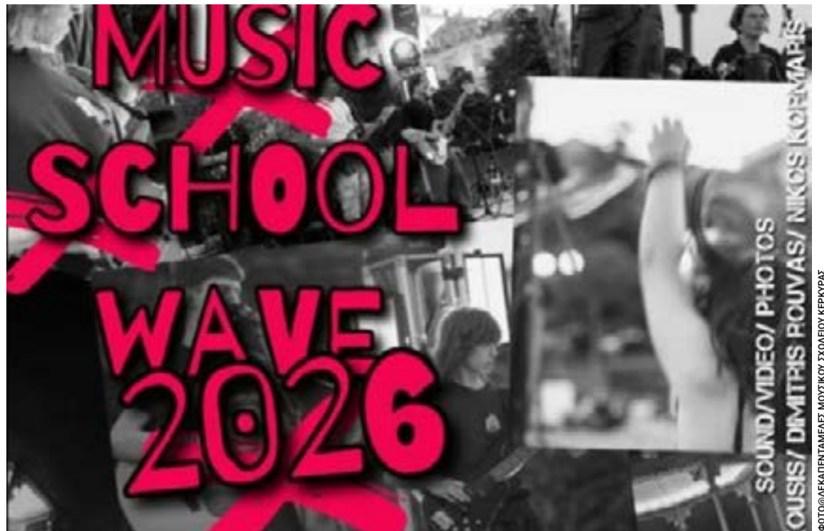
Από την αφίσα της εκδήλωσης