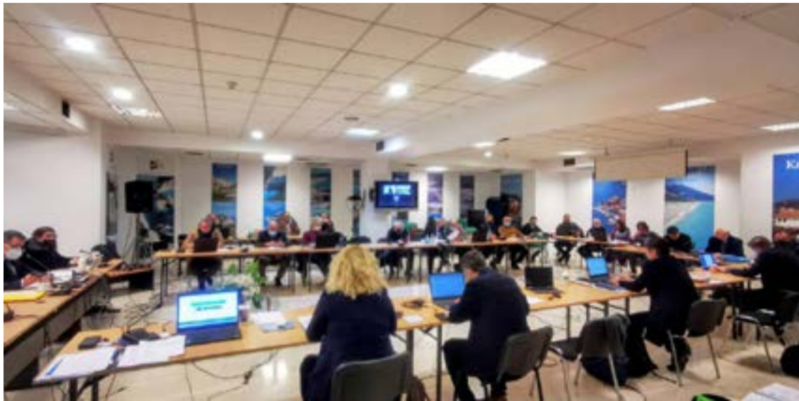
Θα ληφθούν αποφάσεις σε 12 θέματα της επικαιρότητας