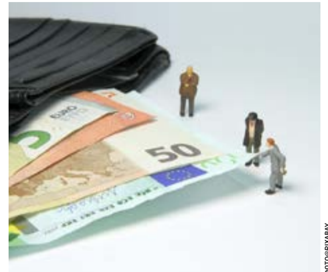
Συνολικά έως χθες το μεσημέρι είχαν υποβληθεί 2.283.103 δηλώσεις