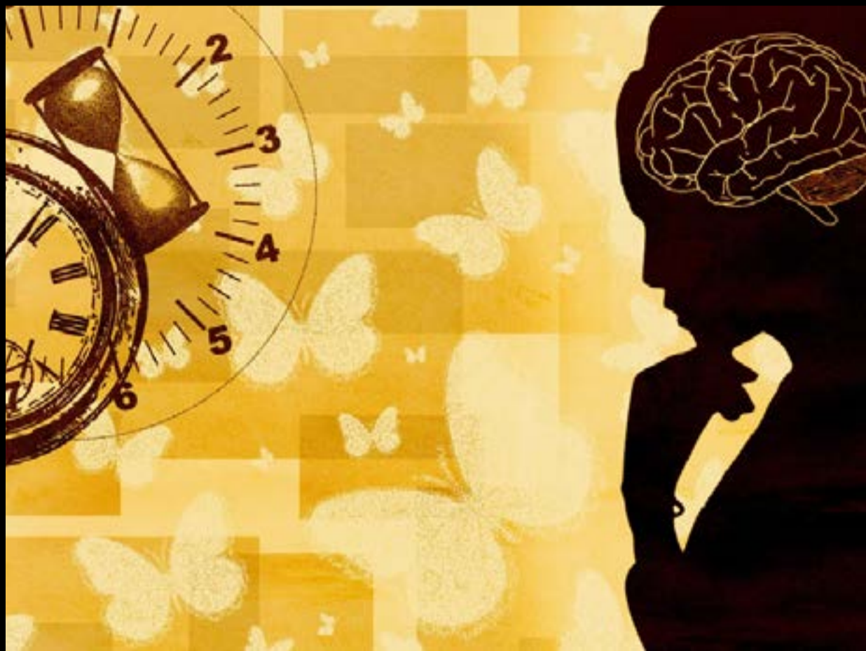
Το συνειδησιακό φαινόμενο δεν συμπίπτει με αυτό που ονομάζουμε «διάλογο με τον εαυτό μας»

Το δίκτυο της μνήμης συγκρατεί και συνδέει εγγραφές παρελθοντικών αισθήσεων, οι οποίες είναι καταναμημένες σε όλο τον εγκέφαλο, στις συνειρμικές αισθητικές περιοχές του. Η ανάκληση αυτών των εγγραφών μπορεί να αφορά ένα επεισόδιο ή όλη τη σειρά από την αρχή ως το τέλος. Σε όρους υπολογιστών, δεν πρόκειται για το ανάλογο ενός «σκληρού δίσκου», αλλά περισσότερο για