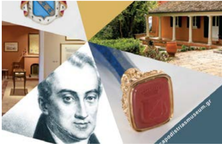
Από την αφίσα των εκδηλώσεων

Στο πλαίσιο της εκδήλωσης θα παρουσιαστεί για πρώτη φορά στις Ηνωμένες Πολιτείες η Μουσειοσκευή του Μουσείου Καποδί-