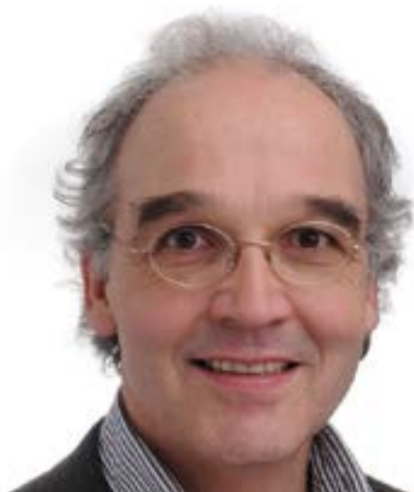
Ο συνθέτης και μουσικολόγος Raphael Staubli