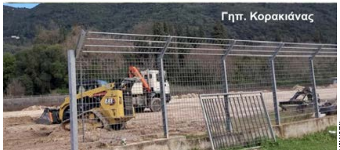
Από τις εργασίες στα γήπεδα Καστελλάνων Μέσης και Άνω Κορακιάνας