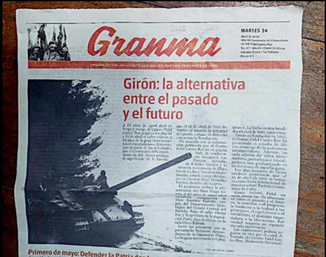
Το (14/4) πρωτοσέλιδο του Granma, του επίσημου δημοσιογραφικού όργανου της Κεντρικής Επιτροπής του Κομμουνιστικού Κόμματος Κούβας, για την 65η επέτειο της ανεπιτυχούς προσπάθειας των ΗΠΑ για στρατιωτική απόβαση στην παραλία Girón, στην Κούβα, το 1961.

Στον αντίλογο αυτών των σκέψεων προβάλλεται η εμπειρία ότι ανακύπτει ζήτημα διαφορετικού υποδείγματος: άλλος ο ατομικός δρόμος της αγοράς, άλλος ο κοινωνικός, συμμετοχικός δρόμος, που γοήτευσε ως προοπτική ολόκληρο τον κόσμο. Ο ψυχραιμος παρατηρητής θα ζητήσει λιγότερη συναισθηματική προσέγγιση στο επίδικο, ιδίως υπό το βάρος της σημερινής δύσκολης πραγματικότητας στο νησί — όταν η κρίσιμη συζήτηση δεν γίνεται σε κάποια ελληνική ταβέρνα, μετά από ένα φεστιβάλ, υπό τους ήχους ίσως του Θεοδωράκη.