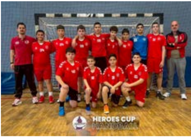
Η ομάδα Παμπαίδων του Φαίακα