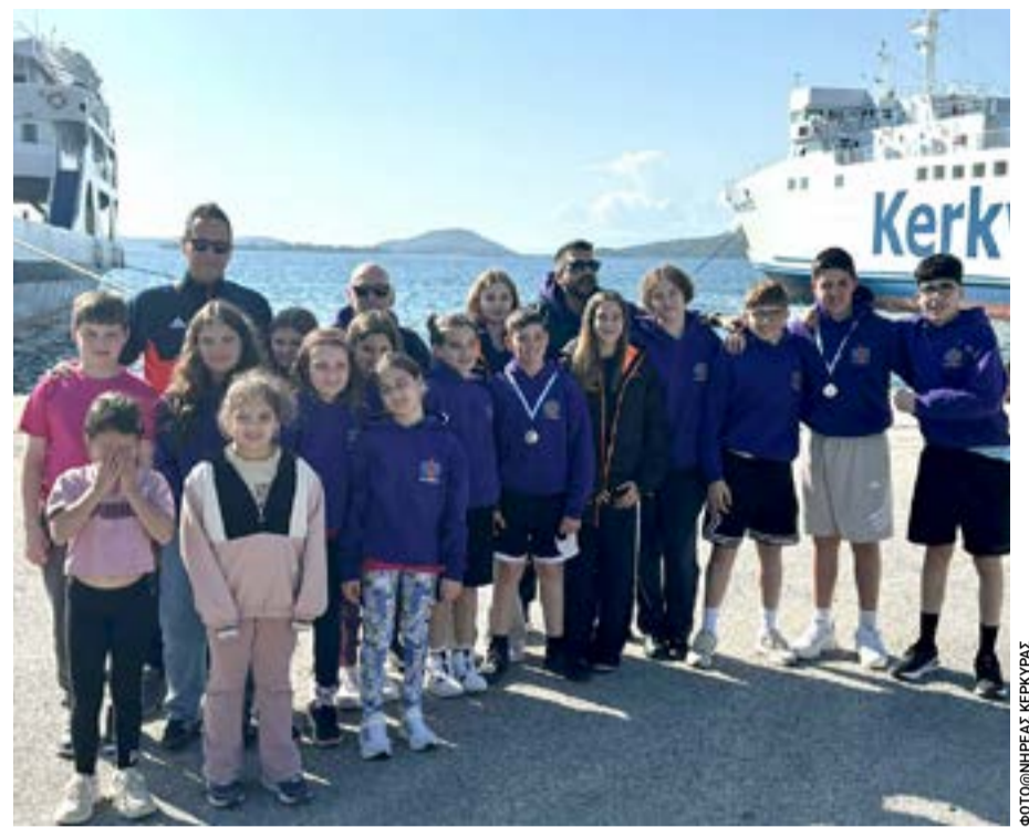
Η ομάδα του Νηρέα