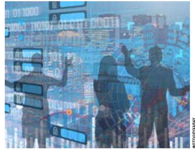
Η εκδήλωση διοργανώνεται στις 29 Απριλίου 2026, στον χώρο εκδηλώσεων Silicon Urban Ecosystem (οδός Δονάτου Δημουλίτσα 19-21)

Ένα πρόστιμο για απόρριψη μπάζων στους κάδους. (Παραβίαση άρθρου 7.3.β). Ποσό ανά πρόστιμο: 300,00 €.