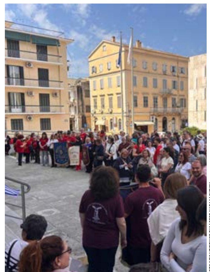
Από την ξενάγηση στην πόλη της Κέρκυρας