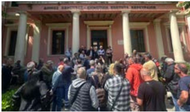
Από προηγούμενη δομαρτυρία στο Μαράσειο