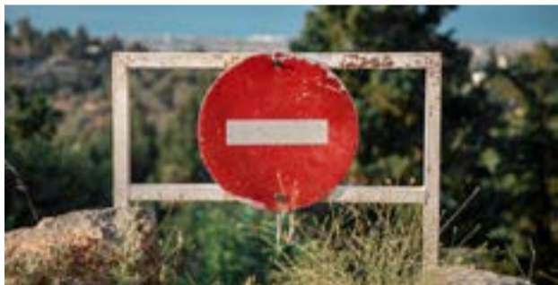
Καλούνται οι οδηγοί να είναι ιδιαίτερα προσεκτικοί

ΚΕΡΚΥΡΑ. Ο Σύλλογος Εργαζομένων Ο.Τ.Α. Κέρκυρας, καλεί όλα τα μέλη του να συμμετάσχουν μαζικά και αγωνιστικά στις κινητοποιήσεις «απέναντι στις αντεργατικές κυβερνητικές πολιτικές που πλήττουν τα δικαιώματα και το μέλλον των εργαζομένων στην Τοπική Αυτοδιοίκηση». Την Παρασκευή 24 Απριλίου είναι προγραμματισμένη η 24ωρη πανελλαδική απεργία. Η συγκέντρωση θα γίνει στις 10:00 π.μ. στον βρεφικό σταθμό «Τα Μαρμελίνια».