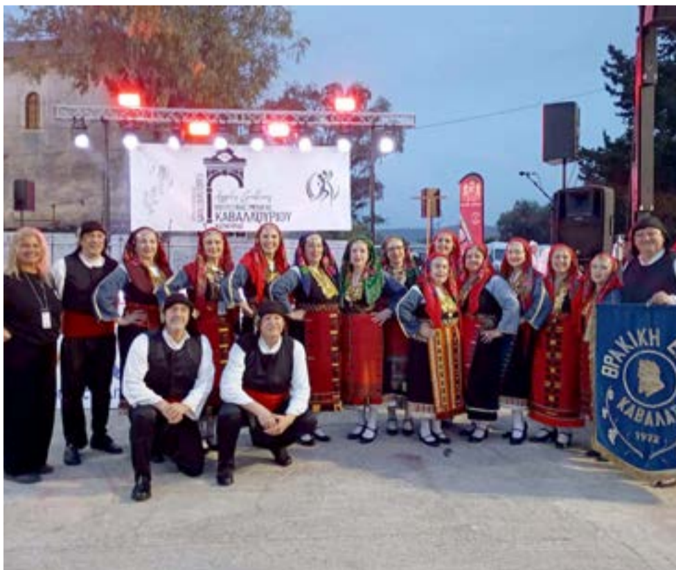
Το συγκρότημα της Θρακικής Εστίας Καβάλας