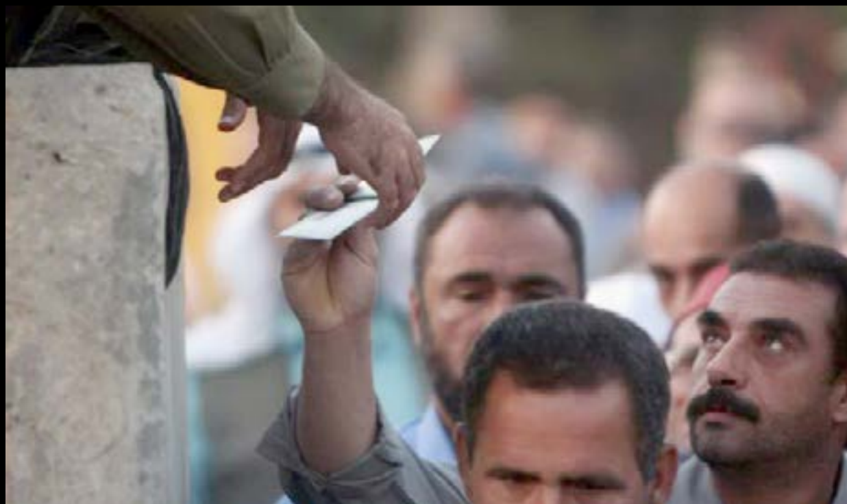
Την ταυτότητά του επιδεικνύει σε ισραηλινό στρατιώτη ένας παλαιστίνιος σε σημείο ελέγχου της Βηθλεέμ προτού περάσουν στην Ιερουσαλήμ για την τέταρτη και τελευταία Παρασκευή του Ραμαζανίου.

Το σιωνιστικό κίνημα είναι ένα εθνικιστικό κίνημα του τέλους του 19ου αιώνα που θα οδηγήσει σε διαδοχικά κύματα μετανάστευσης Εβραίων στην (οθωμανική και μετά βρετανική) Παλαιστίνη. Θα υπάρξουν πλούσιοι Εβραίοι, Ρότσιλντ, Χίρτσ, Σράους κ.ά., που θα χρηματοδοτήσουν την Εβραϊκή αγορά γης από μεγάλους γαιοκτήμονες Άραβες (που ζούσαν εκτός Παλαιστίνης). Σιωνιστές ήταν τόσο οι Εβραίοι έποικοι όσο και οι μακρινοί χρηματοδότες τους. Υπάρχουν όμως, δίπλα σε αυτούς, και σιωνιστές που επιδίωξαν την μαζική μεταφορά των Εβραίων στην (βρετανική) Παλαιστίνη όχι από αγάπη αλλά από αντισημιτισμό. Ήταν όλοι αυτοί που επιδίωξαν να «ξεφορτωθούν» τους Εβραίους της χώρας τους στέλνοντάς τους στην Παλαιστίνη με πιο «πολιτισμένο» τρόπο από αυτόν της «Τελικής Λύσης» του 1942-