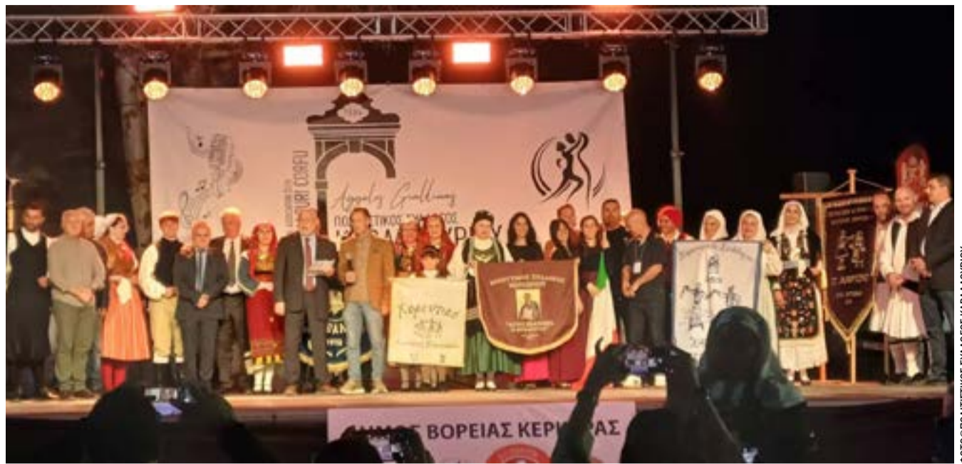
Το ραντεβού ανανεώθηκε για τον Μάιο του 2027

Με οδηγό τις όμορφες στιγμές στο ξενοδοχείο Robola, όπου έκλεισε η γιορτή, ο Πολιτιστικός Σύλλογος Καβαλλουρίου ευχαριστεί θερμά εθελοντές και χορηγούς, ανανεώνοντας το ραντεβού για το επόμενο μεγάλο αντάμωμα στις 6 - 8 Μαΐου 2027.