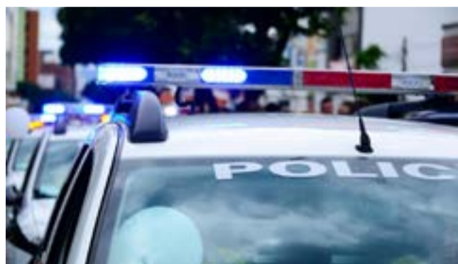
Ο συλληφθείς οδηγήθηκε στον εισαγγελέα

ΓΙΑ ΤΗΝ ΕΠΙΤΡΟΠΗ ΑΓΩΝΑ ΓΙΑ ΤΟΝ ΜΩΛΟ ΜΕΣΟΓΓΗΣ, ΔΗΜΗΤΡΗΣ ΑΥΛΙΑΝΟΣ.