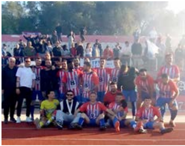
Οι παίκτες του ΟΦΑΜ πανηγυρίζουν την νίκη-τίτλο την περασμένη Κυριακή με τον Ολυμπο