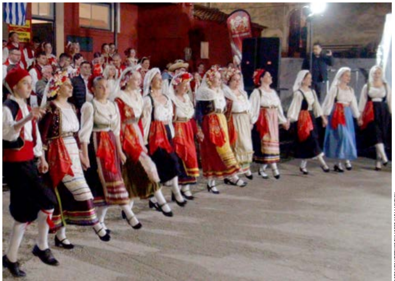
Το χορευτικό του Συλλόγου Καβαλλουρίου