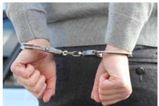
Ο 25χρονος κατηγορείται για παράβαση της νομοθεσίας περί όπλων

Γενική Συνέλευση των μελών του Πολιτιστικού Συλλόγου Γαρίτσας «Το Άλσος», θα πραγματοποιηθεί την Τετάρτη 13 Μαΐου 2026 και ώρα 18:00 στο 6ο Δημοτικό Σχολείο. Σκοπός η ενημέρωση των μελών, για τα προβλήματα που έχουν δημιουργηθεί στο Άλσος, για τη δημιουργία του διασυλλογικού οργάνου, για την επικείμενη νέα σύμβαση της Δημοτικής Πλαζ Μον Ρεπό.