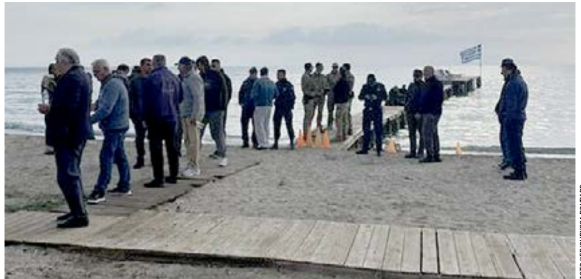
Οι κάτοικοι της Μεσογής προστατεύουν το μώλο

ΚΕΡΚΥΡΑ. Ο Δήμος Νότιας Κέρκυρας ενημερώνει ότι ο δρόμος Μπούκαρη - Πετριτή τίθεται εκτός λειτουργίας, λόγω αυξημένης επικινδυνότητας στο οδόστρωμα και θα παραμείνει κλειστός μέχρι την ολοκλήρωση των εργασιών και την πλήρη αποκατάσταση των ζημιών. Παρακαλούνται οι οδηγοί να χρησιμοποιούν εναλλακτικές διαδρομές και να συμμορφώνονται με τη σήμανση.