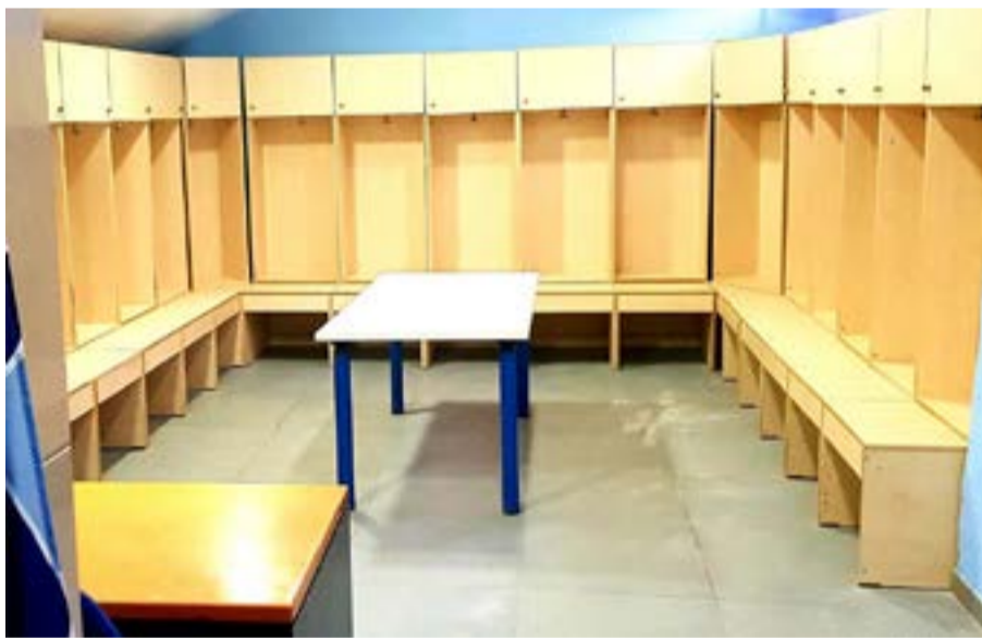
Τα αποδυτήρια που χρησιμοποιεί αποκλειστικά η Β' ομάδα και η Κ15, μετά την ανακαίνισή τους.