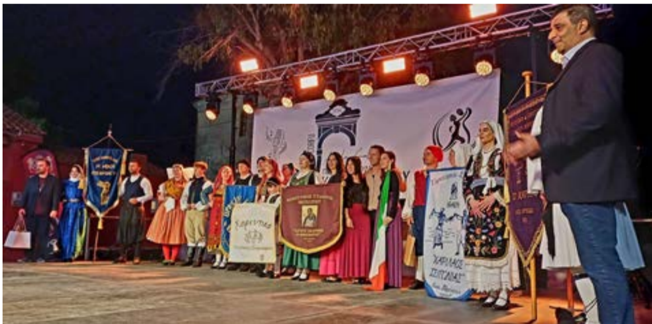
Συμμετείχαν συγκροτήματα απ όλη την Ελλάδα και το εξωτερικό