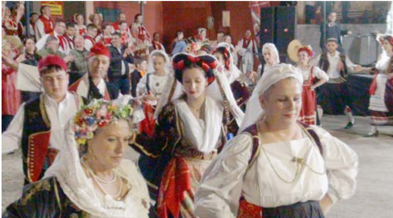
Από την εντυπωσιακή εμφάνιση των χορευτικών συγκροτημάτων