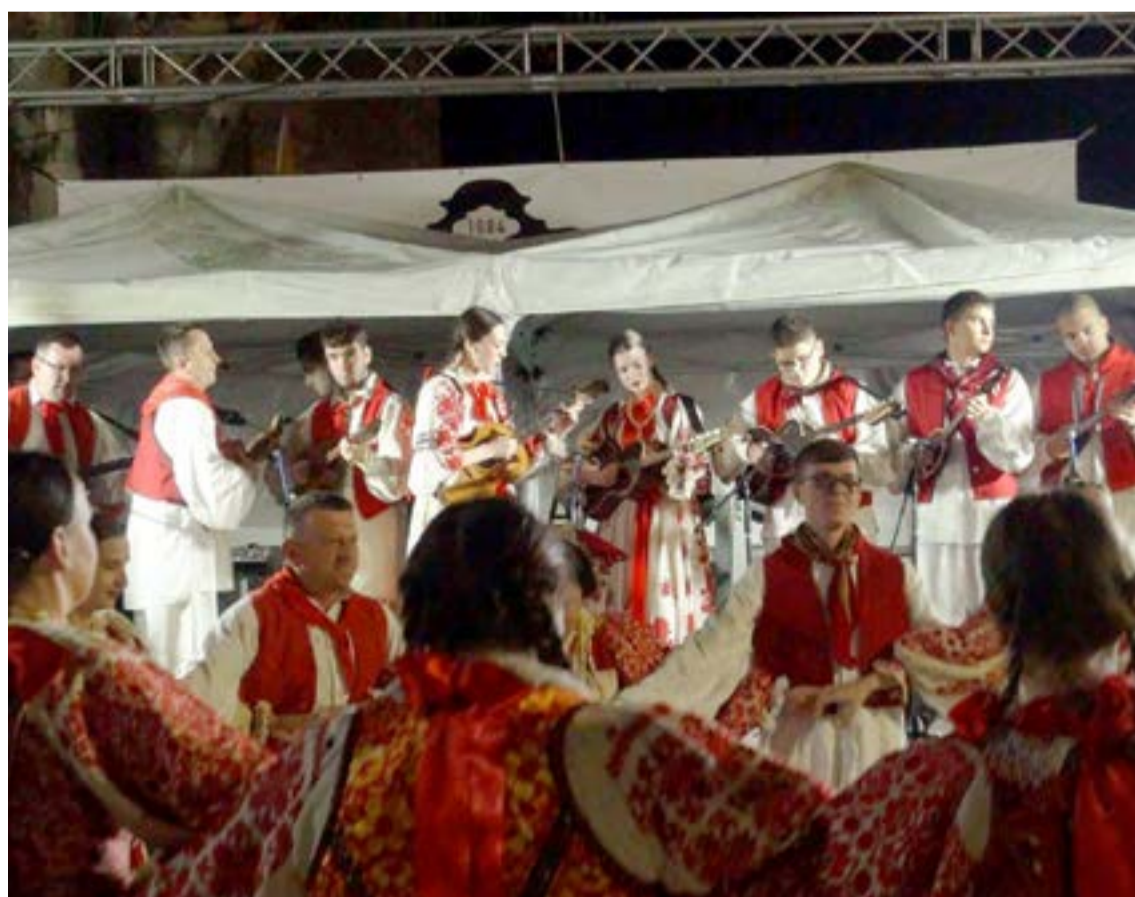
Η γιορτή αυτή απέδειξε ότι η παράδοση δεν είναι ένα στατικό έκθεμα, αλλά μια ζωντανή μνήμη που ενώνει λαούς