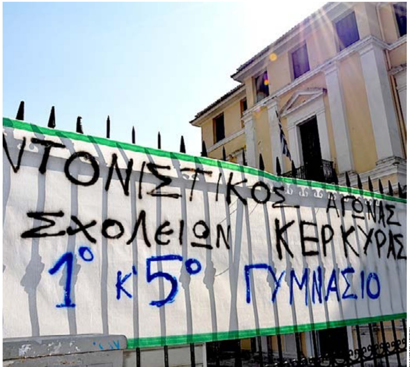
Από παλαιότερη μαθητική κινητοποίηση.