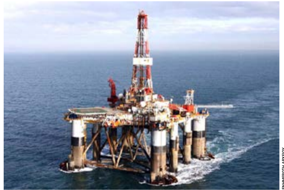
Τέτοια «νησιά» χρησιμοποιούνται στις θαλάσσιες γεωτρήσεις.

ανακοίνωση, η προώθηση των υδρογονανθράκων δεν συνδέεται με την κάλυψη λαϊκών αναγκών, αλλά με την ενίσχυση της κερδοφορίας επιχειρηματικών ομίλων και τη γεωστρατηγική αναβάθμιση της χώρας. Ιδιαίτερη αναφορά γίνεται στο επιχείρημα της «ενεργειακής ασφάλειας», το οποίο το ΚΚΕ χαρακτηρίζει παραπλανητικό, υποστηρίζοντας ότι αφορά κυρίως τη διασφάλιση των κερδών των μονοπωλίων. Αντίθετα, όπως σημειώνει, για τα λαϊκά στρώματα