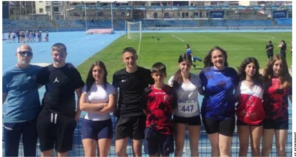
Η ομάδα στίβου της Λευκίμμης μετά την τοποθέτηση του ταρτάν «μεγαλώνει» και η αποστολή στα Γιάννενα είχε πολλά παιδιά