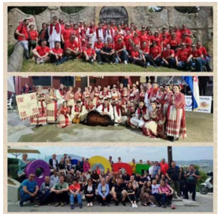
Τα ευρωπαϊκά συγκροτήματα που συμμετείχαν στο φεστιβάλ