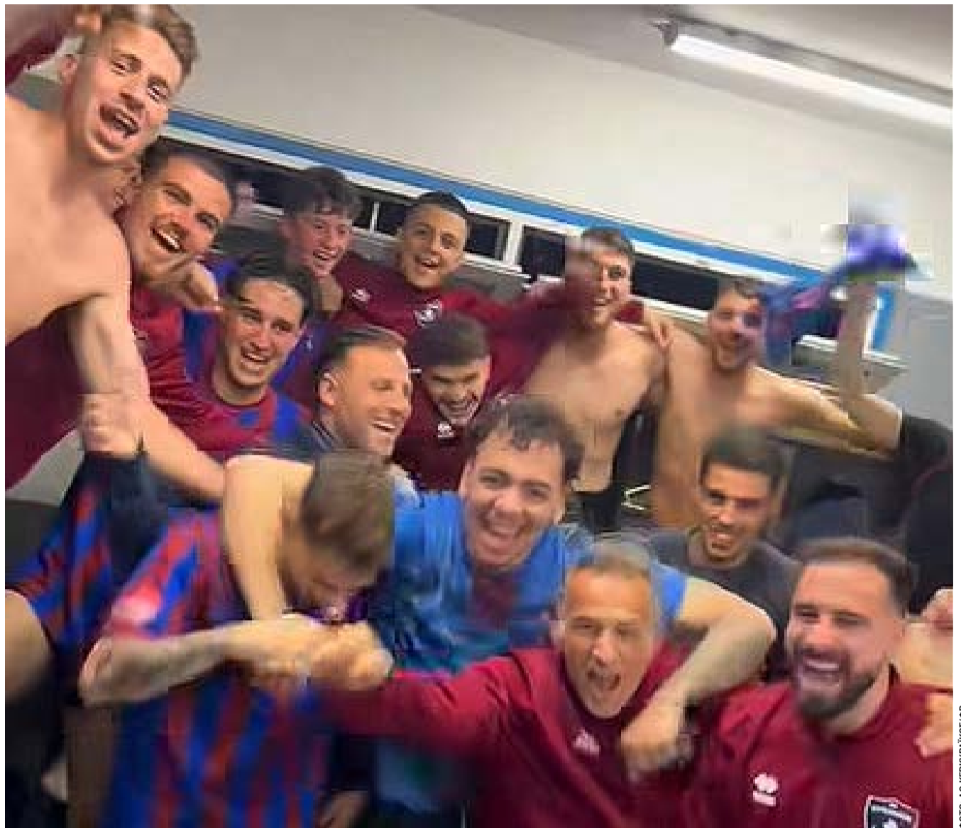
Με αυτή τη νίκη, ο Κερκυραϊκός έφτασε τους 31 βαθμούς σε επτά αγωνιστικές στα πλέι οφ και διατηρεί σαφές προβάδισμα για την κατάκτηση του τίτλου της Β ΕΠΣΚ. ΣΤΙΓΜΙΟΤΥΠΟ: Πανηγύρια στα αποδυτήρια μετά την ευρεία νίκη.

Μετά από απόφαση της Γενικής Συνέλευσης ορίστηκε ημερομηνία εκλογών την Κυριακή 03/05 στο Πνευματικό Κέντρο Καρουσάδων με παρουσία Δικαστικού εκπροσώπου και ώρα 12.00-18.00. Δηλώσεις Υποψηφίων έως το βράδυ της Παρασκευής 01/05 στις 17.00 στον Γραμματέα Μπαντούνο Ανδρέα τηλ. 6980757435. ΣΠΥΡΟΣ ΠΙΚΟΥΛΑΣ