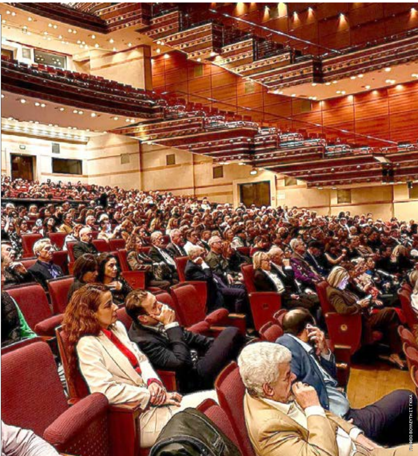
Από την συναυλία της Τετάρτης στο Μέγαρο Μουσικής Αθηνών.