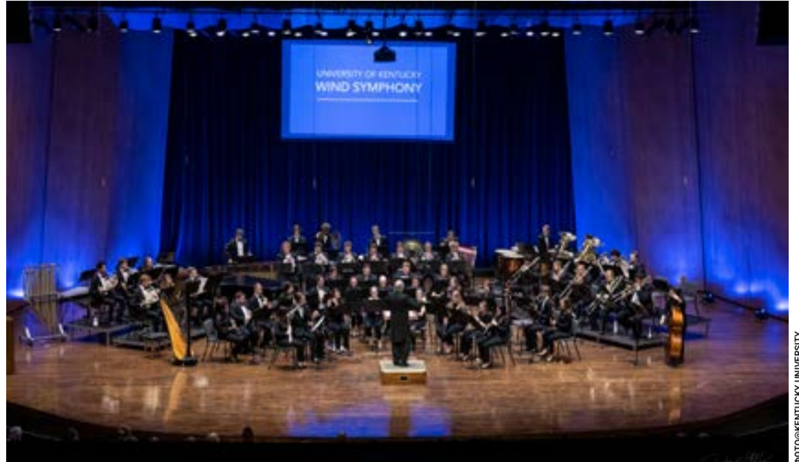
Η Wind Symphony Orchestra του Πανεπιστημίου του Κεντάκι

ΖΑΚΥΝΘΟΣ. Ένας θάνατος που αποδίδεται στη λεπτοσπείρωση και δύο ακόμα επιβεβαιωμένα κρούσματα της νόσου καταγράφηκαν της τελευταίες ημέρες στη Ζάκυνθο. Οι δύο ασθενείς νοσηλεύονται εκτός κινδύνου στο Νοσοκομείο του νησιού. Οι υγειονομικές αρχές αναμένουν τα αποτελέσματα των εργαστηριακών εξετάσεων για το θύμα, ενώ και ο ΕΟΔΥ είναι σε ετοιμότητα.