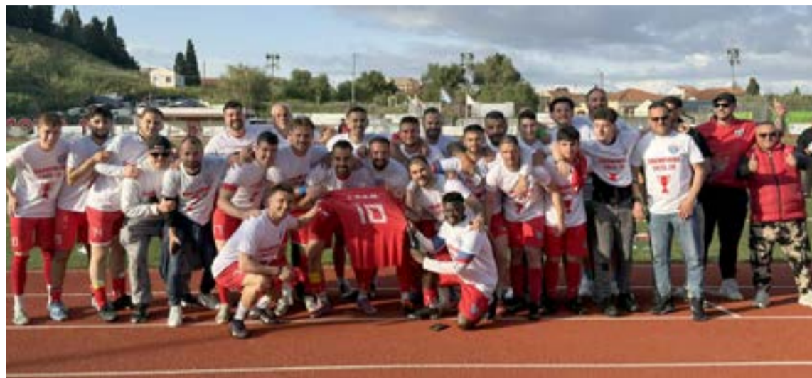
Η οικογένεια του ΟΦΑΜ πανηγυρίζει