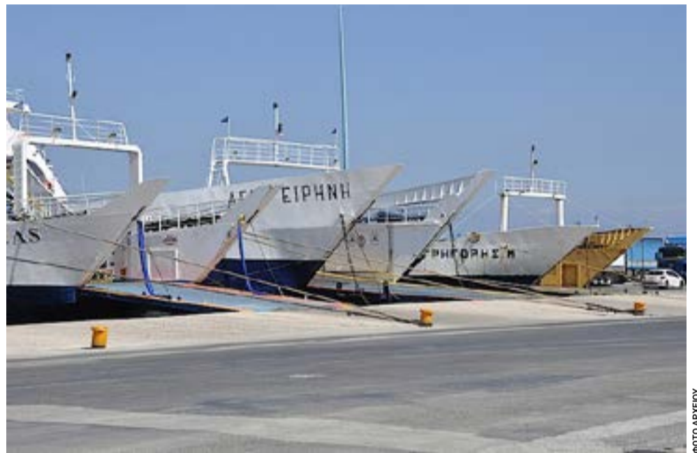
Αφορά όλα τα πλοία που δραστηριοποιούνται στις γραμμές: Κέρκυρα – Ηγουμενίτσα, Ηγουμενίτσα – Παξοί και Λευκίμμη – Ηγουμενίτσα

Η πρόβλεψη δεν είναι αισιόδοξη, αν δεν αλλάξει ρυθμός. Με τα σημερινά δεδομένα, η τουριστική περίοδος θα εξελιχθεί κανονικά σε επίπεδο αφίξεων και εσόδων, αλλά θα συνοδεύεται από αυξημένη πίεση στις υποδομές και υψηλή ευαισθησία σε κάθε ακραίο καιρικό φαινόμενο. Αυτό σημαίνει ότι το επόμενο επεισόδιο – μικρό ή μεγάλο – δεν θα βρει το νησί επαρκώς θωρακισμένο. Και τότε το κόστος δεν θα είναι μόνο οικονομικό· θα είναι και έντοκο κόστος αξιοπιστίας για έναν από τους πιο εμβληματικούς προορισμούς της χώρας.