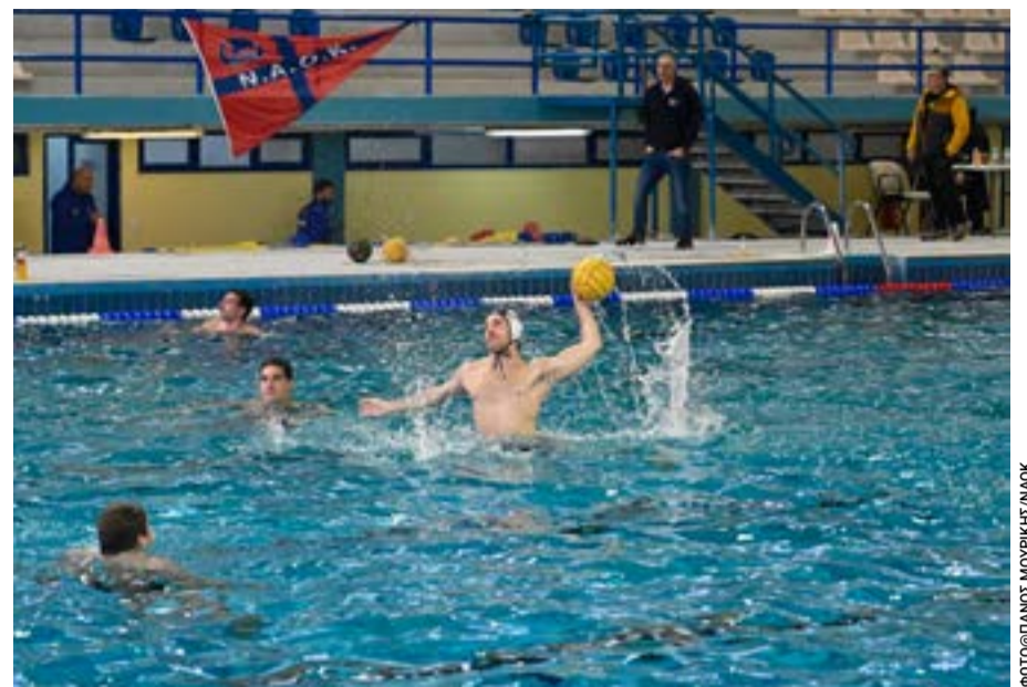
Από παλαιότερη αναμέτρηση με τον ΟΥΚ Βόλου (πιθανό αντίπαλο στα ημιτελικά).