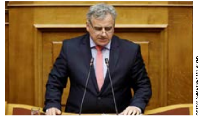
Στο στόχαστρο του ΠΑΣΟΚ – Κίνημα Αλλαγής οι τραπεζικές χρεώσεις και η κυβερνητική πολιτική της Νέα Δημοκρατία.

ματα. Ανέφερε ότι, σύμφωνα με τον κανονισμό, η ανανέωση της θητείας γίνεται από το Κολλέγιο της Ευρωπαϊκής Εισαγγελίας για πέντε ακόμη έτη, καθώς οι εισαγγελείς έχουν επιτελέσει εξαιρετικό έργο. Όποιος δεν συμφωνεί, αρμόδιο για την επίλυση της διαφωνίας είναι το Ευρωπαϊκό Δικαστήριο που εδρεύει στο Λουξεμβούργο και όχι ο Άρειος Πάγος. Επιπλέον, έθεσε τα ίδια ερωτήματα: «Ποιος είναι ο λόγος να μην ανανεωθεί η θητεία τους; Γιατί; Ποιος έχει συμφέρον οι εισαγγελείς που εργάζονται στην υπόθεση των Τεμπών και στην υπόθεση του ΟΠΕΚΕΠΕ να μην ανανεωθούν;». Απαντήστε, λοιπόν, κύριοι της κυβέρνησης: Γιατί ξεσηκώσατε όλο αυτό τον θόρυβο; Τι κρύβεται πίσω από αυτές τις αθλιότητες; Ποιος έχει συμφέρον να μην ανανεωθεί η θητεία των Ευρωπαίων εισαγγελέων; Και γιατί;