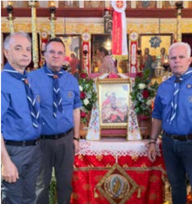
Οι Παλαιοί Πρόσκοποι συμμετείχαν και φέτος στη λιτανεία