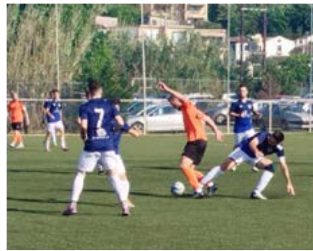
Από τον αγώνα Θιναλιακός - Αχιλλέας Νυμφών

Καλό καλοκαίρι σε όλους με υγεία. ΟΦΑΜ FAMILY FOR EVER