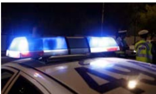
Ο νεαρός αλλοδαπός οδηγήθηκε στον εισαγγελέα

Η επιλογή της Κέρκυρας υπογραμμίζει τη διεθνή επιρροή της επτανησιακής μουσικής παράδοσης και τους φιλικούς δεσμούς της Φ.Ε. "Μάντζαρος" και του Μουσικού Τμήματος του Πανεπιστημίου του Kentucky, τμήμα του οποίου, τα τελευταία χρόνια, κάθε χρόνο την ημέρα εορτασμού της Μουσικής επισκέπτεται την Κέρκυρα και συμμετέχει στη συναυλία που πραγματοποιεί η Φιλαρμονική "Μάντζαρος".