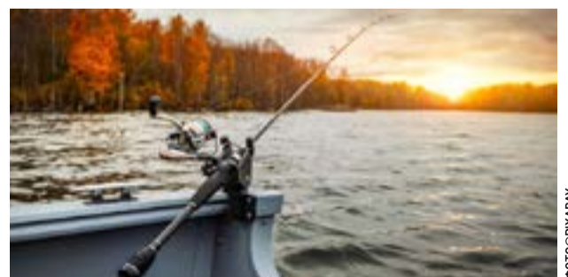
Για την προστασία της αναπαραγωγής των ιχθύων και των λοιπών υδρόβιων οργανισμών

ΓΙΑΝΝΕΝΑ. Αστυνομικοί του Τμήματος Διαβατηριακού Ελέγχου Κακαβιάς συνέλαβαν αλλοδαπό που προσπαθούσε να περάσει τα σύνορα. Σε βάρος του εκκρεμούσε ευρωπαϊκό ένταλμα σύλληψης από τις ιταλικές αρχές. Οι κατηγορίες που τον βαρύνουν αφορούν αδικήματα ενδοοικογενειακής βίας. Σύμφωνα με τα στοιχεία του εντάλματος, ο συλληφθείς κινδύνευε με μέγιστη ποινή φυλάκισης έως και 12 ετών στην Ιταλία.