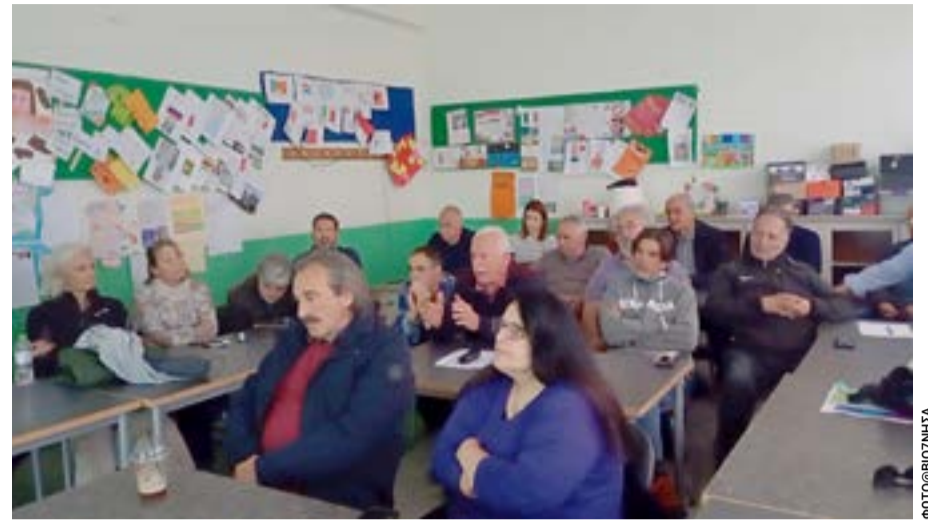
Από την εκδήλωση των Παξών