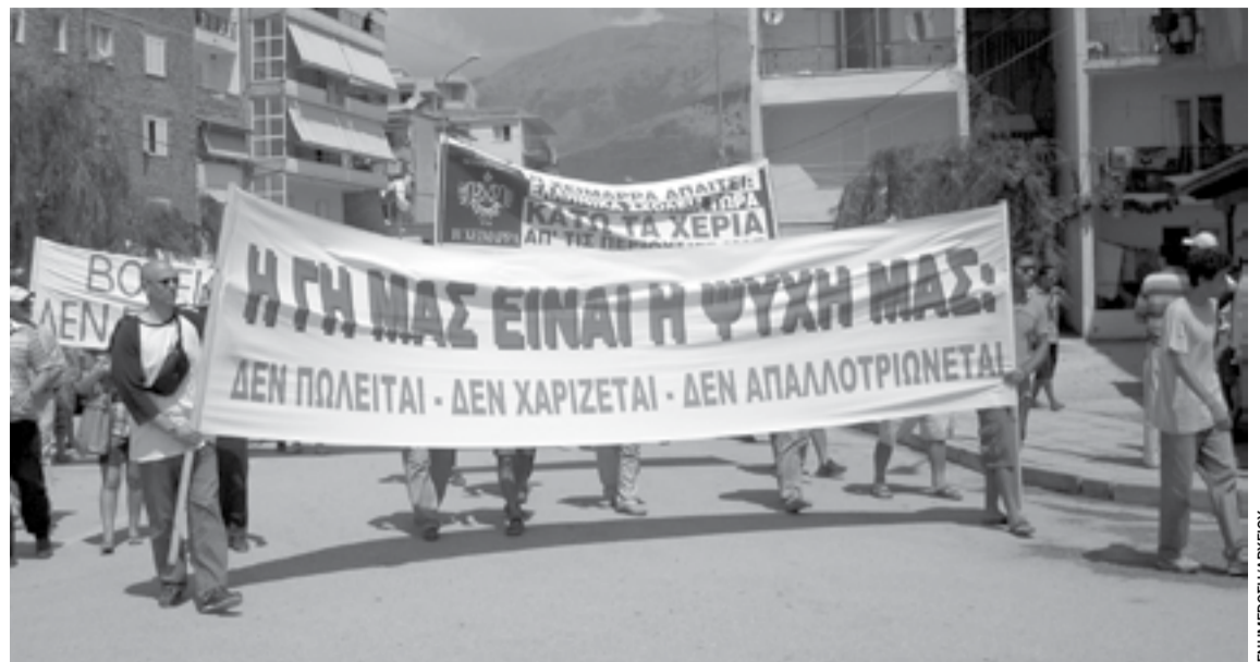
Το αποτέλεσμα δεν είναι απαραίτητα άμεσος εκπατρισμός. Είναι κάτι πιο ύπουλο: η σταδιακή αποξένωση από τον τόπο. Η γη μπορεί να παραμείνει τυπικά στην κατοχή του ιδιοκτήτη, αλλά η χρήση της, η αξία της, η σχέση μαζί της μεταβάλλονται ριζικά. Από χώρος ζωής γίνεται επενδυτικό προϊόν· από συνέχεια γίνεται ευκαιρία ρευστοποίησης.

Στον διαγωνισμό, το Υπερταμείο έχει ορίσει την Eurobank ως χρηματοοικονομικό σύμβουλο, το Doxiadis Associates ως τεχνικό και κυκλοφοριακό σύμβουλο, καθώς και τις εταιρείες Your Legal Partners και Dracopoulos & Vassalakis ως νομικούς συμβούλους για τη διαγωνιστική διαδικασία και τη συναλλαγή.