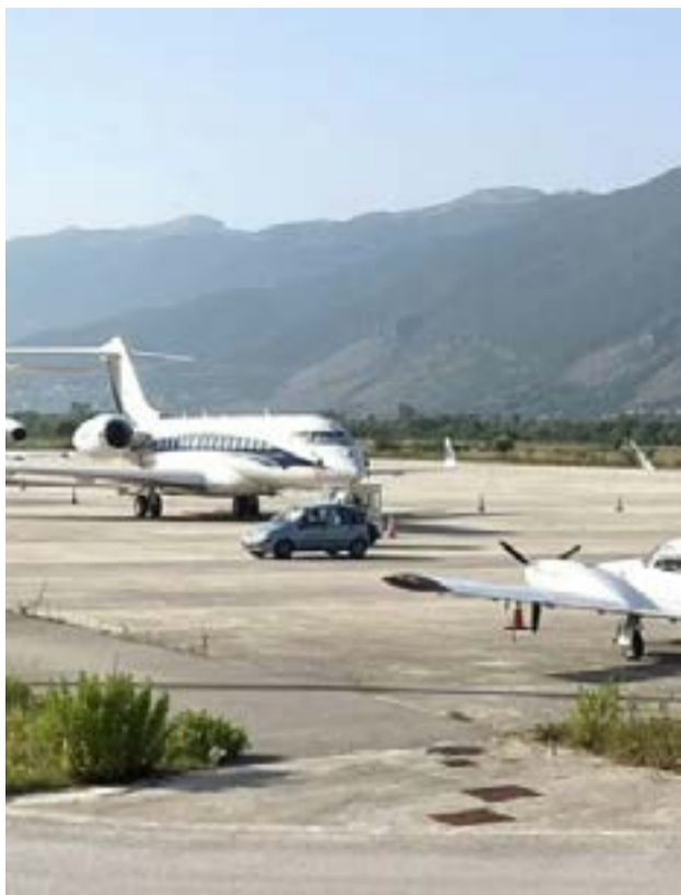
Το αεροδρόμιο Ιωαννίνων.