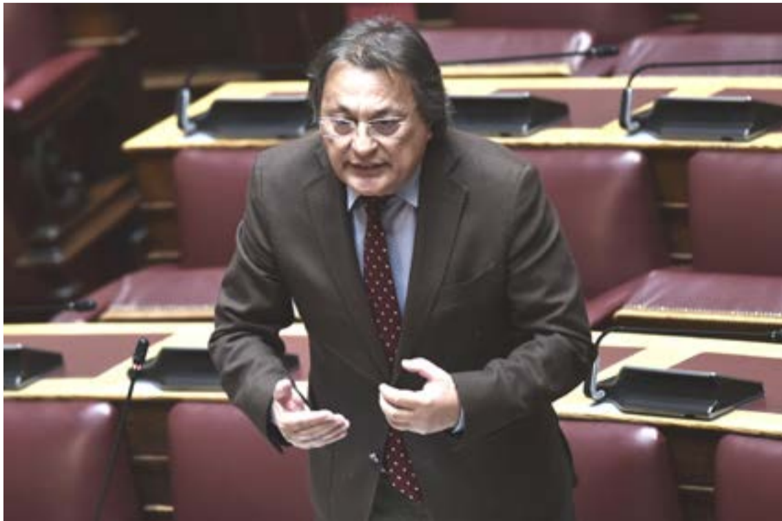
Δηλώσεις με αιχμές εν μέσω αντιπαράθεσης για την υπόθεση ΟΠΕΚΕΠΕ και τη στάση της κυβέρνησης.