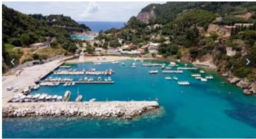
Το λιμάνι της Αλύπας στην Παλαιοκαστρίτσα, στο επίκεντρο της κοινοβουλευτικής παρέμβασης για τα πρόστιμα σε επαγγελματίες και αλιείς.

Σύμφωνα με την κοινοβουλευτική παρέμβαση, το Κεντρικό Λιμεναρχείο Κέρκυρας, μέσω του Λιμενικού Τμήματος Παλαιοκαστρίτσας, επανέρχεται στην επιβολή παραβάσεων που αφορούν την περίοδο άνοιξης-καλοκαιριού 2025, με βασική αιτιολογία την «έλλειψη άδειας ελλιμενισμού από τον φορέα διαχείρισης». Τα πρόστιμα ανέρχονται σε 875 € για αλιευτικά σκάφη και 750 € για τα υπόλοιπα.