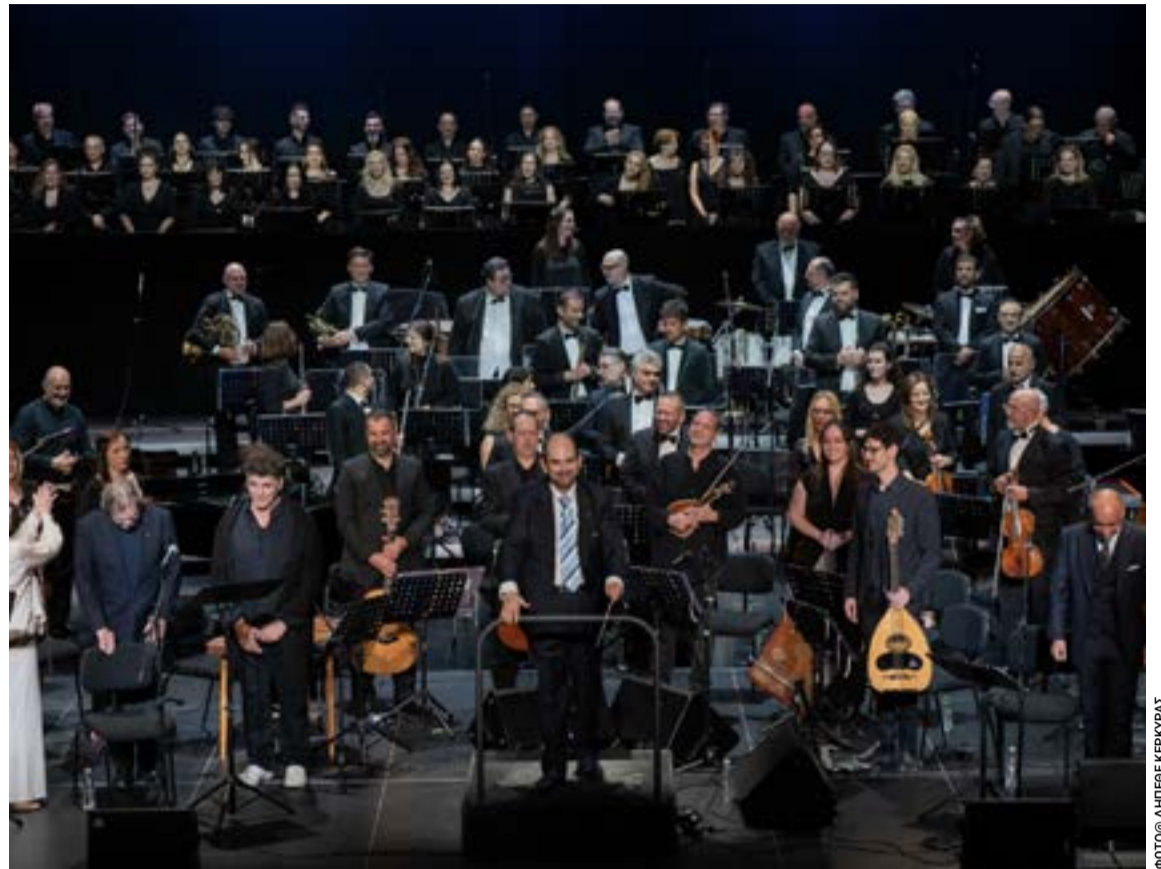
Το κοινό χειροκρότησε θερμά τους συντελεστές της παράστασης