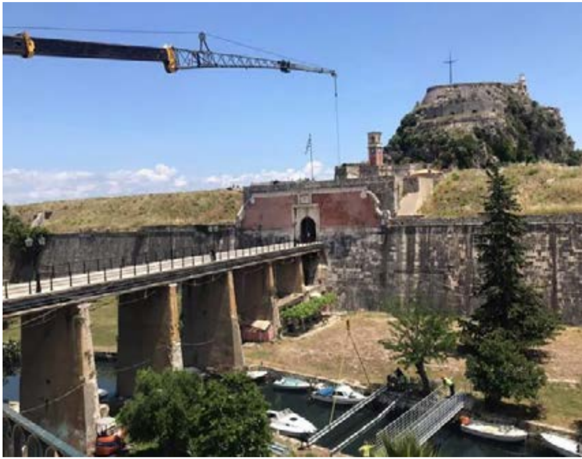
Η γέφυρα του Παλαιού Φρουρίου, ούτε της Άρτας να ήταν...