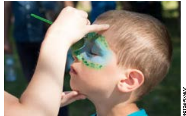
Η γιορτή έχει φιλανθρωπικό χαρακτήρα κι τα έσοδα θα διατεθούν στον «Φάρο Ζωής»

Η ίδια ανακοίνωση, το ίδιο ερώτημα — πότε ξεκινά το έργο;