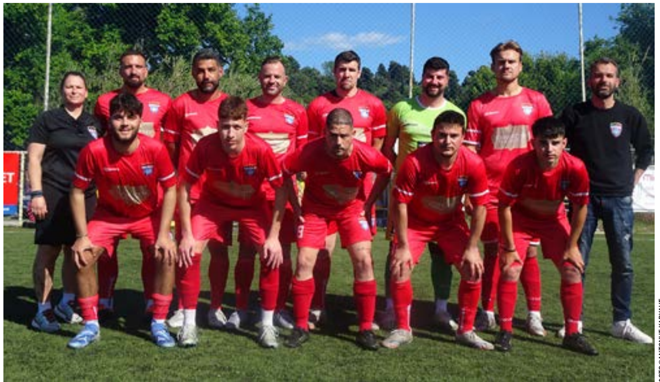
Ο πρωταθλητής της ΕΠΣ Κέρκυρας για το 2026, ΟΦΑΜ

Επικοινωνία: naoraxon@gmail.com και 6972307554