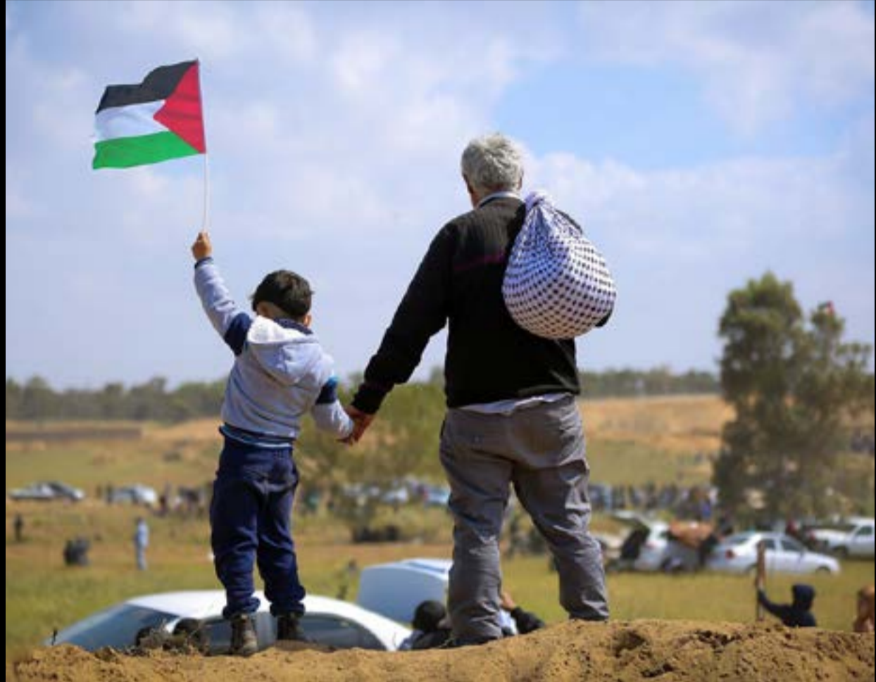
Η ειδική εισηγήτρια του ΟΗΕ, Φραντσέσκα Αλμπανέζε, έχει συντάξει εκθέσεις που περιγράφουν τη δύσκολη κατάσταση των Παλαιστινίων στα κατεχόμενα.

Με τον πόλεμο του 1967, το Ισραήλ κατέλαβε και το υπόλοιπο 22% της παλιάς «βρετανικής» Παλαιστίνης (δηλαδή Ανατολικά Ιεροσόλυμα, Δυτική Όχθη και Γάζα, που από το 1948 διοικούνταν από την Ιορδανία και την Αίγυπτο αντίστοιχα). Από το 1967, οι Ισραηλινοί εποικίζουν ένοπλα και παράνομα τα εδάφη που από τον