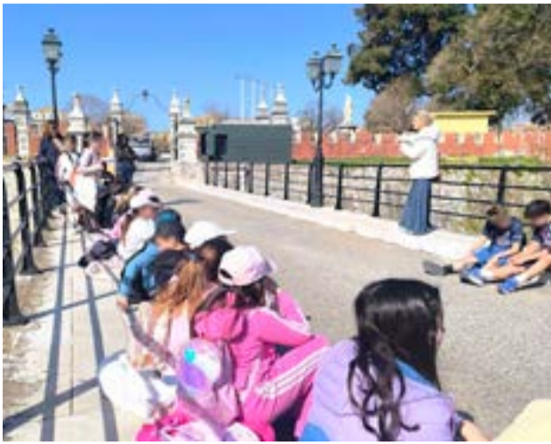
Στην εκδήλωση συμμετείχαν τα παιδιά της Ε' Τάξης του Δημοτικού Σχολείου Παλιάς Πόλης