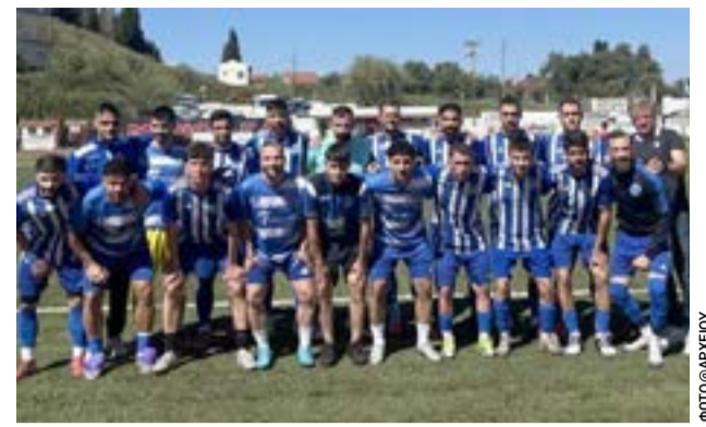
Η ομάδα της Ολυμπιάδας Καρουσάδων

Από 20 Μαΐου και μετά αν δεν έχει προσέλθει/ενδιαφερθεί κανείς, θα συνεχίσουμε στο πλάνο μας, αυτό της υπομονής και επιμονής με Κορωνίδα την Ακαδημία μας!