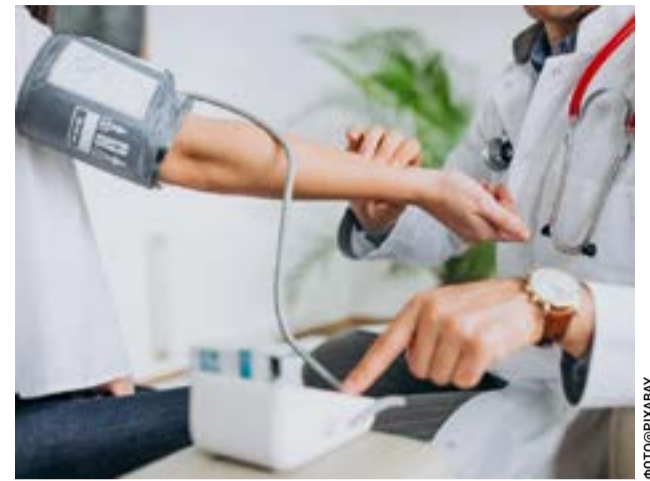
Από 22 έως και 24 Μαΐου 2026, στο Περιφερειακό Πολυδύναμο Ιατρείο Αχαράβης

Μέσα από την παρουσίαση της εμπειρίας στο ΣΔΕ Φυλακών Κέρκυρας, επιδιώκεται η ανάδειξη του κοινωνικού ρόλου των μουσειακών συλλογών. Τα μουσεία δεν αποτελούν πλέον στατικούς χώρους φύλαξης αντικειμένων, αλλά ενεργούς παράγοντες κοινωνικής αλλαγής που προάγουν τη δημοκρατικοποίηση του πολιτισμού και τη διεύρυνση της πρόσβασης στην κοινή κληρονομιά για όλες τις κοινωνικές ομάδες. Την Δευτέρα 18 Μαΐου στις 18:00.