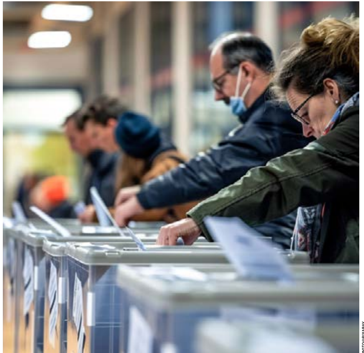
Η πολιτική ζωή της χώρας μπαίνει πλέον σε προεκλογική περίοδο

Ο Δήμος ανανεώνει το ραντεβού με τους μαθητές για την επόμενη σχολική χρονιά 2026-2027 τον μήνα Οκτώβριο, με την προσδοκία υλοποίησης περισσότερων προγραμμάτων για τον πολιτισμό και την κληρονομιά μας.