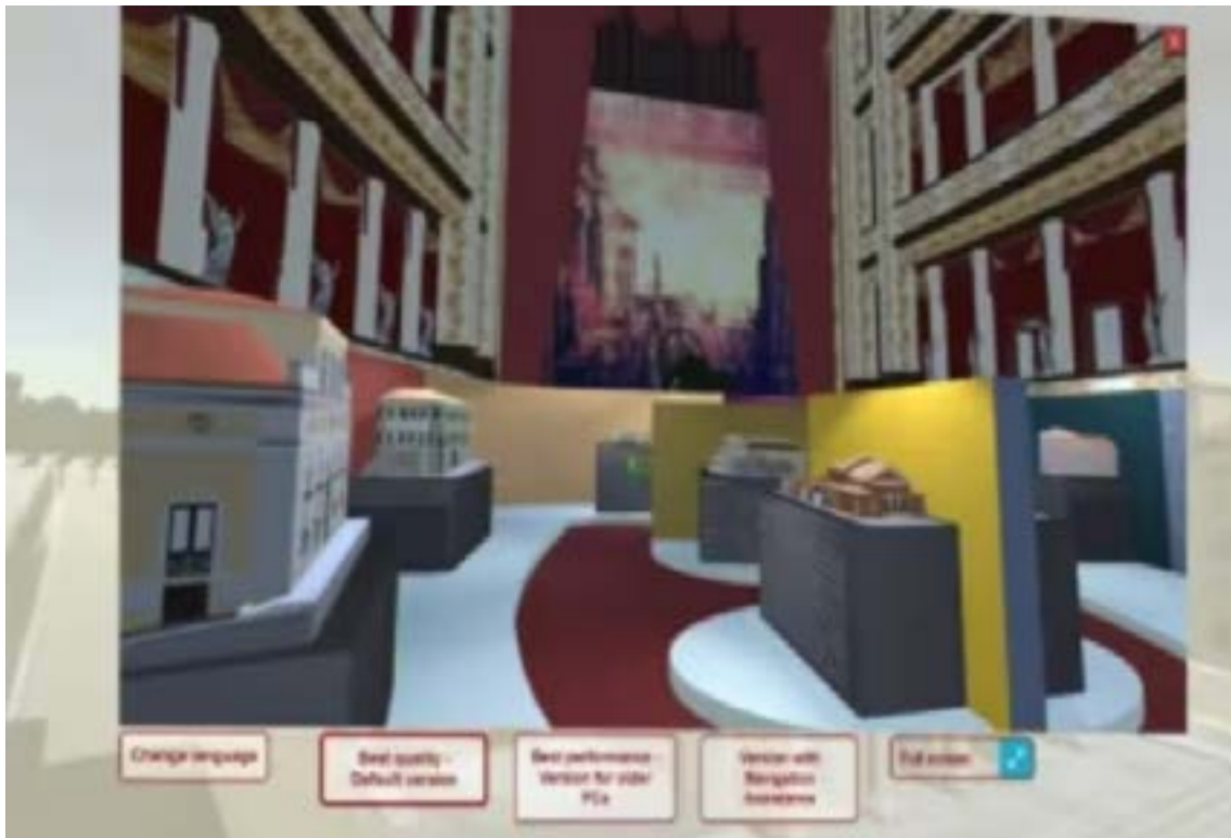
Από την ψηφιακή ξενάγηση των μαθητών του Σχολείου Δεύτερης Ευκαιρίας των Φυλακών