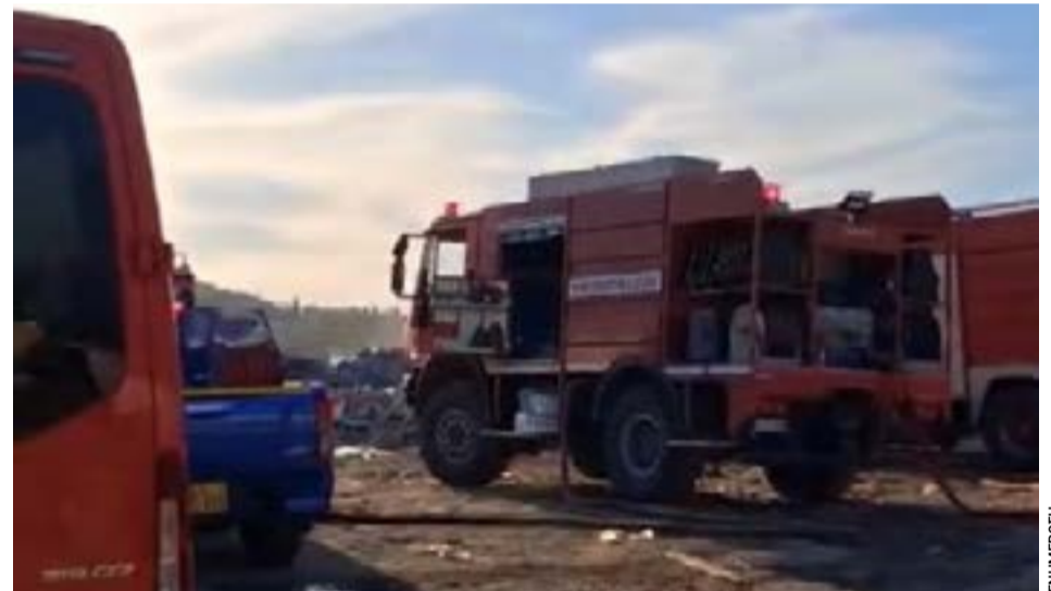
Η Πυροσβεστική καλεί τους πολίτες σε επαγρύπνηση και συνεργασία