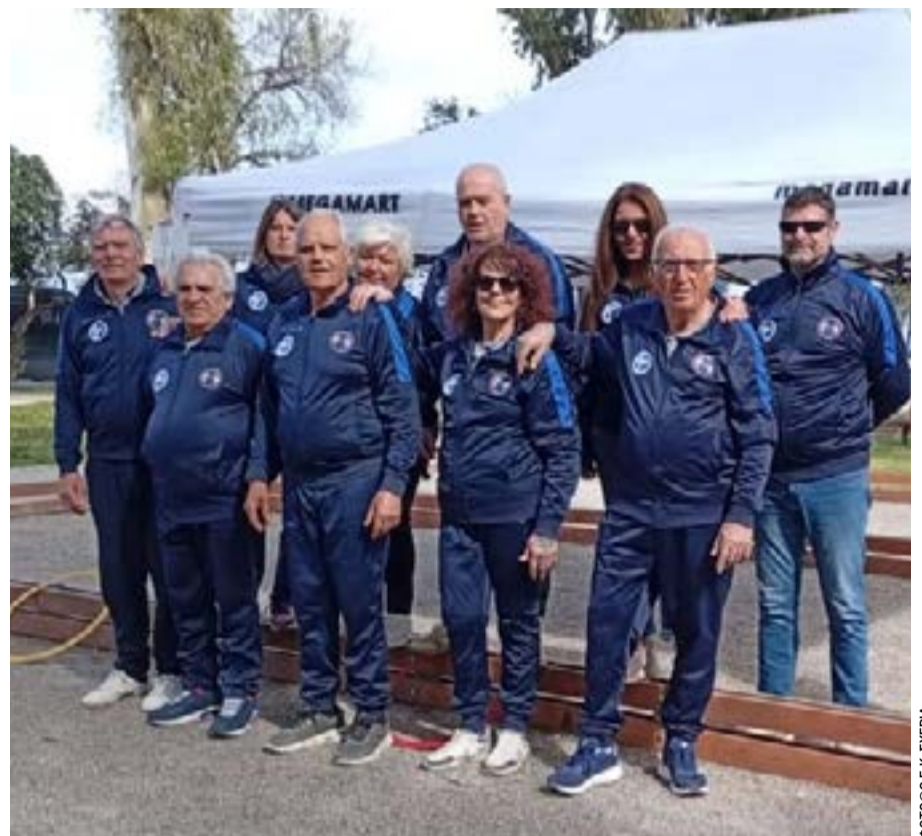
Η ομάδα εδαφοσφαίρισης της Σχερίας

Η ομάδα του Παλαιού Φαλήρου θα εκπροσωπήσει την Ελλάδα τον Νοέμβριο στο Sin-le-Noble της Γαλλίας, στο Ευρωπαϊκό Κύ-