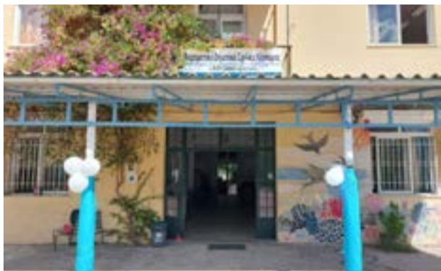
Το «Αθηναγόρειο» σχολείο

ΚΕΡΚΥΡΑ. Επιβλήθηκαν από ανακριτικούς υπαλλήλους της ΔΙ.Π.Υ.Ν. Κέρκυρας διοικητικά πρόστιμα ως ακολούθως: α) προχθές 1.500,00 € και β) χθες 1.875,00€, σε ημεδαπό και αλλοδαπό αντίστοιχα, οι οποίοι προέβησαν σε ελεγχόμενες καύσεις, σε περιοχές του Δήμου Κεντρικής Κέρκυρας & Διαποντίων Νήσων.