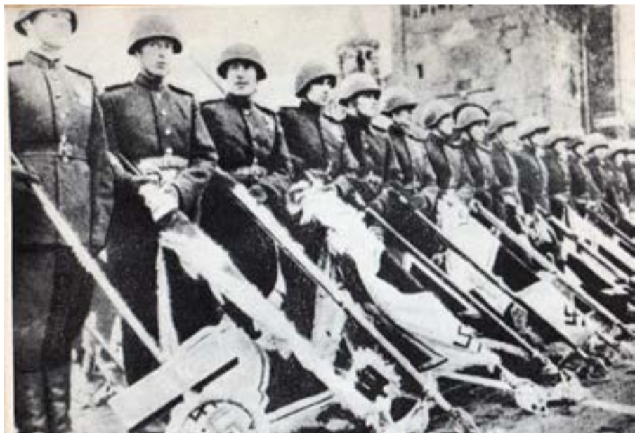
24 Ιούνη 1945: Σοβιετικοί στρατιώτες στην Κόκκινη Πλατεία της Μόσχας, σωριάζουν σημαίες των ηττημένων ναζί στο βάθρο του Μαυσωλείου του Λένιν.