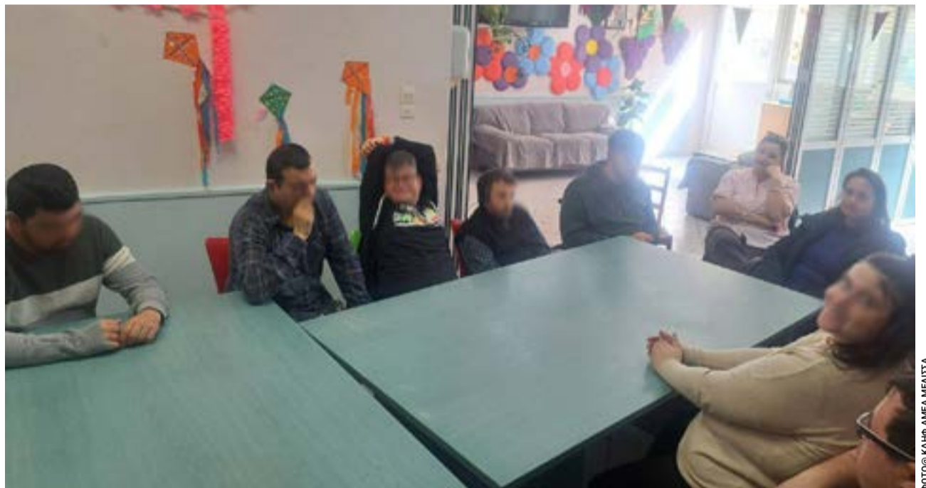
Τα παιδιά μαθαίνουν για τους τρόπους αποφυγής κινδύνων εντός της οικίας.