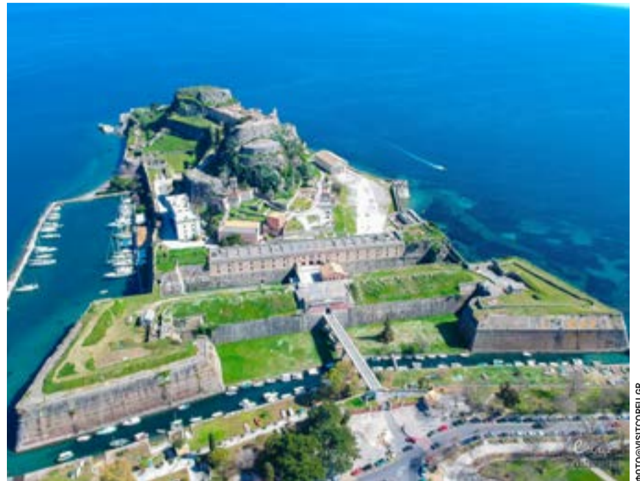
Η γέφυρα στο Παλιό Φρούριο

Αναφερόμενος στο Νέο Φρούριο, κάνει λόγο για έναν χώρο «κλειστό και εγκαταλελειμμένο», όπου – σύμφωνα με την παράταξη – απουσιάζει η παρουσία και η αξιοποίηση από την πλευρά του Δήμου προς όφελος της πόλης