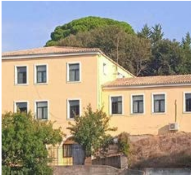
Το Γυμνάσιο - Λύκειο Καρουσάδων