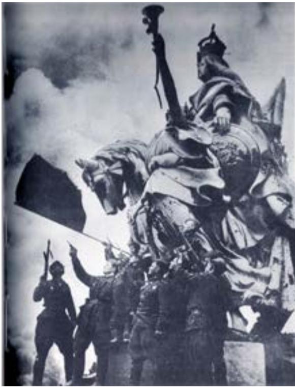
Βερολίνο: Σοβιετικοί στρατιώτες στη βάση ενός αγάλματος του Ράιχσταγκ στις 9 Μάη του 1945