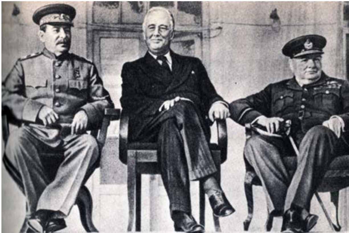
Στάλιν, Φρ. Ρούσβελτ και Ου. Τσώρτσιλ στη Διάσκεψη της Τεχεράνης (28/11-1/12/1943)