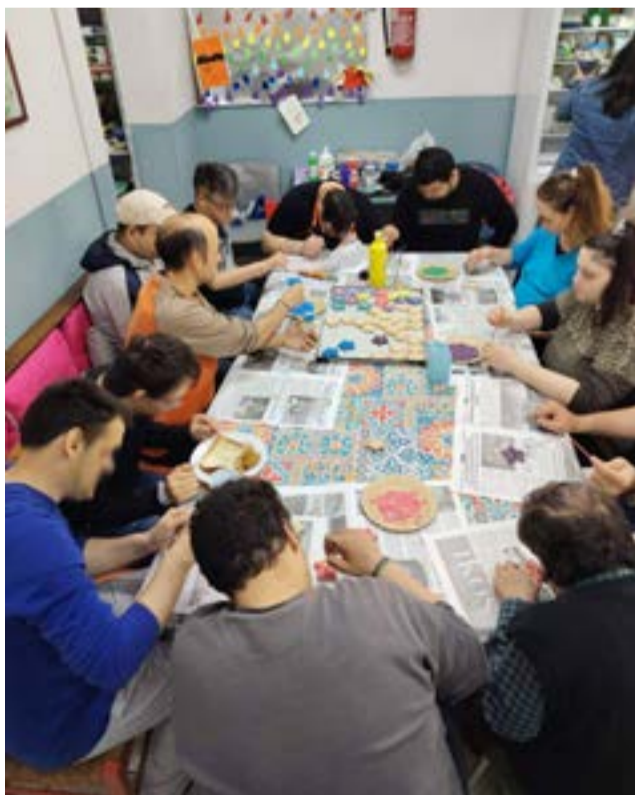
Με χρήση χαρτονιού και χρωμάτων, τα παιδιά σχεδίασαν και κατασκεύασαν παραδοσιακά πρωτομαγιάτικα στεφάνια