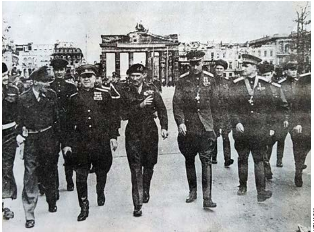
Βερολίνο: Οι σοβιετικοί στρατάρχες Ζούκοφ, Σοκολόφσκι, Ροκοσόφσκι συναντιούνται με τον αμερικανό στρατηγό Μοντγκόμερυ