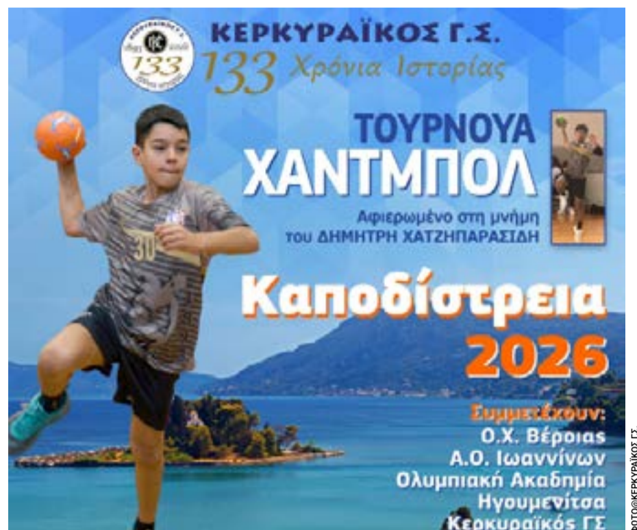
Από την αφίσα των αγώνων