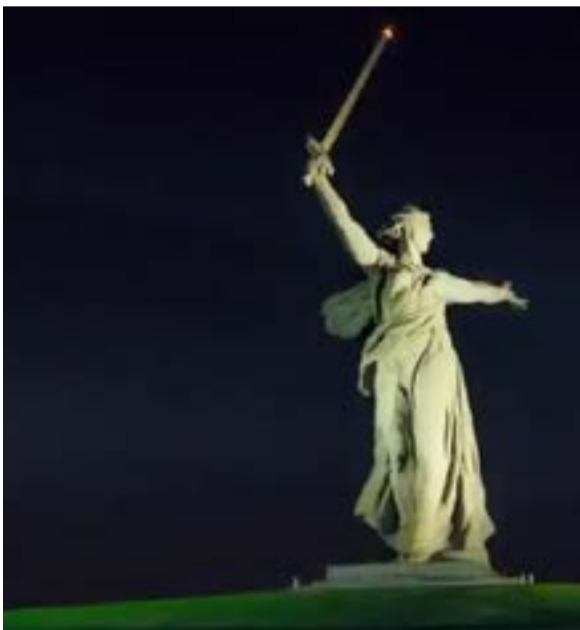
Το άγαλμα της Πατρίδας στο Βόλγκογκραντ, με εντυπωσιακό φωτισμό