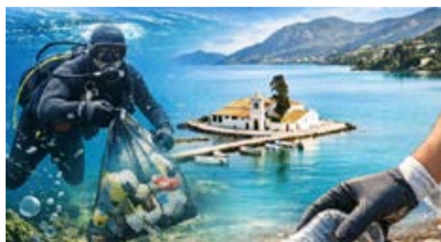
Η αφίσα του ΠΑΣΥΦΘΕΑ

Η δράση εντάσσεται στο πλαίσιο της περιοδικής έκθεσης «Ελλάδα, χώρα αναφοράς. Η τέχνη στις αφίσες του ΕΟΤ, 1929–1976», η οποία παρουσιάζεται στο μουσείο και αναδεικνύει τη σχέση τέχνης, τουρισμού και πολιτισμού μέσα από σπάνιο αρχειακό υλικό. Τα προγράμματα για σχολικές ομάδες θα πραγματοποιηθούν από τις 13 έως τις 15 Μαΐου κατόπιν ραντεβού, ενώ στις 16 και 17 Μαΐου η δράση θα είναι ανοιχτή για το κοινό.