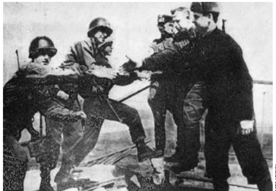
23 Απρίλη 1945: Αμερικανοί και Σοβιετικοί συναντιούνται στον ποταμό Έλβα.