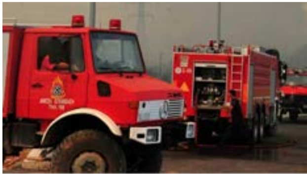
Η Πυροσβεστική ζητά τη συνεργασία και την κατανόηση των πολιτών