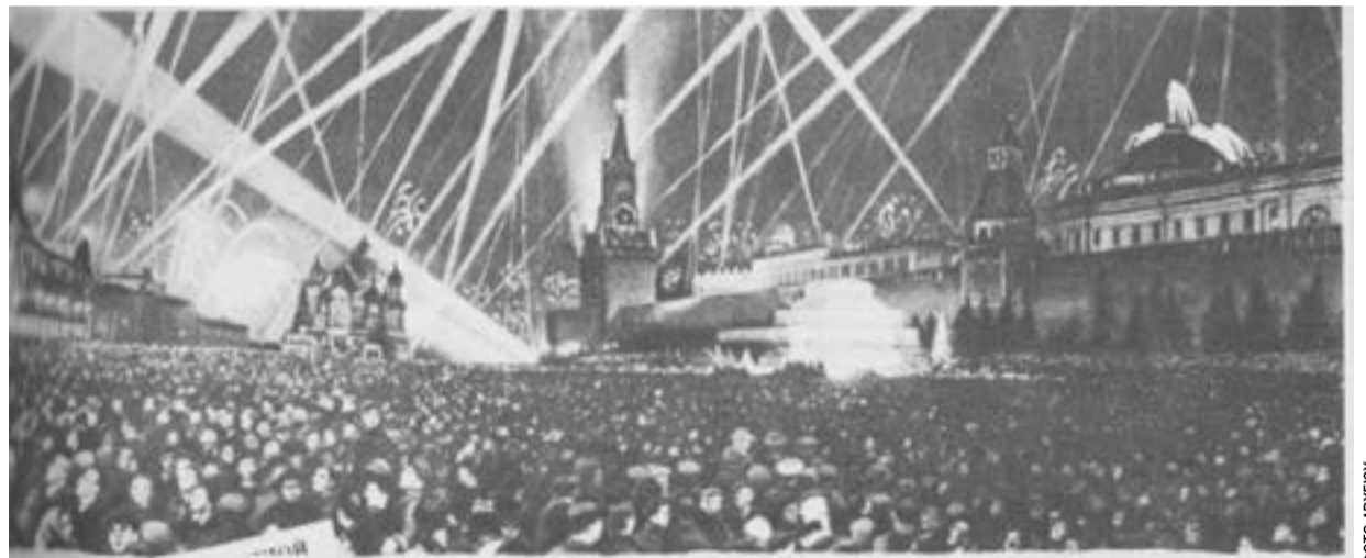
Μόσχα, Κόκκινη Πλατεία, Μάης 1945: «Γιορτή της Νίκης στην Ευρώπη»