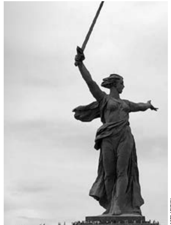
«Η Πατρίδα καλεί» με ύψος 85 μέτρα στο Βόλγκογκραντ, σε ανάμνηση της μάχης του Στάλινγκραντ.