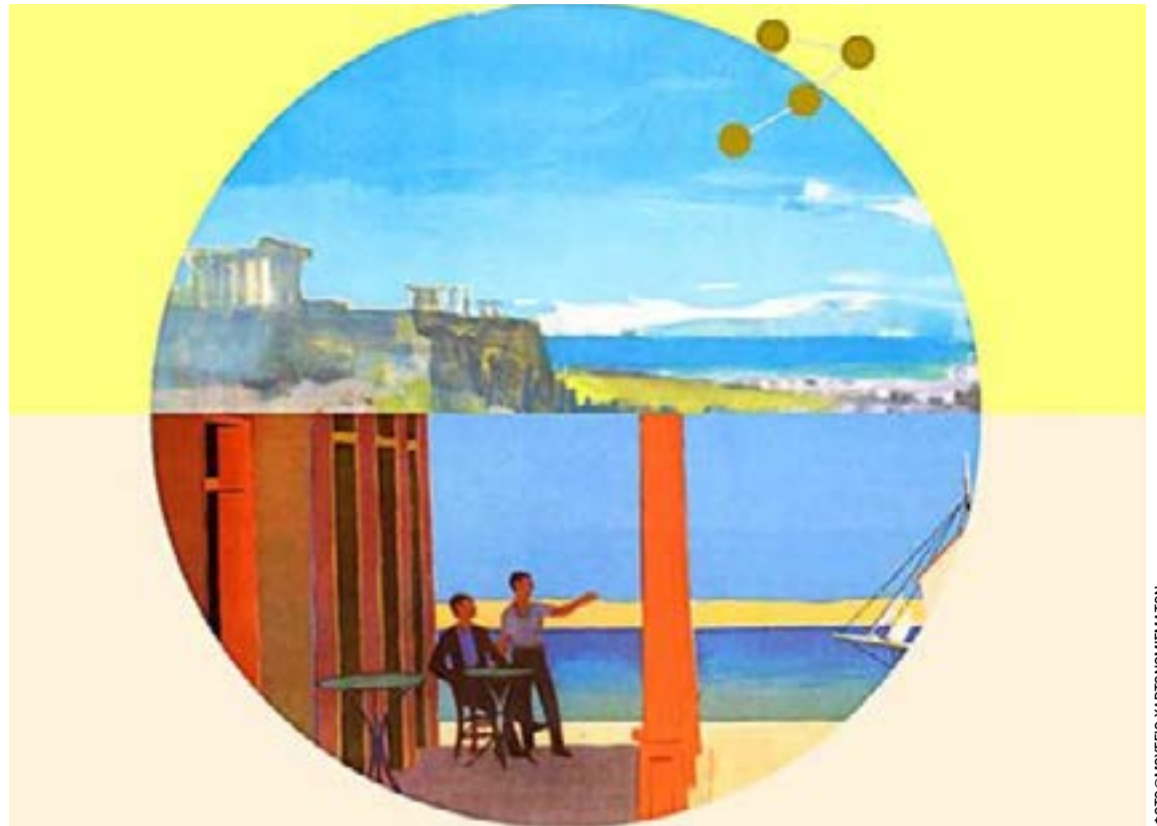
Η αφίσα για τις αφίσες

ΚΕΡΚΥΡΑ. Το 4ο Πειραματικό Δημοτικό Σχολείο Κέρκυρας – «Αθηναγόρειο» διοργανώνει το 2ο Δεκαήμερο Γνώσης, Τέχνης και Πολιτισμού, από τις 3 έως και τις 12 Ιουνίου 2026, σε εμβληματικούς χώρους της πόλης της Κέρκυρας. Το πρόγραμμα περιλαμβάνει εικαστικές εκθέσεις, μουσικές, θεατρικές και χορευτικές παραστάσεις, διαδραστικές και καινοτόμες εκπαιδευτικές πρωτοβουλίες, ανοιχτές στο κοινό.