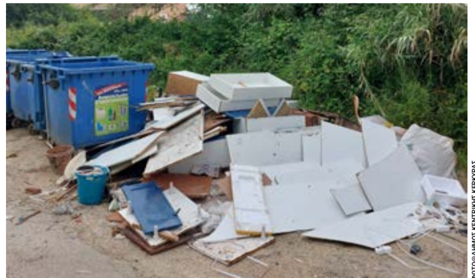
Μια από τις φωτογραφίες που έδωσε στη δημοσιότητα ο δήμος

Το μεγάλο ζητούμενο για την Κέρκυρα φαίνεται πλέον να μην είναι η συνεχής αύξηση του τουρισμού, αλλά η μετάβαση σε ένα διαφορετικό υπόδειγμα ελεγχόμενης, ποιοτικής και βιώσιμης ανάπτυξης.