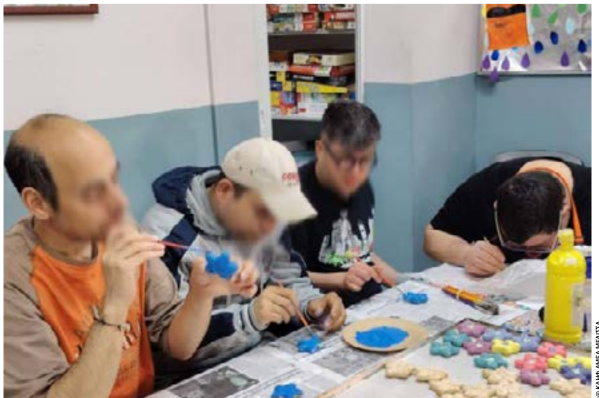
Η δράση αυτή έδωσε την ευκαιρία στα παιδιά να εκφραστούν καλλιτεχνικά, δημιουργώντας χειροποίητα λουλούδια