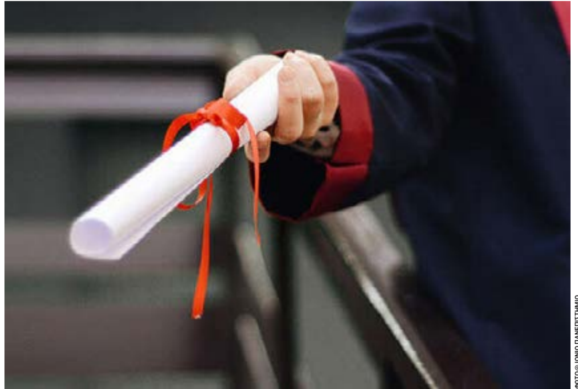
Συνιστάται σε κάθε απόφοιτο να συνοδεύεται έως τρία άτομα

Η «Συμπαράταξη Ανεξάρτητων Πολιτών για τη Βόρεια Κέρκυρα» καλεί τη Δευτεροβάθμια Εκπαίδευση και τη Δημοτική Αρχή να τοποθετηθούν άμεσα και να ενημερώσουν επίσημα μαθητές, εκπαιδευτικούς και τοπικούς φορείς για οποιεσδήποτε εξελίξεις ή αποφάσεις σχετίζονται με το σχολείο.