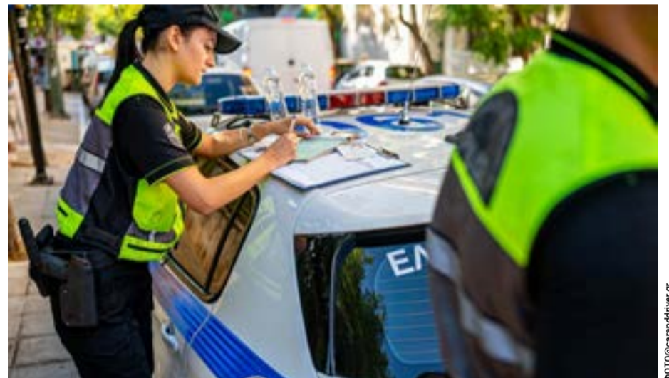
Αμείωτος ο ρυθμός των παραβάσεων στα Ιόνια Νησιά

Οι κάτοικοι του νησιού δεν πληρώνουν περισσότερο επειδή παράγουν περισσότερα απορρίμματα. Πληρώνουν περισσότερο επειδή το κράτος δεν κατάφερε επί χρόνια να παραδώσει τη βασική υποδομή που το ίδιο σχεδίαζε, υποσχόταν και χρηματοδοτούσε. Και όσο αυτή η μεταβατική κατάσταση παρατείνεται, τόσο λιγότερο μπορεί να παρουσιάζεται ως «κανονική» ανταποδοτική λειτουργία ενός δήμου.