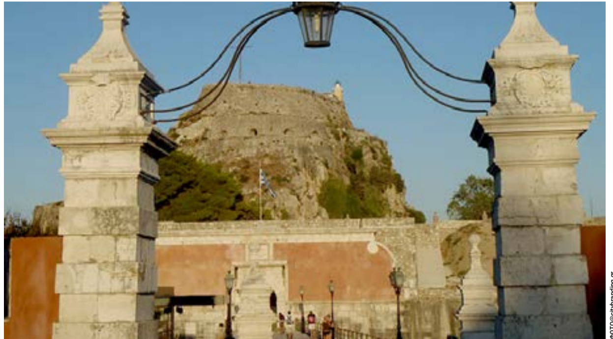
Το Παλιό Φρούριο

Είναι λοιπόν ώρα ο Δήμος μας, με την στήριξη των εκπροσώπων μας στο Κοινοβούλιο και όλων των φορέων να διεκδικήσουμε την παρουσία μας στα δύο εμβληματικά Φρούριά μας και ασφαλώς την συμμετοχή μας, στα μεγάλα έσοδα που προκύπτουν από τους