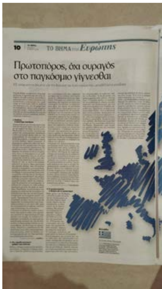
Το άρθρο των παιδιών της Κέρκυρας