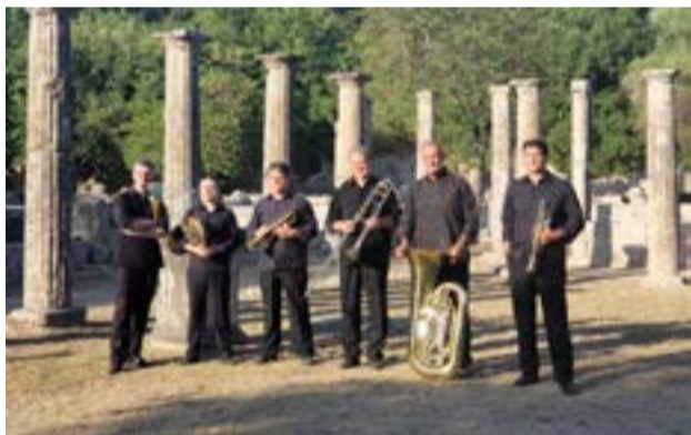
Το σύνολο Μέταλλων της ΚΟΑ

ΚΕΡΚΥΡΑ. Στους 68.788 θα ανέλθει ο αριθμός εισακτέων σπουδαστών στην Τριτοβάθμια Εκπαίδευση για το ακαδημαϊκό έτος 2026-27. Ο αριθμός αυτός είναι ίδιος με τον συνολικό αριθμό εισακτέων και για το 2025, ενώ το 2024 ήταν ελαφρά αυξημένος (68.851). Από το Υπουργείο Παιδείας, έχει αποσταλεί για δημοσίευση σε ΦΕΚ η σχετική Υπουργική Απόφαση που καθορίζει τον συνολικό αριθμό των εισακτέων για το ακαδημαϊκό έτος 2026-2027.