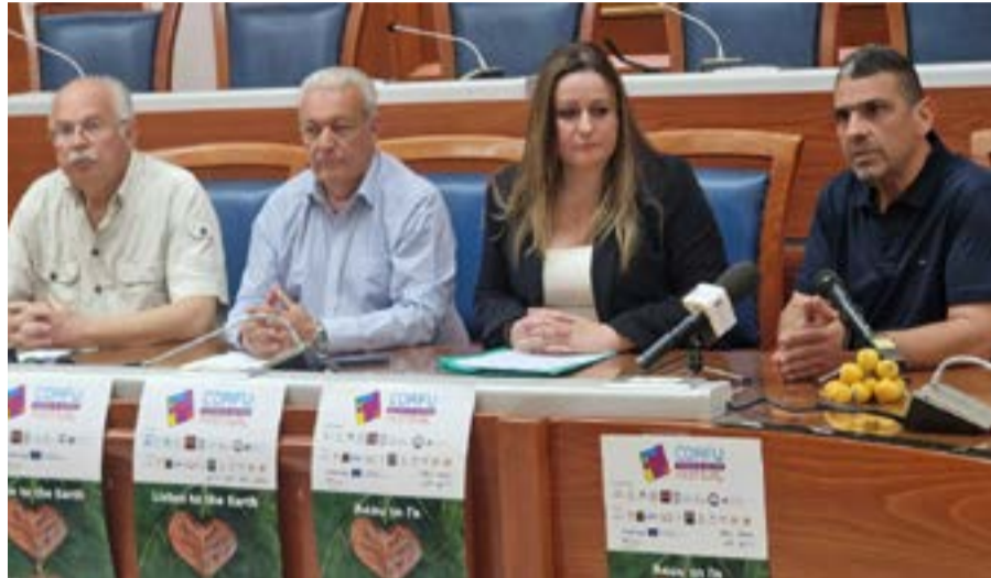
Το φεστιβάλ εστιάζει σε δράσεις που φέρνουν κοντά κατοίκους, επισκέπτες, κοινότητες, φορείς και διαφορετικές γενιές

Στο πλαίσιο της θεματικής ενότητας «Κύκλος», το 8ο Corfu Food & Wine Festival διοργανώνει μια ανοιχτή βιωματική δράση αφιερωμένη στην κυκλική οικονομία, τη βιώσιμη διαχείριση της τροφής και τη μείωση της