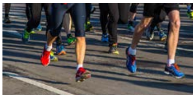
Παράλληλα θα γίνουν και οι ιατρικές εξετάσεις των υποψηφίων

Μετά την επιτυχημένη έναρξη του νέου κύκλου δράσεων, η δράση συνεχίζεται τη Δευτέρα 18 Μαΐου με εξετάσεις σκελετικής υγείας στο 7ο Γυμνάσιο Κέρκυρας. Είχαν προηγηθεί τις προηγούμενες μέρες στοματολογικές εξετάσεις σε παιδιά δημοτικών σχολείων του νησιών από εθελοντές οδοντιάτρους. Την εποπτεία της δράσης έχει ο αντιδήμαρχος Χρήστος Ηρακλής Σκούρτης.