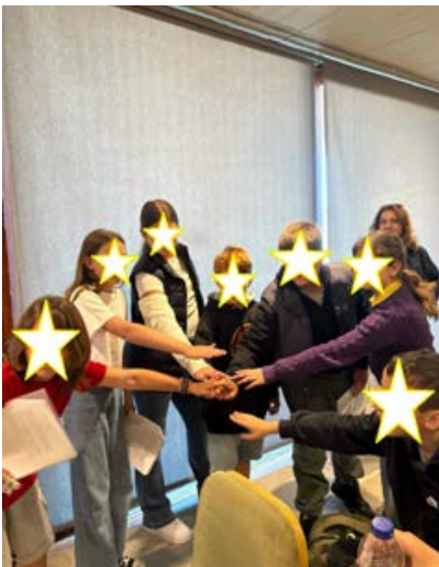
ΦΩΤΟ@12ο ΔΗΜΟΤΙΚΟ ΣΧΟΛΕΙΟ ΚΕΡΚΥΡΑΣ