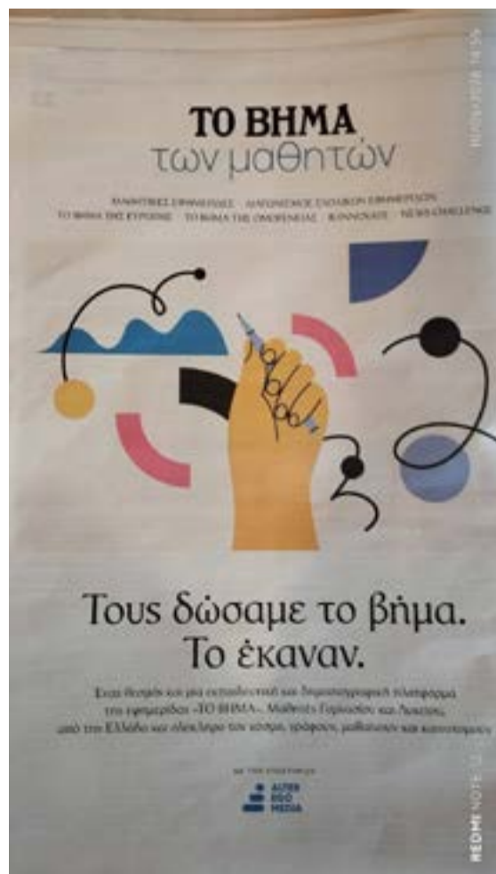
Από το ειδικό ένθετο με τα άρθρα των μαθητών