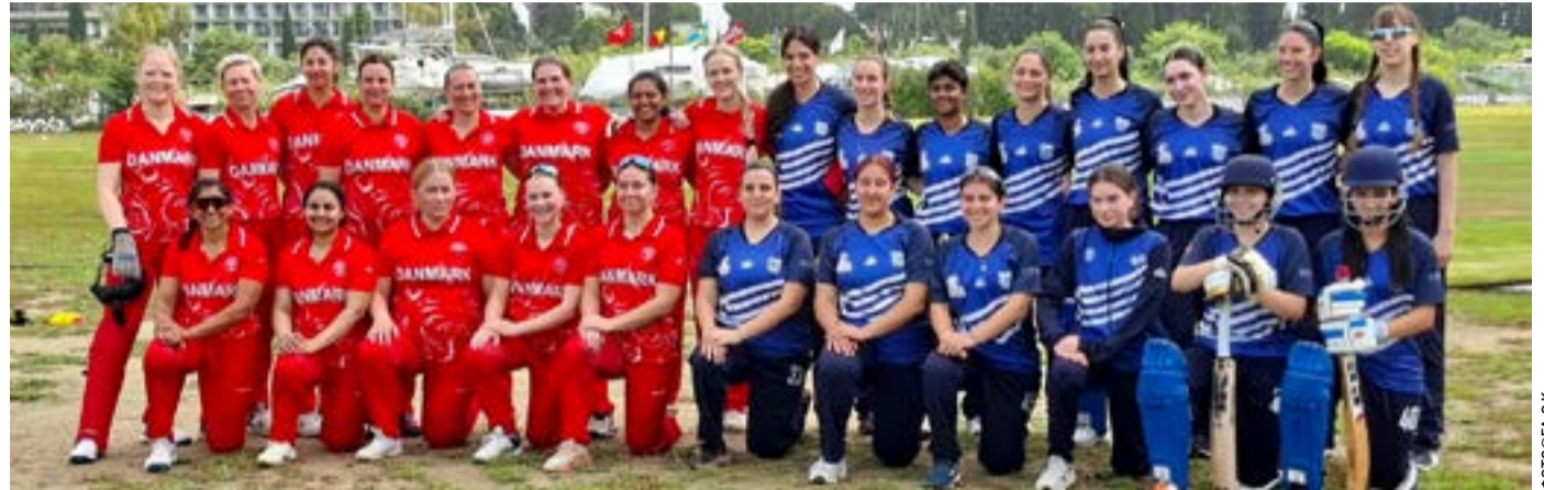
Οι εθνικές ομάδες Ελλάδας και Δανίας στα Γουβιά

ΚΕΡΚΥΡΑ. Κάποιος θα έλεγε ότι το γυναικείο κρίκετ στην Ελλάδα ή καλύτερα στην Κέρκυρα όπου υπάρχουν ομάδες βρίσκεται ακόμη στα «σπάργαλα», αλλά γεγονός είναι πως σε σύντομο χρονικό διάστημα έχει κάνει σημαντικά βήματα προόδου. Έχοντας μπροστά την πρόσκληση πρόκληση, των Ολυμπιακών αγώνων και τη δυνατότητα να πάρει μέρος στα προκριματικά η Εθνική μας ομάδα φιλοξένησε την αντίστοιχη της Δανίας και στο πλαίσιο της προολυμπιακής τους προετοιμασίας έπαιξαν τέσσερις αγώνες το Σαββατοκύριακο 9 & 10 Μαΐου. Βέβαια δεν πρέπει να τρέφουμε ελπίδες για πρόκριση στους Ολυμπιακούς, θα συμμετάσχουν λίγες ομάδες και σίγουρα υπάρχουν χώρες με τεράστια εμπειρία και πιο έτοιμες από την δική μας, αλλά τα δικά μας κορίτσια θα το παλέψουν με όλες τους τις δυνάμεις.