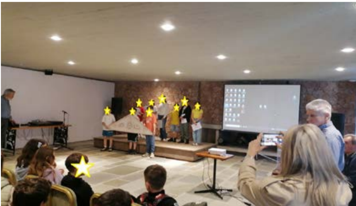
ΦΩΤΟ@12ο ΔΗΜΟΤΙΚΟ ΣΧΟΛΕΙΟ ΚΕΡΚΥΡΑΣ