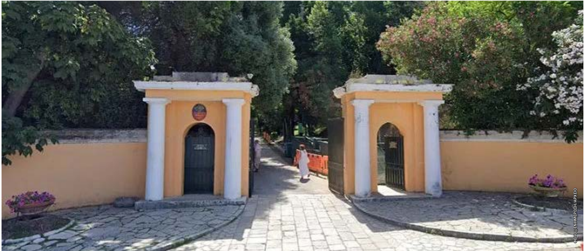
Η Παλαιόπολη, παρά τη σημασία του για την ιστορία και το περιβάλλον της Κέρκυρας, εξακολουθεί να λειτουργεί χωρίς το ειδικό θεσμικό πλαίσιο διαχείρισης που προέβλεπε ήδη από το 1994 ο νόμος παραχώρησής του στον Δήμο Κερκυραίων.