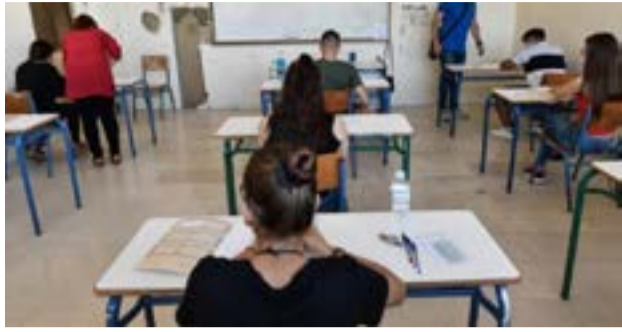
Καμιά μεταβολή φέτος στις θέσεις των εισακτέων