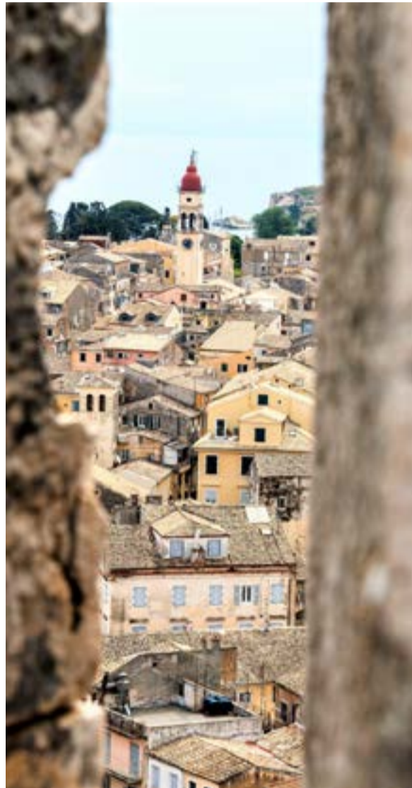
Ο συγγραφέας υποστηρίζει ότι η άνοδος του υπερτουρισμού, η εκτόξευση των τιμών κατοικίας, η εξάρτηση της τοπικής οικονομίας από τον τουρισμό και η συνεχής επέκταση των τουριστικών υποδομών αλλοιώνουν τη φυσιογνωμία του νησιού και δυσκολεύουν ολόένα περισσότερο τη ζωή των μόνιμων κατοίκων.

Η Κέρκυρα ως τουριστικός προορισμός εμπο-