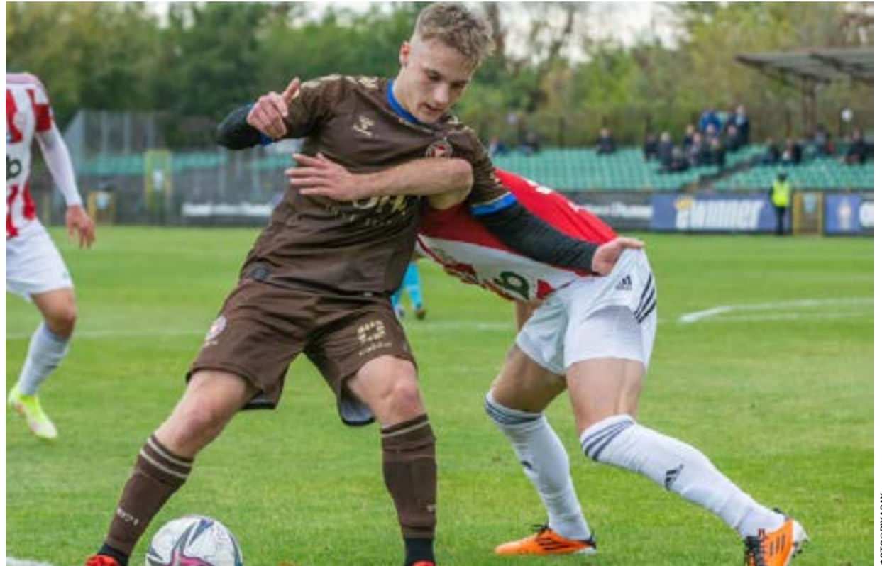
Η ΑΕΛ Λευκίμμης και ο ΟΦΑΜ που θα αγωνιστούν στην Γ' Εθνική θα πρέπει να έχουν στο ρόστερ τους τουλάχιστον 5 ή και 6 ποδοσφαιριστές γεννημένους το 2008 και μετά

Θεωρούμε ότι το μέτρο θα ισχύσει από τη σε-