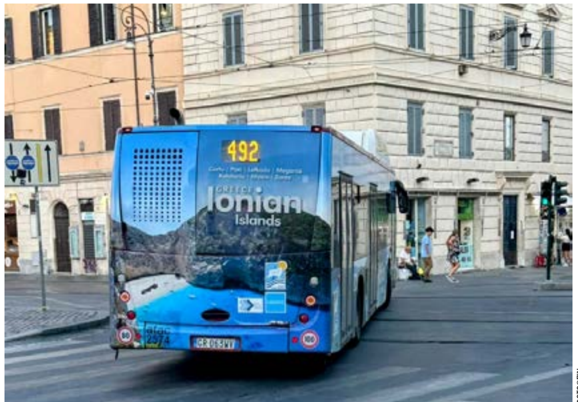
Λεωφορεία στο Παρίσι διαφημίζουν τα Ιόνια Νησιά

Η επιτυχής υλοποίηση του προγράμματος αναδεικνύει τη σημασία της περιβαλλοντικής εκπαίδευσης και της ευαισθητοποίησης της μαθητικής κοινότητας σε ζητήματα προστασίας της βιοποικιλότητας, συμβάλλοντας ενεργά στη διαμόρφωση υπεύθυνων και ενημερωμένων πολιτών.