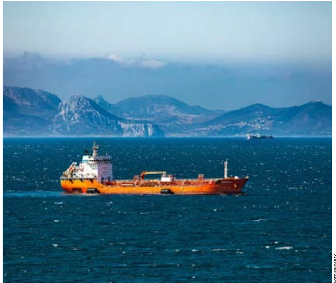
Ακόμη όμως και στο ενδεχόμενο θετικής κατάληξης των διπλωματικών επαφών δεν πρόκειται να είναι άμεση η ελεύθερη ναυσιπλοΐα στα Στενά του Ορμούζ

Στον απόηχο των σοβαρών επεισοδίων που έγιναν λίγες ώρες νωρίτερα στη Θεσσαλονίκη και τη Δυτική Αττική, διεξήχθησαν χθες οι φοιτητικές εκλογές σε όλη τη χώρα. Ως το κλείσιμο της κάλπης όλα κύλησαν ομαλά και η συμμετοχή θεωρείται η συνήθης των τελευταίων χρόνων. Κάθε παράταξη αναμένεται να εκδώσει τα δικά της αποτελέσματα.