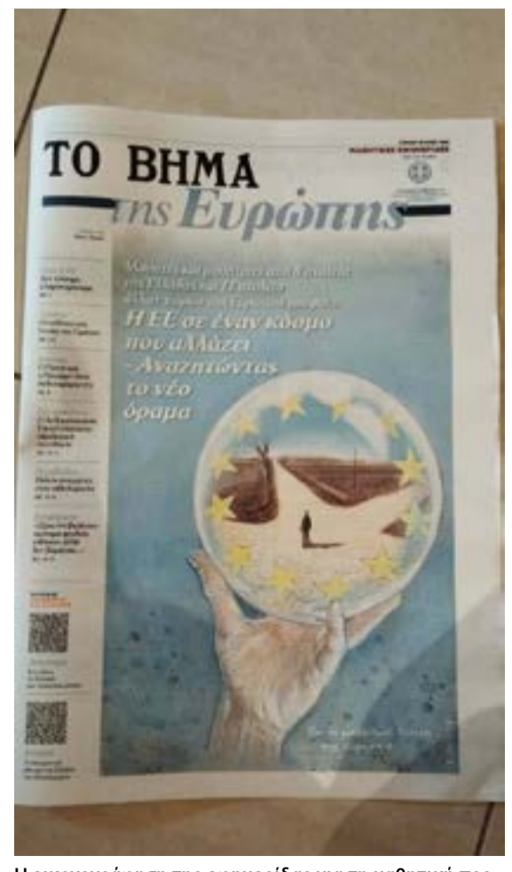
Η εικονογράφηση της εφημερίδας για τη μαθητική προσέγγιση της ΕΕ