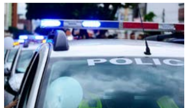
Ο συλληφθείς οδηγήθηκε στον εισαγγελέα Πρωτοδικών Ιωαννίνων

Νομοσχέδιο του υπουργείου Ανάπτυξης βάζει τέλος σε φαινόμενα καταχρηστικών συμπεριφορών από Τράπεζες σε βάρος των δανειοληπτών. Αυτό τόνισε χθες ο υπουργός Τάκης Θεοδωρικάκος, και πρόσθεσε να τεθεί σε δημόσια διαβούλευση μέσα στον Μάιο και θα ψηφιστεί τον Ιούνιο, κατ'εφαρμογή δύο ευρωπαϊκών οδηγιών. Πρόσθεσε ότι μπαίνει τέλος στα «ψιλά γράμματα», των δανείων.