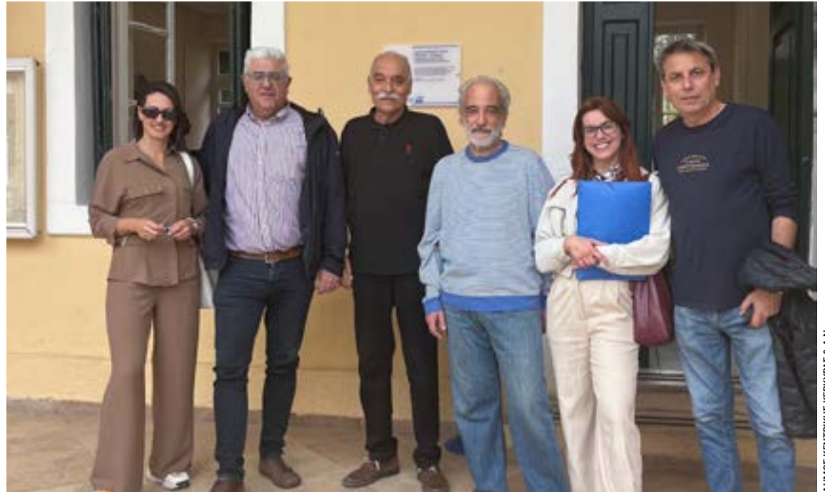
Οι μετέχοντες στη δράση για τη σκελετική υγεία

ΚΕΦΑΛΟΝΙΑ. Η Φιλαρμονική Σχολή Κεφαλληνίας (ΦΣΚ) σε συνεργασία με το σύνολο χάλκινων πνευστών και κρουστών "ΜΕΤΑΛΛΟΝ" της Κρατικής Ορχήστρας Αθηνών (ΚΟΑ), διοργανώνει 16 και 17 Μαΐου Εργαστήρια Χάλκινων Πνευστών και Κρουστών, με αφορμή τη συναυλία της, την Παρασκευή 15 Μαΐου 2026 και ώρα 20:30 στην Αίθουσα Συναυλιών της ΦΣΚ.