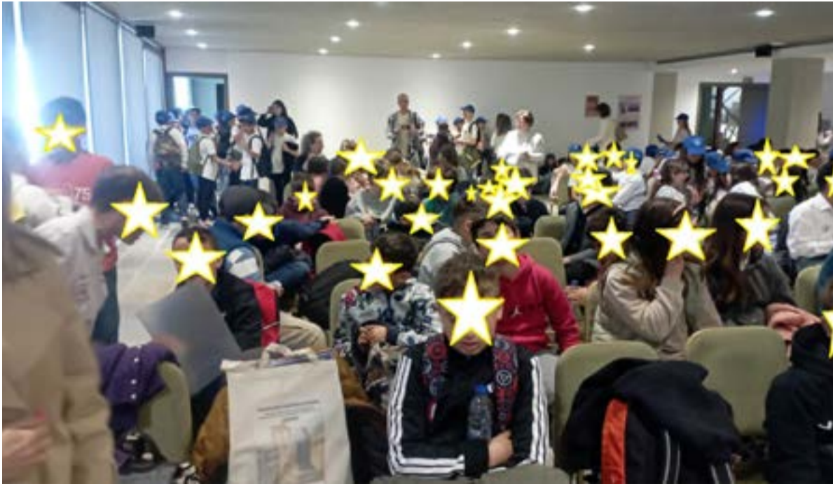
ΦΩΤΟ@12ο ΔΗΜΟΤΙΚΟ ΣΧΟΛΕΙΟ ΚΕΡΚΥΡΑΣ

Παράλληλα και με την ευκαιρία του Συνεδρίου τα παιδιά είχαν την ευκαιρία να παρακολουθήσουν εργασίες συμμαθητών τους από άλλα σχολεία της Ελλάδας και του εξωτερικού, να γνωρίσουν από κοντά την πολιτιστική και ιστορική κληρονομιά των Δελφών, αλλά και στοιχεία του φυσικού περιβάλλοντος και της οικονομικής ζωής της ευρύτερης περιοχής. Επισκέφθηκαν το αρχαιολογικό μουσείο και το Μαντείο των Δελφών που ήταν το σημαντικότερο θρησκευτικό κέντρο του αρχαίου ελληνικού κόσμου. Παρακολούθησαν παράσταση μαθητών και μαθητριών στο θέατρο Φρύνιχος, ξεναγήθηκαν στο ναυτικό μουσείο Γαλαξιδίου και γνώρισαν από κοντά τον τρόπο εξόρυξης του βωξίτη.