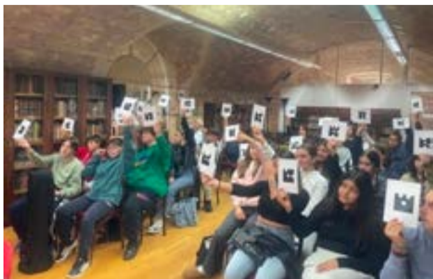
Στο πρόγραμμα συμμετείχαν συνολικά 533 μαθητές και μαθήτριες, καθώς και 52 εκπαιδευτικοί συνοδοί από 18 Γυμνάσια και Λύκεια του νησιού