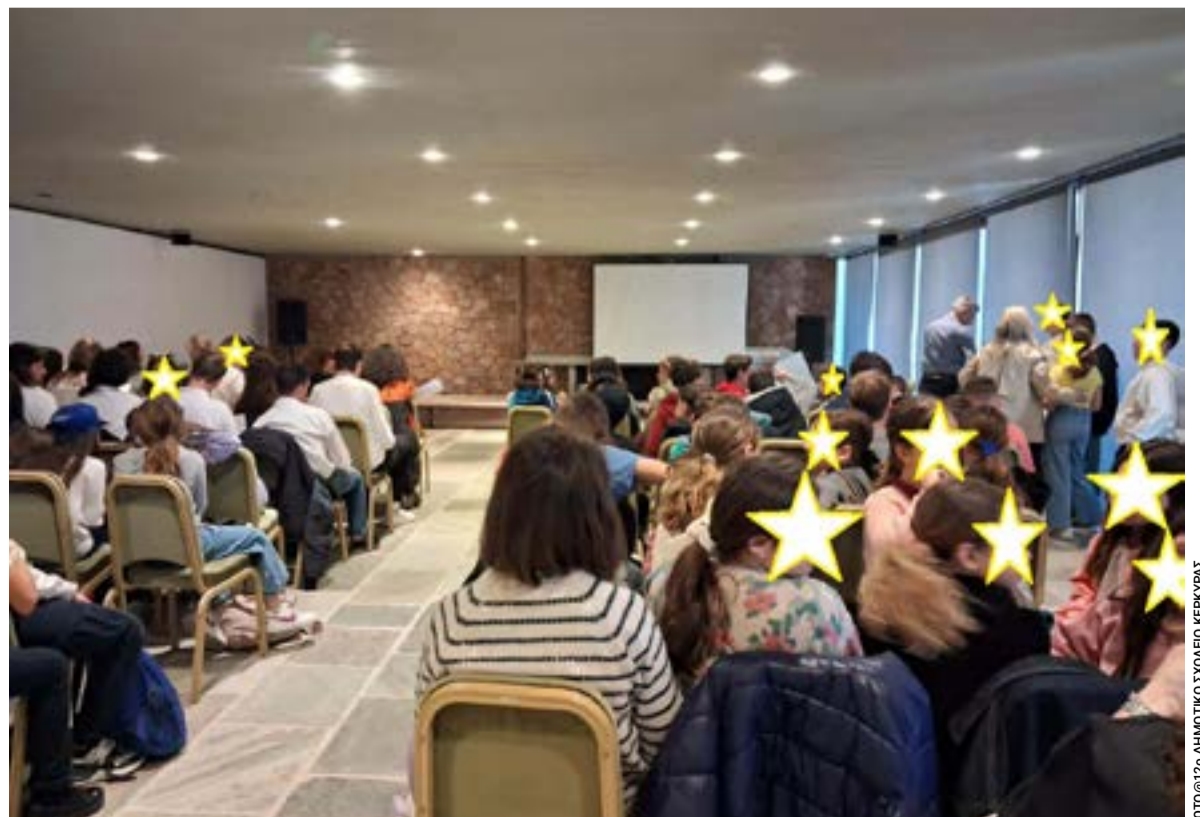
ΦΩΤΟ@12ο ΔΗΜΟΤΙΚΟ ΣΧΟΛΕΙΟ ΚΕΡΚΥΡΑΣ