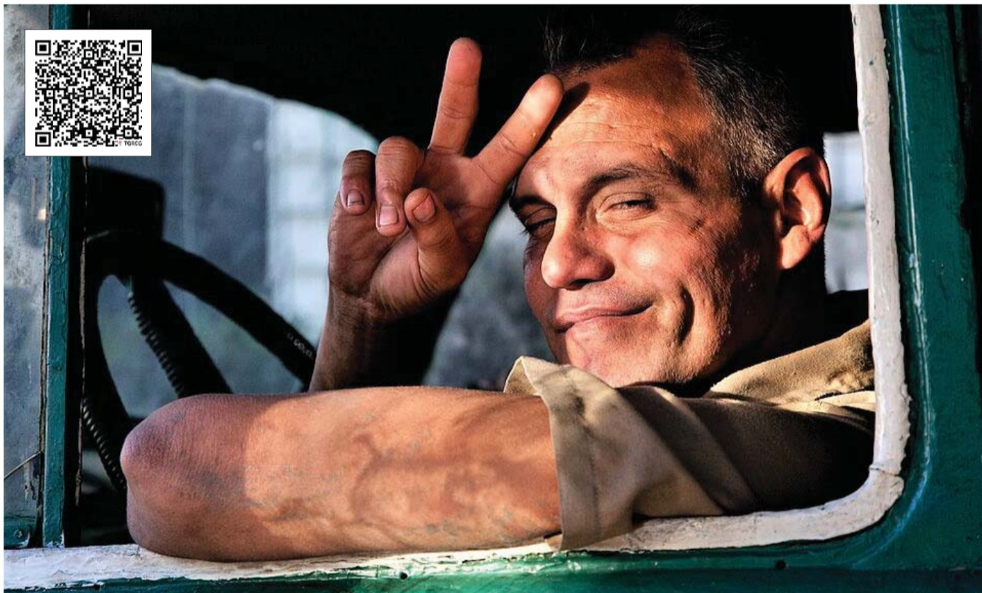
Jorge Royan, WIKIMEDIA COMMONS PICTURES