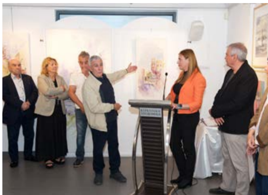
ΦΩΤΟ@ FB ΚΕΡΚΥΡΑΪΚΗ ΠΙΝΑΚΟΘΗΚΗ