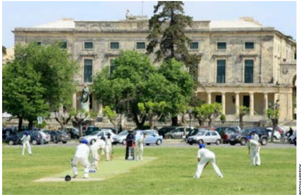
Κρίκετ στην Σπιανάδα, μπροστά από τα ανάκτορα, όπου παραμένει το επίκεντρο του αθλήματος στην Ελλάδα.

Το κλείσιμο της 21ης Μαΐου είναι τελικά ένα σύμπτωμα. Όχι η αιτία.