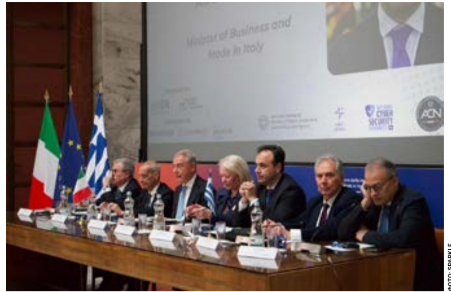
Οι Υπουργοί Adolfo Urso και Δημήτρης Παπαστεργίου έθεσαν τις βάσεις για την ενίσχυση της ευρωπαϊκής ψηφιακής κυριαρχίας.