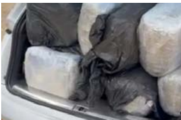
Το αυτοκίνητο φορτωμένο με κάναβη

Σας προτείνουμε να έχετε μαζί σας καπέλα και νερό και φυσικά την καλή σας διάθεση.