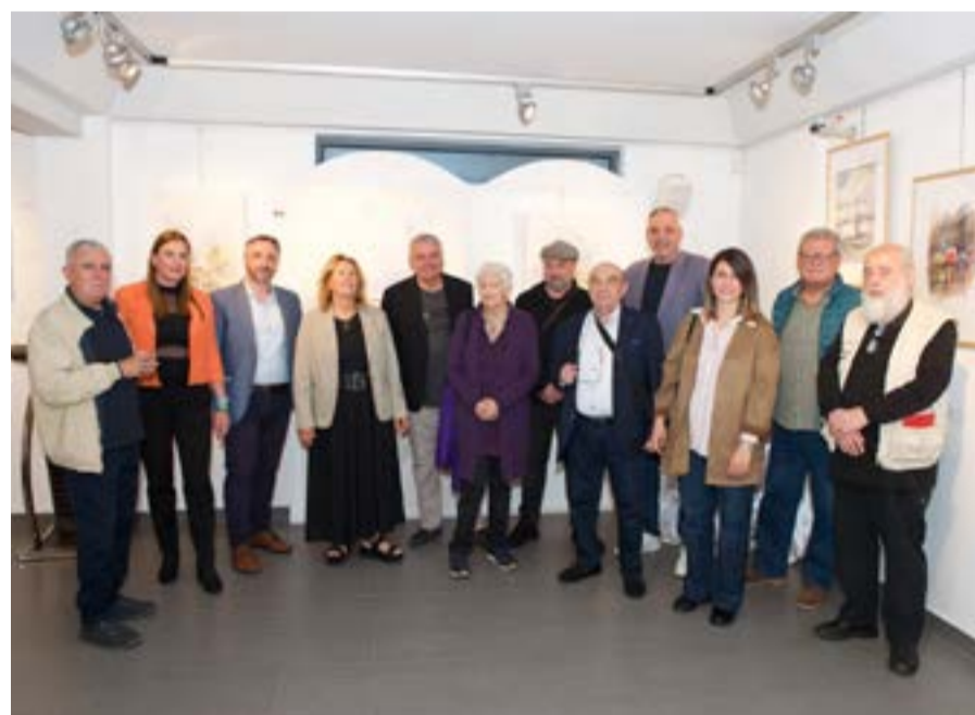
ΦΩΤΟ@ FB ΚΕΡΚΥΡΑΪΚΗ ΠΙΝΑΚΟΘΗΚΗ