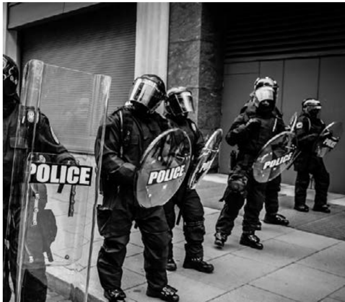
Η βία δεν έχει τελειωμό στα ελληνικά πανεπιστήμια

https://www.diaxeiristiki.gr/index.php/2016-02-19-10-34-07/5511-prosklisi-yronolis-protaseon-gia-tin-drasi-symprakseis-epixeiriseon-tis-perifereias-ionion-nison-me-organismoyis-erevnas-kai-diadosis-gnoseon