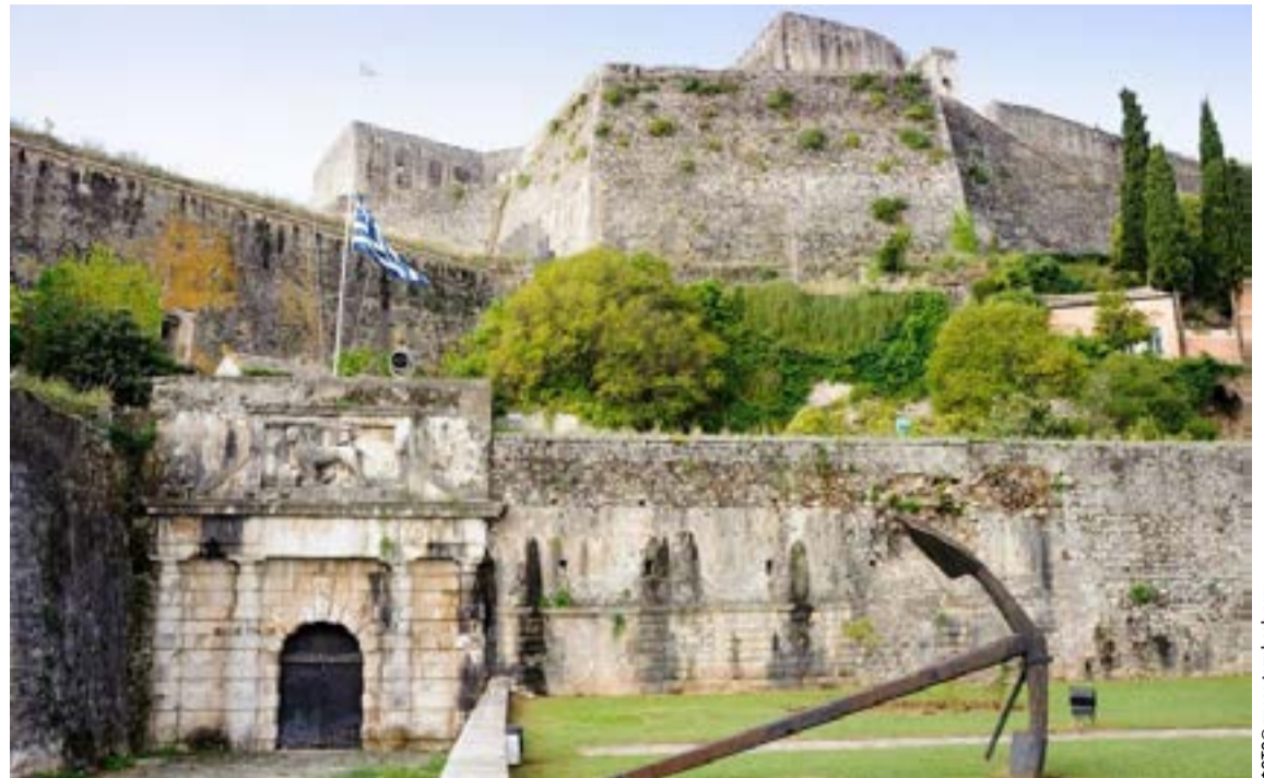
Το Νέο Φρούριο, θεωρείται αριστούργημα της οχυρωματικής τέχνης

Η πύλη Data.gov.gr περιλαμβάνει ένα ευρύ φάσμα θεματικών κατηγοριών, όπως γεωργία, αλιεία, δασοκομία και τρόφιμα, παιδεία, πολιτισμό και αθλητισμό, περιβάλλον, υγεία, δικαιοσύνη και δημόσια ασφάλεια, πληθυσμό και κοινωνία, μεταφορές, οικονομία και χρηματοοικονομικά θέματα, ενέργεια, κυβέρνηση, αλλά και τεχνητή νοημοσύνη.