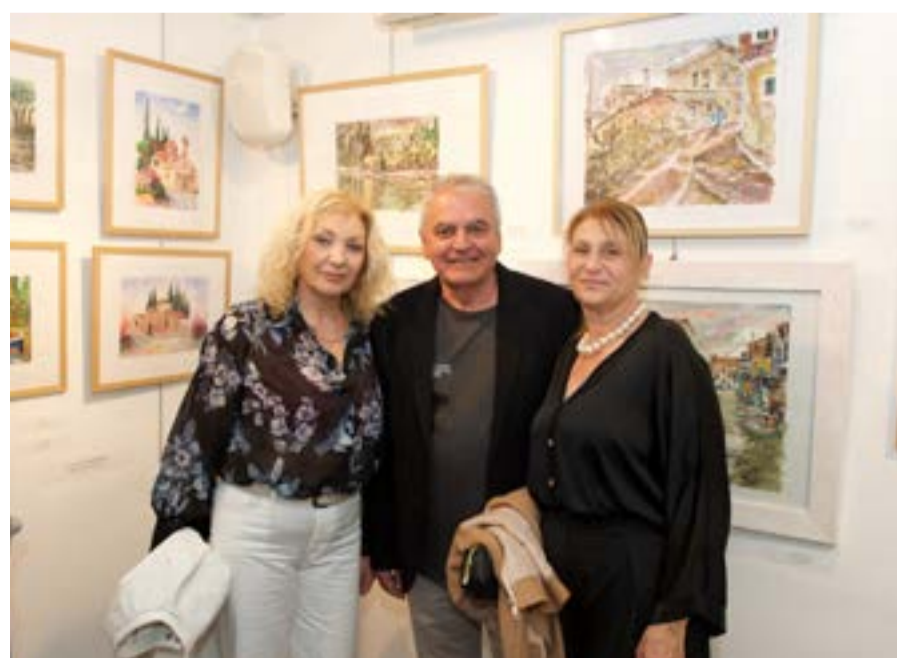
ΦΩΤΟ@ FB ΚΕΡΚΥΡΑΪΚΗ ΠΙΝΑΚΟΘΗΚΗ