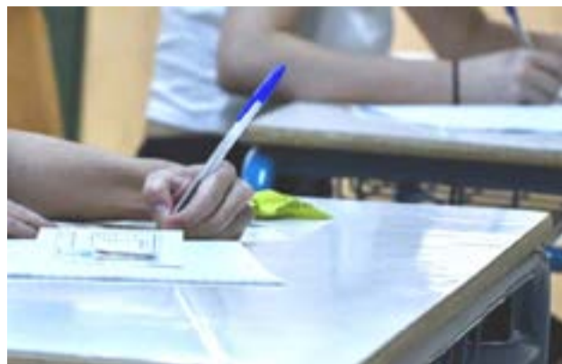
Μαθητές και γονείς μπορούν να επικοινωνούν εργάσιμες ημέρες και ώρες