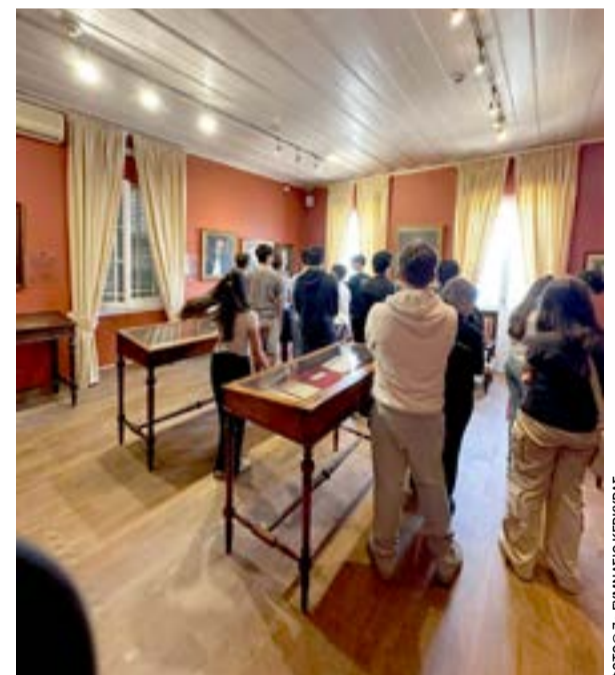
Τα παιδιά έμαθαν για την ιστορία και τη δράση των μουσείων