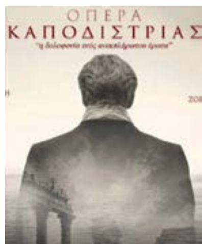
Η αφίσα του έργου