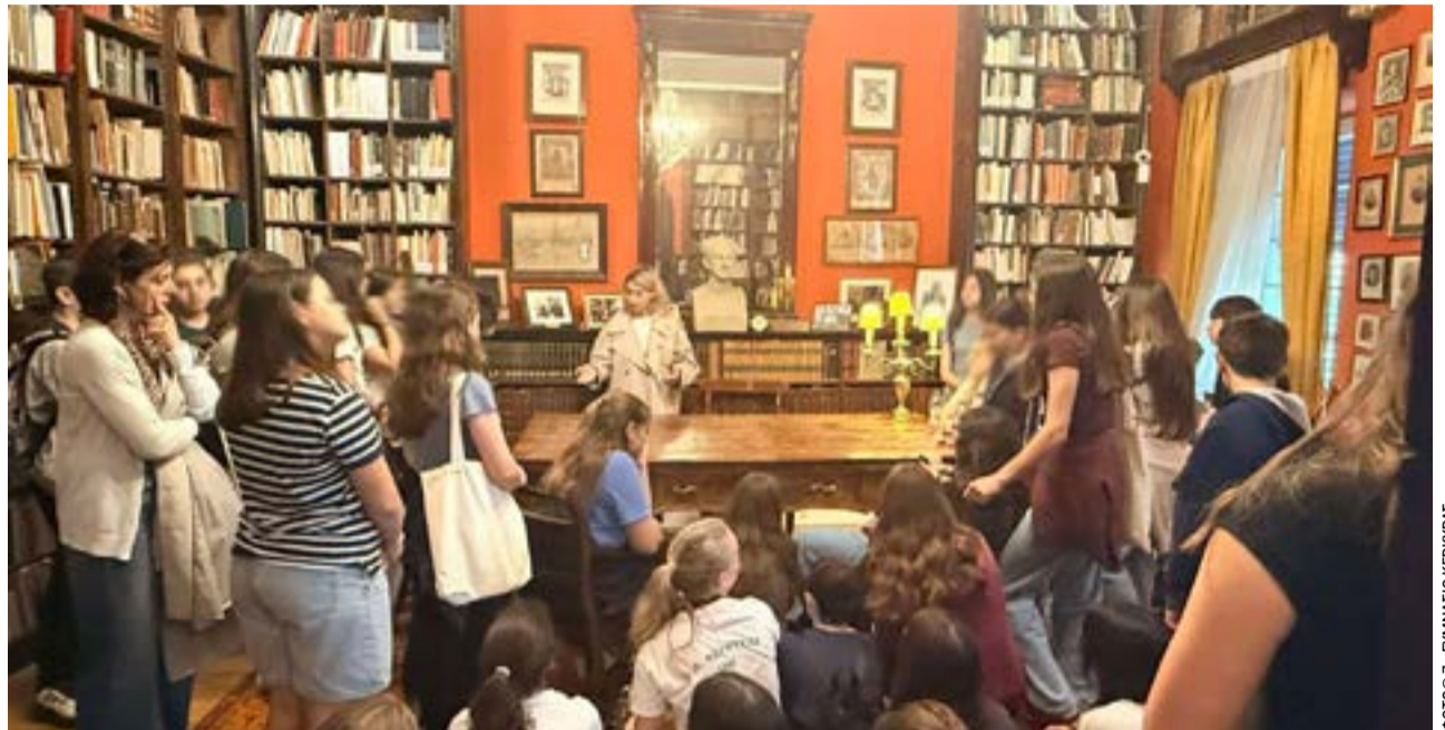
Από την επίσκεψη στην Αναγνωστική Εταιρεία

Με τις παραπάνω δράσεις ολοκληρώθηκε ο κύκλος των σχολικών περιπάτων για το τρέχον έτος. Οι επισκέψεις αυτές πέτυχαν τον διπλό τους στόχο: την απαραίτητη αποφόρτιση των μαθητών από τη σχολική καθημερινότητα και την ουσιαστική επαφή τους με την τοπική ιστορία και την πολιτιστική κληρονομιά του τόπου τους.