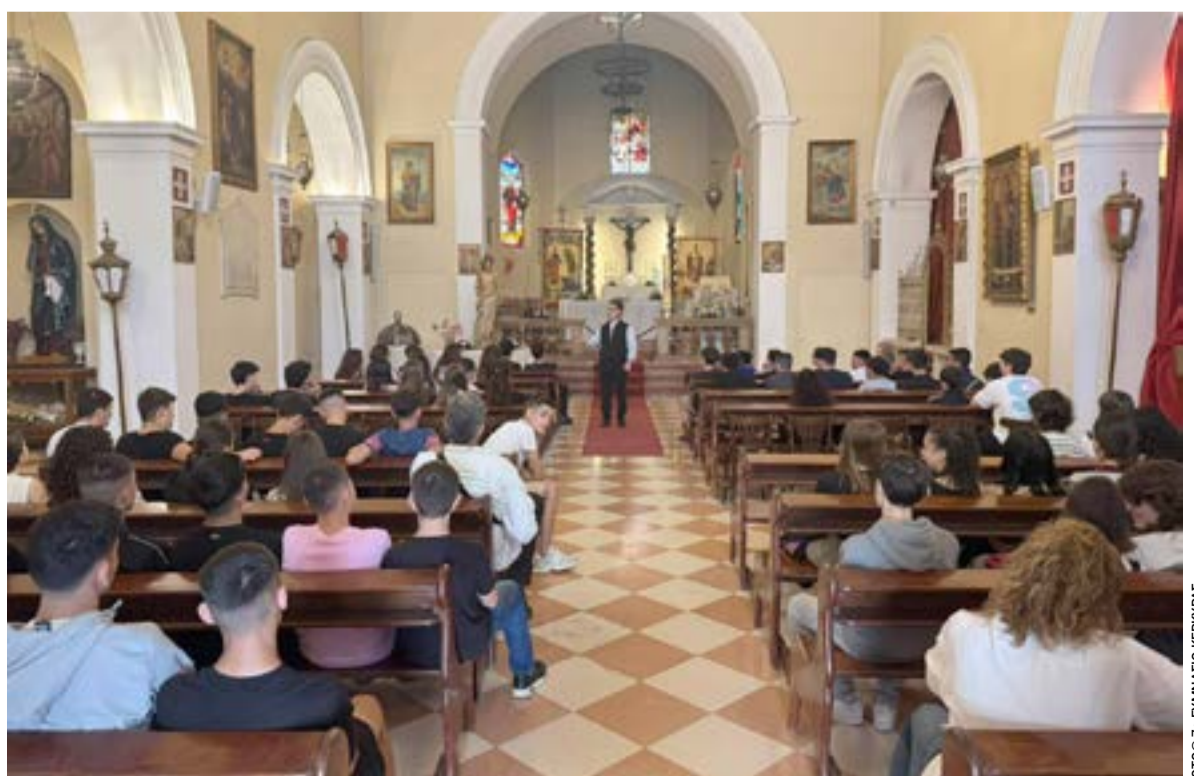
Στον Καθεδρικό Ναό των Ρωμαιοκαθολικών