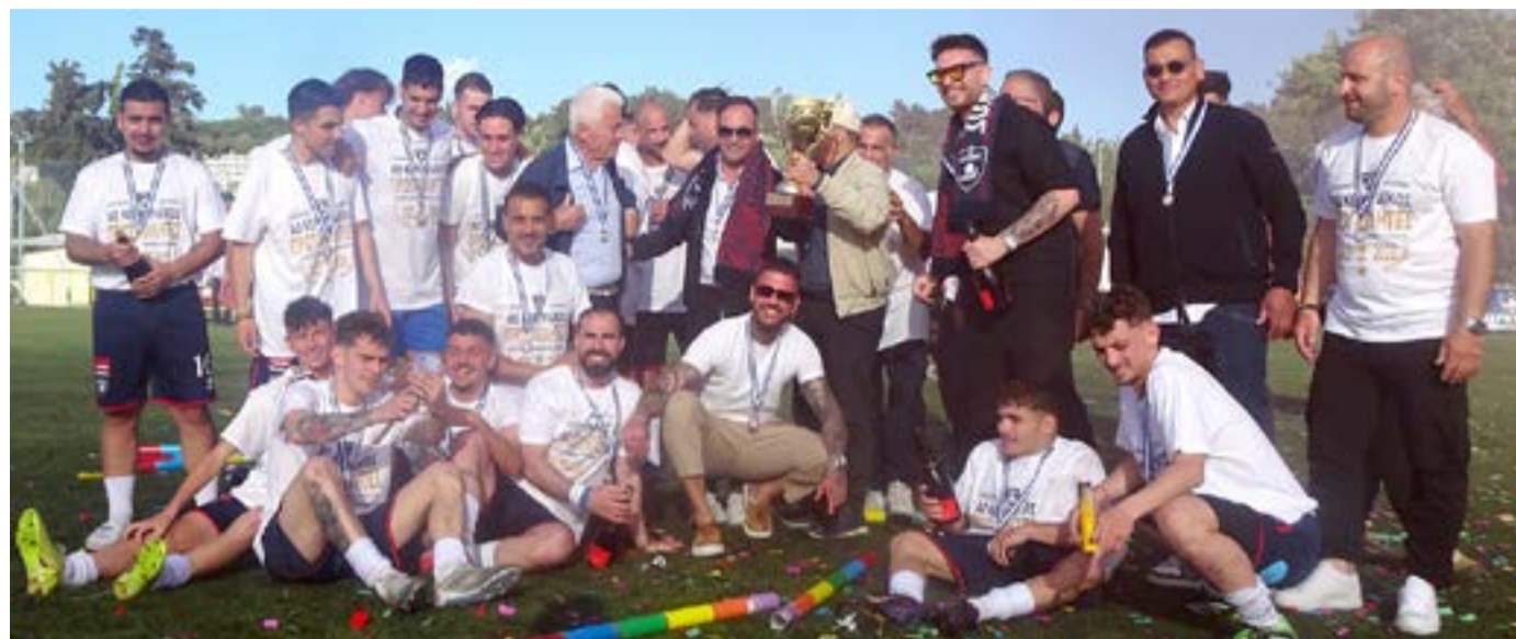
Ο πρωταθλητής της Β' ΕΠΣ Κέρκυρας ΑΟ Κερκυραϊκός

Με την ολοκλήρωση αυτής της σπουδαίας προσπάθειας και την κατάκτηση του πρωταθλήματος, αισθανόμαστε την ανάγκη