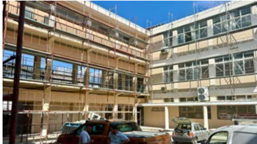
Ύστερα από πολυετή εκκρεμότητα και συνεχείς διαμαρτυρίες για τα προβλήματα ασφάλειας και φθορών στο σχολικό συγκρότημα των ΕΠΑΛ στο Μαντούκι, ο Δήμος Κεντρικής Κέρκυρας και Διαποντίων Νήσων προχωρά πλέον στη δημοπράτηση του έργου στατικής ενίσχυσης και αποκατάστασης του κτηρίου.

Τα ζητήματα φθορών, ασφάλειας και λειτουργικότητας του συγκροτήματος είχαν αναδειχθεί επανειλημμένα από μαθητές, εκπαιδευτικούς και γονείς, με κινητοποιήσεις και δημόσιες παρεμβάσεις ήδη από το 2020. Τα τελευταία χρόνια οι ανησυχίες εντάθηκαν, ιδιαίτερα μετά περιστατικά όπως η πτώση παραθύρου από όροφο του σχολείου, που επανέφεραν στο προσκήνιο το ζήτημα της στατικής επάρκειας και της γενικότερης κατάστασης των εγκαταστάσεων.