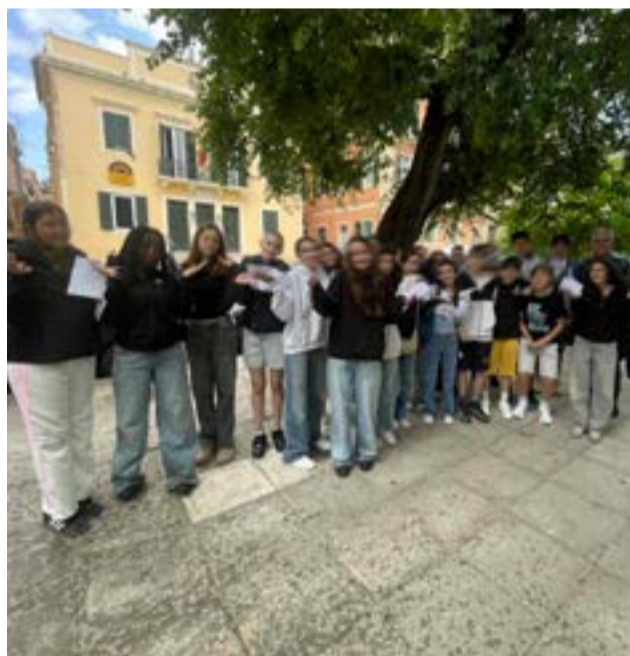
Τα παιδιά ξεναγήθηκαν σε ιστορικά σημεία και πολιτιστικούς φορείς της παλιάς πόλης της Κέρκυρας