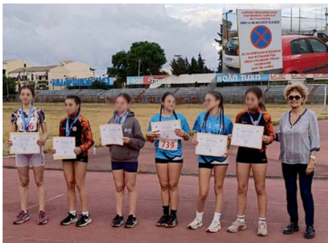
ΤΕ ΣΕΓΑΣ ΚΕΡΚΥΡΑΣ

Παρά τις κακές συνθήκες τα παιδιά τα κατάφεραν