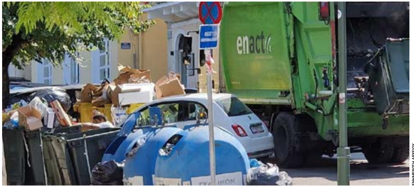
Κατά πλειοψηφία εγκρίθηκε από το Δημοτικό Συμβούλιο Κεντρικής Κέρκυρας και Διαποντίων Νήσων η επανάληψη της διαδικασίας για τη «θεραπεία τυπικής πλημμέλειας» της απόφασης αύξησης των ανταποδοτικών τελών καθαριότητας και ηλεκτροφωτισμού για το 2025