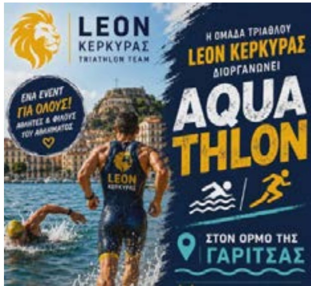
Η αφίσα του αγώνα