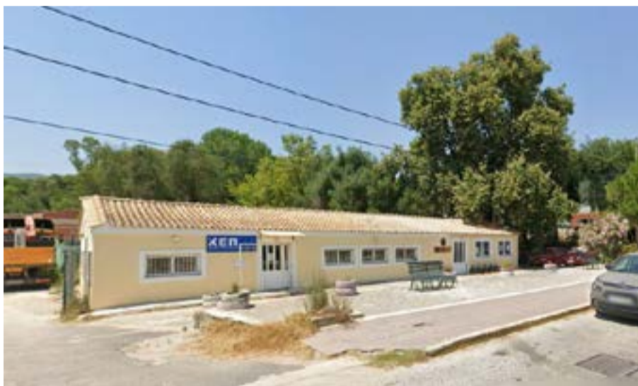
Στον ίδιο χώρο βρίσκεται σήμερα το ΚΕΠ Φαιάκων

Η συνολική διάρκεια εκτέλεσης του έργου ορίζεται σε 15 μήνες. Η προθεσμία υποβολής προσφορών λήγει στις 19 Ιουνίου 2026, ενώ η ηλεκτρονική αποσφράγιση των προσφορών θα πραγματοποιηθεί στις 25 Ιουνίου.