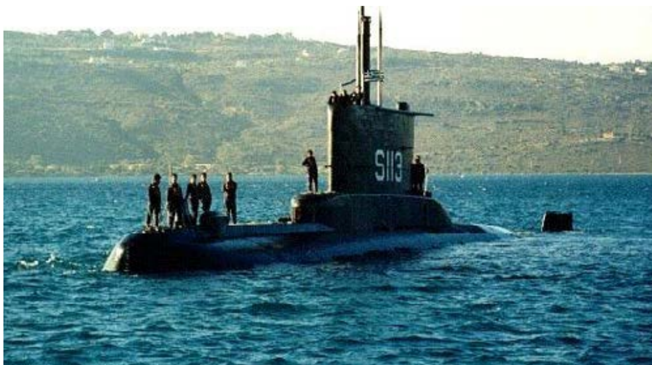
Η μουσειακή παρουσίαση του σύγχρονου «Πρωτέα» αναβιώνει παράλληλα τη μνήμη του ιστορικού υποβρυχίου του 1940, που χάθηκε σε πολεμική αποστολή κοντά στην Κέρκυρα κατά τον ελληνοϊταλικό πόλεμο.