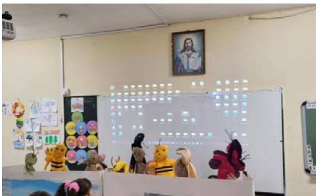
Η παράσταση ενθουσίασε τα παιδιά