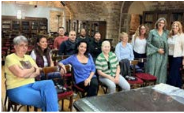
Από τη δράση στη Δημόσια Κεντρική Ιστορική Βιβλιοθήκη