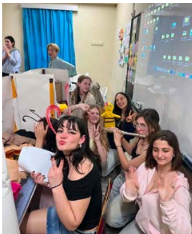
Τα παιδιά του 1ου ΓΕΛ Κέρκυρας, παρουσίασαν μια εξαιρετική παράσταση κουκλοθεάτρου