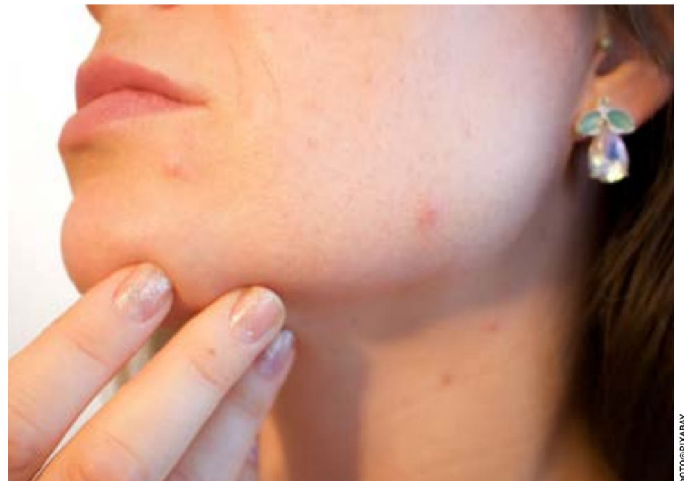
Οι εξετάσεις γίνονται με ραντεβού

Ίσως τελικά οι εθνικές επέτειοι να λένε συχνά λιγότερα για το παρελθόν και περισσότερα για το παρόν. Και η πιο έντιμη προσέγγιση στην ιστορία να είναι η επίγνωση ότι, κάθε φορά που τη γιορτάζουμε, μιλάμε ταυτόχρονα για εκείνη την εποχή – αλλά και για την τωρινή.