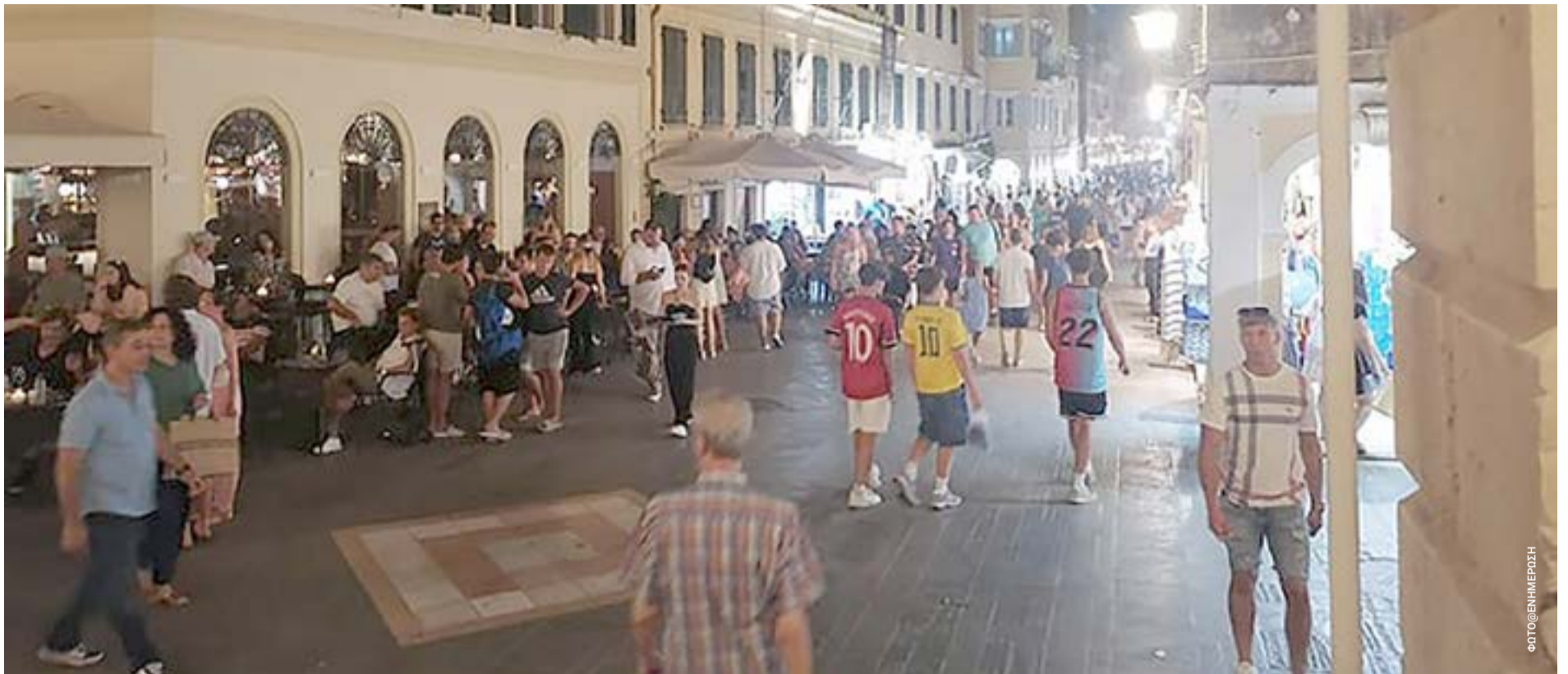
Εστίαση, κάτοικοι και τοπική οικονομία σε αναζήτηση νέας ισορροπίας για την επόμενη μέρα της Κέρκυρας.