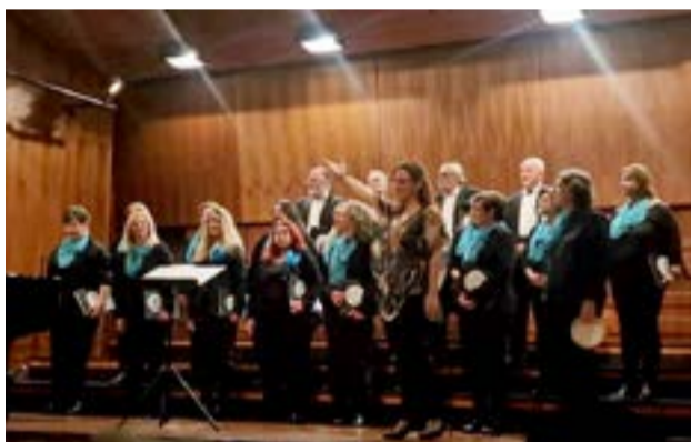
Η Χορωδία Μπενιτσών Il Canto