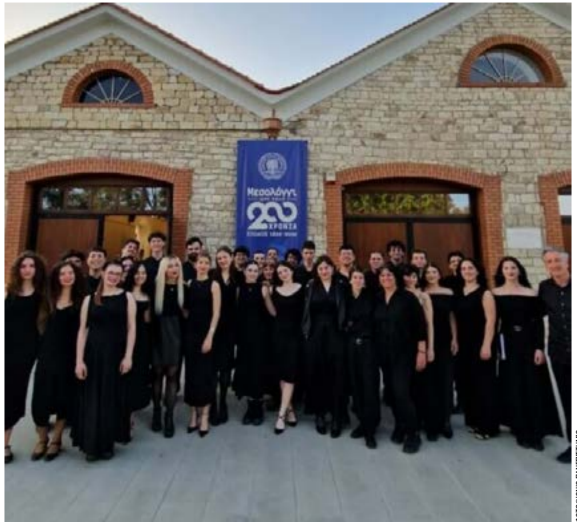
Το φωνητικό σύνολο του τμήματος Μουσικών Σπουδών του Ιονίου