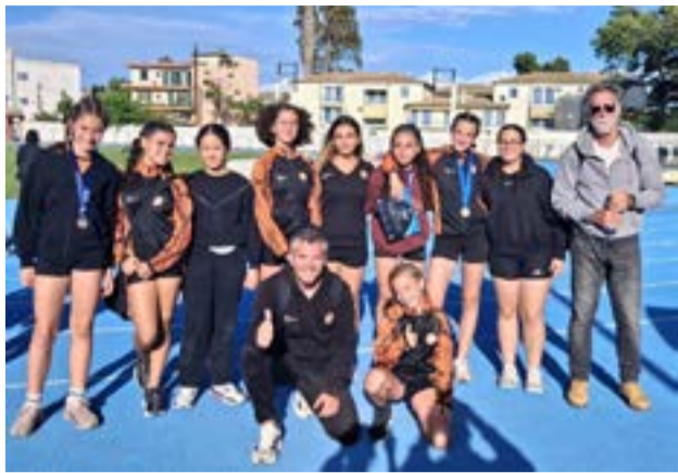
Η αποστολή της ΓΕ Θιναλίου στη Λευκάδα