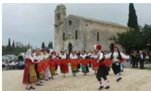
Απόψς στην πλατεία του χωριού