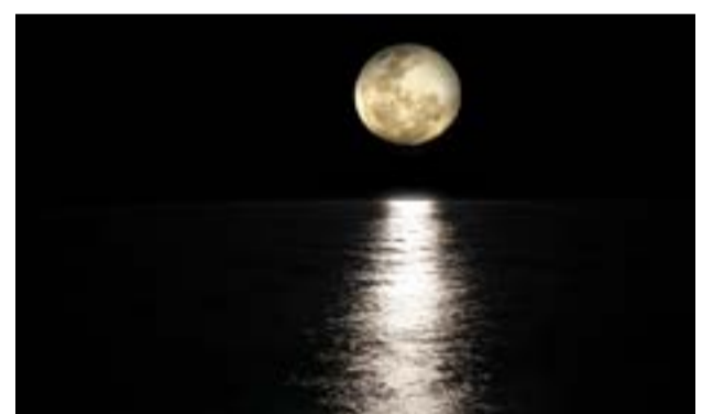
Σε περίπτωση συννεφιάς η εκδήλωση θα ματαιωθεί