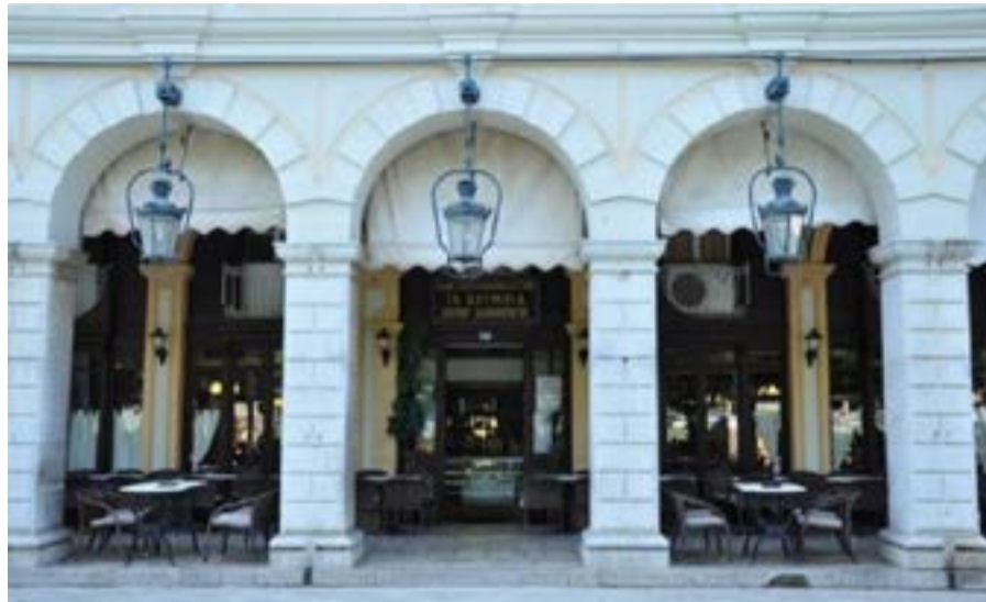
Ξεπεράστηκαν οι γραφειοκρατικές δυσκολίες

Η διεύθυνση της επιχείρησης σημειώνει ότι η διαδικασία αυτή έγινε με γνώμονα το ενδιαφέρον για την προστασία του ιστορικού αυτού χώρου της πόλης και εκφράζει την ελπίδα για μια μελλοντική συνεργασία με την Εφορεία Αρχαιοτήτων, έχοντας ως κοινό στόχο την ανάδειξη και αναβίωση του σημείου. Παράλληλα, τονίζει