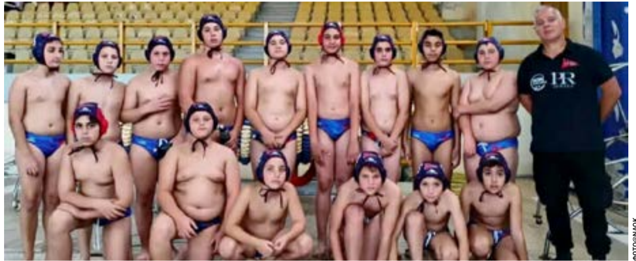
Η ομάδα Κ-14 του ΝΑΟΚ

Οκτάλεπτα: 0-8, 0-1 (0-9 ημίχρονο), 2-3, 1-4 (3-