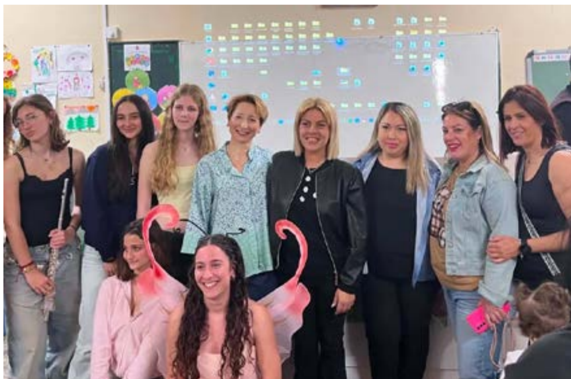
Ο Σύλλογος Γονέων και Κηδεμόνων εκφράζει τις θερμές του ευχαριστίες σε όλους όσοι παρευρέθηκαν και αγκάλιασαν με την παρουσία τους αυτή την όμορφη προσπάθεια.