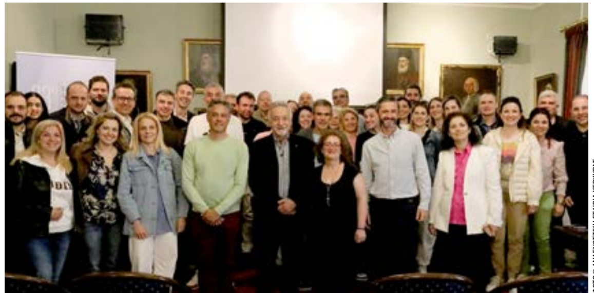
Οι οδοντίατροι που συμμετείχαν στη σύνοδο

ΚΕΡΚΥΡΑ. Η Χορωδία Μπενιτσών "Il Canto" παρουσιάζει την 4η Συνάντηση Χορωδιών "Μαζί Τραγουδάμε". Συμμετέχουν οι Χορωδίες: Πολιτιστικού Συλλόγου Κασσιόπης, Κοντοκαλιού, "ΔΗΜΟΔΟΚΟΣ", Ερεσού, Λέσβου "ΜΕΛΙΡΡΥΤΟΣ", Μπενιτσών "IL CANTO". Συμμετέχει η Κερκυραϊκή Μαντολινάτα. Σάββατο 30 Μαΐου 2026, 19:00 στη Μαρίνα Μπενιτσών. Είσοδος ελεύθερη.