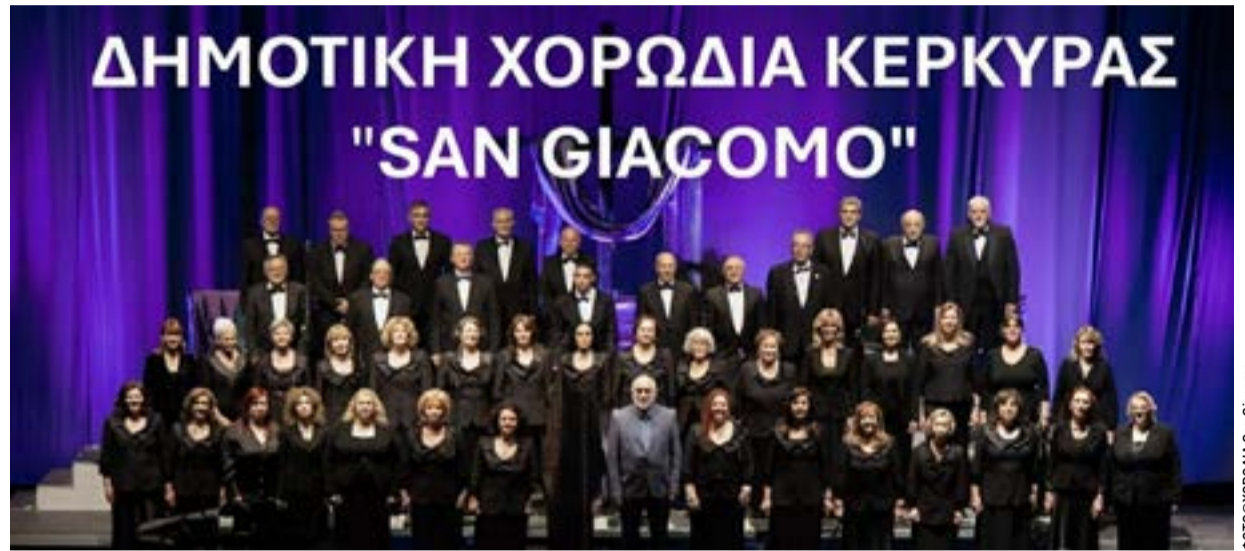
Στο αφιέρωμα συμμετέχει και η Δημοτική Χορωδία San Giacomo