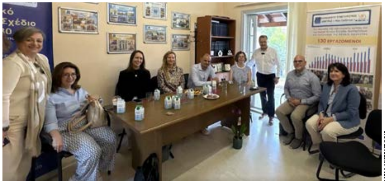
Στα γραφεία διοίκησης του ΚΟΙΣΠΕ

νοι επισκέφθηκαν επιχειρηματικές δραστηριότητες και κοινωνικές δομές του Κοι.Σ.Π.Ε. Κέρκυρας, μεταξύ των οποίων τα Γραφεία Διοίκησης, οι δομές βασικών αγαθών, τα Κοινωνικά Παντοπωλεία και Συσσίτια, η Cafeteria Lunatico, οι υπηρεσίες στάθμευσης, καθώς και το Περιβαλλοντικό Πάρκο με τα θερμοκήπια και τις υπαίθριες καλλιέργειες. Στο πλαίσιο του προγράμματος πραγματοποιήθηκαν επίσης εθιμοτυπικές συναντήσεις με τον Δήμαρχο Κεντρικής Κέρκυρας και Διαποντίων Νήσων, καθώς και με τον Πρύτανη του Ιονίου Πανεπιστημίου.