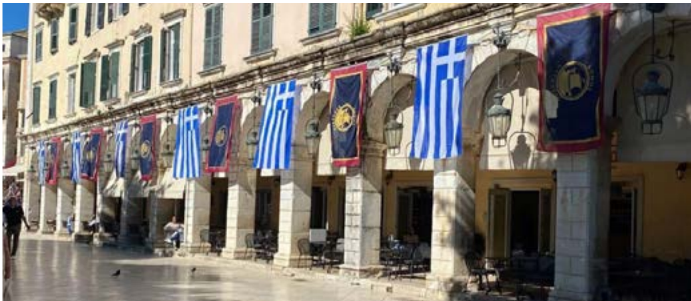
Σημαιοστολισμένο το Λιστόν για τις γιορτές της επετείου της Ένωσης.