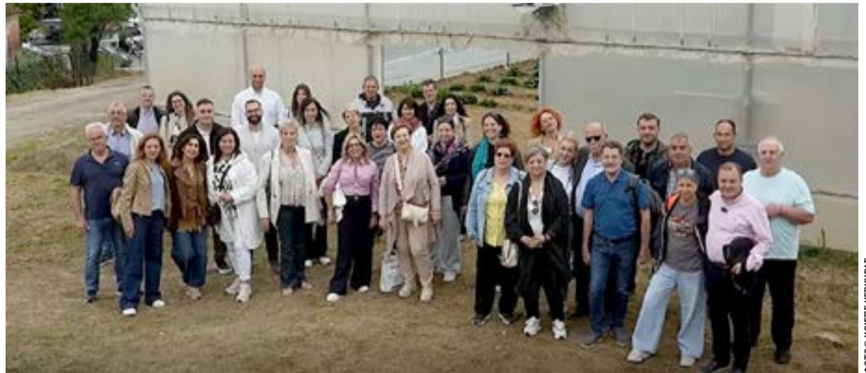
Από την επίσκεψη των προσκεκλημένων στις επιχειρηματικές δραστηριότητες και κοινωνικές δομές του Κοι.Σ.Π.Ε.

Το Σάββατο 16 Μαΐου 2026, οι προσκεκλημέ-