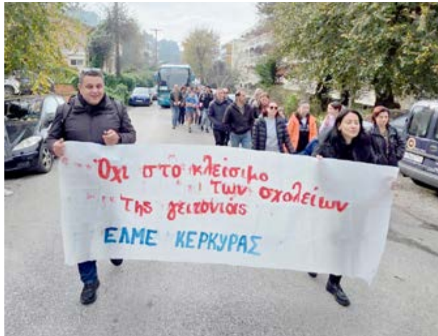
Από διαμαρτυρία της ΕΛΜΕ

Στην ανακοίνωση της τονίζει ακόμα: «Με δημόσιες δηλώσεις και αναφορές της για τη λεγόμενη «Εταιρική Κοινωνική Ευθύνη» της Digea, η Διευθύντρια Δευτεροβάθμιας Εκπαίδευσης δεν περιορίστηκε καν στην περιοχή ευθύνης της. Προχώρησε σε αναλυτική αναφορά στη δράση της εταιρείας σε διάφορες περιοχές της χώρας, παρουσιάζοντας μία προς μία τις παρεμβάσεις της, σαν να ήταν στέλεχος επικοινωνίας, υπεύθυνη δημοσί-