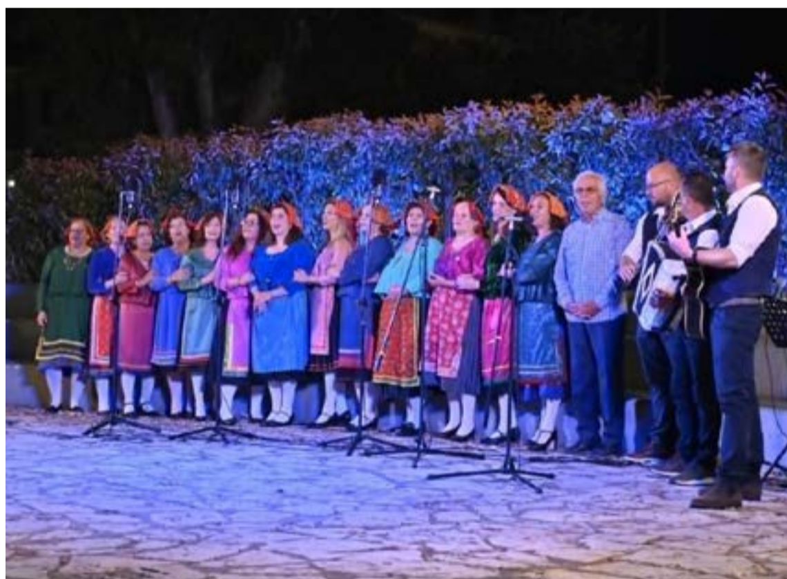
Η Πολυφωνική Γυναικεία Χορωδία Κάτω Γαρούνα μάγεψε με τις ερμηνείες της