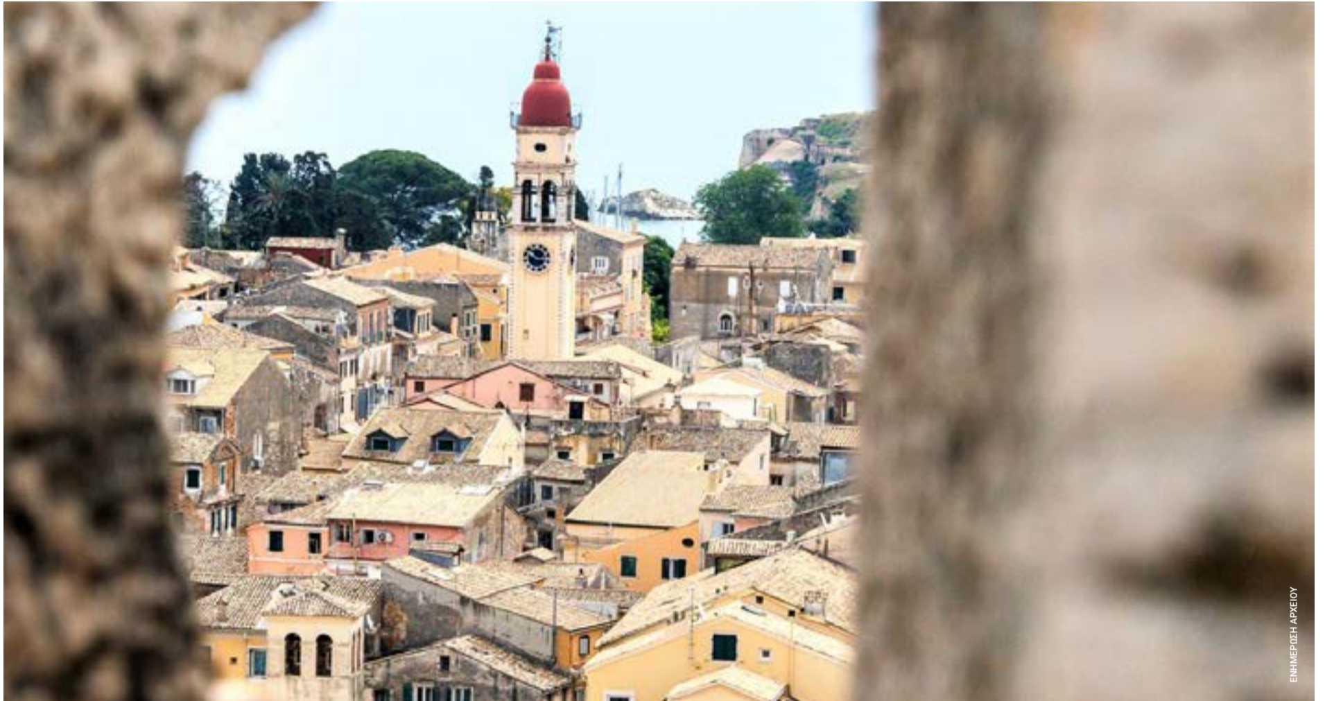
Η παλιά πόλη της Κέρκυρας. Η συζήτηση για τον ρόλο των κοινοτήτων επαναφέρει το ερώτημα αν η αυτοδιοίκηση μπορεί να επιστρέψει πιο κοντά στους κατοίκους και στις τοπικές κοινωνίες.