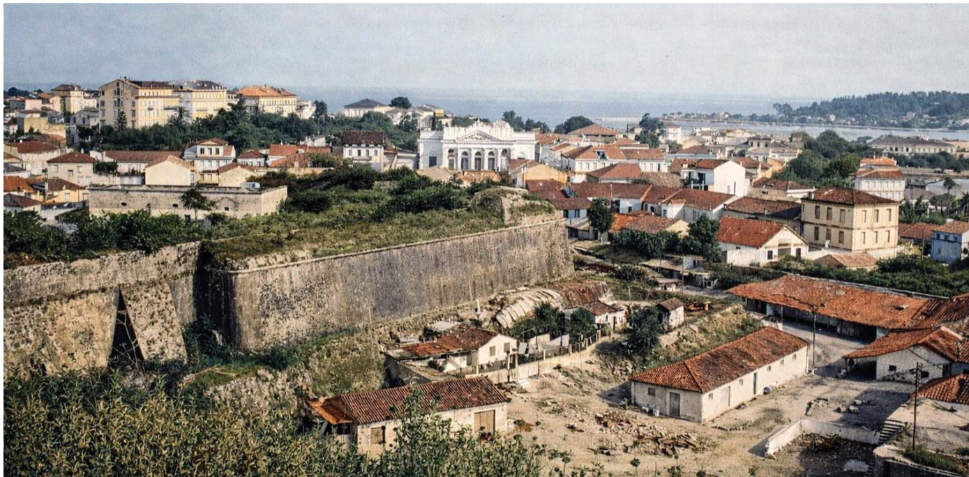
ΑΡΧΕΙΟ ΣΤΑΜΑΤΗ ΚΑΤΑΠΟΔΗ