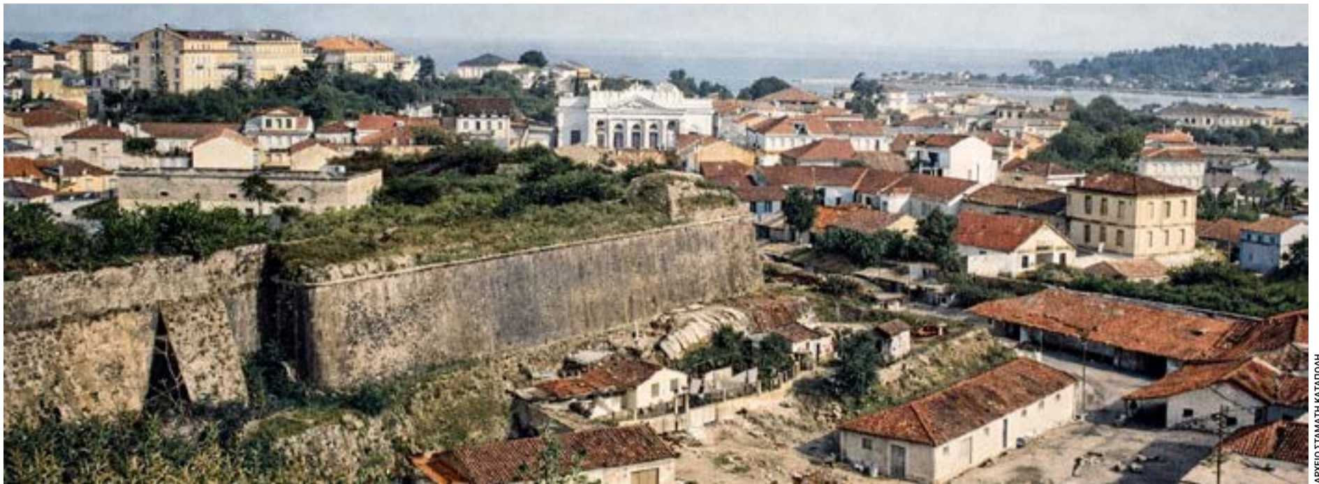
Το προπολεμικό Δημοτικό Θέατρο, εμπνευσμένο από τη Σκάλα του Μιλάνου, καταστράφηκε στους βομβαρδισμούς του 1943. Για πολλούς Κερκυραίους, η απώλειά του παραμένει ανοιχτό πολιτιστικό τραύμα και σημείο αναφοράς στη συζήτηση για την ταυτότητα της πόλης.