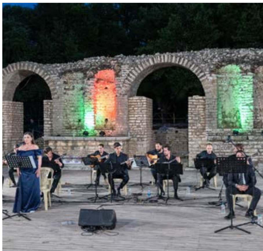
Η σολίστ Έλενα Ρίστοβα