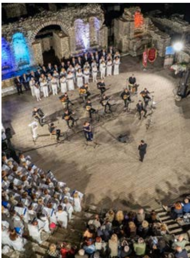
Κοινό και καλλιτέχνες στον όμορφα φωτισμένο αρχαιολογικό χώρο