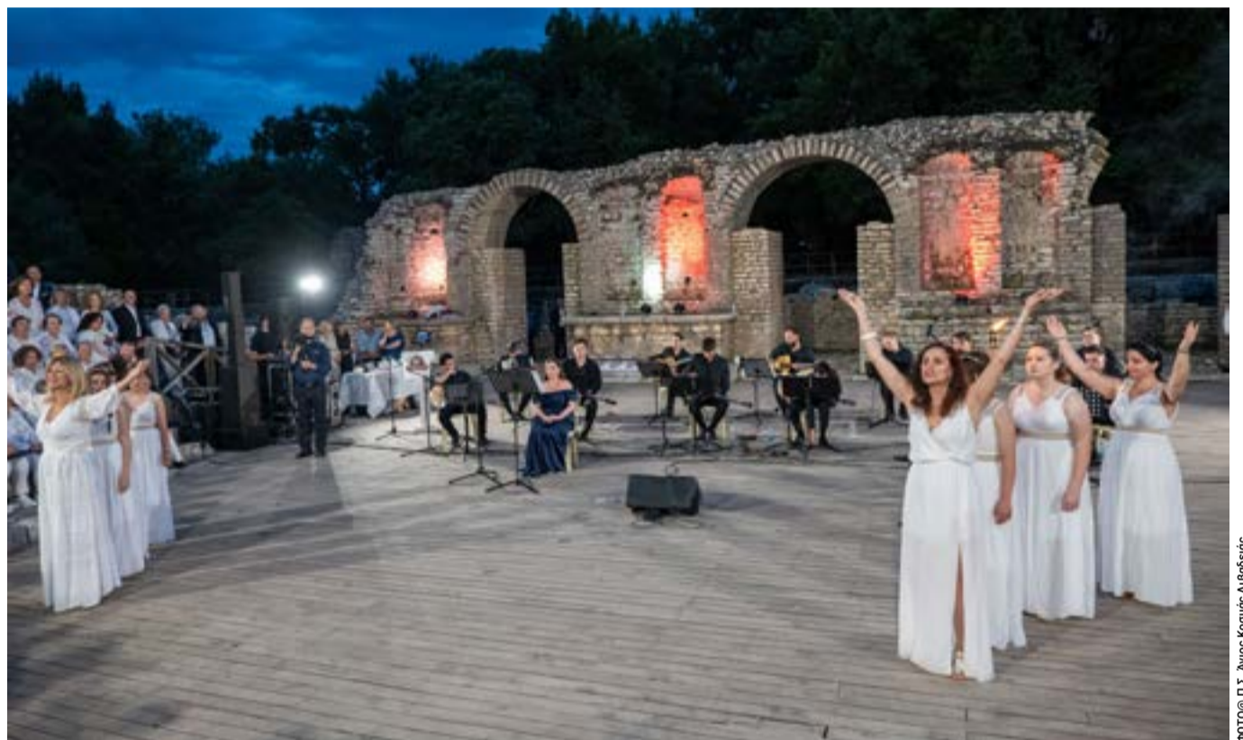
Μια βραδιά που δεν ήταν απλώς συναυλία, αλλά ήταν ένα ταξίδι ψυχής, ένας φόρος τιμής στον μεγάλο δημιουργό