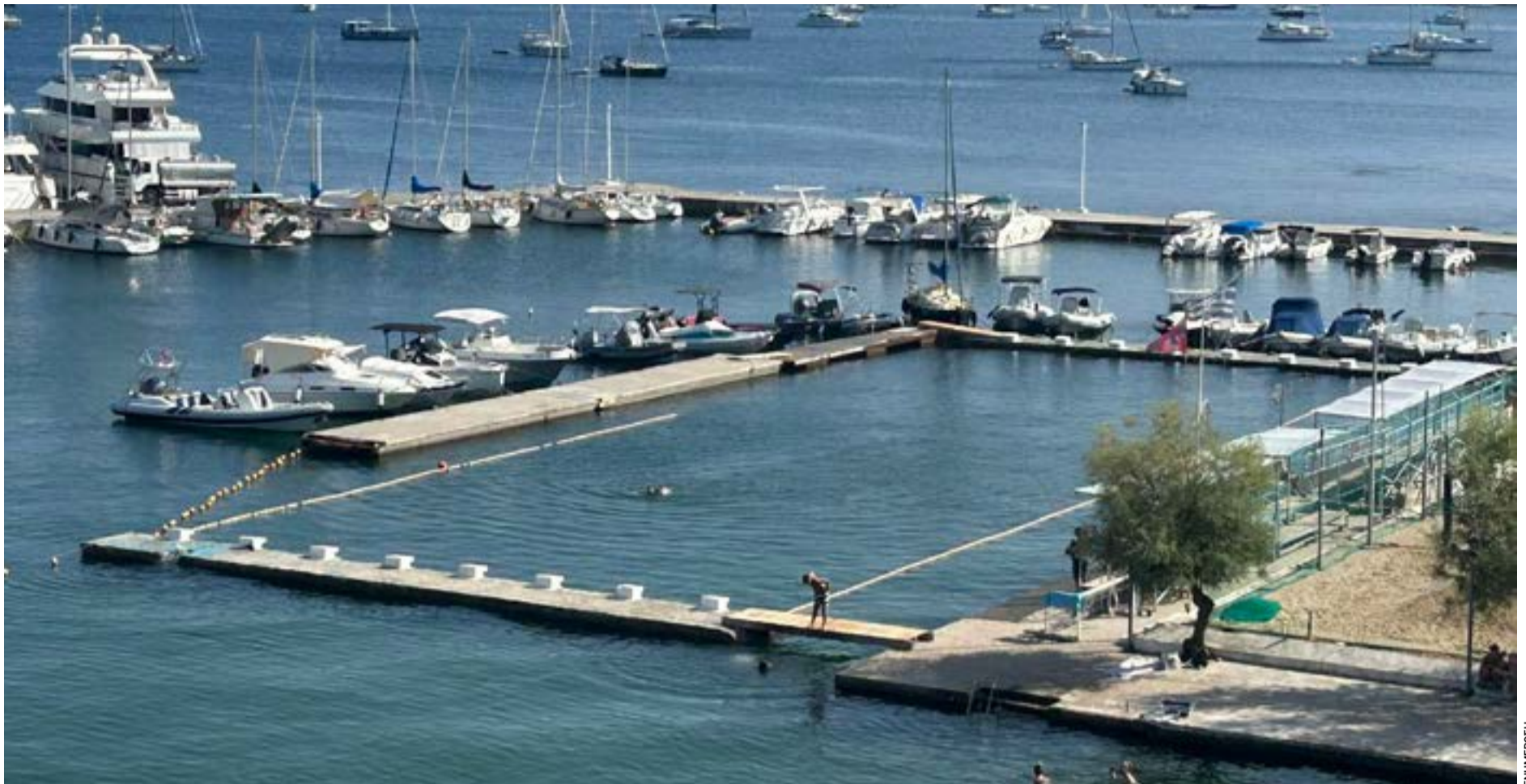
Ο χώρος του ΝΑΟΚ, όπου σχεδιάζεται η κατασκευή του νέου κολυμβητηρίου. Μετά την έγκριση του ΚΑΣ, το έργο εισέρχεται σε φάση αδειοδοτήσεων, μελετών και διοικητικών διαδικασιών πριν από ενδεχόμενη δημοπράτηση.