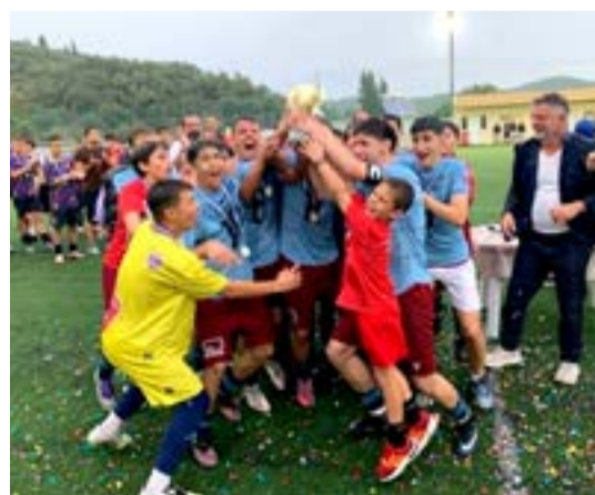
Πανηγύρι για τους πρωταθλητές

ΚΕΡΚΥΡΑ. Στο γήπεδο των Νυμφών έγινε προχθές ο τελικός του πρωταθλήματος Κ15 της Ένωσης ανάμεσα στην Θύελλα (Ακαδημία Ολύμπου) και τον ΠΑΟ Σφακιανάκη. Σε μια εξαιρετική ατμόσφαιρα που δημιούργησαν οι φίλοι των δυο ομάδων