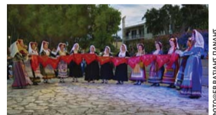
ΦΩΤΟ @ FB ΒΑΣΙΛΗΣ ΠΑΝΔΗΣ