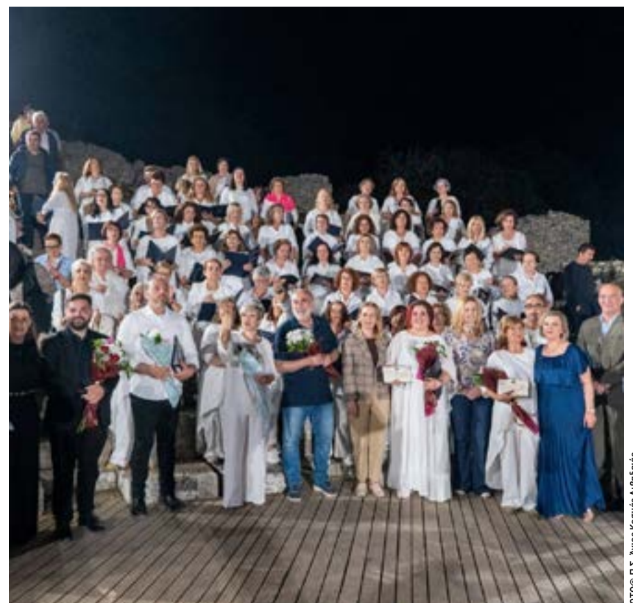
Θερό χαιρεκρότημα στους συντελεστές της βραδιάς