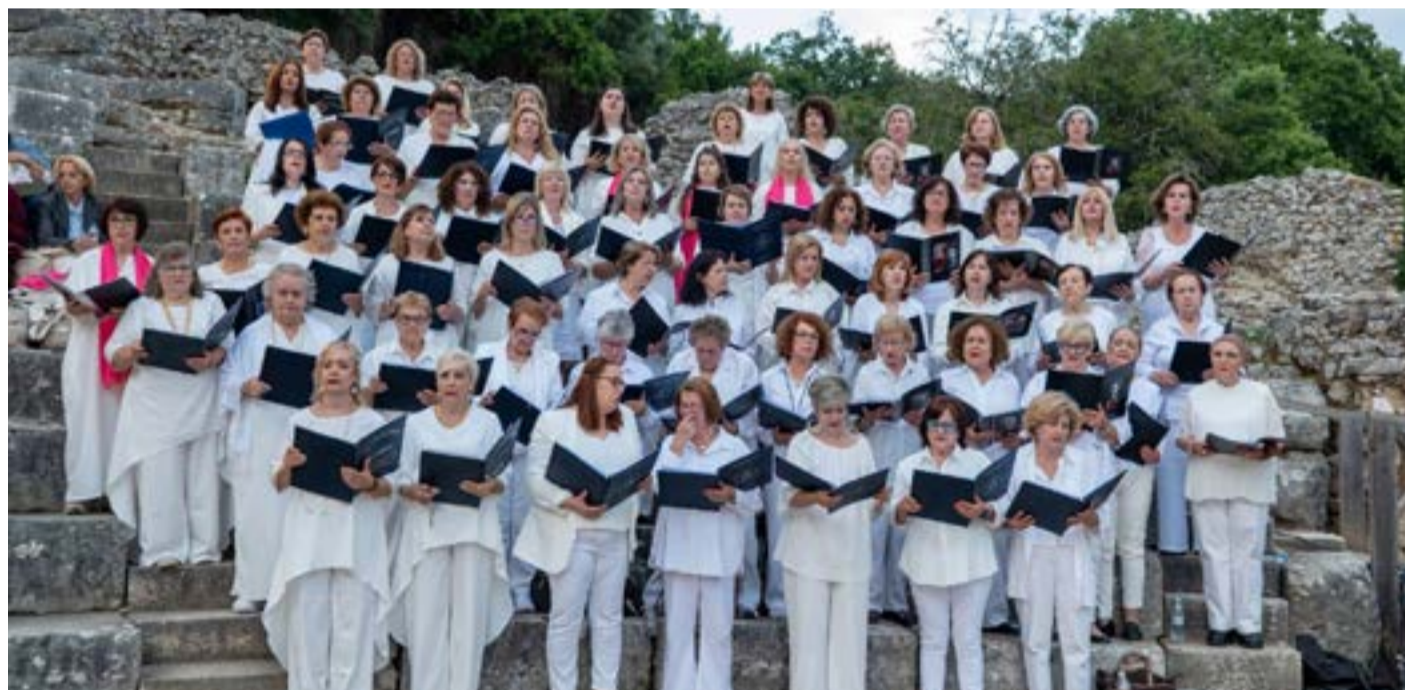
Τέσσερις χορωδίες από Κέρκυρα και Καστοριά ένωσαν τις φωνές τους και χάρισαν στο κοινό στιγμές βαθιάς συγκίνησης