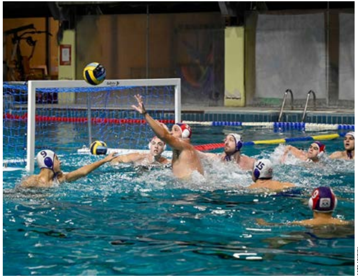
Ψηλά το κεφάλι και σχεδιασμός της νέας χρονιάς