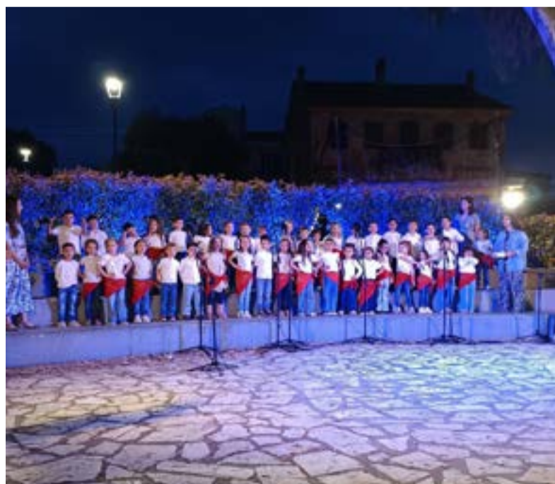
Τα παιδιά του Νηπιαγωγείου Κοινοπιστών έκλεψαν τις εντυπώσεις