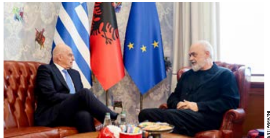
Αυτό το στιγμιότυπο ανάρτησε στον λογαριασμό του στο φ/β ο πρωθυπουργός της Αλβανίας Εντι Ράμα. Το μοναδικό και στον Τύπο, μέχρι τουλάχιστον αργά το απόγευμα της Δευτέρας.

Το παράδοξο είναι ότι ένα τέτοιο μοντέλο σπανίως ζητείται με επιμονή. Ίσως επειδή το πολιτικό σύστημα έχει μάθει να λειτουργεί γύρω από πρόσωπα και όχι γύρω από θεσμούς. Ίσως επειδή η συγκέντρωση εξουσίας είναι πιο διαχειρίσιμη. Ίσως επειδή οι πολίτες, έπειτα από χρόνια απογοήτευσης, αντιμετωπίζουν τον δήμο ως πάροχο υπηρεσιών και όχι ως κοινό πεδίο ευθύνης. Ή ίσως επειδή η συλλογική ισχύς δεν παράγει εύκολα πολιτική προβολή.