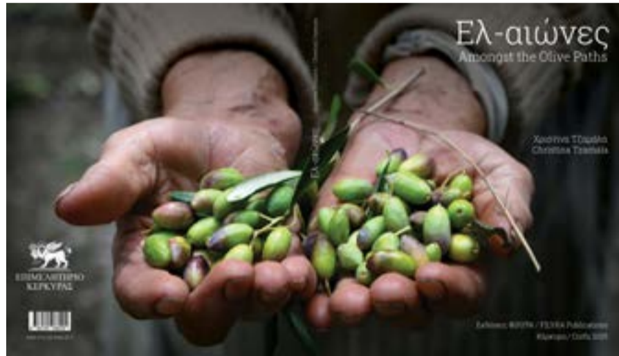
Το εξώφυλλο της έκδοσης

Οι Ελ-αιώνες της Χριστίνας Τζαμάλα είναι ένα σύνθετο αφι-