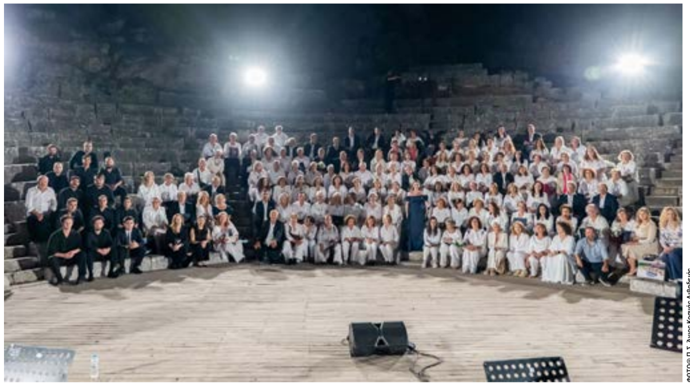
Οι καλλιτέχνες στον αρχαιολογικό χώρο του Βουθρωτού, που έχει χαρακτηριστεί μνημείο Παγκόσμιας Κληρονομιάς