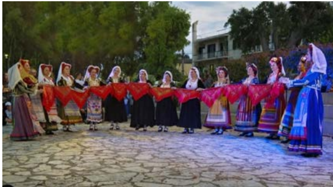
Το Λύκειο Ελληνίδων Κέρκυρας (Παράρτημα Κέρκυρας), χόρεψε παραδοσιακούς χορούς

Μια μαγική βραδιά αφιερωμένη στα παραδοσιακά τραγούδια και τους χορούς της Κέρκυρας