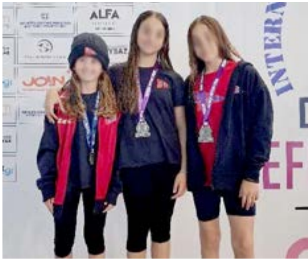
Εντυπωσιακή παρουσία των παιδιών του ΝΑΟΚ