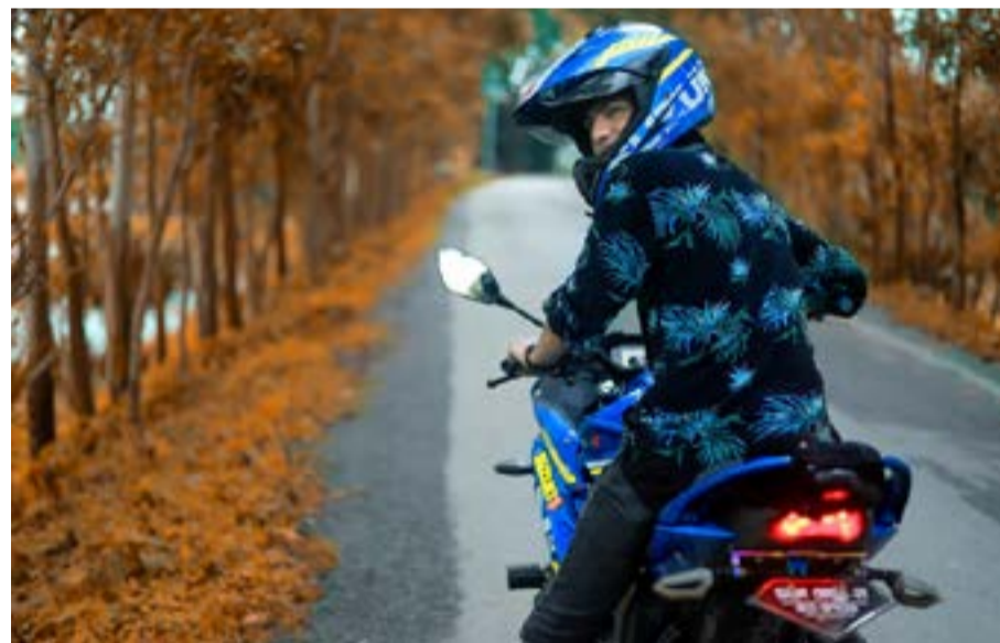
Η Τροχαία υπενθυμίζει ότι να πρόστιμα είναι τσουχγτερά τόσο για οδηγούς, όσο και για επιβάτες

προσέφερε έναν εξοπλισμό σε ένα ή δύο σχολεία. Το ζήτημα είναι ποιος έχει την ευθύνη για να έχουν όλα τα σχολεία τον αναγκαίο εξοπλισμό. Και η απάντηση είναι μία: την ευθύνη την έχει το κράτος. Οι λεγόμενες «χορηγίες» και οι δράσεις «Εταιρικής Κοινωνικής Ευθύνης» είναι αποσπασματικές. Αφορούν ελάχιστα και επιλεγμένα σχολεία. Δεν καλύπτουν τις συνολικές ανάγκες της δημόσιας εκπαίδευσης. Δεν λύνουν το πρόβλημα των κτιριακών ελλείψεων, της υποχρηματοδότησης, της έλλειψης τεχνολογικού εξοπλισμού, της απουσίας σύγχρονων και ασφαλών υποδομών. Αντίθετα, λειτουργούν ως άλλοθι για το κράτος, που έχει συνειδητά αφήσει τα σχολεία με κενά, ελλείψεις και επικίνδυνες εγκαταστάσεις. Αυτό ακριβώς είναι το πραγματικό περιεχόμενο της «Εταιρικής Κοινωνικής Ευθύνης».