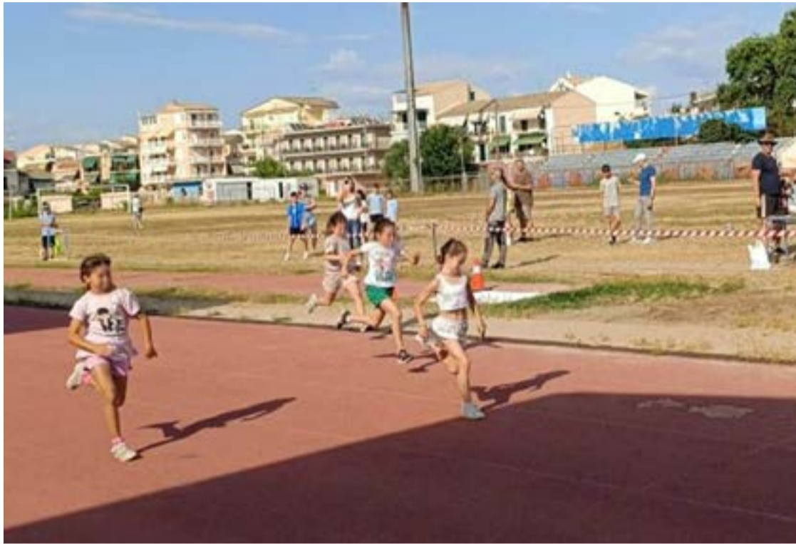
Εντυπωσιακός τερματισμός στο σπριν κοριτσιών