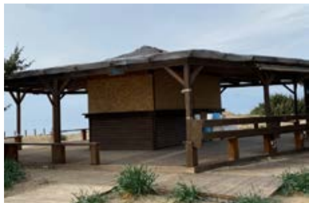
Φωτογραφία της καντίνας του Χαλικούνα, που έδωσε στη δημοσιότητα ο Σύλλογος