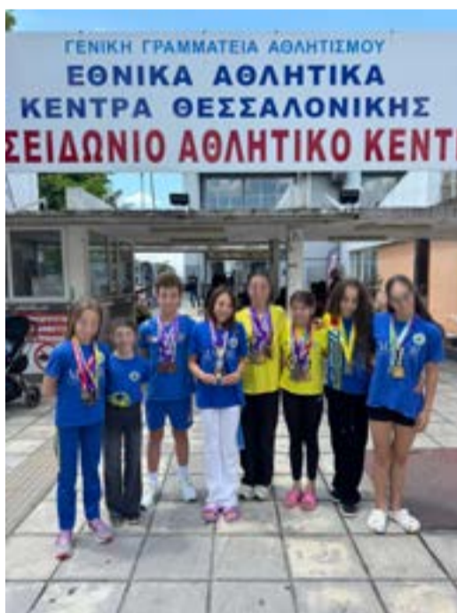
Η ομάδα του Ναυσίθου μετά το τέλος των αγώνων