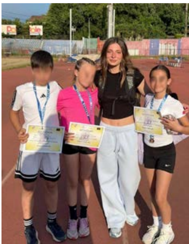
Χαμόγελα στις απονομές