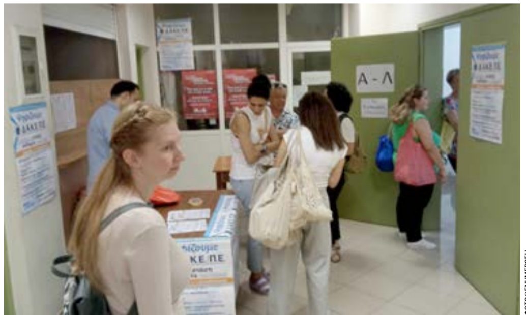
Από παλαιότερες εκλογές στον ΣΕΠΕ

Το ζητούμενο, λοιπόν, δεν είναι αν η Κέρκυρα θα δεχτεί περισσότερους ή λιγότερους επισκέπτες. Είναι αν θα γνωρίζει εγκαίρως πότε η πίεση γίνεται υπερβολική και πώς θα αντιδρά πριν η διαχείριση μετατραπεί σε κρίση. Για να συμβεί αυτό, η μέτρηση δεν είναι πολυτέλεια. Είναι η αρχή.