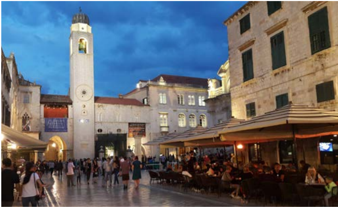
Η ιστορική πόλη χρησιμοποιείται ως ευρωπαϊκό παράδειγμα διαχείρισης υπερτουρισμού, με εργαλεία παρακολούθησης της πυκνότητας επισκεπτών και των ροών κρουαζιέρας για τον έλεγχο της πίεσης στις υποδομές και τον δημόσιο χώρο.