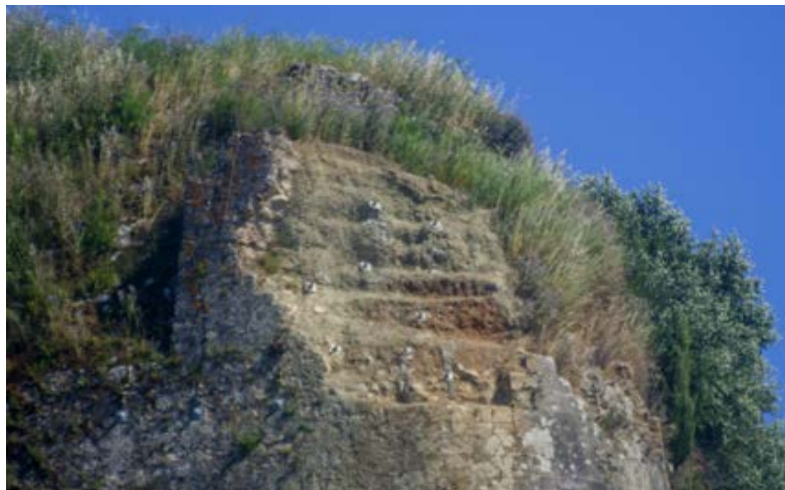
Από την καταγγελία για την πτώση του ανώτερου τμήματος της αιχμής του βόρειου ημιπρομαχώνα.

Μάταια όμως! Κάθε χρόνο «στο ίδιο έργο θεατές»! Η μοναδική Υπηρεσία που έδειχνε κατανόηση και προσπαθούσε να βοηθήσει ήταν η Διεύθυνση Δασών Κέρκυρας.