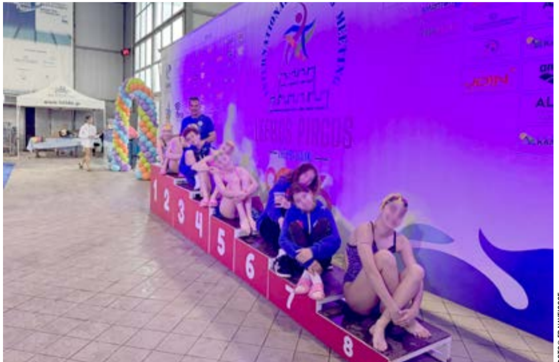
Χαμόγελα μετά τη μεγάλη επιτυχία του συλλόγου

Σημείωση για τη δημοσίευση φωτογραφικού υλικού: Όλες οι φωτογραφίες που απεικονίζουν αθλήτριες και αθλητές, δημοσιεύονται κατόπιν συγκατάθεσης των γονέων/κηδεμόνων τους και του αθλητικού σωματείου "Ναυσίθους" Κέρκυρας.