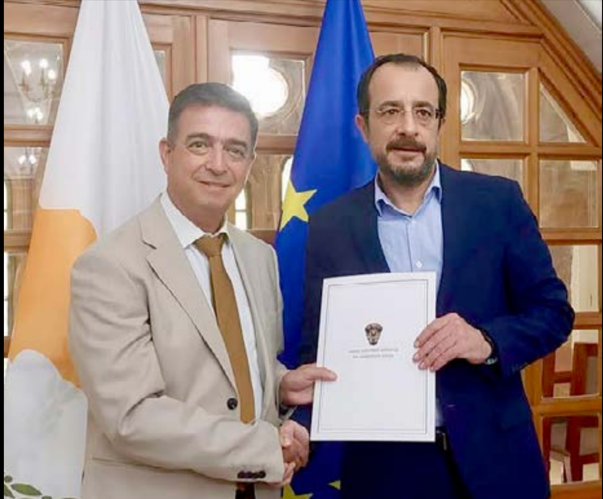
Με τον πρόεδρο της Κυπριακής Δημοκρατίας, κ. Νίκο Χριστοδουλίδη.

Ιδιαίτερη βαρύτητα δίνει στον διαχωρισμό αρμοδιοτήτων, προτείνοντας ο δήμαρχος να ασκεί αποκλειστικά τα καθήκοντά του και να μην αναλαμβάνει παράλληλες θέσεις προέδρου σε δημοτικές επιχειρήσεις, ενώσεις δήμων ή ιδρύματα.