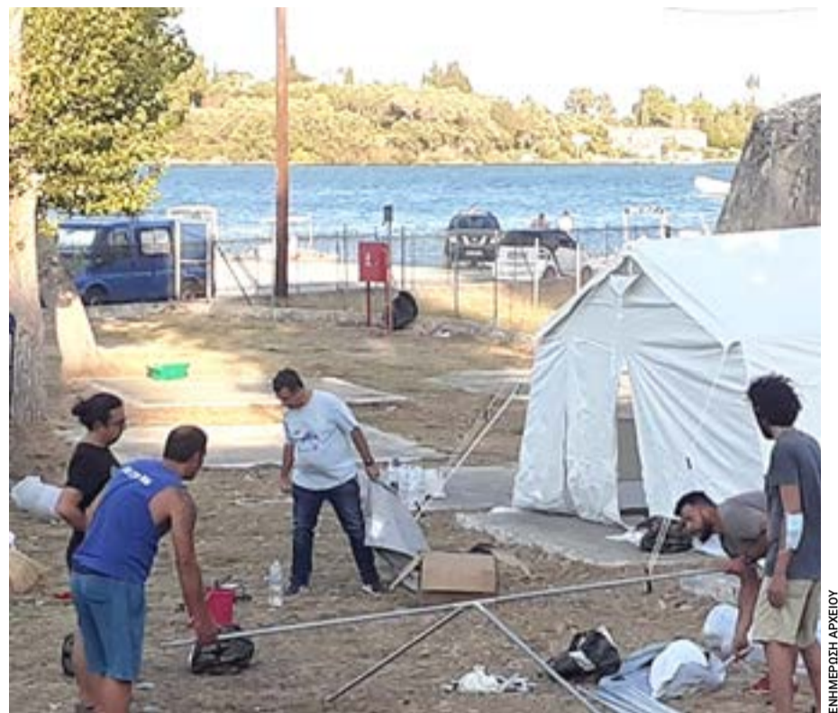
Παιδικές κατασκηνώσεις στα Γουβιά.

ακόμη η λειτουργία των παιδικών κατασκηνώσεων «Σταμάτιος Δεσύλλας» στα Γουβιά για το καλοκαίρι του 2026, η έγκριση επιχειρησιακού σχεδίου για τη διαχείριση αδέσποτων ζώων, η παραχώρηση δημοτικών χώρων και ακινήτων, καθώς και διαδικασίες εκμίσθωσης ή αξιοποίησης δημοτικής περιουσίας.