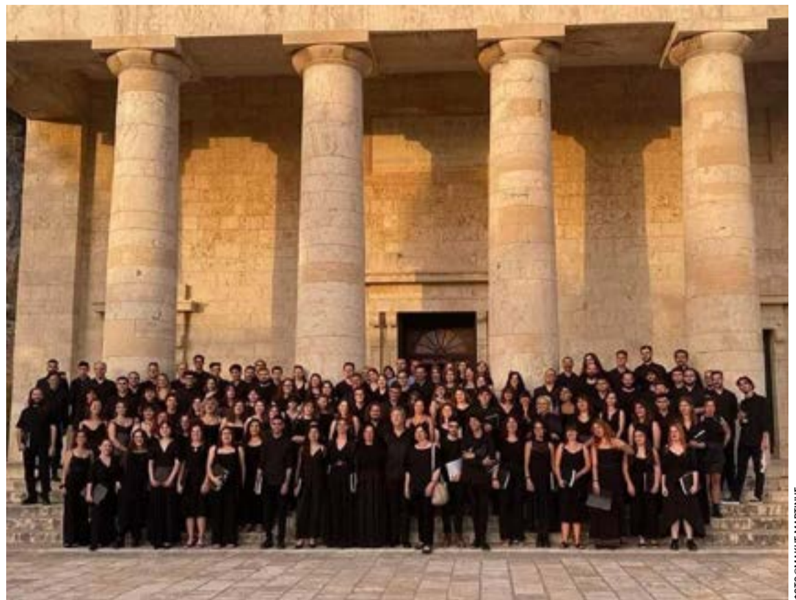
Η Χορωδία του Τμήματος Μουσικών Σπουδών του Ιονίου Πανεπιστημίου