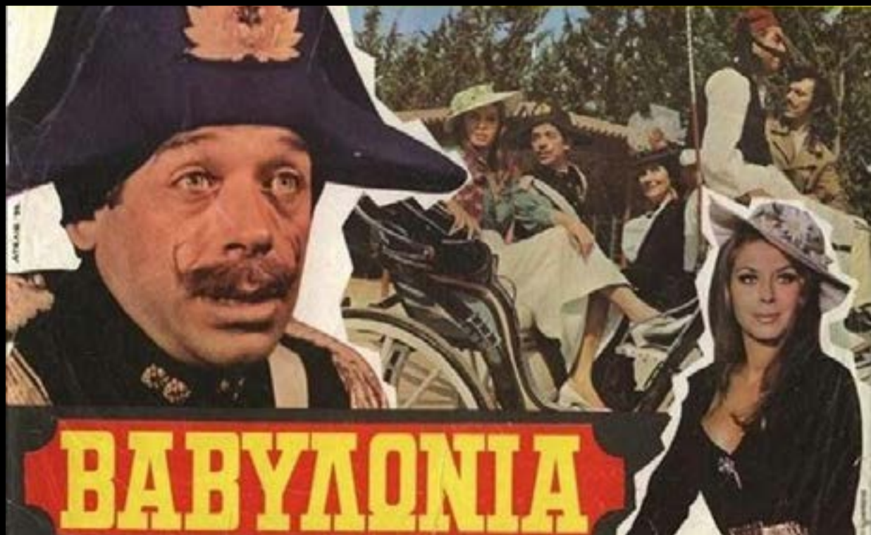
Βαβυλωνία του Βυζάντιου, η ταινία.

Το φθινόπωρο του 1901, η εφημερίδα «Ακρόπολις» άρχισε να δημοσιεύει μετάφραση του Ευαγγελίου στην δημοτική γλώσσα. Αυτό προκάλεσε τεράστιες αντιδράσεις από συντηρητικούς κύκλους, πανεπιστημιακούς, φοιτητές και την Εκκλησία, που θεωρούσαν ότι η δημοτική ήταν «κατώτερη» γλώσσα και ότι η μετάφραση απειλούσε την εθνική και θρησκευτική ενότητα. Τον Νοέμβριο του 1901 έγιναν μεγάλες διαδηλώσεις στην Αθήνα. Οι συγκρούσεις μεταξύ διαδηλωτών και στρατού-αστυνομίας εξελίχθηκαν βίαια και υπήρξαν νεκροί και τραυματίες. Τα γεγονότα έμειναν γνωστά ως «Ευαγγελικά». Τα Ευαγγελικά