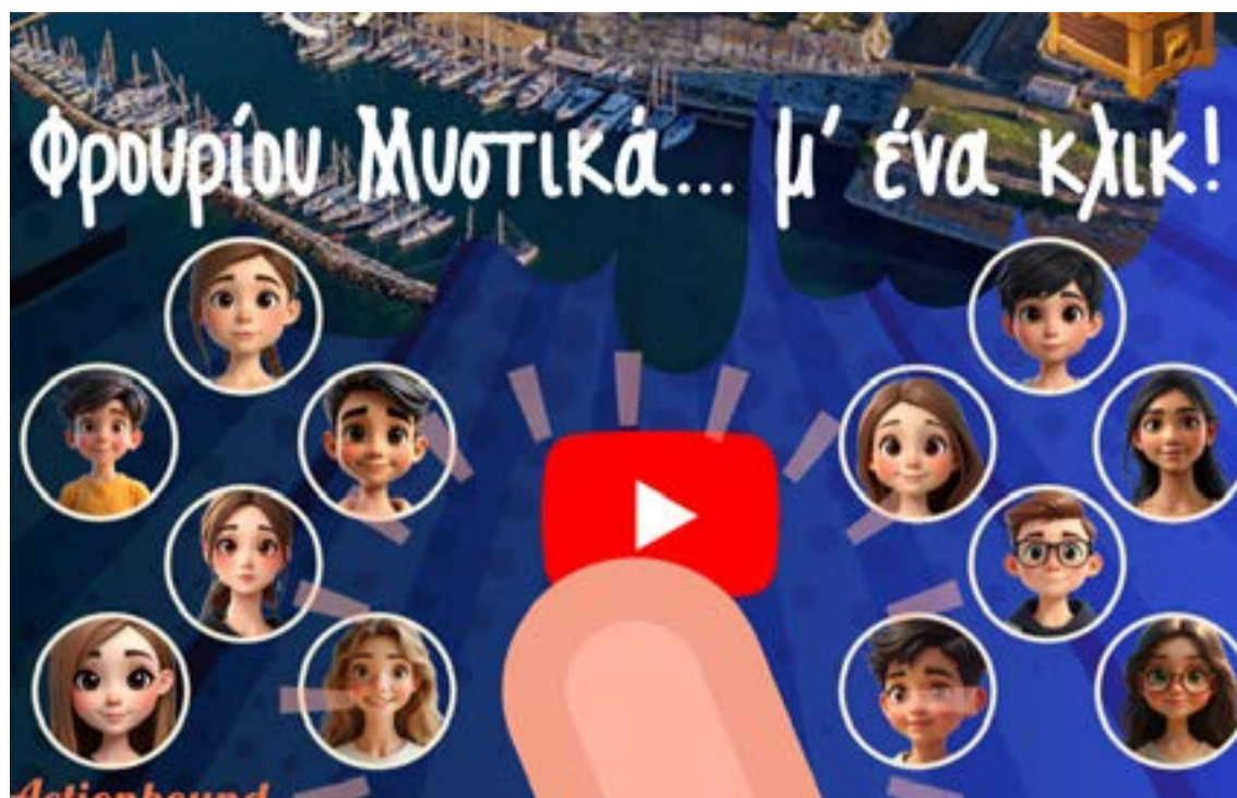
Η αφίσα με το QR CODE της εφαρμογής

ΚΕΡΚΥΡΑ. Η 12 η Συνάντηση Χορωδιών θα πραγματοποιηθεί στους Αργυράδες, την Παραμονή Αγίου Πνεύματος αφιερωμένη στον Γιώργο «Γάκη» Καββαδιά. Συνδιοργάνωση Περιφέρεια Ιονίων Νήσων - Πολιτιστικός Σύλλογος Αργυράδων. Την Κυριακή 31 Μαΐου και ώρα 21:00. Συμμετέχουν οι χορωδίες Αη Μαθιά, Αργυράδων, «Θωμάς Φλαγγίνης», Λευκίμης, Γυναικεία Χορωδία Κέρκυρας και η Σύμπραξη Χορωδιών Περιβολίου & Πολιτιστικού Συλλόγου Πετριτή με τη συμμετοχή της Μαντολινάτας Περιβολίου.