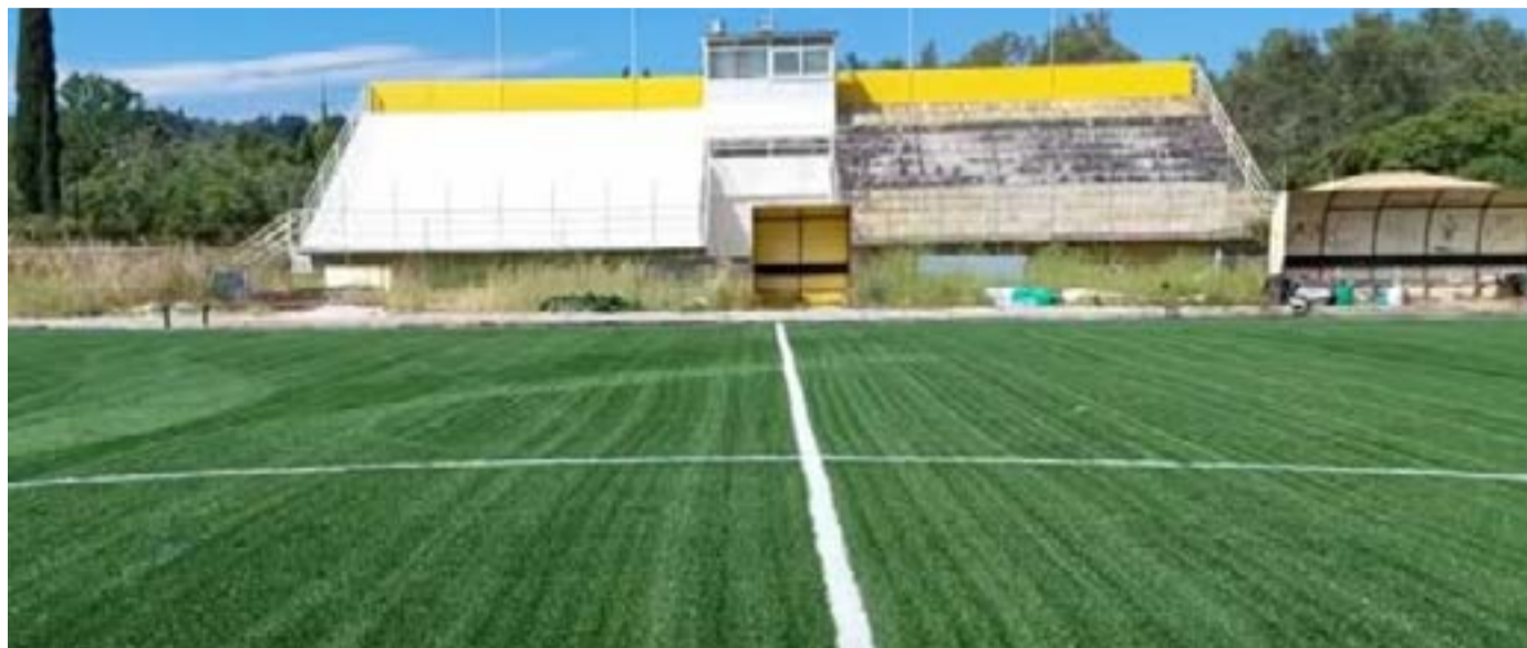
Το γήπεδο Καστελλάνων Μέσης

Πρέπει να σημειώσουμε ότι τουλάχιστον αυτό των Καστελλάνων που είναι δίπλα από τα σχολεία (Δημοτικό, Γυμνάσιο, Λύκειο), έχει όλες τις προδιαγραφές για να τοποθετηθεί και ταρτάν ώστε να μπορεί να χρησιμοποιηθεί και