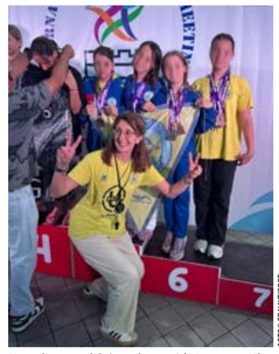
Η εμφάνιση αυτή δείχνει ότι η κολύμβηση στην Κέρκυρα έχει μέλλον