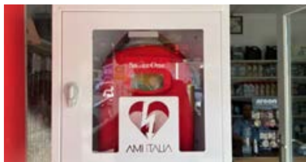
Σήμερα το απόγευμα στο Φαληράκι