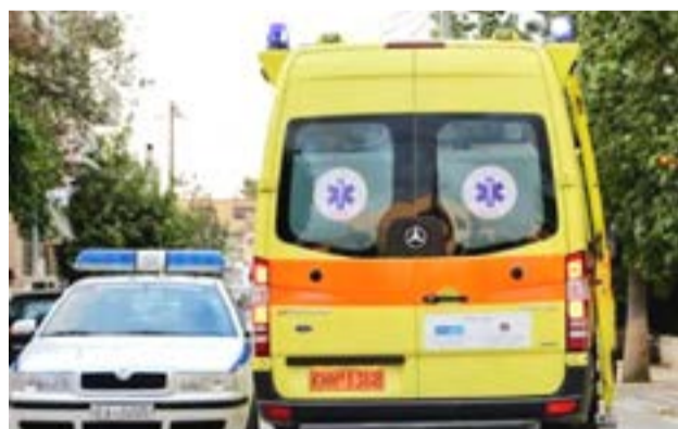
Οι συνθήκες του περιστατικού διερευνώνται

Για περισσότερες πληροφορίες και συμμετοχή στο παιχνίδι, οι ενδιαφερόμενοι μπορούν να σαρώσουν το QR code της εφαρμογής που περιλαμβάνεται στην αφίσα της δράσης.