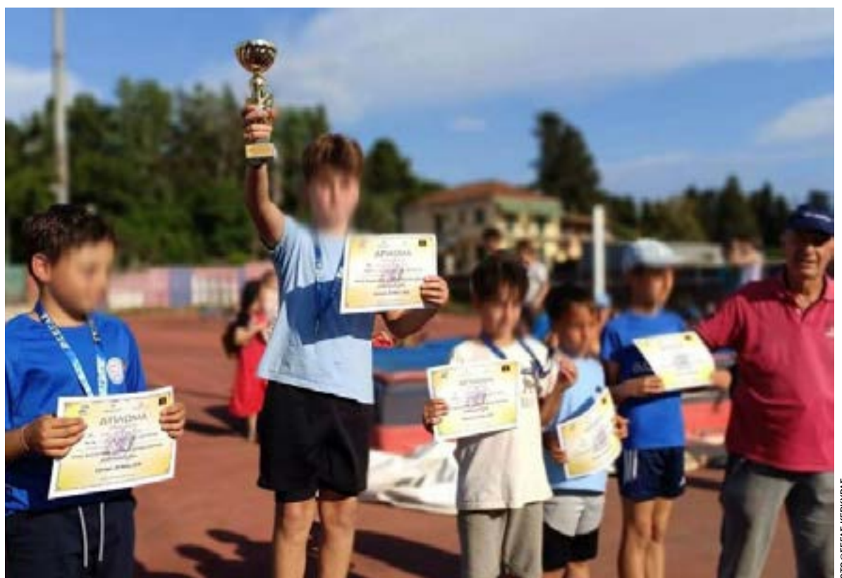
Περήφανοι οι μικροί αθλητές στο βάθρο