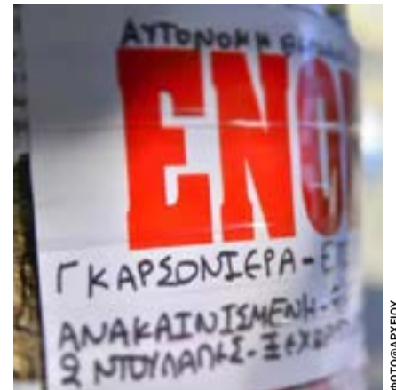
Η ενίσχυση της κοινωνικής κατοικίας μπήκε στα κριτήρια της προγραμματικής στόχευσης.

Η εικόνα παραπέμπει περισσότερο σε ένα πολυετές σύστημα συνεχούς παρακολούθησης, συνδεδεμένο με τις πολιτικές βιωσιμότητας του Υπουργείου Τουρισμού, παρά σε μια εφάπαξ μελέτη. Το κρίσιμο ερώτημα πλέον δεν είναι τι θα μετρά, αλλά αν τα δεδομένα θα οδηγήσουν σε αποφάσεις για όρια στην κρουαζιέρα, ρυθμίσεις κυκλοφορίας, έργα υποδομών ή ακόμη και στον καθορισμό της «φέρουσας ικανότητας» των προορισμών.