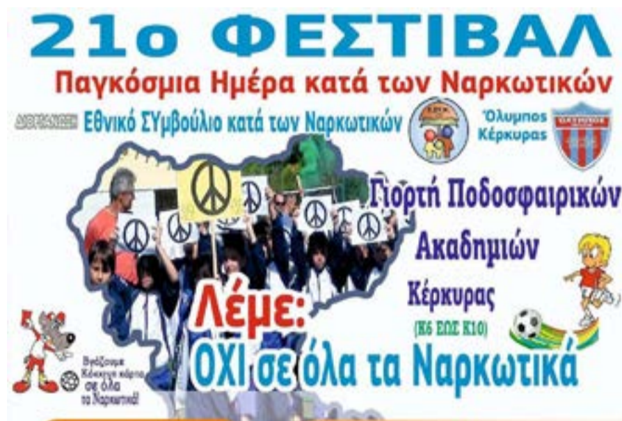
Η αφίσα της εκδήλωσης

Ομαδικές αποδεσμεύσεις. 01-07-2026 ως 30-06-2027