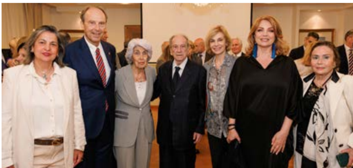
Στην εκδήλωση παρέστησαν γνωστοί Κερκυραίοι που ζουν στην Αθήνα