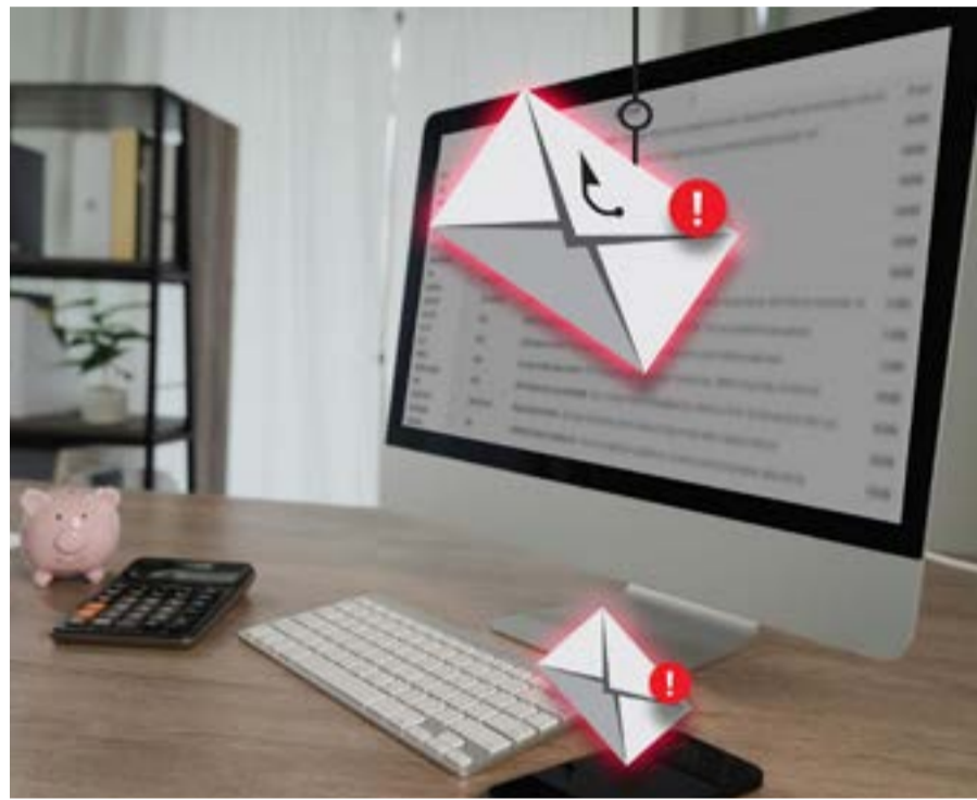
Η Ελληνική Αστυνομία προειδοποιεί για νέα απόπειρα phishing μέσω email που χρησιμοποιεί παράνομα στοιχεία δημόσιων φορέων και αξιωματούχων για την εξαπάτηση πολιτών.

Ιδιαίτερη προσοχή θα δοθεί επίσης στη διευκόλυνση των μαθητών που συμμετέχουν στις Πανελλαδικές Εξετάσεις, προκειμένου να διασφαλιστεί η απροβλημάτιστη μετάβασή τους στα εξεταστικά κέντρα.