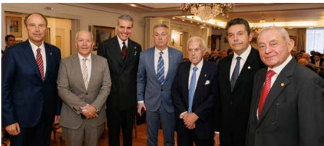
Αναμνηστική μετά τη λήξη της τελετής