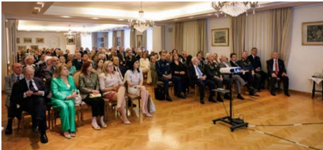
Η κατάμεστη αίθουσα εκδηλώσεων της Αθηναϊκής Λέσχης