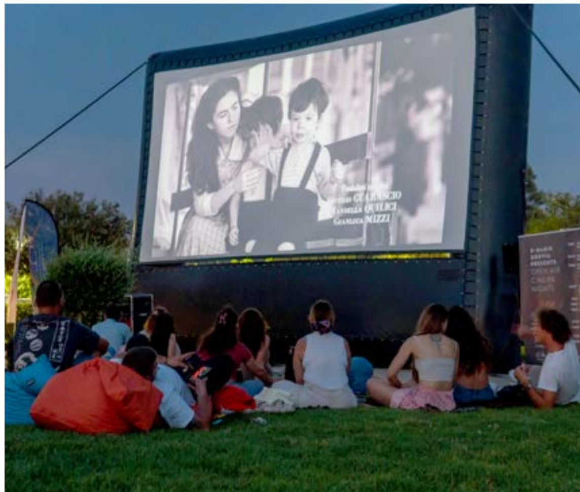
Απολαυστικές βραδιές στη μαρίνα Γουβιών