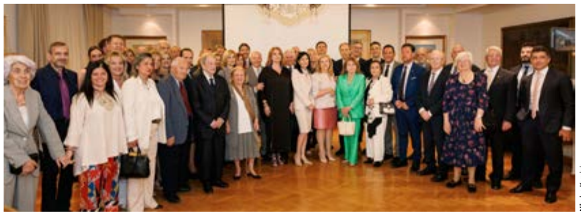
Η εκδήλωση στέφθηκε με μεγάλη επιτυχία