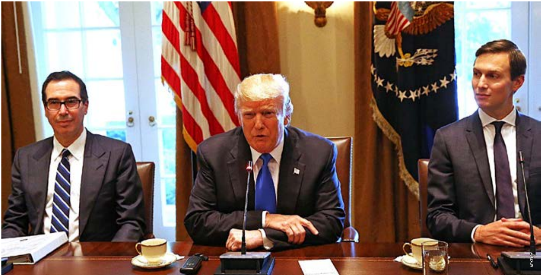
Ο Ντόναλντ Τραμπ και ο γαμπρός του Τζάρεντ Κούσερ (δεξιά). Η σχεδιαζόμενη επένδυση του Κούσερ στη Σάσωνα και στο Ζβέρνετς βρίσκεται στο επίκεντρο των αντιδράσεων κατοίκων και της πολιτικής αντιπαράθεσης που ακολούθησε τα επεισόδια στην περιοχή.