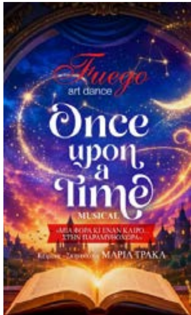
Η αφίσα της παράστασης