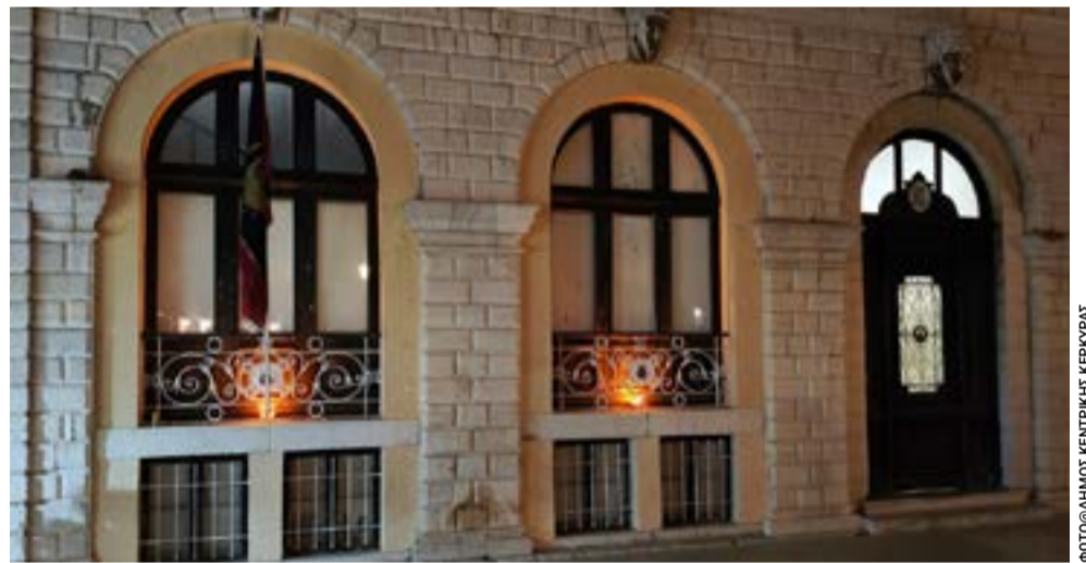
Το ιστορικό δημαρχείο λουσμένο στο πορτοκαλί φως

Πριν από οποιαδήποτε απόφαση για νέες χρεώσεις, παραχωρήσεις ή οργανωμένα πεδία ναυδέτων, απαιτείται κάτι απλούστερο: διαφάνεια. Να γνωρίζει η πόλη τι ακριβώς συμβαίνει στον όρμο της, ποιο είναι το οικονομικό αποτύπωμα αυτής της δραστηριότητας και ποια ανταποδοτικά οφέλη επιστρέφουν στην τοπική κοινωνία. Διαφορετικά, η Γαρίτσα θα συνεχίσει να λειτουργεί ως μια αόρατη μαρίνα, χωρίς κανόνες, χωρίς στοιχεία και χωρίς δημόσιο σχεδιασμό.