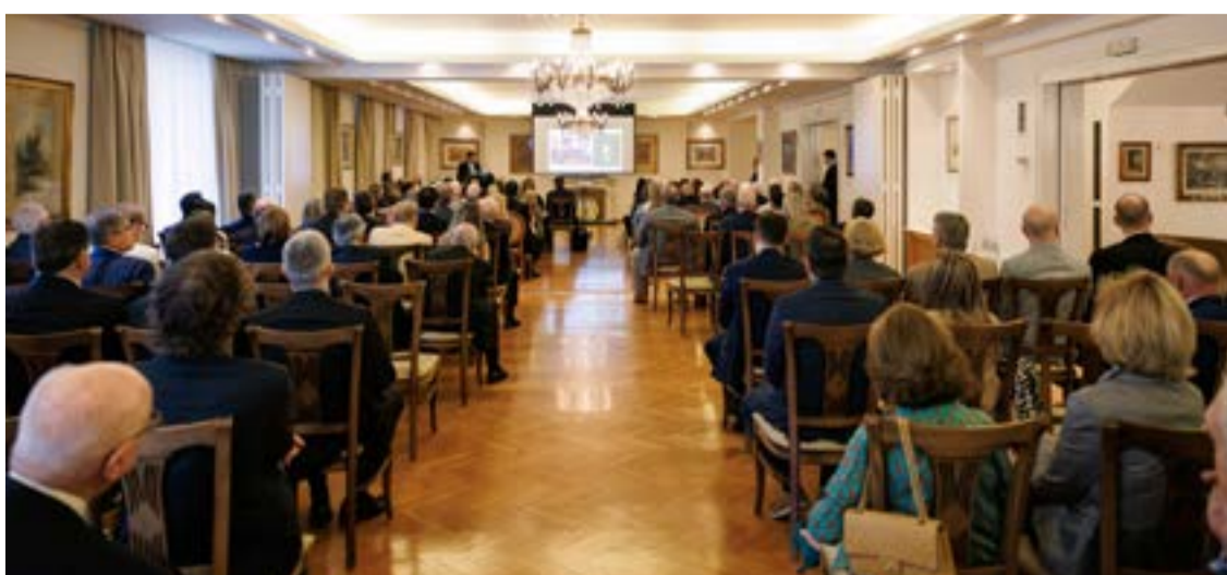
Από την παρουσίαση της ιστορικής διαδρομής της Αναγνωστικής