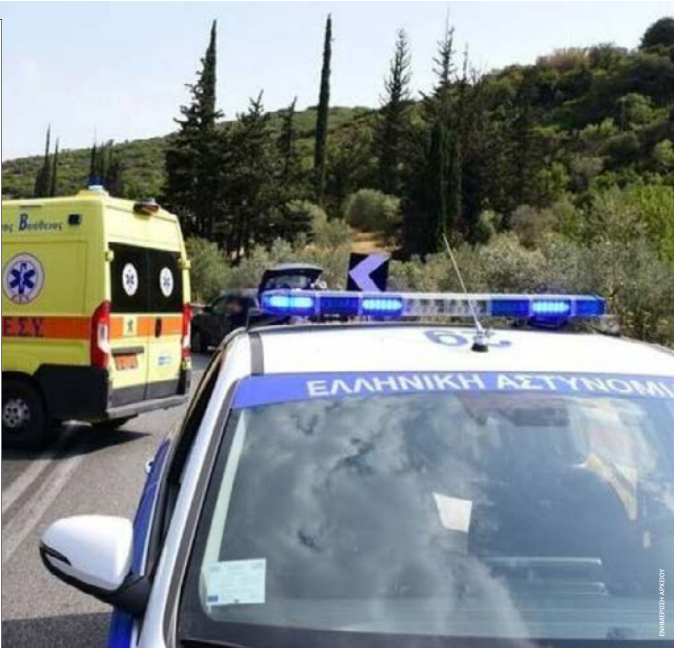
Αυξημένοι τροχονομικοί έλεγχοι και περισσότερα τροχαία ατυχήματα κατέγραψε η ΕΛ.ΑΣ. στα Ιόνια Νησιά τον Μάιο του 2026, με βασικές παραβάσεις την υπερβολική ταχύτητα και τη μη χρήση κράνους.

Κατά τη διάρκεια της επιχείρησης συνελήφθη η γυναίκα, ενώ οι δύο άνδρες αναζητούνται στο πλαίσιο της αυτόφωρης διαδικασίας. Οι παρεμβάσεις στο δίκτυο διαπιστώθηκαν από τα συνεργεία του ΔΕΔΔΗΕ. Σε βάρος των τριών σχηματίστηκε δικογραφία για κλοπή ηλεκτρικού ρεύματος, η οποία θα υποβληθεί στον Εισαγγελέα Πλημμελειοδικών.