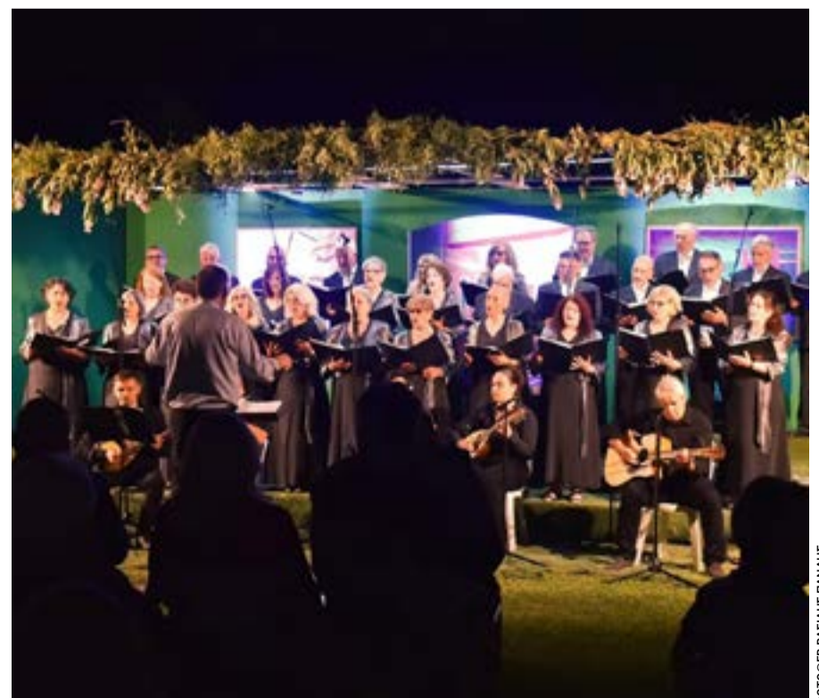
Οι χορωδίες έδωσαν τον καλύτερό τους εαυτό, κερδίζοντας το θερμό χειροκρότημα του κοινού