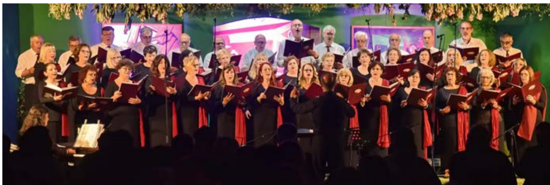
Οι χορωδίες χάρισαν βαθιά συγκίνηση στο πολυπληθές κοινό