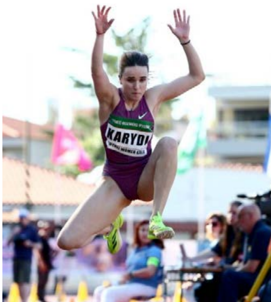
Η Σπυριδούλα Καρύδη στην προσπάθειά της στη Φιλοθέη για το 13,68μ.

Αν κάποιος δεν ξέρει να θυμίσουμε ότι η Καρύδη πήρε στο τριπλούν Χρυσό μετάλλιο στο Ευρωπαϊκό Πρωτάθλημα Κ20 (2019) 14.00μ., αργυρό στο Ευρωπαϊκό Πρωτάθλημα Κ23 (2021) και 9η θέση στο Ευρωπαϊκό Γυναικών (2022), ενώ τα ατομικά της ρεκόρ είναι 14.19μ. στο τριπλούν και 6.71μ. στο μήκος.