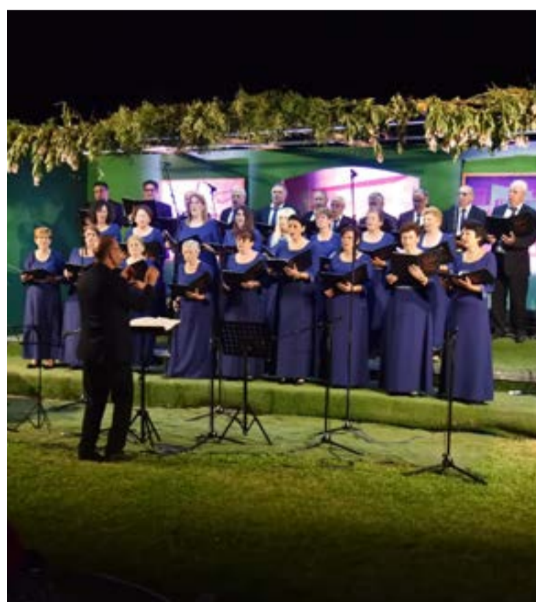
Οι διοργανωτές ευχαριστούν τον Πολιτιστικό Σύλλογο Αργυράδων, καθώς και όλους τους εθελοντές και τους συντελεστές της βραδιάς