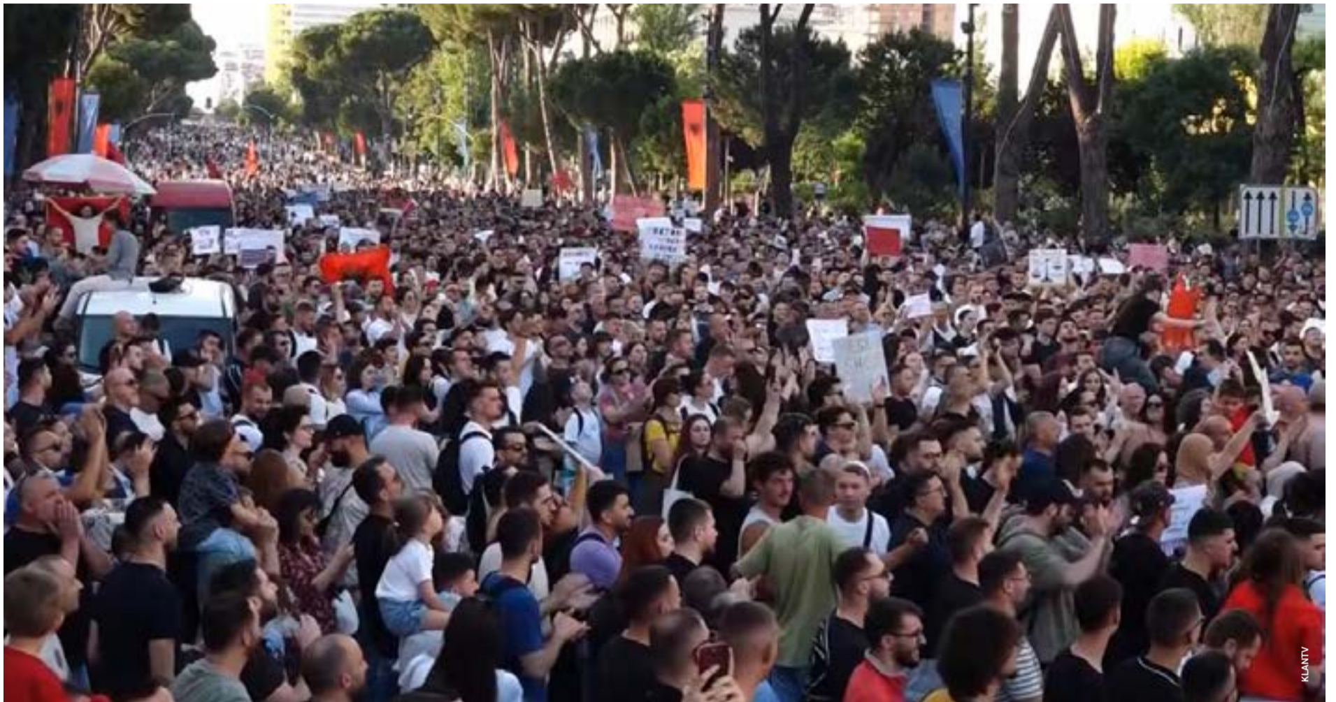
Από την Αυλώνα έως τα Τίρανα, οι αντιδράσεις για τη Σάσωνα δεν εστιάζουν στην εθνότητα των διαδηλωτών αλλά στο δικαίωμα των πολιτών να έχουν λόγο για τη γη, το περιβάλλον και το μέλλον του τόπου τους.