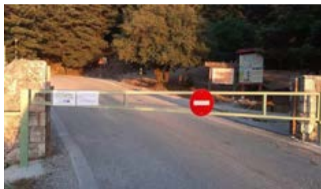
Οι περιορισμοί ισχύουν ως το τέλος της αντιπυρικής περιόδου

Με χορό και μουσική αποχαιρετούμε τη χρονιά και ευχόμαστε σε όλους καλό καλοκαίρι!