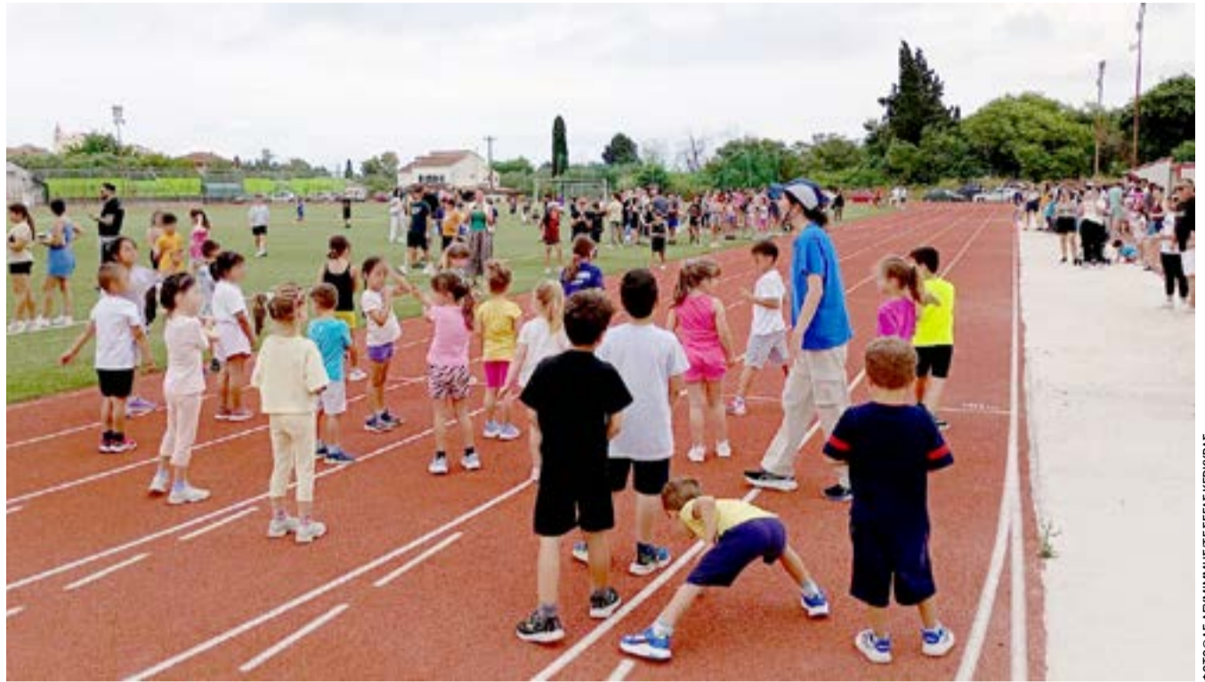
Χαρούμενα παιδιά στο ταρτάν του σταδίου της Λευκίμμης

Η πειθαρχική επιτροπή της ΕΠΟ ανακοίνωσε την απόφασή της για το ματς Πύργος-Ζάκυνθος, το οποίο είχε διακοπεί, διαμορφώνοντας έτσι την τελική κατάσταση της ανόδου στη Super League 2. Η επιτροπή έδωσε τη νίκη στα χαρτιά με 3-0 στη Ζάκυνθο, ωστόσο δεν τιμώρησε την ομάδα της Ηλείας με αφαίρεση βαθμών. Της επέβαλλε πρόστιμο και δύο αγώνες κεκλεισμένων των θυρών. Με αυτή την απόφαση, στη Super League 2 ανεβαίνουν η Ζάκυνθος και ο Πύργος, ο οποίος υπερτερεί στην ισοβαθμία του Άρη Πετρούπολης.