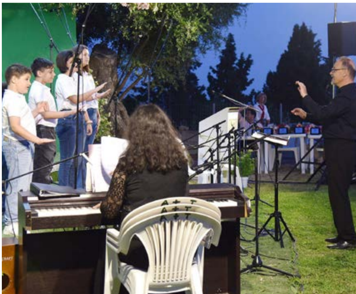
Η Παιδική Χορωδία Πολιτιστικού Συλλόγου Αργυράδων

Οι χορωδίες που συμμετείχαν έδωσαν τον καλύτερό τους εαυτό, κερδίζοντας το θερμό χειροκρότημα του κοινού και επιβεβαιώνοντας το υψηλό επίπεδο του πολιτισμού της Κέρκυρας. Στη σκηνή συναντήθηκαν τα εξής σχήματα: Η Παιδική Χορωδία Πολιτιστικού Συλλόγου Αργυράδων Η Σύμπραξη Χορωδιών Μουσικής Καλλιτεχνικής Ένωσης Περιβολίου & Πολιτιστικού Συλλόγου Πετριτή (με τη συμμετοχή της Μαντολινάτας Περιβολίου) Η Μικτή Χορωδία «Μιχάλης Καποδίστριας» Καλλιτεχνικού Συλλόγου Αη Μαθιά Η Χορωδία Ανεμόμυλου «Θωμάς Φλαγγίνης» Η Χορωδία Λευκίμμης Η Γυναικεία Χορωδία Κέρκυρας Η Μικτή Χορωδία Πολιτιστικού Συλλόγου Αργυράδων Αξίζουν θερμά συγχαρητήρια στον Πολιτιστικό Σύλλογο Αργυράδων, καθώς και σε όλους τους εθελοντές και συντελεστές που δούλεψαν σκληρά και συνέβαλαν στην επιτυχία αυτής της όμορφης και άριστα οργανωμένης βραδιάς.