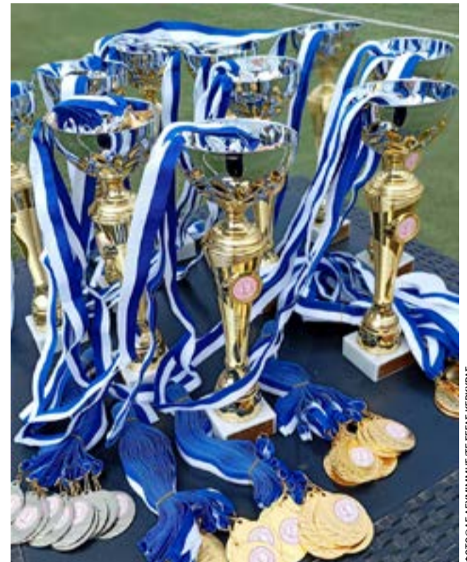
Κύπελλα και μετάλλια για τους νικητές

Είναι πάντα πολύ όμορφο να βλέπεις αυτά τα παιδιά να χαίρονται τη συμμετοχή και ακόμα περισσότερο τη νίκη, να υποστηρίζουν το ένα το άλλο, να καμαρώνουν το μετάλλιο ή το δίπλωμά τους.... Έτσι γεννιέται ο υγιής αθλητισμός! Ευχαριστούμε ιδιαίτερα τον προπονητή Βασίλη Μακαντάνη για την άφογη οργάνωση αλλά και το μεράκι