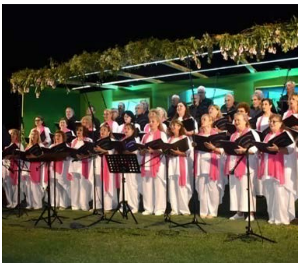
Οι φίλοι της χορωδιακής μουσικής απόλαυσαν μια μοναδική βραδιά