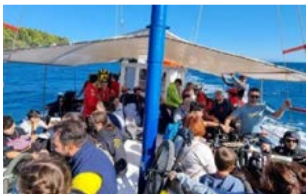
Ραντεβού στις 17.30 στη Σπηλιά

Το βιβλίο θα το βρείτε στο βιβλιοπωλείο Πλους και στο Public.