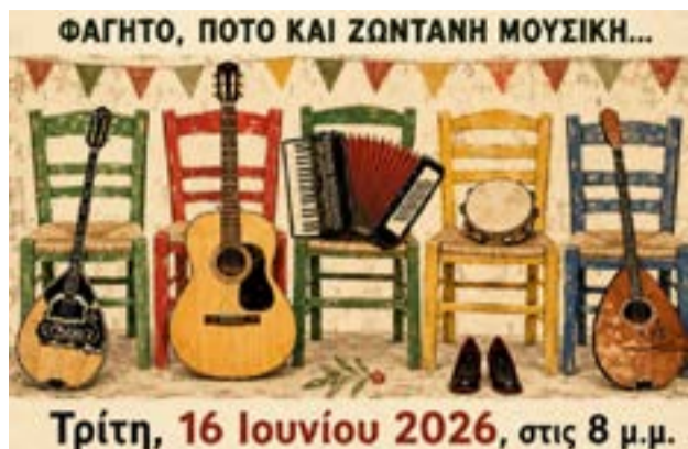
Η αφίσα της εκδήλωσης