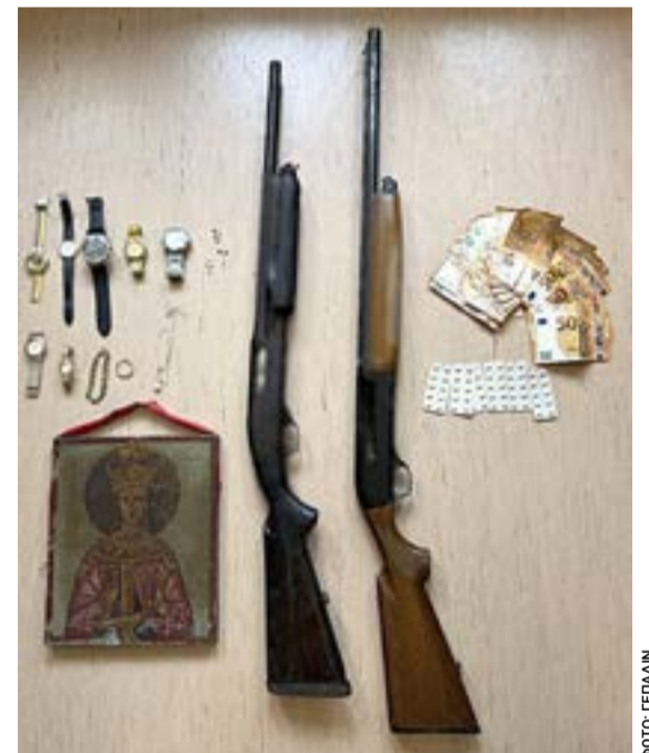
Η λεία που αποδίδεται στη δράση της συμμορίας ξεπερνά τις 250.000 ευρώ, ενώ στις έρευνες κατασχέθηκαν πολύτιμα αντικείμενα, όπλα, μετρητά, ναρκωτικά χάπια και εξοπλισμός για παράνομη ηλεκτροδότηση κατοικιών.

Οι συλληφθέντες οδηγήθηκαν στην Εισαγγελία, ενώ η προανάκριση συνεχίζεται προκειμένου να διερευνηθεί πιθανή εμπλοκή τους και σε άλλες υποθέσεις διαρρήξεων στο νησί.