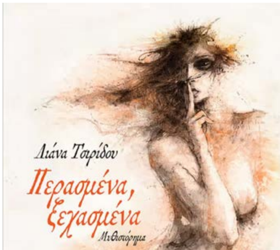
Το εξώφυλλο του βιβλίου

ΚΕΡΚΥΡΑ. Την απαγόρευση της κυκλοφορίας πεζών και οχημάτων, από τη δύση έως την ανατολή του ηλίου, καθ' όλη τη διάρκεια της αντιπυρικής περιόδου 2026 στον Εθνικό Δρυμό Αίνου, ανακοίνωσε ο αντιπεριφερειάρχης Κεφαλληνίας - Ιθάκης Σ. Κουρής. Επίσης επιβάλλεται και το μέτρο της καθολικής απαγόρευσης εισόδου, κάθε φορά που η Πολιτική Προστασία προβλέπει υψηλό κίνδυνο πυρκαγιάς.