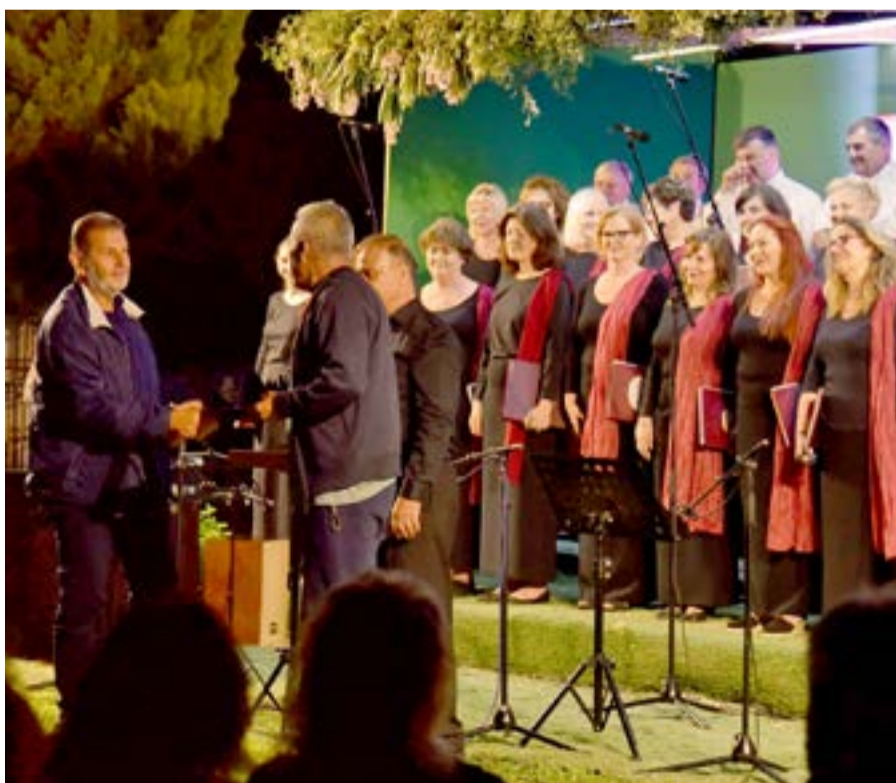
Η εκδήλωση συνδιοργανώθηκε από την Περιφέρεια Ιονίων Νήσων και τον Πολιτιστικό Σύλλογο Αργυράδων