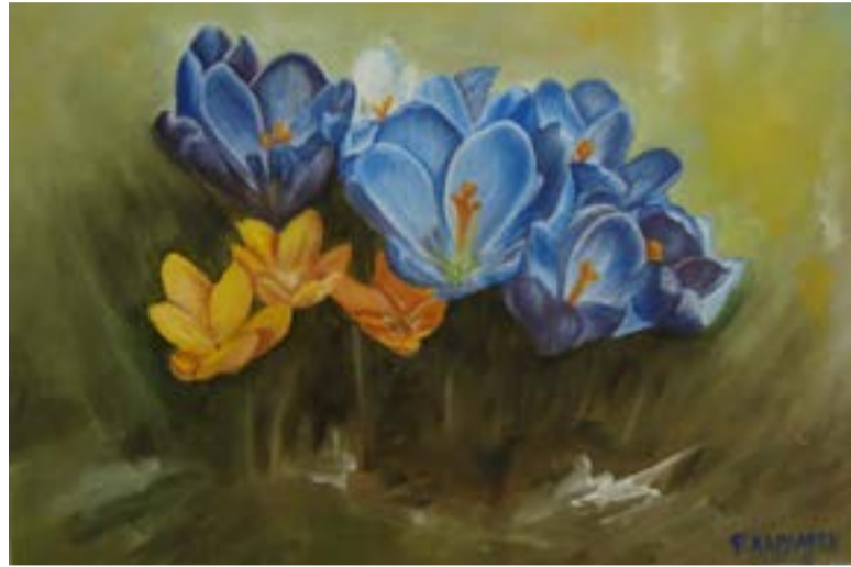
Το έργο της Φωτεινής Καρλάφτη στην κατηγορία «STILL LIFE & FLORAL»

Το έργο του με τίτλο "Meditation" (Ακουαρέλα, 56X38cm) επιλέχθηκε ανάμεσα σε 1.019 συμμετοχές, αποτελώντας ένα από τα μόλις 222 έργα από 60 χώρες που κατάφεραν να προκριθούν. Το συγκεκριμένο έργο ανήκει ήδη σε ιδιωτική συλλογή.