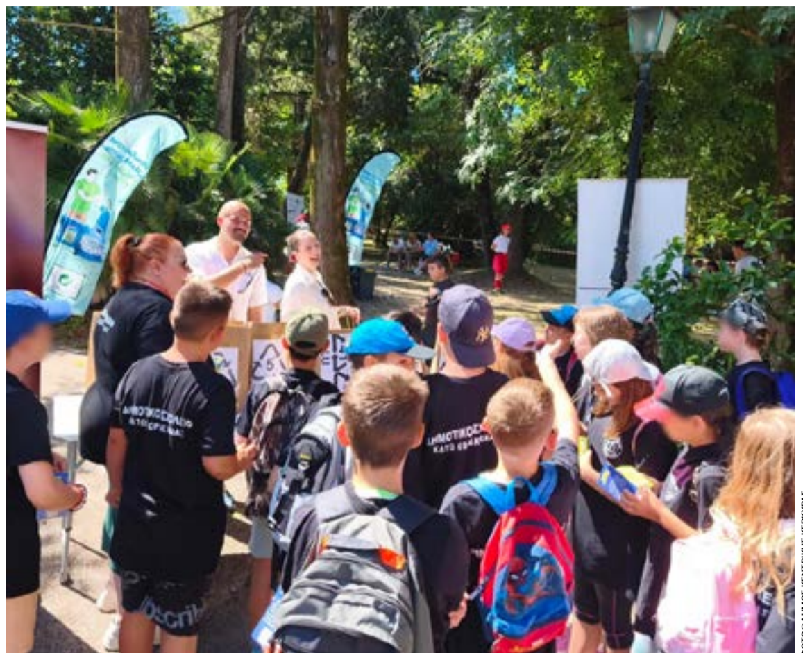
Από την εκδήλωση στο Μον Ρεπό

ΚΕΡΚΥΡΑ. Διεθνή διάκριση πέτυχαν οι μαθητές και οι μαθήτριες της ΣΤ' τάξης και του Ομίλου Δημιουργικότητας και Καινοτομίας του 4ου Πειραματικού Δημοτικού Σχολείου Κέρκυρας «Αθηναγόρειο». Το εκπαιδευτικό επιτραπέζιο παιχνίδι διαφυγής που ανέπτυξαν, με τίτλο «The Mind Trap of Lord Blabberlier in Foodland», προκρίθηκε στον 14ο Διεθνή Διαγωνισμό Παιχνιδιών, στο Ντάρμστατ της Γερμανίας.