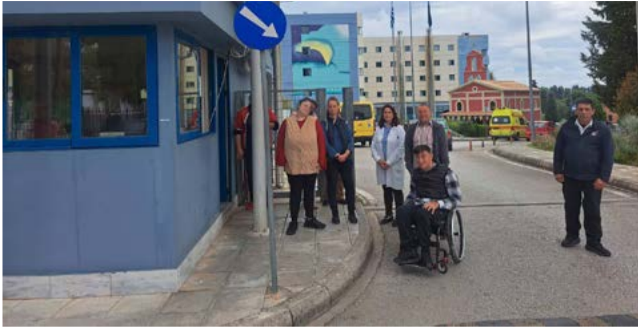
Από την υποδοχή στην είσοδο του νοσοκομείου

Μια ξεχωριστή δράση ενημέρωσης και πρόληψης στο πλαίσιο του προγράμματος «Πλειάδες»