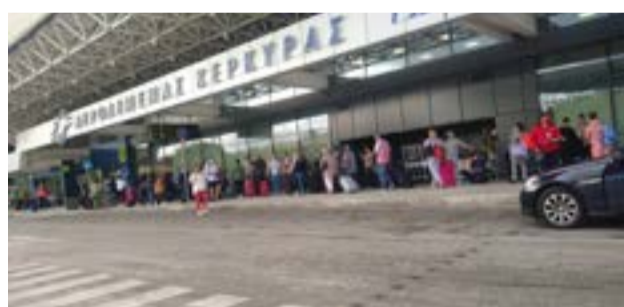
Ο συλληφθείς οδηγήθηκε στον Εισαγγελέα Πλημμελειοδικών

Η επιλογή του πανέμορφου αυτού δάσους δεν ήταν τυχαία. Ο παραδεισένιος τόπος αντήχησε από παιδικές φωνές και γέλια, λειτουργώντας ταυτόχρονα ως το ιδανικό πεδίο για να περάσει στη νέα γενιά ένα ξεκάθαρο, επίκαιρο και ηχηρό μήνυμα: η ορθή διαχείριση των απορριμμάτων είναι ζήτημα πολιτισμού και επιβίωσης για τον τόπο μας. Στο πλαίσιο της δράσης, λειτούργησαν ειδικά διαμορφωμένοι σταθμοί με διαδραστικά παιχνίδια και ενημερώσεις, ώστε τα παιδιά να γίνουν κοινωνοί της προστασίας του περιβάλλοντος.