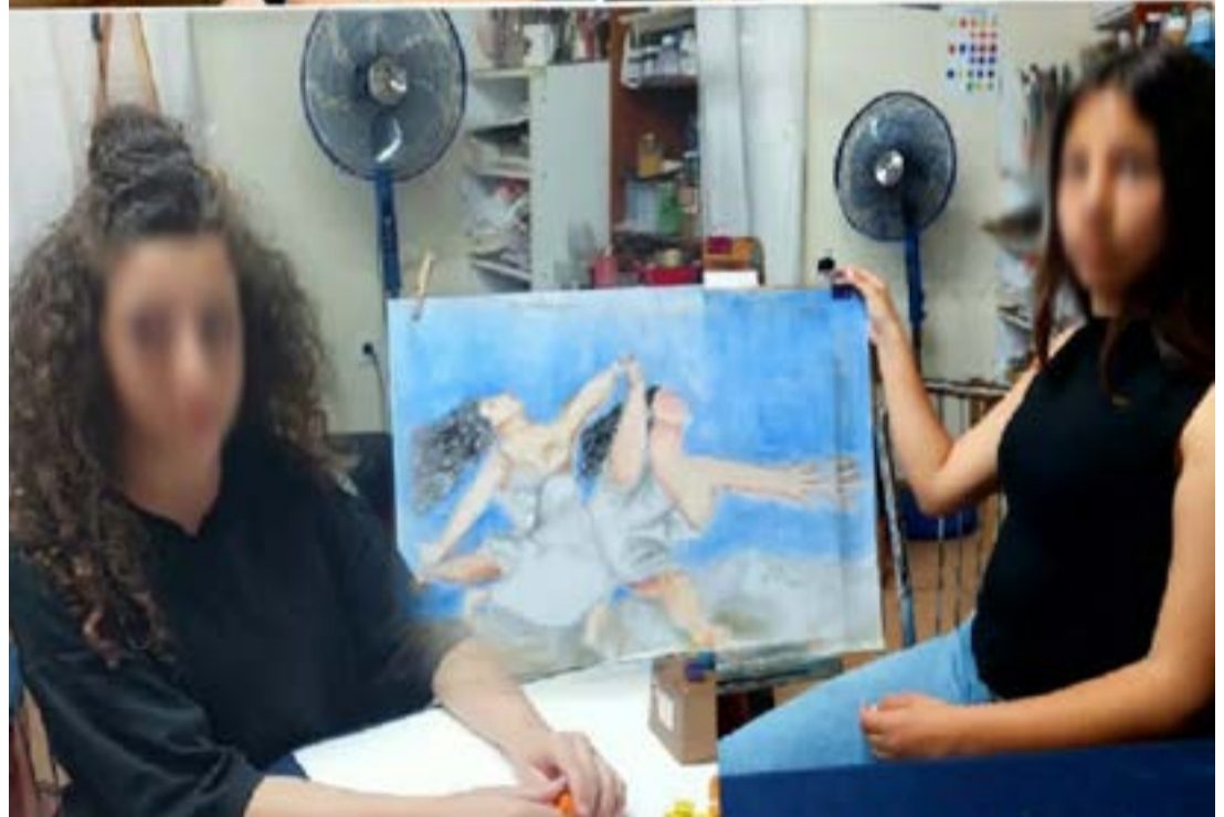
Έργα των παιδιών του Καλλιτεχνικού Εργαστηρίου

ΦΩΤΟ: ΚΑΛΙΤΕΧΝΙΚΟ ΕΡΓΑΣΤΗΡΙ «ΤΕΧΝΗ ΕΥ ΠΟΙΟΥΜΕΝ»