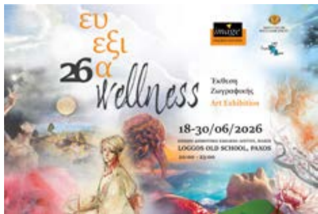
Η αφίσα της έκθεσης