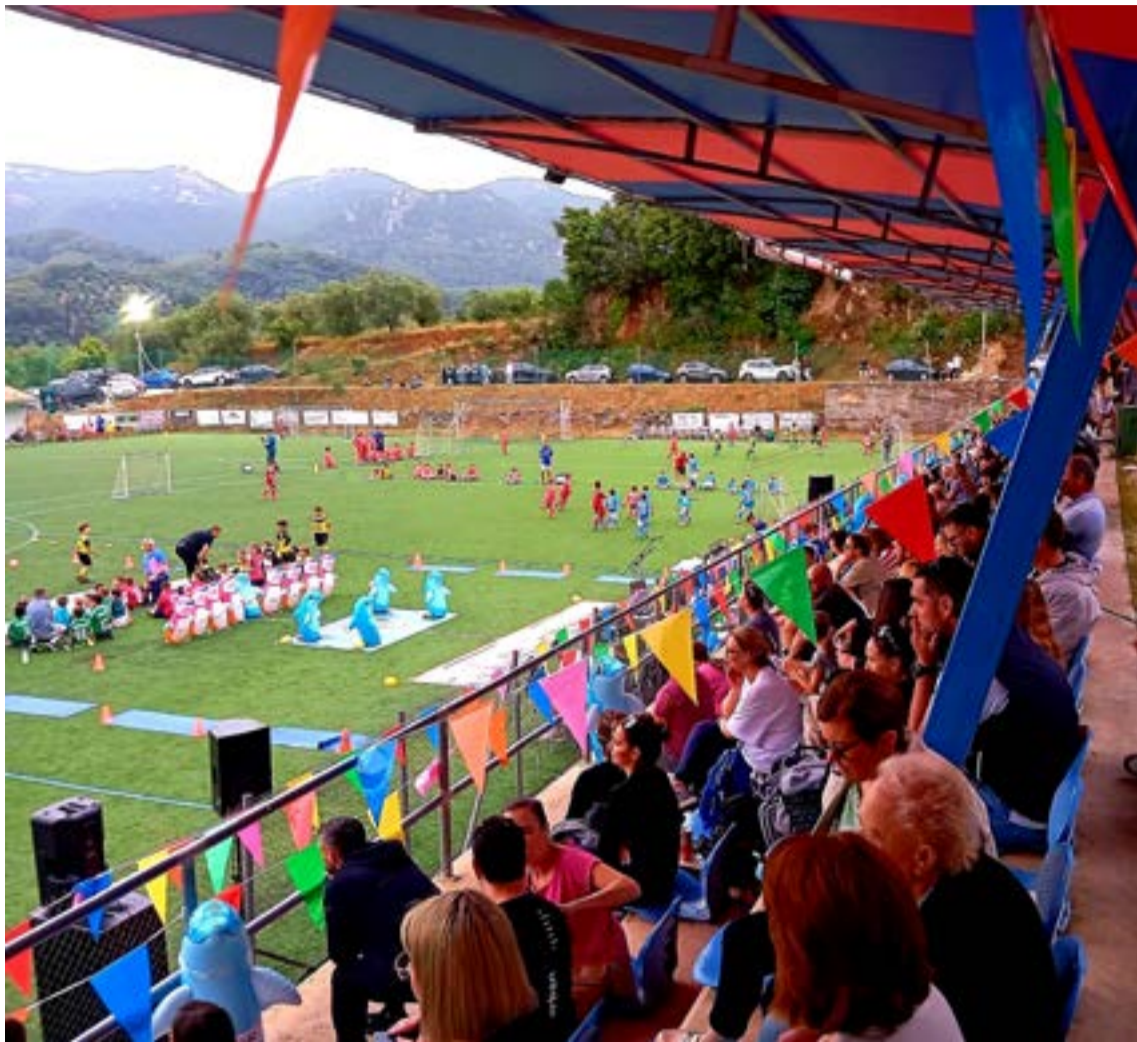
Από το περσινό φεστιβάλ του ΕΣΥΝ