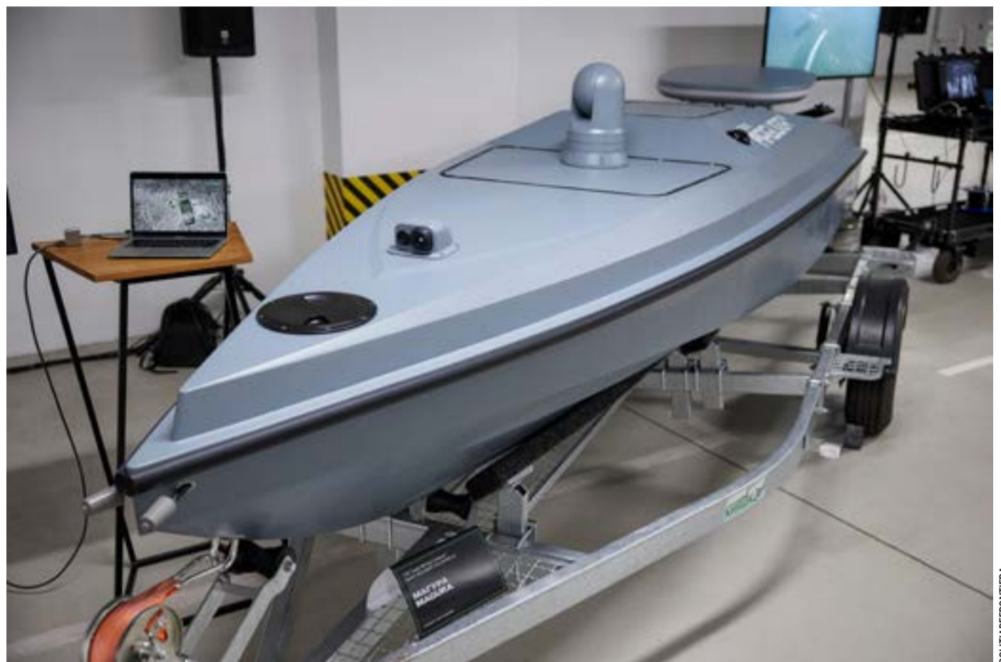
Τα ουκρανικά μη επανδρωμένα θαλάσσια σκάφη τύπου MAGURA χρησιμοποιούνται επιχειρησιακά στη Μαύρη Θάλασσα εναντίον ρωσικών ναυτικών στόχων. Οι ρουμανικές αρχές δεν έχουν επιβεβαιώσει επισήμως τον τύπο του drone που εντοπίστηκε στην Κωνσταντζα.

Το Μαυροβούνιο αναδείχθηκε ως ο πλέον προχωρημένος υποψήφιος προς ένταξη, με στόχο την ολοκλήρωση των διαπραγματεύσεων έως το 2028. Η Αλβανία θεωρείται επίσης μεταξύ των χωρών που σημειώνουν τη μεγαλύτερη πρόοδο, ενώ η Σερβία εξακολουθεί να αντιμετωπίζει δυσκολίες λόγω της απόκλισης από την κοινή εξωτερική πολιτική της Ε.Ε. και των σχέσεων της με τη Μόσχα. Από τα πιο χειροπιαστά αποτελέσματα της συνόδου θεωρείται η απόφαση έναρξης διαπραγματεύσεων για την ένταξη των έξι χωρών των Δυτικών Βαλκανίων στη ζώνη «Roam Like at Home». Παράλληλα εξετάστηκε η περαιτέρω συμμετοχή των χωρών της περιοχής σε ευρωπαϊκούς οικονομικούς και χρηματοπιστωτικούς μηχανισμούς πριν από την πλήρη ένταξή τους.