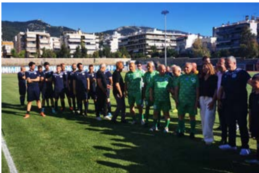
Από το φιλανθρωπικό παιχνίδι στον Χολαργό

Ενόψει των τελικών αναμετρήσεων με τον ΠΑΣ Γιάννινα, που θα διεξαχθούν στις 6 και 7 Ιουνίου, ευχόμαστε ολόψυχα καλή επιτυχία στην ομάδα με του Αθλητικού Συλλόγου Κέρκυρας «Θινάλι».