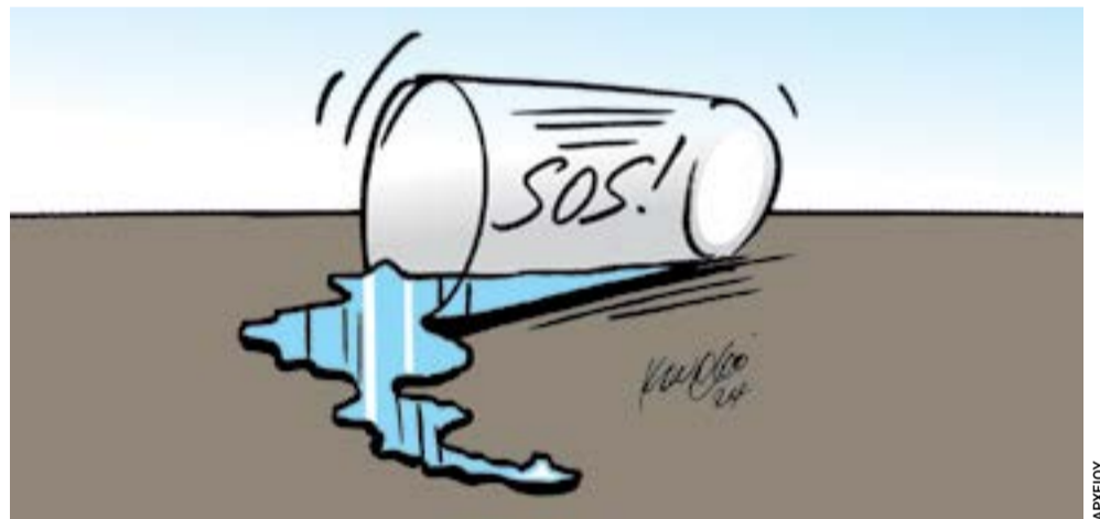
Σκίτσο του Αποστόλη Κουρσοβίτη για την Ενημέρωση