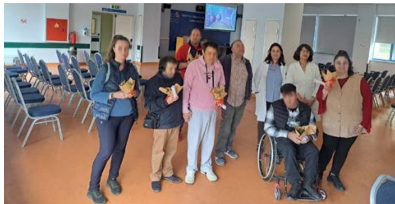
Τα παιδιά περιηγήθηκαν σε επιλεγμένα τμήματα του νοσοκομειακού ιδρύματος και είχαν την ευκαιρία να εξοικειωθούν με το περιβάλλον του