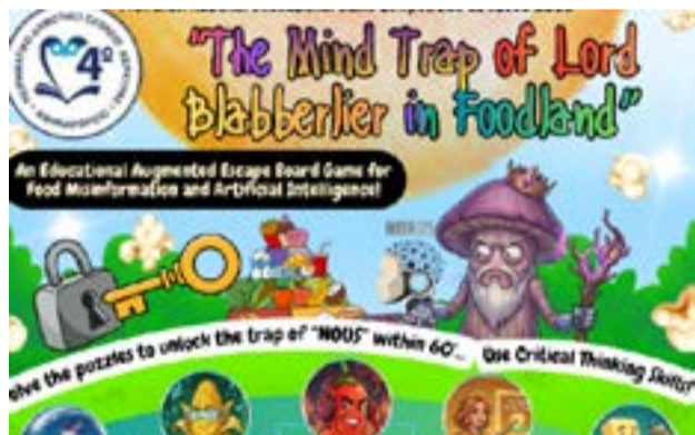
Το επιτραπέζιο παιχνίδι των παιδιών του Αθηναγόρειου

ΠΑΞΟΙ. Οι εκδόσεις image οργανώνουν την ομαδική έκθεση ζωγραφικής με τίτλο «Ευεξία» με στόχο την προώθηση του έργου 26 σύγχρονων επαγγελματιών καλλιτεχνών. Εγκαίνια: Πέμπτη 18/06/2026 στις 20:30. Διάρκεια έκθεσης: 18-30/06/2026 ώρες επίσκεψης 20:00 - 23:00. Στο πρώην Δημοτικό Σχολείο Λόγγου.