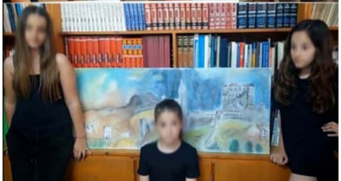
Τα παιδιά δημιούργησαν έργα βάση τα σημαντικότερα κινήματα της ζωγραφικής, από την Αναγέννηση έως την Pop Art