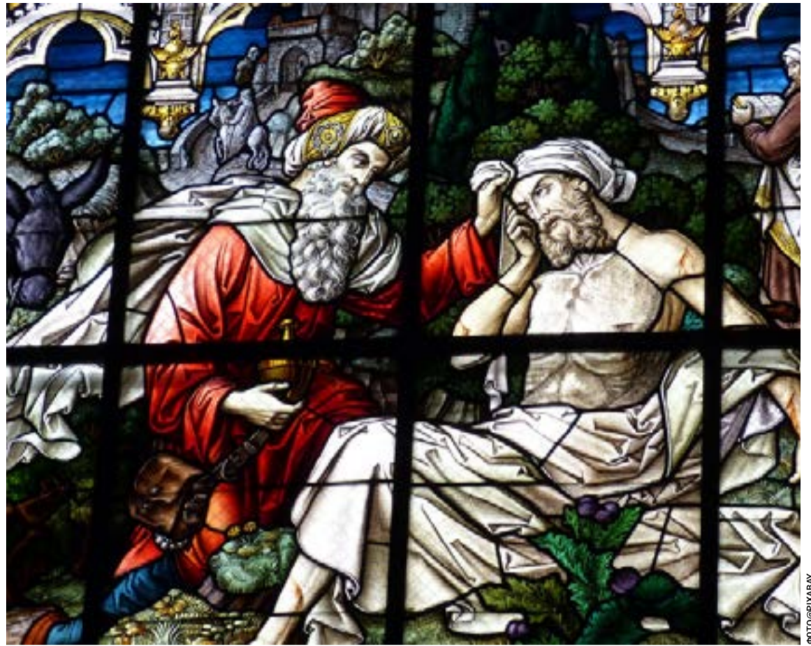
Η φράση αποκτά ένα βαθύτερο νόημα: «σε συγχωρώ» σημαίνει ότι δεν κουβαλώ πλέον το συναισθηματικό βάρος της βλάβης, ενώ «δεν ξεχνώ» σημαίνει ότι διατηρώ τη γνώση που απέκτησα από αυτήν.