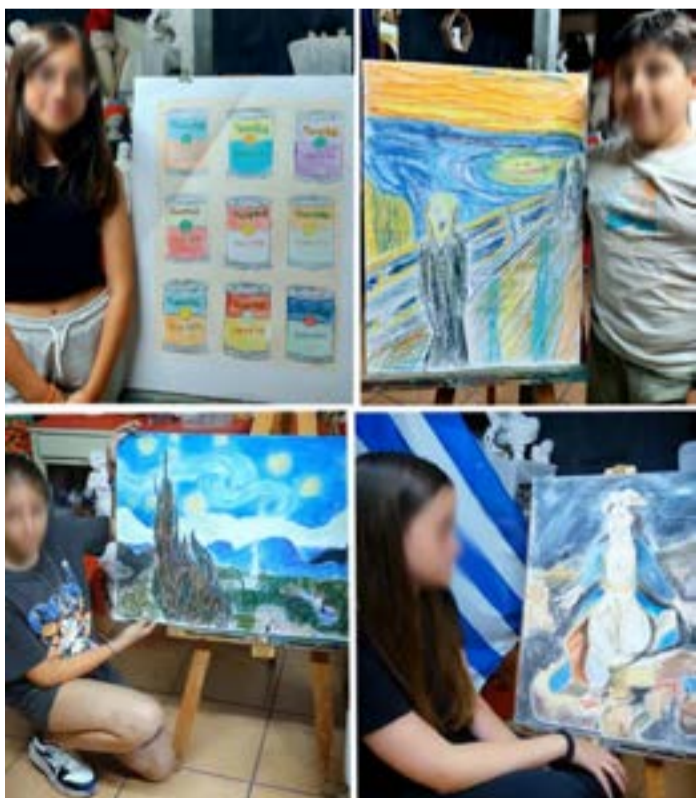
Η εκδήλωση είναι προγραμματισμένη για αύριο και ώρα 20:30, στην Αίθουσα Εκδηλώσεων του Δημοτικού Σχολείου Αχαράβης