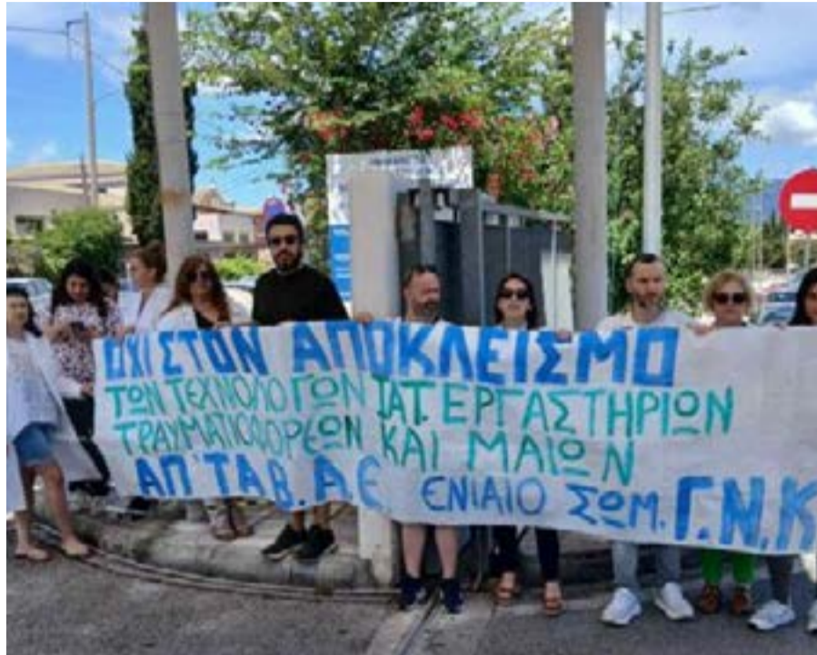
Από την κινητοποίηση των τεχνολόγων Ιατρικών Εργαστηρίων στην Κέρκυρα

Ένταξη στα ΒΑΕ: Αντίδραση για τον περιορισμό των πρόσφατων εξαγγελιών του Υπουργείου Υγείας περί ένταξης στα Βαρέα και Ανθυγιεινά μόνο των νοση-