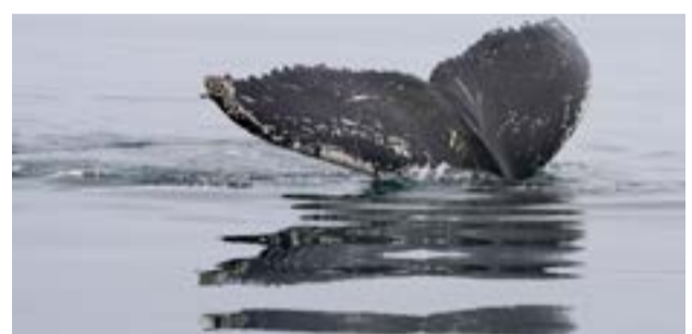
Το έργο πραγματεύεται τις συνέπειες της αλόγιστης μόλυνσης του θαλάσσιου περιβάλλοντος.

ΚΕΡΚΥΡΑ. Ο Πολιτιστικός Σύλλογος Καστελλάνων Μέσης, σε συνεργασία με το Γενικό Νοσοκομείο, διοργανώνει εθελοντική αιμοδοσία την Κυριακή 14 Ιουνίου, από τις 10:00 έως τις 13:30 στην πλατεία του χωριού. Επίσης θα βραβευτούν οι συγχωριανοί για την πολύτιμη προσφορά τους στον Πολιτιστικό Σύλλογο και στην Τράπεζα Αίματος. Παράλληλα, θα γίνει η επίσημη δωρεά ενός απινιδωτή στο χωριό.