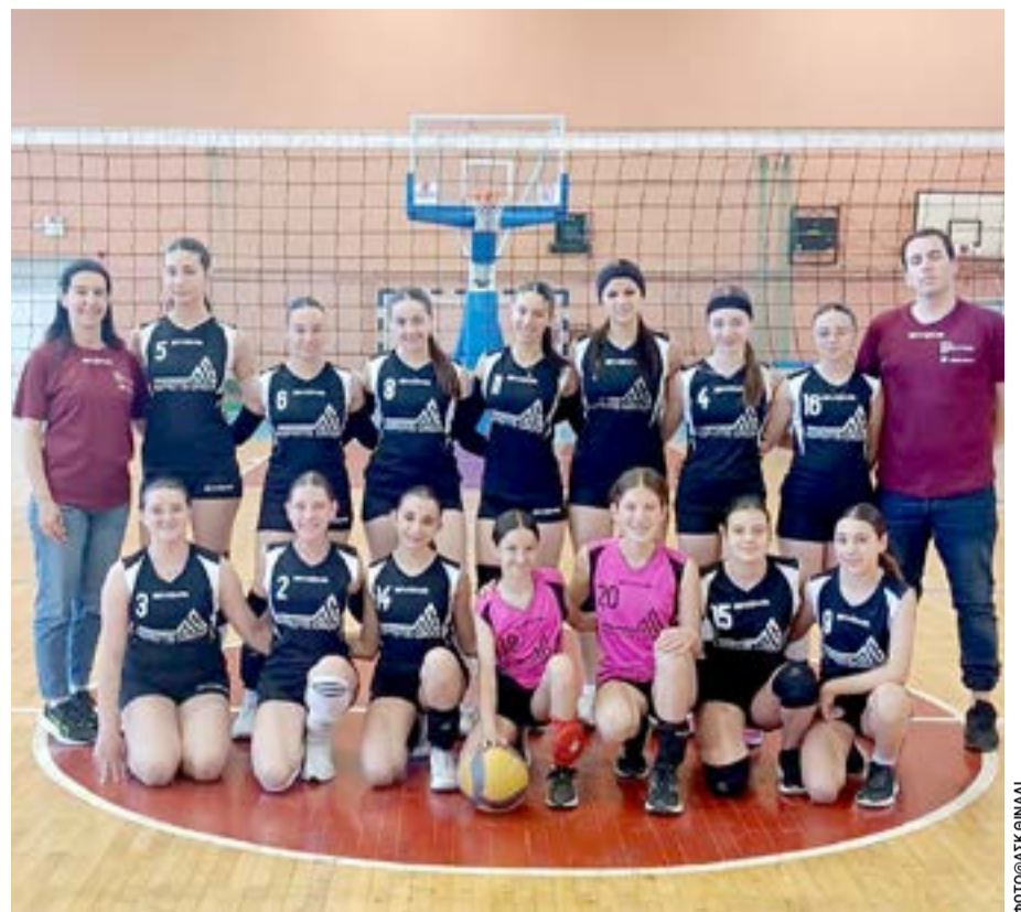
Η ομάδα κορασίδων του Θινάλιου

Η αήττητη πορεία της ομάδας, ανάμεσα σε δεκαεπτά συλλόγους της Περιφέρειας, αποτελεί ένα εξαιρετικό επίτευγμα που γεμίζει υπερηφάνεια ολόκληρη την Κέρκυρα και ιδιαίτερα το Δήμο Βόρειας Κέρκυρας, την οποία