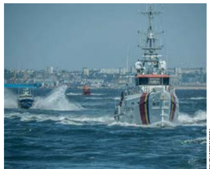
Περιπολικά της ρουμανικής Ακτοφυλακής.

λόγω της ελληνικής υπόθεσης. Στην ενημέρωση των διπλωματικών συντακτών στις 3 Ιουνίου, το Υπουργείο Εξωτερικών αποκάλυψε ότι έχει ήδη παραλάβει το επίσημο πόρισμα του ΓΕΕΘΑ για το οπλισμένο μη επανδρωμένο σκάφος που εντοπίστηκε στη Λευκάδα. Η Αθήνα προχώρησε σε επίσημο διάβημα προς το Κίεβο, ενημέρωσε την Ευρωπαϊκή Ένωση και το ΝΑΤΟ και έκανε λόγο για κίνδυνο από τη «μεταφορά πολεμικών επιχειρήσεων στη Μεσόγειο».