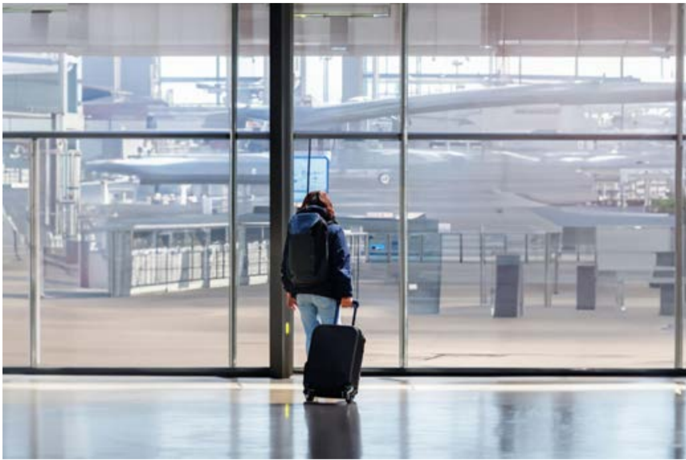
Ο παγκόσμιος τουρισμός καταγράφει ιστορικά υψηλά επίπεδα αφίξεων, ενώ η συζήτηση μετατοπίζεται πλέον από την ποσοτική ανάπτυξη στη βιωσιμότητα και την ποιότητα του τουριστικού αποτυπώματος.

Εκκινώντας την σε βάθος ανάλυση των όσων ειπώθηκαν ο Βουλευτής ΝΔ Καρδίτσας, Γιώργος Κωτσός, καταθέτοντας την εμπειρία των 21 ετών του ως δήμαρχος, εστίασε στη θεματική του παρέμβαση στις τομές που εισάγει ο νέος Κώδικας Δήμων και Κοινοτήτων, για τον οποίο είναι κεντρικός εισηγητής. Υπογράμμισε ότι ο νέος κώδικας δεν αποτελεί μια απλή τακτοποίηση νόμων, αλλά μια συνολική αναθεώρηση του αυτοδιοικητικού πλαισίου, ενοποιώντας περισσότερες από 2.000 διάσπαρτες διατάξεις σε ένα κείμενο και βάζοντας τέλος στην έντονη πολυνομία δεκαετιών. Ξεχωρίζοντας τις πιο σημαντικές αλλαγές, έδωσε έμφαση στην αλλαγή του τρόπου εκλογής των αυτοδιοικητικών οργάνων με την κατάργηση του δεύτερου γύρου, μια κίνηση που ενισχύει τις συνεργασίες εκ των προτέρων, αλλά και στη θεσμοθέτηση της ηλεκτρονικής ψηφοφορίας για τους ετεροδημότες.