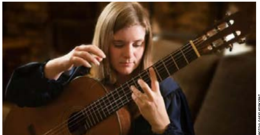
Η Νορβηγίδα κιθαρίστα Kristina Varlid

Τέλος, χρειάζεται πολιτική ειλικρίνεια. Δεν μπορούν όλοι να έχουν πάντα δίκιο. Δεν μπορεί να αυξάνεται διαρκώς η προσφορά χωρίς συνέπειες. Δεν μπορεί η επιτυχία να μετριέται μόνο με φωτογραφίες από εκθέσεις και αριθμούς αφίξεων. Δεν πρόκειται για επανάσταση. Πρόκειται για ενηλικίωση. Το ερώτημα δεν είναι αν η Κέρκυρα θα συνεχίσει να ζει από τον τουρισμό. Είναι αν θα αποφασίσει επιτέλους να τον κυβερνήσει, αντί να τον παρακολουθεί.