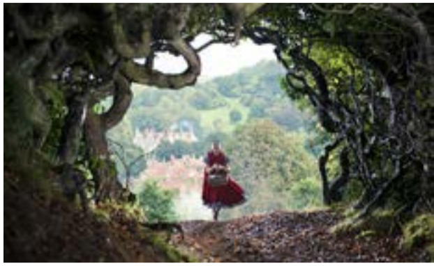
Από την αφίσα της παράστασης