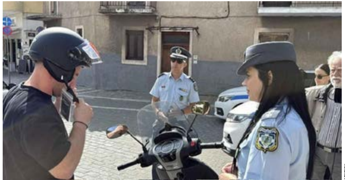
Συνεχείς τροχονομικοί έλεγχοι πραγματοποιούνται στα νησιά του Ιονίου από τις υπηρεσίες της Ελληνικής Αστυνομίας, με στόχο την πρόληψη των τροχαίων ατυχημάτων και την ενίσχυση της οδικής ασφάλειας ενόψει της θερινής περιόδου.

ΚΕΡΚΥΡΑ. Η Ελληνική Ομάδα Μελέτης Ιδιοπαθών Φλεγμονωδών Νόσων του Εντέρου (ΕΟΜΙΦΝΕ), θα πραγματοποιήσει ανοιχτή ενημερωτική εκδήλωση, γύρω από τις ΙΦΝΕ (Ελκώδης Κολίτιδα & Νόσος Crohn) . Η εκδήλωση θα πραγματοποιηθεί το Σάββατο 13 Ιουνίου 2026 και ώρα 18:30 , στην Ιόνιο Βουλή στην Κέρκυρα. Η είσοδος είναι ελεύθερη.