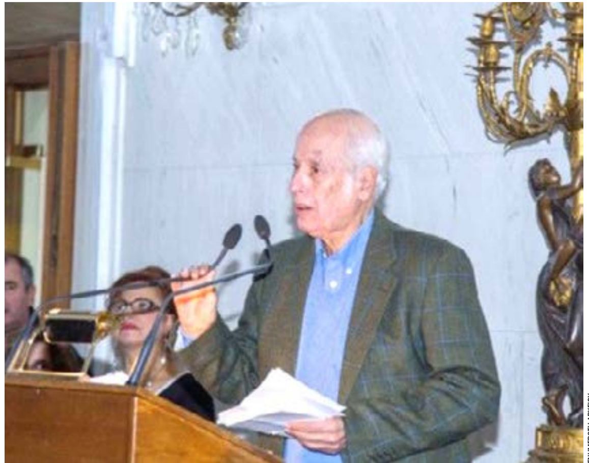
Ο Σπύρος Κατσίμης (1933–2026), ποιητής, δημοσιογράφος και ζωγράφος, υπηρέτησε επί επτά δεκαετίες τα ελληνικά γράμματα και τον πολιτισμό. Η Κέρκυρα τιμά τη μνήμη ενός ανήσυχου δημιουργού που συνέδεσε τη δημοσιογραφία με την ποίηση και τη δημόσια παρουσία με τη διακριτικότητα της τέχνης.

Περισσότερες πληροφορίες θα ανακοινωθούν τις επόμενες ημέρες μέσω της επίσημης ιστοσελίδας: averof.hellenicnavy.gr