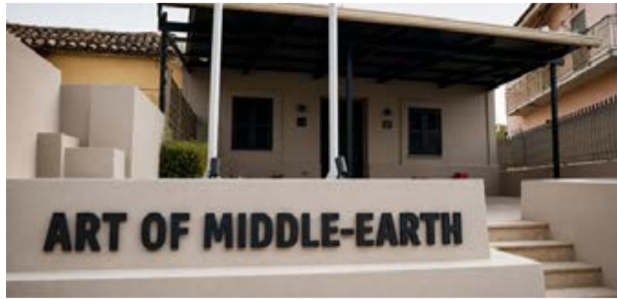
Ο νέος εκθεσιακός χώρος «Art of Middle-Earth Gallery» στην Κέρκυρα, η πρώτη γκαλερί παγκοσμίως αφιερωμένη αποκλειστικά σε πρωτότυπα έργα ζωγραφικής εμπνευσμένα από το σύμπαν του J.R.R. Tolkien.

Το νέο εγχείρημα αποτελεί προσωπική σύλληψη, δημιουργία και υλοποίηση του καλλιτέχνη και λειτουργεί περισσότερο ως προέκταση της καλλιτεχνικής του αναζήτησης παρά ως μια συμβατική γκαλερί. Με κεντρικό άξονα το τρίπτυχο «Myth. Memory.