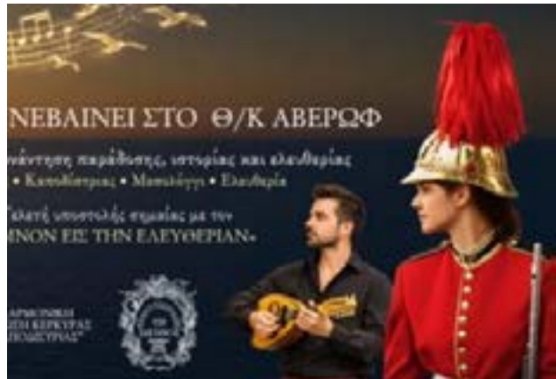
Η μουσική του Ιονίου θα ακουστεί από το θρυλικό πλοίο