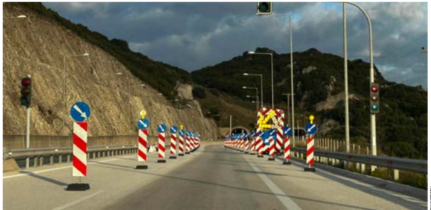
Οι εργασίες συντήρησης και επαναδιοδότησης στην Εγνατία Οδό συνεχίζονται με τμηματικούς περιορισμούς στην κυκλοφορία έως το τέλος του 2026, προκαλώντας αντιδράσεις από το Επιμελητήριο Κέρκυρας και τους χρήστες του δρόμου.

Παρά τη διαφωνία του με την έκβαση της αναμέτρησης, δηλώνει ότι σέβεται το αποτέλεσμα και δεσμεύεται πως οι εκπρόσωποί του στο νέο Διοικητικό Συμβούλιο θα ασκούν έλεγχο, θα παρεμβαίνουν όπου απαιτείται και θα λογοδοτούν διαρκώς στους συναδέλφους που τους εμπιστεύθηκαν.