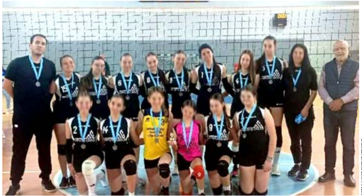
Η ομάδα του Θινάλιου

Η ομάδα Παγκορασίδων του Α.Σ.Κ. Θινάλι Δήμου Βόρειας Κέρκυρας στον τελικό εκτός έδρας (Γιάννενα) στις 7-6-2026, κέρ-