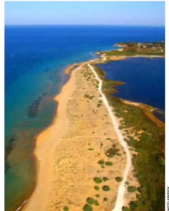
Η παραλία του Χαλικούνα

Ο συνδυασμός Ανεξάρτητοι Ιατροί Κέρκυρας έλαβε 91 ψήφους και εκλέγεται: ΒΛΑΧΟΥ ΙΛΙΑΝΑ - ΣΟΦΙΑ (91 ψήφοι)