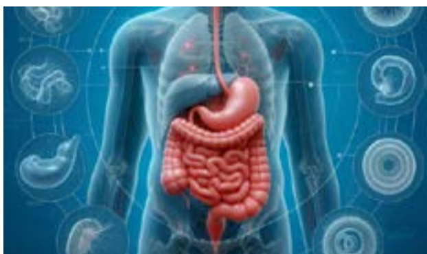
Αυτό το Σάββατο στην Ιόνιο Βουλή

ΚΕΡΚΥΡΑ. Η θεατρική ομάδα του 5ου Δημοτικού Σχολείου και Νηπιαγωγείου Κέρκυρας παρουσιάζει το έργο «Μέσα στο Δάσος» του James Lapine, σε διασκευή κειμένου, σκηνοθεσία και μουσική επιμέλεια των Ευτυχίας Βογιατζόγλου και Σπύρου Ατσοπάρδη, την Παρασκευή 19 Ιουνίου 2026, στις 20:00, στον προαύλιο χώρο του 5ου Δημοτικού Σχολείου Κέρκυρας.