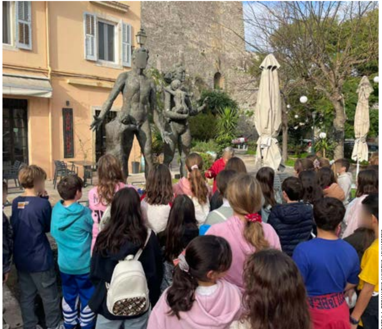
Μικροί μαθητές του 4ου Δημοτικού στο Μνημείο του Ολοκαυτώματος, στην πλατεία Νέου Φρουρίου της Κέρκυρας.

Και τελειώνει η ανακοίνωση, προειδοποιώντας: «Όλοι οι Εβραίοι οι οποίοι δεν επαρουσιάσθησαν την ημέραν της προσκλήσεως