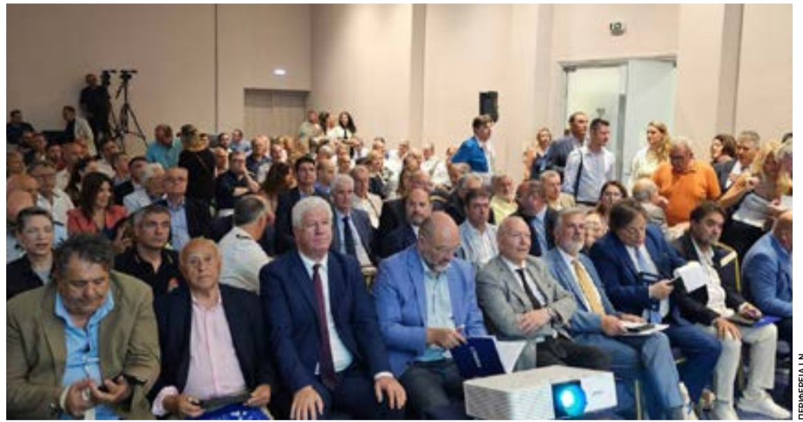
Στιγμιότυπο από την ημερίδα της Περιφέρειας Ιονίων Νήσων στην Κέρκυρα για το μέλλον των μικρών νησιών του Ιονίου, με κεντρικό άξονα το «Δικαίωμα στην Παραμονή» και τη διαμόρφωση πολιτικών για τη βιώσιμη ανάπτυξη και τη δημογραφική ανθεκτικότητα των νησιωτικών κοινοτήτων.

ΚΕΡΚΥΡΑ. Η Φιλαρμονική Κορακιάνας «Ο Σπύρος Σαμάρας» παρουσιάζει για την Παγκόσμια και Ευρωπαϊκή Ημέρα Μουσικής, συναυλία Μπαντίνας & Μουσικών Συνόλων το Σάββατο 20 Ιουνίου 2026 20:00 στον αύλειο χώρο του Ι.Ν. Αγίου Γεωργίου Άνω Κορακιάνα. Μετά τη συναυλία θα προβληθεί βίντεο από το ταξίδι της φιλαρμονικής στη Νέα Υόρκη (22-28 Απριλίου 2026).