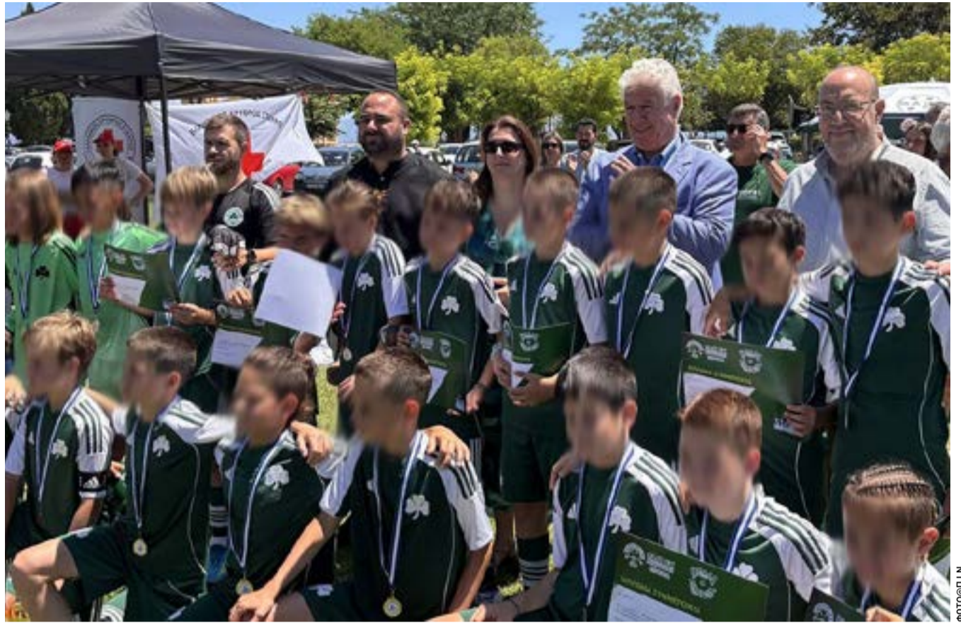
Από τη γιορτή του ποδοσφαίρου στη Σπιανάδα