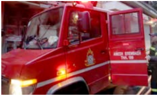
Το ξενοδοχείο εκκενώθηκε προληπτικά