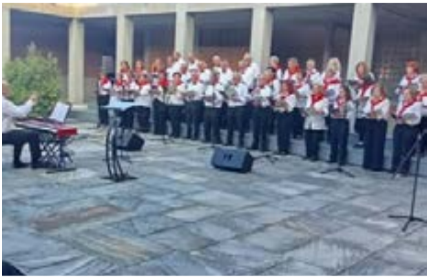
Από την εκδήλωση στη Θεσσαλονίκη