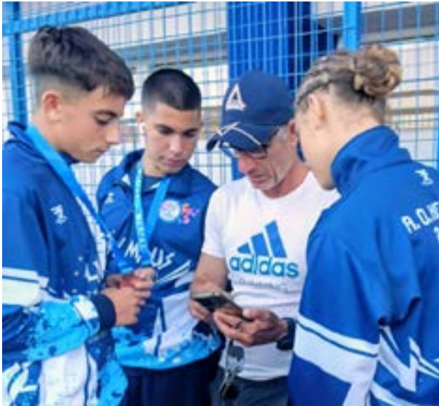
Τελευταίες οδηγίες πριν από τον αγώνα