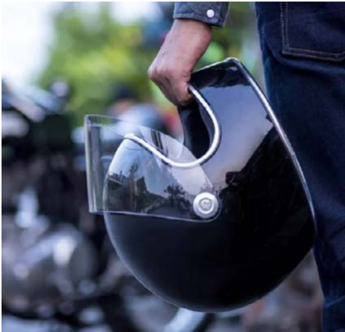
Η Τροχαία υπενθυμίζει ότι το κράνος δεν είναι ένα απλό αξεσουάρ