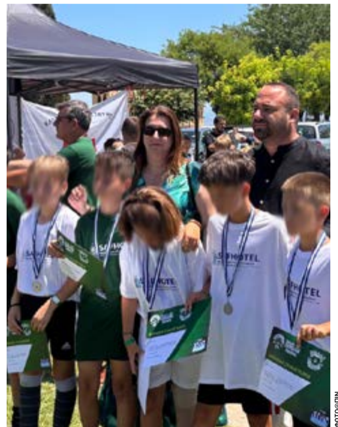
Από τη βράβευση των παιδιών των Ακαδημιών

στηρίζει σταθερά πρωτοβουλίες που προάγουν τον αναπτυξιακό αθλητισμό, ενισχύουν τη συμμετοχή των παιδιών σε οργανωμένες αθλητικές δραστηριότητες και καλλιεργούν τις αξίες της συνεργασίας, της προσπάθειας και της ευγενούς άμιλλας.