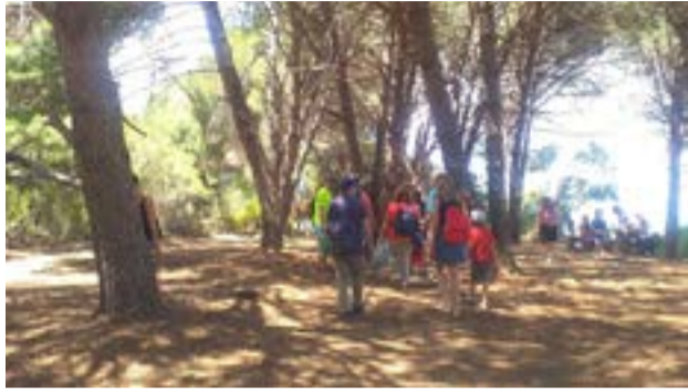
Τα μέλη του Συλλόγου Προστασίας και Ανάδειξης του Βίδο «Οι Φίλοι του Βίδο» σε πρόσφατη επίσκεψή τους στην νησίδα.