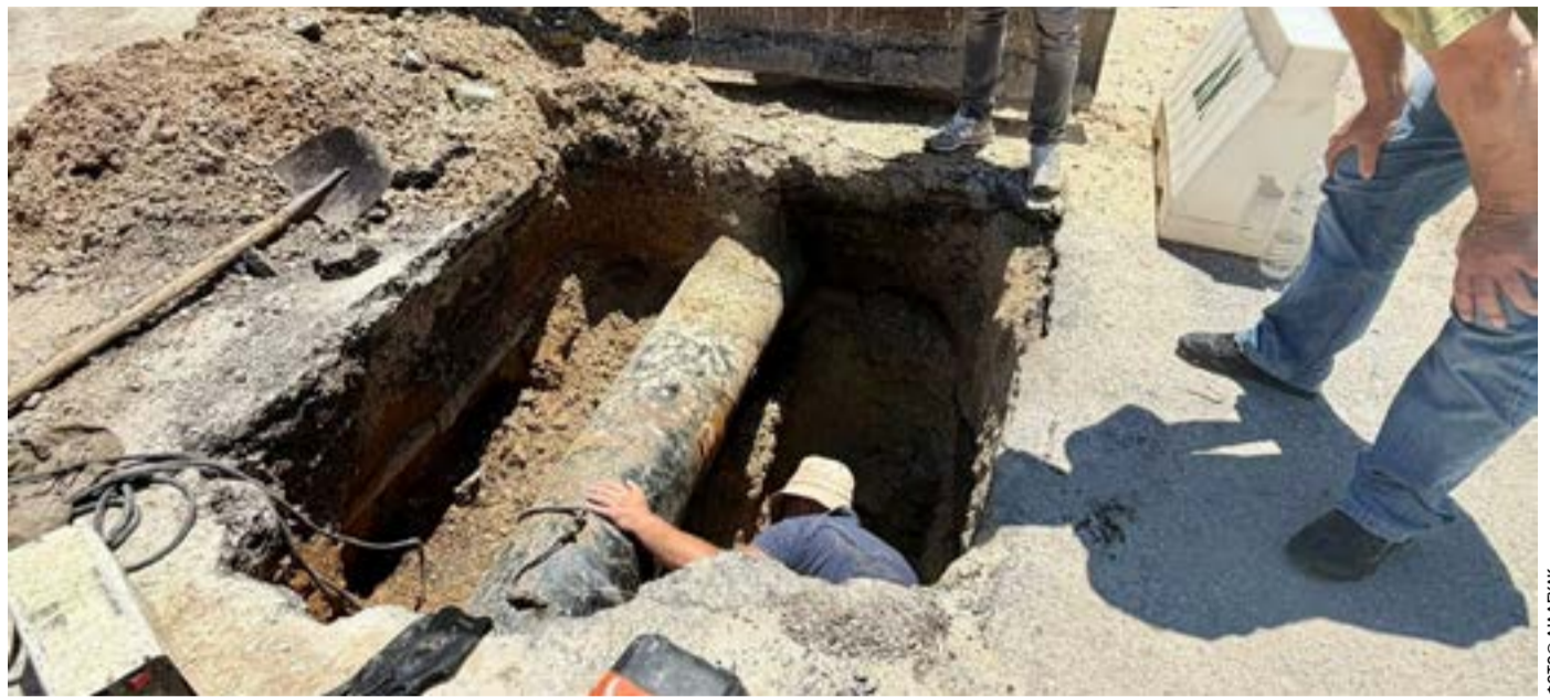
«Έχουμε ζητήσει από την κυβέρνηση πιστώσεις ύψους δεκάδων εκατομμυρίων ευρώ και μέχρι στιγμής έχουμε λάβει μόλις 1,6 εκατ. ευρώ από το υπουργείο Περιβάλλοντος», αναφέρει, εκφράζοντας πάντως την εκτίμηση ότι, χάρη στις φετινές βροχοπτώσεις και στα έργα που υλοποιούνται από τη ΔΕΥΑΚ, η Κέρκυρα δεν θα βιώσει ξανά φαινόμενα λειψυδρίας αντίστοιχα με εκείνα του 2024.

ΚΕΡΚΥΡΑ. Το Σωματείο Ψυχιατρικού Τομέα καταγγέλλει απόπειρα στραγγαλισμού νοσηλεύτριας από ασθενή σε μονάδα ψυχοκοινωνικής αποκατάστασης, αποδίδοντας το περιστατικό στην υποστελέχωση και την υποβάθμιση των δημόσιων υπηρεσιών ψυχικής υγείας. Νέα σοβαρή επίθεση σε βάρος εργαζόμενης στον χώρο της ψυχικής υγείας καταγγέλλει το Σωματείο Ψυχιατρικού Τομέα, με αφορμή την απόπειρα στραγγαλισμού νοσηλεύτριας από νοσηλεύόμενο σε μονάδα ψυχοκοινωνικής αποκατάστασης.