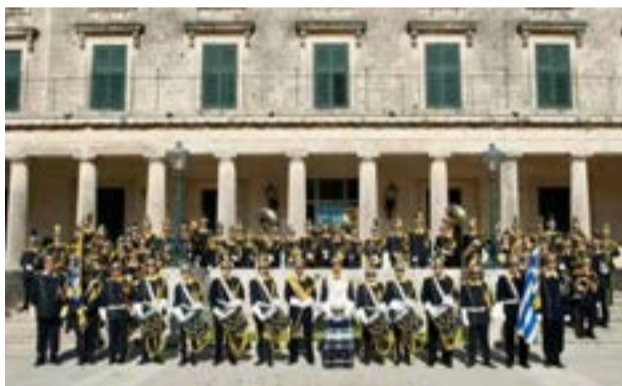
Η Φιλαρμονική Κορακιάνας «Σπύρος Σαμάρας»

ΚΕΡΚΥΡΑ. Πυρκαγιά εκδηλώθηκε λίγο πριν τις 12:00 τα μεσάνυχτα της Κυριακής, σε υπόγειο χώρο ξενοδοχειακής μονάδας στην περιοχή Κομμένο. Η κινητοποίηση της Πυροσβεστικής Υπηρεσίας υπήρξε άμεση, ενώ για λόγους ασφαλείας δόθηκε εντολή για την προληπτική εκκένωση των εγκαταστάσεων του ξενοδοχείου. Για την κατάσβεση της φωτιάς επιχειρήσαν πέντε υδροφόρα οχήματα.