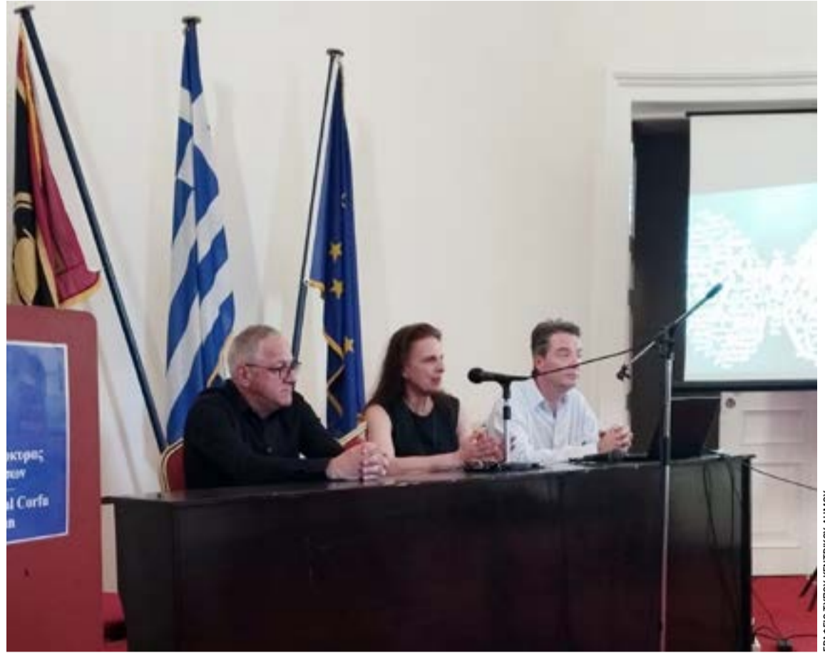
Στιγμιότυπο από την ενημερωτική εκδήλωση της ΕΟΜΙΦΝΕ στην Ιόνιο Βουλή, όπου ειδικοί γαστρεντερολόγοι ενημέρωσαν το κοινό για τις Ιδιοπαθείς Φλεγμονώδεις Νόσους του Εντέρου.