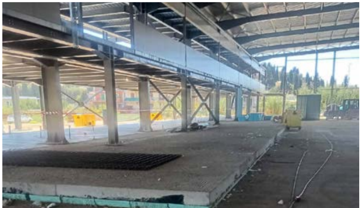
Οι εργασίες στο γήπεδο προχωρούν ικανοποιητικά

ξουμε στο επόμενο «ΕΣΠΑ» εκδηλώνοντας όμως και τον θαυμασμό της για το πλούσιο υλικό «... το οποίο θα γινόταν ένα αξιόλογο μουσείο...!!!».