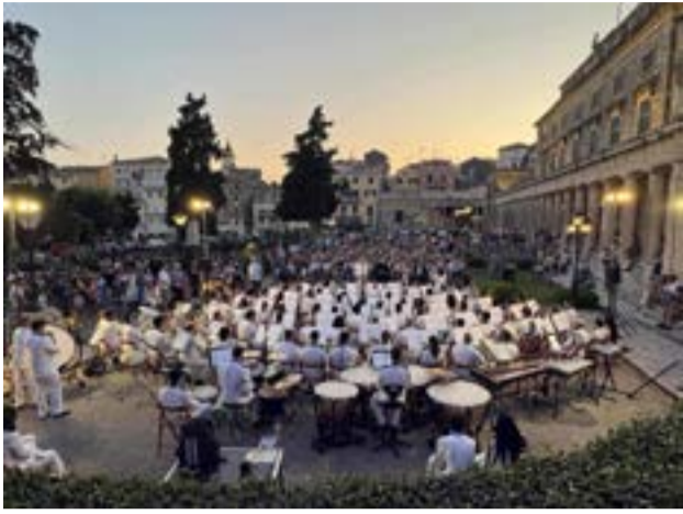
Η ΦΕ Μάντζαρος