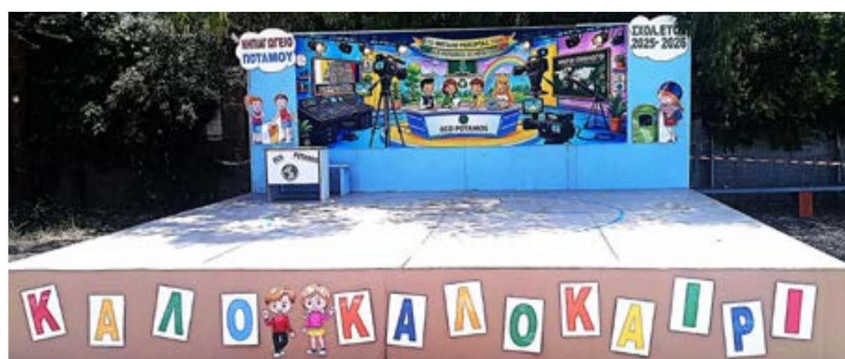
Οι μαθητές ανέβηκαν στη σκηνή ως δημοσιογράφοι, ερευνητές και ενεργοί πολίτες

ΚΕΡΚΥΡΑ. Μια ξεχωριστή οικολογική γιορτή, γεμάτη δημιουργικότητα, τραγούδι και μηνύματα ευαισθητοποίησης για το περιβάλλον, παρουσίασε το Νηπιαγωγείο Ποταμού στην καλοκαιρινή εκδήλωση λήξης της σχολικής χρονιάς, το απόγευμα της Τετάρτης 10 Ιουνίου, αποσπώντας το θερμό χειροκρότημα γονέων, εκπαιδευτικών και επισήμων προσκεκλημένων.