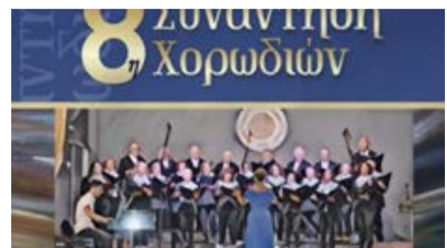
Το βράδυ του Σαββάτου στο Δημοτικό Σχολείο Καναλίων

Ανακοινώνεται το πρόγραμμα διενέργειας εργασιών του 6ου Κύκλου Εφαρμογών Μυοκτονίας στους εξωτερικούς δημόσιους χώρους της Δημοτικής Ενότητας Κερκυραίων, το οποίο θα πραγματοποιηθεί από την Πέμπτη 18 Ιουνίου 2026 έως και το Σάββατο 27 Ιουνίου 2026. Το πρόγραμμα ενδέχεται να τροποποιηθεί ανάλογα με τις επικρατούσες καιρικές συνθήκες ή εάν συντρέξουν άλλοι σοβαροί αστάθμητοι παράγοντες.