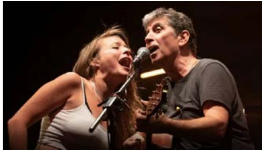
Οι δύο καλλιτέχνες στη σκηνή

Η παρουσία Νέων Καλλιτεχνών, παιδιών και νέων που θα προσφέρουν έργο από τη σκηνή του SEVEN, μαζί με τον κοινωνικό προσανατολισμό της διοργάνωσης ήταν τα φετινά ζητούμενα!