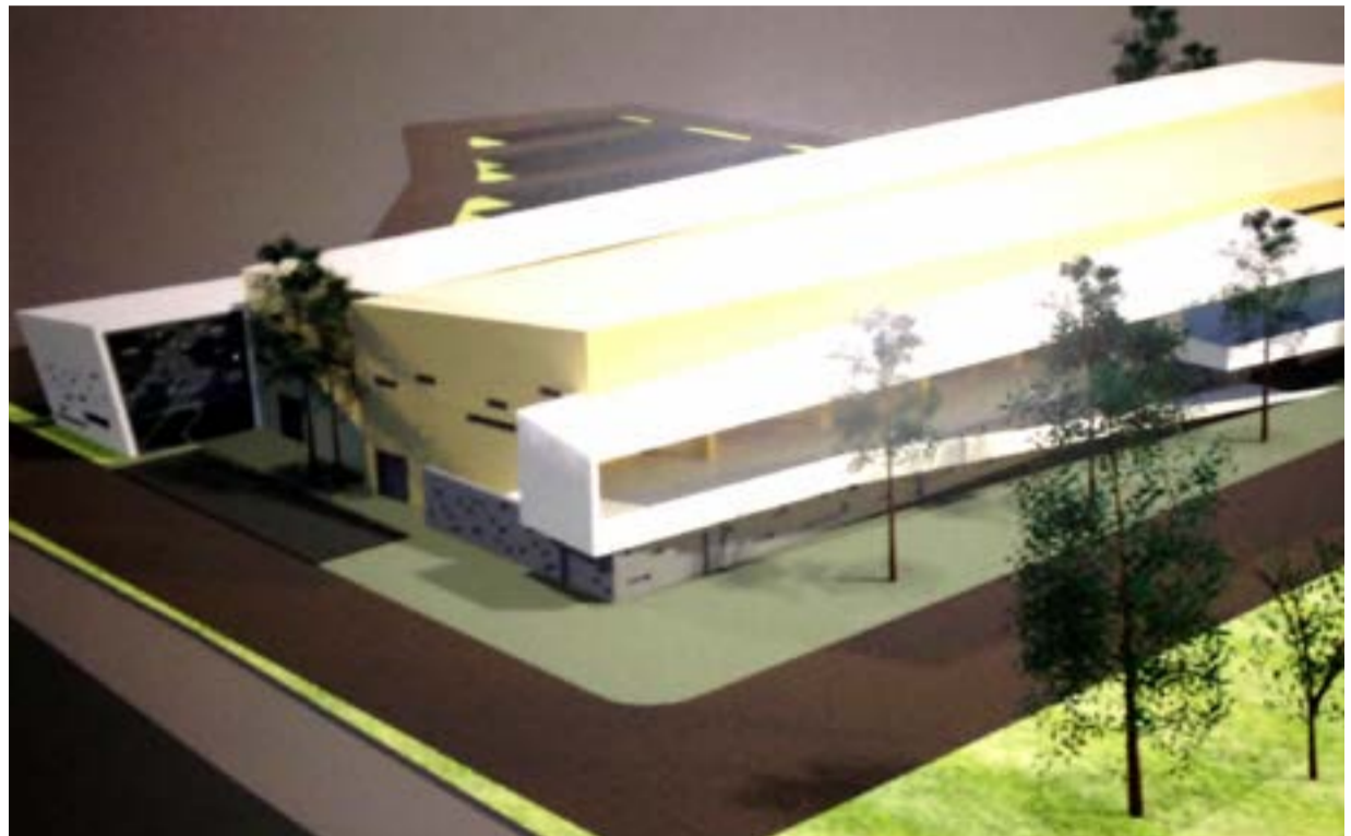
Η μακέτα του γηπέδου στις Αλυκές

Συναντήσαμε τον υπουργό Αθλητισμού κ. Αυγενάκη. Απάντησή του ήταν ότι το έργο «είναι Φαραωνικό για την Κέρκυρα!» (προϋπολογισμού 5,4 εκατομμύρια). Συναντήσαμε την Περιφερειάρχη κα Κράτσα. Την φιλοξενήσαμε στον Κερκυραϊκό και στην πλούσια τροπαιοθήκη μας. Πήραμε ένα «ΘΑ» το εντά-