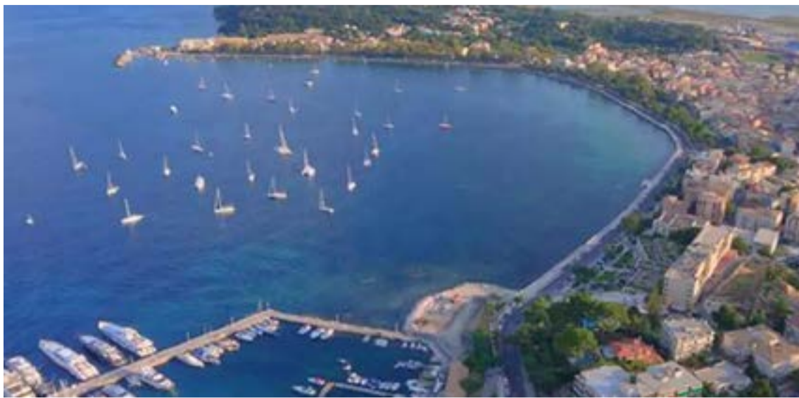
Η αξιοποίηση της Σπηλιάς παραμένει στο τραπέζι, ενώ η οριστική παραχώρηση του χώρου του ΝΑΟΚ στον ιστορικό Όμιλο εξακολουθεί να εκκρεμεί. Χωρίς ένα δημόσια διατυπωμένο σχέδιο για τη σχέση της Κέρκυρας με τη θάλασσά της, τα ερωτήματα για τις προτεραιότητες και τις ισορροπίες ανάμεσα στο δημόσιο συμφέρον, τον ναυταθλητισμό και την τουριστική ανάπτυξη πληθαίνουν.