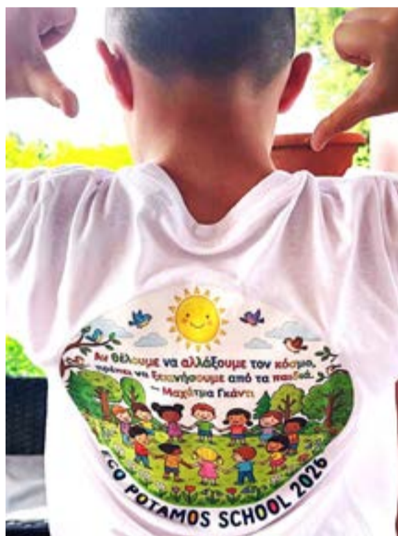
Με λευκές μπλούζες που αποτύπωναν τον ρόλο του καθενός και το κοινό σύνθημα της εκδήλωσης, οι μαθητές έκλεψαν τις εντυπώσεις στη γιορτή λήξης της σχολικής χρονιάς