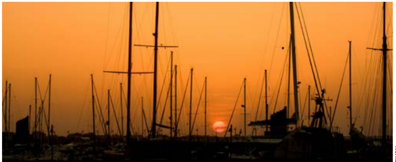
Η Κέρκυρα διαμορφώνει συνειδητά ένα νέο μοντέλο για το παραλιακό της μέτωπο και δεν το έχει ακόμη εξηγήσει στους πολίτες ή απλώς οι αποφάσεις λαμβάνονται αποσπασματικά, δημιουργώντας την εντύπωση ενός σχεδίου που κανείς δεν ομολογεί ότι υπάρχει;

Αν η απάντηση είναι το δεύτερο, τότε οι πόλεις παύουν σταδιακά να ανήκουν στους ανθρώπους που τις κατοικούν. Γίνονται σκηνικά κατανάλωσης, χώροι διέλευσης κεφαλαίων και εμπειριών, όπου ο μόνιμος κάτοικος μετατρέπεται σε κομπάρσο της ίδιας του της ζωής. Αν όμως η πολιτική τολμήσει να προηγηθεί, να σχεδιάσει, να λογοδοτήσει και να θέσει όρια, τότε η ανάπτυξη μπορεί να αποκτήσει νόημα πέρα από τους δείκτες και τις αποδόσεις: ως βελτίωση της ζωής των ανθρώπων. Γιατί ο σκοπός της πολιτικής δεν είναι να υπηρετεί την αγορά. Είναι να υπηρετεί την κοινωνία. Και μόνο μέσα από αυτή τη σειρά προτεραιοτήτων μπορεί η αγορά να γίνει εργαλείο ευημερίας και όχι δύναμη που αναδιατάσσει αδιαμαρτύρητα τον κόσμο γύρω μας.