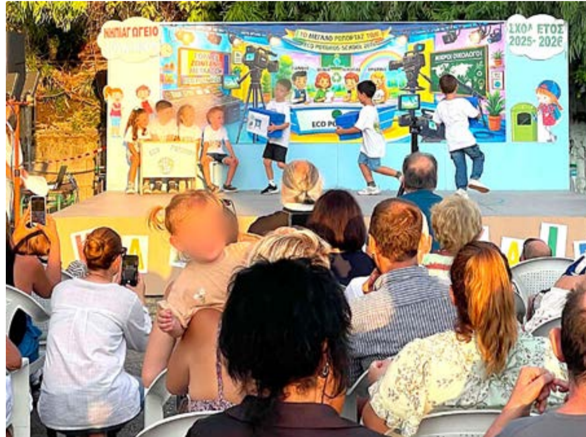
Από τη γιορτή του νηπιαγωγείου Ποταμού