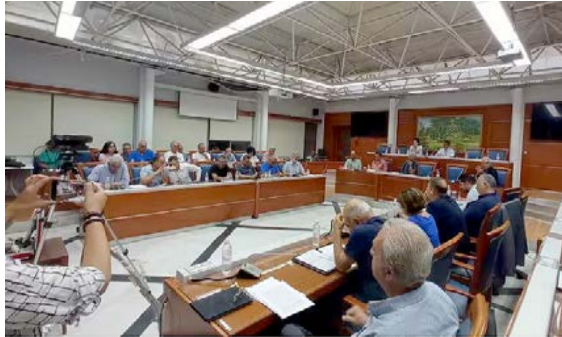
Συνεδριάζει στις 19:00, το Δημοτικό Συμβούλιο Κεντρικής Κέρκυρας και Διαποντίων Νήσων, με πρώτο θέμα την έγκριση εκκίνησης της διαδικασίας για την υποβολή αίτησης του Δήμου για τη δημιουργία ελεγχόμενου αγκυροβολίου με ναύδετα.

στην καθημερινότητα. Μέσα από απλές πρακτικές και στιγμές χαλάρωσης, μπορούμε να ανακαλύψουμε ξανά τη δύναμη που κρύβεται μέσα μας. Ας γιορτάσουμε μαζί μια ημέρα γεμάτη θετικότητα, γαλήνη και ευγνωμοσύνη. Την Κυριακή 21/06/26, στην Πάνω Πλατεία στις 09:00