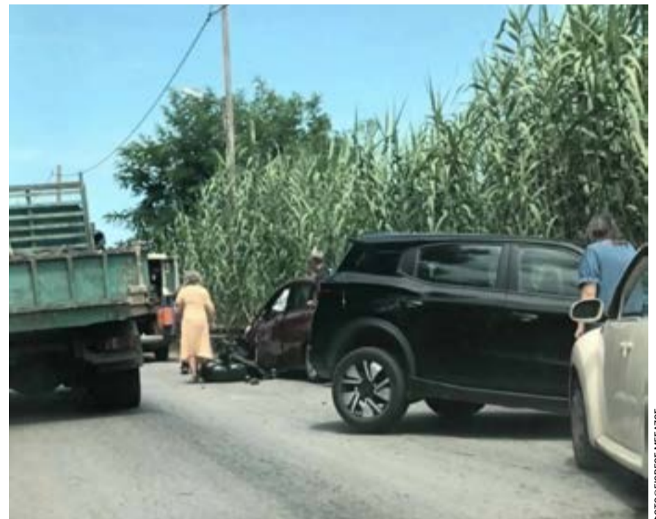
Λίγα λεπτά μετά το ατύχημα

Η προειδοποίηση είναι εδώ. Το ερώτημα είναι αν θα την ακούσουμε πριν η αγανάκτηση μετατραπεί οριστικά σε παραίτηση ή σε τυφλή απόρριψη των πάντων. Γιατί τότε δεν θα έχει καταρρεύσει μόνο το δίκτυο ύδρευσης. Θα έχει διαρραγεί ο ίδιος ο δεσμός εμπιστοσύνης που κρατά όρθια μια κοινωνία.