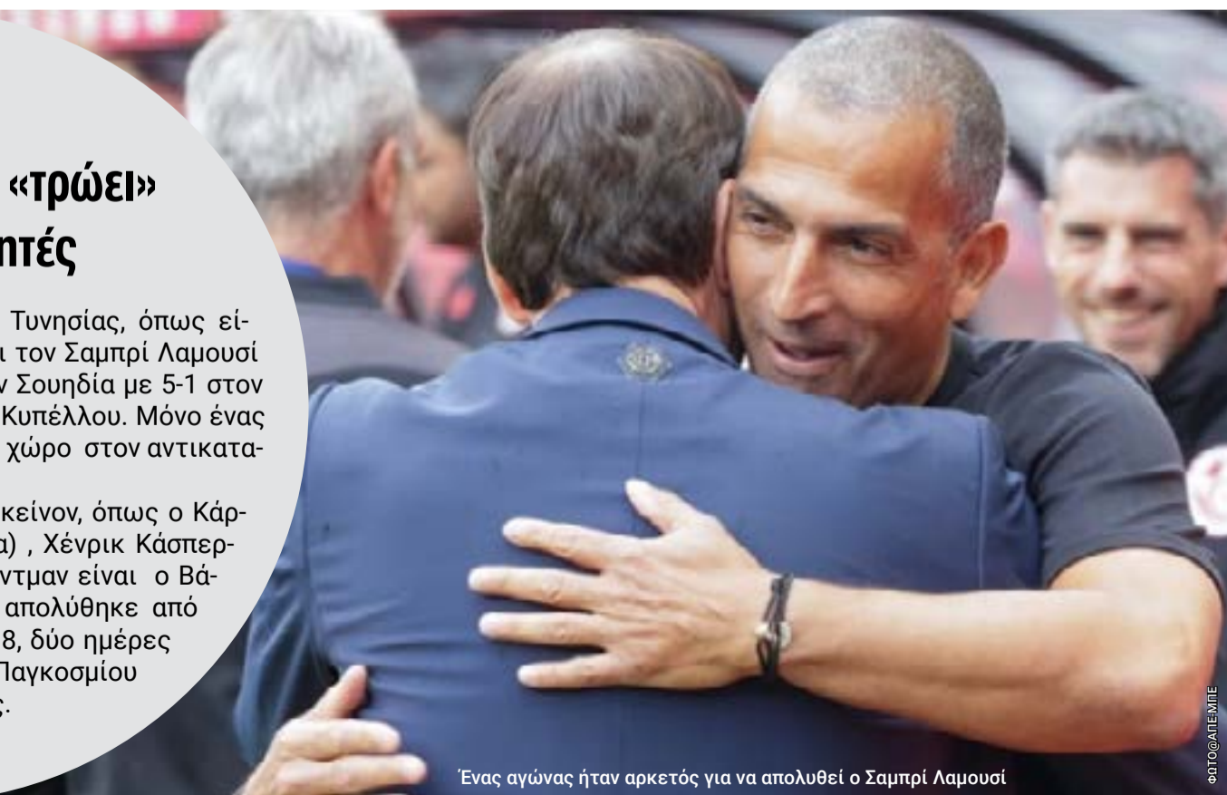
Ένας αγώνας ήταν αρκετός για να απολυθεί ο Σαμπρί Λαμουσί

Είχαν προηγηθεί άλλοι πριν από εκείνον, όπως ο Κάρλος Αλμπέρτο Παρέιρα (Βραζιλία), Χένρικ Κάσπερτακ, (Πολωνία). Ωστόσο ρέκορντμαν είναι ο Βάσκο Χουλέν Λοπετέγκι που απολύθηκε από την Εθνική Ισπανίας το 2018, δύο ημέρες πριν από την έναρξη του Παγκοσμίου Κυπέλλου της Ρωσίας.