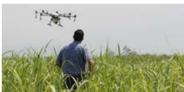
Για ένα καλοκαίρι με λιγότερα κουνούπια