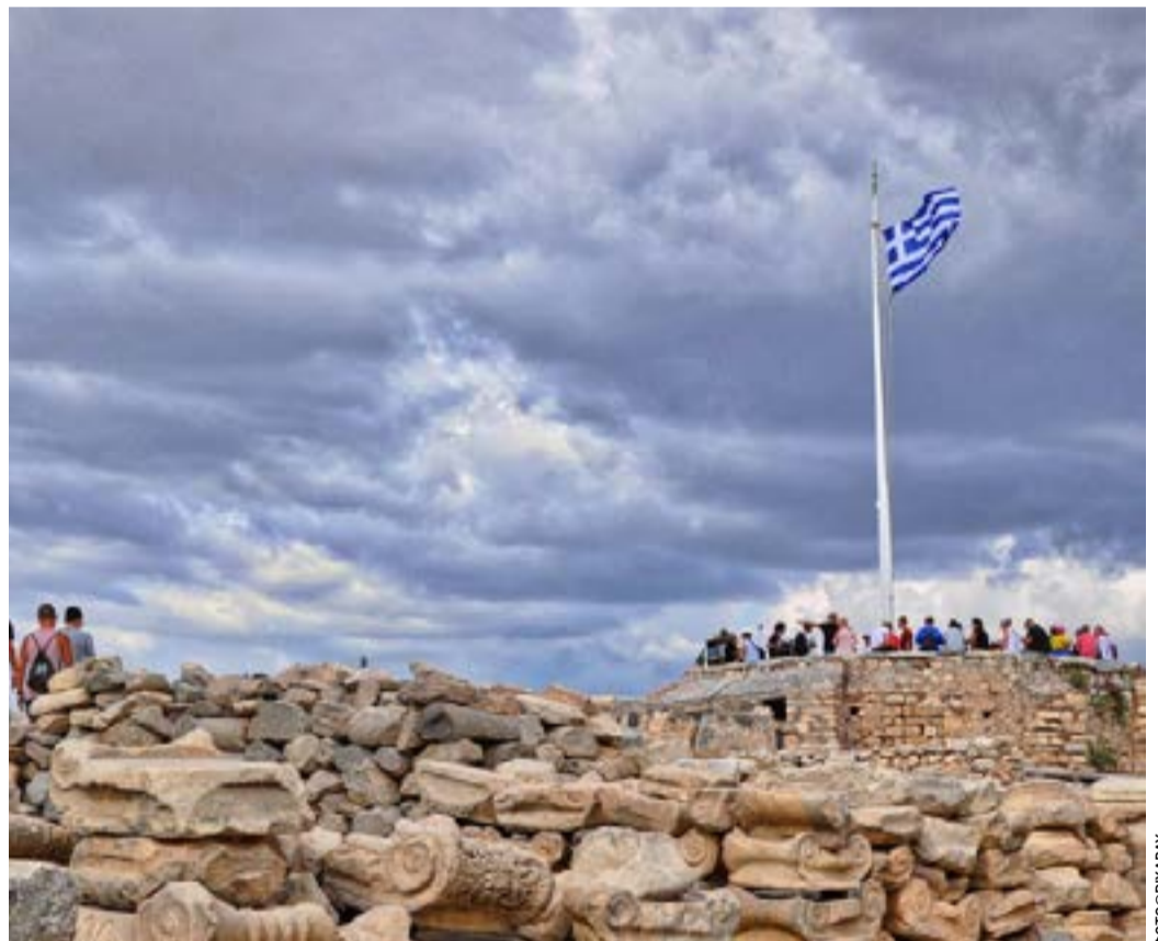
Οι εισπράξεις του πρώτου τετραμήνου του 2026 είναι αυξημένες κατά 37% σε σχέση με το αντίστοιχο διάστημα του 2025

Και τα κληροδοτήματα δεν μπορούν να λειτουργούν ως αθέατα κέντρα ισχύος. Οφείλουν να λειτουργούν στο φως.