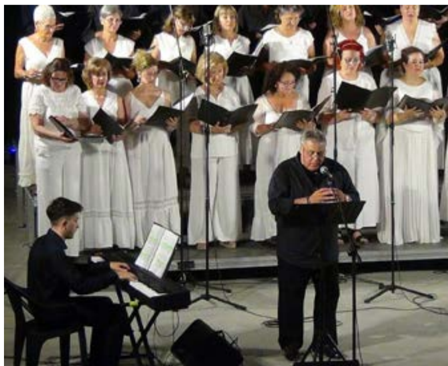
Το κοινό κατέκλυσε το θέατρο και χειροκρότησε θερμά τους καλλιτέχνες