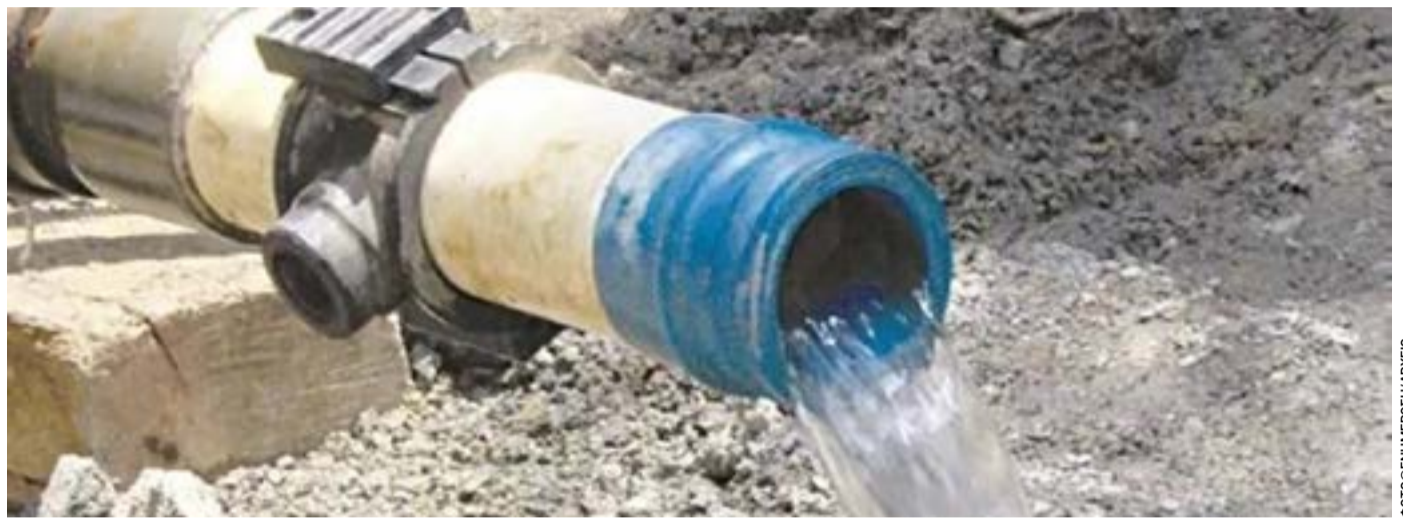
Η ΔΕΥΑΚ ζητά τη συνδρομή εξειδικευμένου συνεργείου από τη Λάρισα

Σε επικοινωνία της "Ε" με υπεύθυνο της ΔΕΥΑ Βόρειας Κέρκυρας, έγινε γνωστό ότι το πρόβλημα οφείλεται σε έναν συνδυασμό τεχνικών βλαβών και αυξημένης ζήτησης. Συγκεκριμένα, υπάρχει καμένη αντλία που πρέπει να αντικατασταθεί, καθώς και βουλωμένοι σωλήνες στο δίκτυο που βρίσκονται σε φάση επισκευής. Παράλληλα, λόγω της περιόδου, η κατανάλωση νερού έχει αυξηθεί σημαντικά, με αποτέλεσμα το δίκτυο να μην μπορεί να