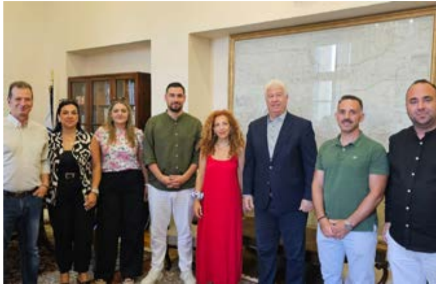
Από τη συνάντηση με το ΔΣ της Φιλαρμονικής Αγ. Ματθαίου

Κατά τη διάρκεια της συνάντησης συζητήθηκαν ζητήματα που αφορούν στη λειτουργία και τη δράση της Φιλαρμονικής, καθώς και ευρύτερα θέματα πολιτιστικού ενδιαφέροντος, μεταξύ των οποίων το Διεθνές Φεστιβάλ Φιλαρμονικών Ιονίων Νήσων που διοργανώνει η Περιφέρεια Ιονίων Νήσων, αλλά και οι πολιτιστικές εκδηλώσεις που έχουν προγραμματιστεί το επόμενο δι-