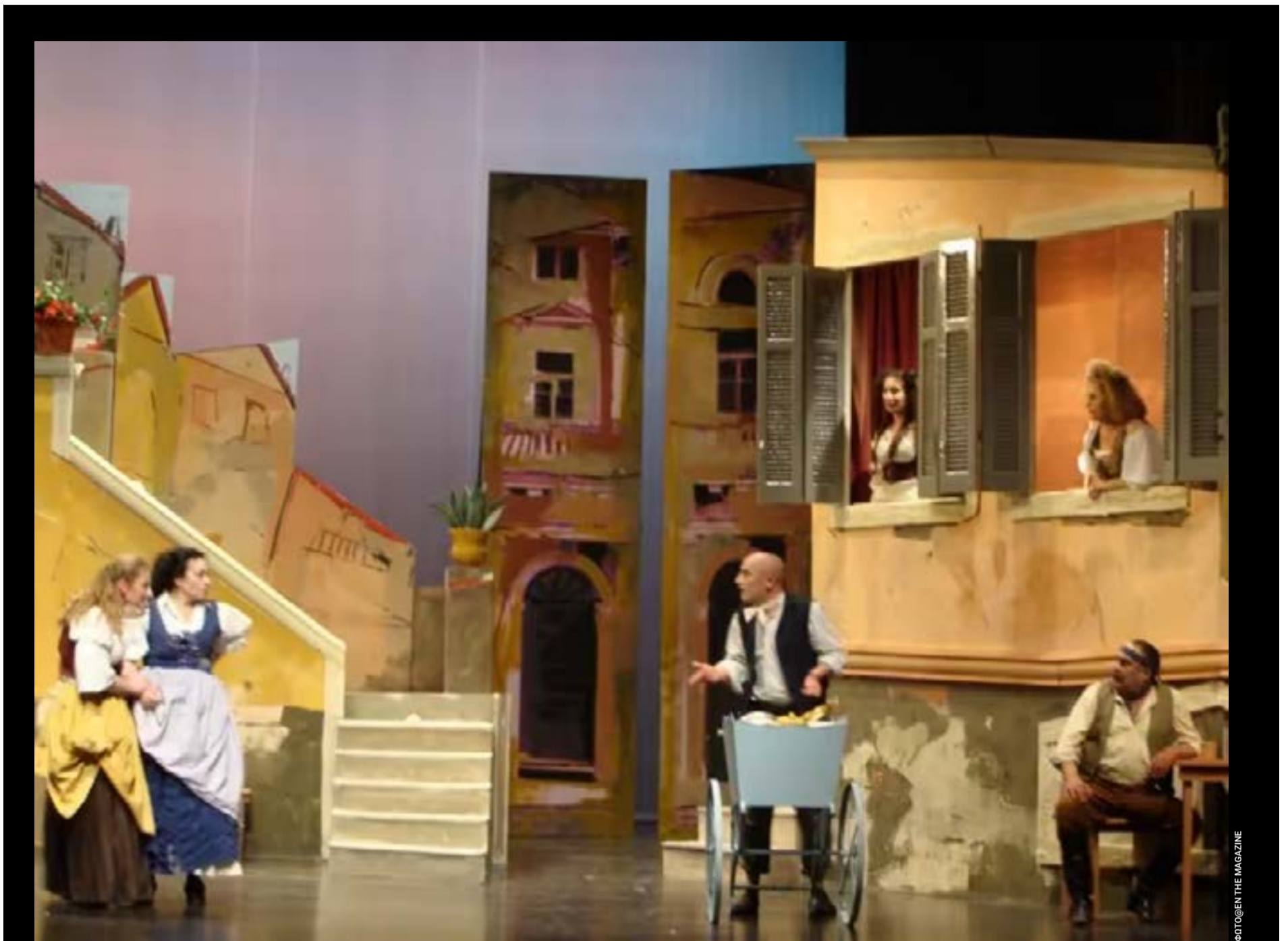
Σκηνή από την παράσταση