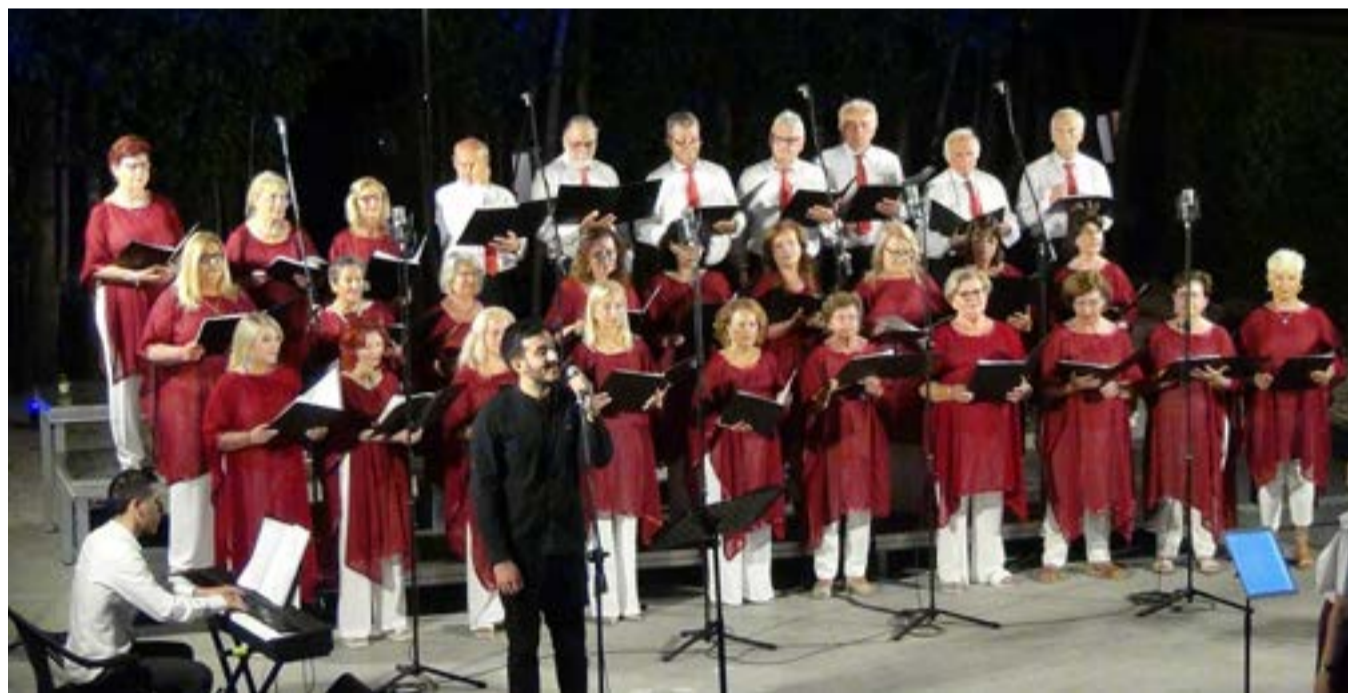
Οι καλλιτέχνες δημιούργησαν μια μαγική καλοκαιρινή βραδιά