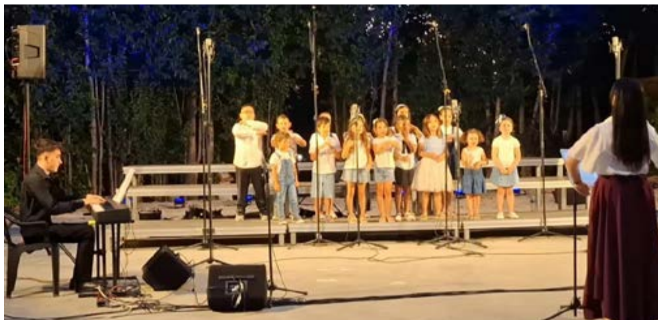
Η Δημοτική Παιδική Χορωδία

Μεγάλη προσέλευση κοινού και συγκινητικές ερμηνείες στο Θέατρο «Ρένα Βλαχοπούλου».