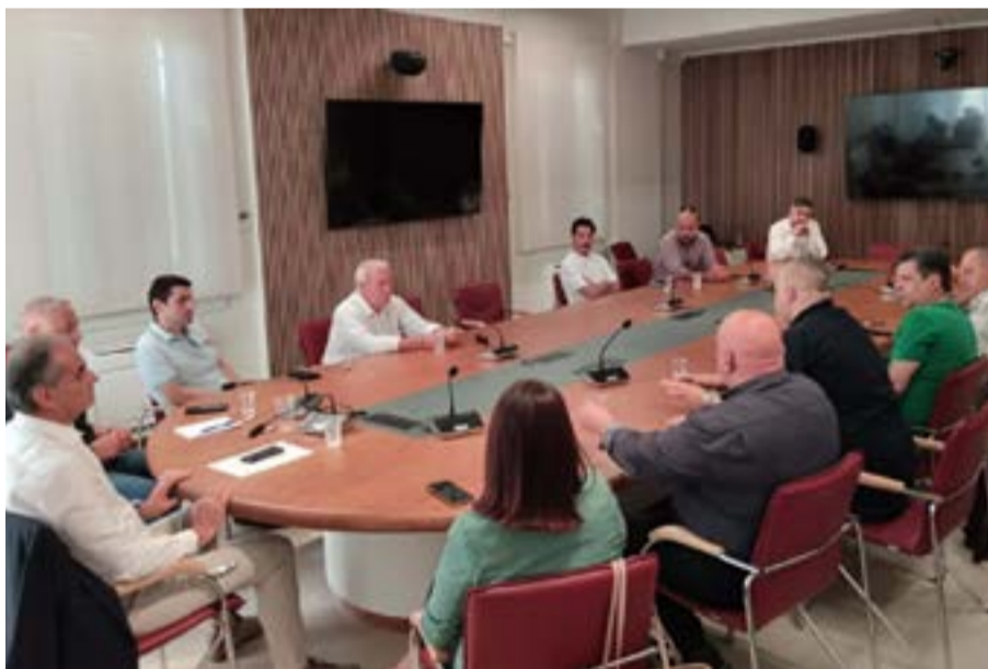
Από τη χθεσινή σύσκεψη στο Επιμελητήριο, με θέμα το φεστιβάλ

Η συνάντηση επιβεβαίωσε την κοινή πεποίθηση ότι ο πολιτισμός αποτελεί ισχυρό πυλώνα κοινωνικής συνοχής, δημιουργίας και εξωστρέφειας για τα Ιόνια Νησιά.