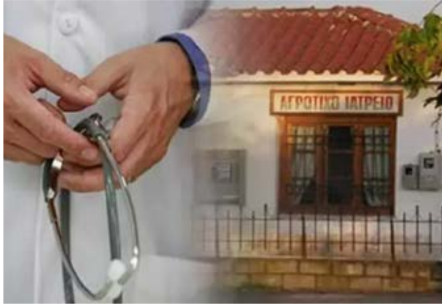
Η ΛΑΣΥ φέρνει το θέμα στη συμμετρική συνεδρίαση του Περιφερειακού Συμβουλίου από το 2016.

ΚΕΡΚΥΡΑ. Την έντονη διαμαρτυρία της για τη στάση της Περιφερειακής Αρχής στο ζήτημα της καταβολής του επιδόματος σίτισης-στέγασης στους αγροτικούς γιατρούς εκφράζει η παράταξη της Λαϊκής Συσπείρωσης στο Περιφερειακό Συμβούλιο Ιονίων Νήσων. Με επιστολή της προς τον περιφερειάρχη και την πρόεδρο του Περιφερειακού Συμβουλίου, καταγγέλλει ότι αίτημα που υπέβαλε στις 11 Ιουνίου για συζήτηση του θέματος εντός ημερήσιας διάταξης της συνεδρίασης δεν συμπεριλήφθηκε στα προς συζήτηση ζητήματα. Η παράταξη χαρακτηρίζει το θέμα «σοβαρό και κατεπείγον», υποστηρίζοντας ότι οι χειρισμοί της Περιφερειακής Αρχής έχουν προκαλέσει σύγχυση και αβεβαιότητα στους ενδιαφερόμενους γιατρούς σχετικά με την καταβολή του επιδόματος, το οποίο, όπως σημειώνει, προβλέπεται