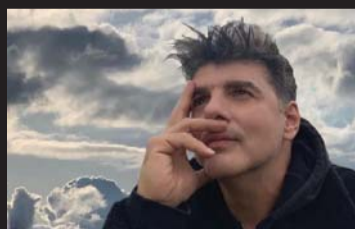
ΕΝΗΜΕΡΩΣΗ/EN THE MAGAZINE

ΚΕΡΚΥΡΑ. Το εμβληματικό «Le Baruffe Chiozzotte», του μέγιστου Carlo Goldoni, αναβιώνει διασκευασμένο στο Μον Ρεπος Ιούλιο και Αύγουστο, ξηπνώντας... μνήμες «Καμπιέλου». Ο ΗΛΙΑΣ ΑΛΕΞΟΠΟΥΛΟΣ. ΣΕΛΙΔΕΣ 12&13.