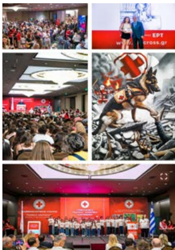
Στιγμιότυπα από την τελετή βράβευσης στην Αθήνα