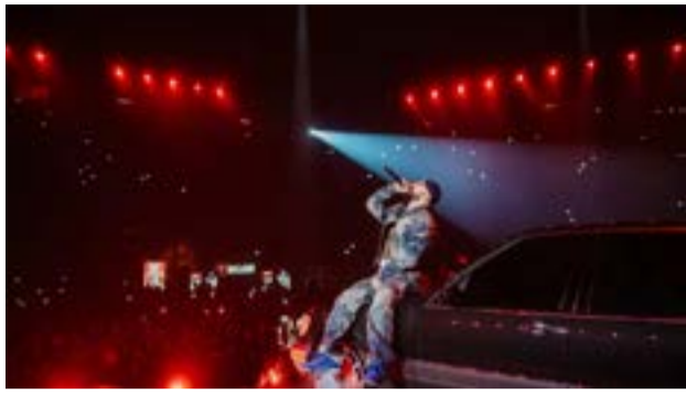
Ο Τοqueel στη σκηνή