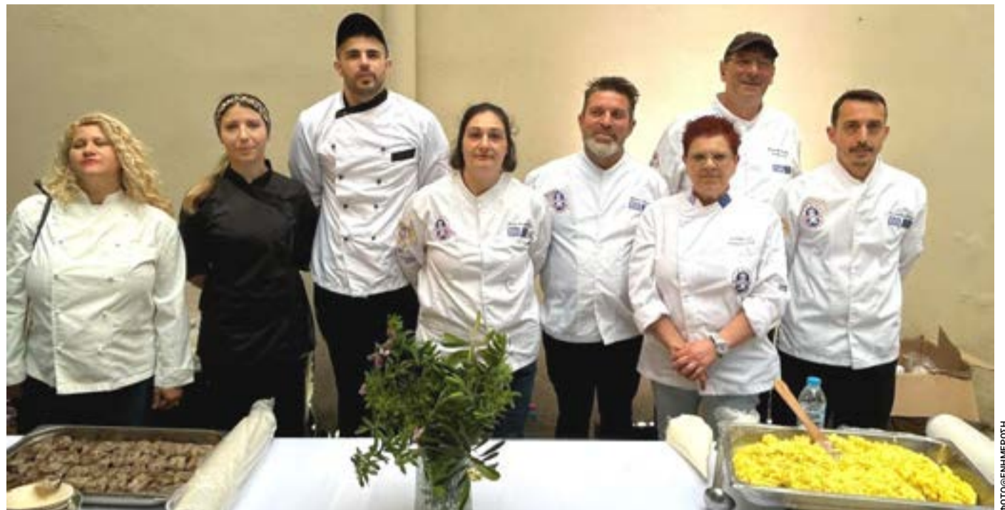
Ομάδα Κερκυραίων μελών της Λέσχης Αρχιμαγείρων, που πρωτοστατεί ετησίως εδώ και μια σχεδόν δεκαετία στη διατήρηση ενός επιτυχημένου θεσμού, που η διοίκηση του Επιμελητηρίου αγνόησε επιδεικτικά.