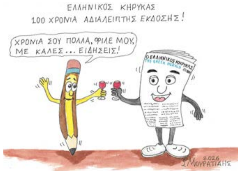
Σκίτσο του Σπ. Μουρατίδη για τα 100 χρόνια της εφημερίδας

Δημοσίευε αφίσες πλοίων, αγγελίες εργασίας, γεννήσεις και θανάτους, ενώ παράλληλα κατέγραφε τις πολιτικές εξελίξεις τόσο στην Ελλάδα όσο και