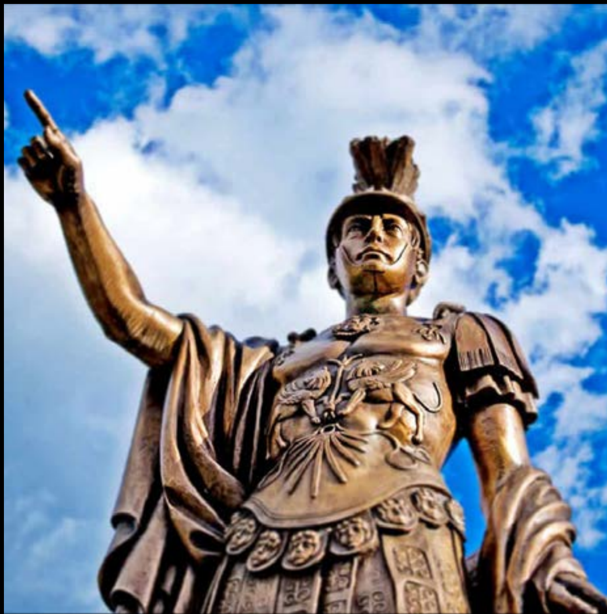
Ο ανδριάντας του Πύρρου στην Άρτα

Ο Πλούταρχος μάς παραδίδει και την ενδιαφέρουσα (εξ επόψεως ηθικο-φιλοσοφικής!) συνομιλία του Πύρρου με τον σύμβουλό του τον Κινέα. Ο Κινέας ρώτησε τον Πύρρο τι θα έκανε αφού νικούσε τους Ρωμαίους. Ο Πύρρος απάντησε ότι τότε θα κατακτούσε τη Σικελία. «Και μετά;» ρώτησε ο Κινέας. «Μετά θα στραφούμε προς την Καρχηδόνα και τις αφρικανικές κτήσεις της». «Και μετά;» «Μετά θα επιστρέψουμε στην Ελλάδα για να ζήσουμε ήσυχα με τους φίλους μας». Και τότε ο Κινέας τον ρώτησε: «Τι δή κωλύει νυν ευχέσθαι και συνόντας αλληλοίς ηδέως διάγειν;» «Και γιατί, αφού αυτός είναι ο τελικός σκοπός, να μην απολαύσουμε από τώρα την ηρεμία και την συντροφιά των φίλων μας, αντί να περάσουμε από τόσους κινδύνους και πολέμους;»