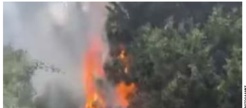
Η άμεση επέμβαση της Πυροσβεστικής αποσόβησε τον κίνδυνο

Ο δήμαρχος μετατρέπεται έτσι στην ασπίδα του κράτους. Συγκεντρώνει τη μήνη των δημοτών, απορροφώντας το πολιτικό κόστος για ανεπάρκειες που συχνά δεν ελέγχει. Είναι ένας βολικός μηχανισμός εκτόνωσης της κοινωνικής δυσάρεσκειας, αλλά όχι μια συνταγή για ισχυρή αυτοδιοίκηση.