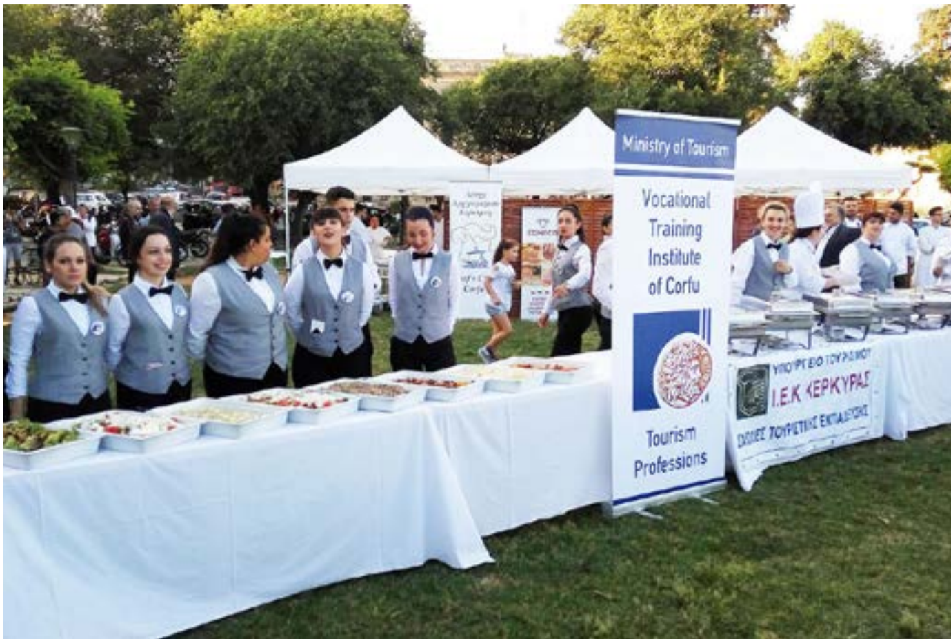
Από τις εκδηλώσεις του κερκυραϊκού φεστιβάλ Γαστρονομίας που αγνοήθηκε επιδεικτικά

Η παραγωγή είναι του ΔΗ.ΠΕ.ΘΕ. Κέρκυρας - 2026