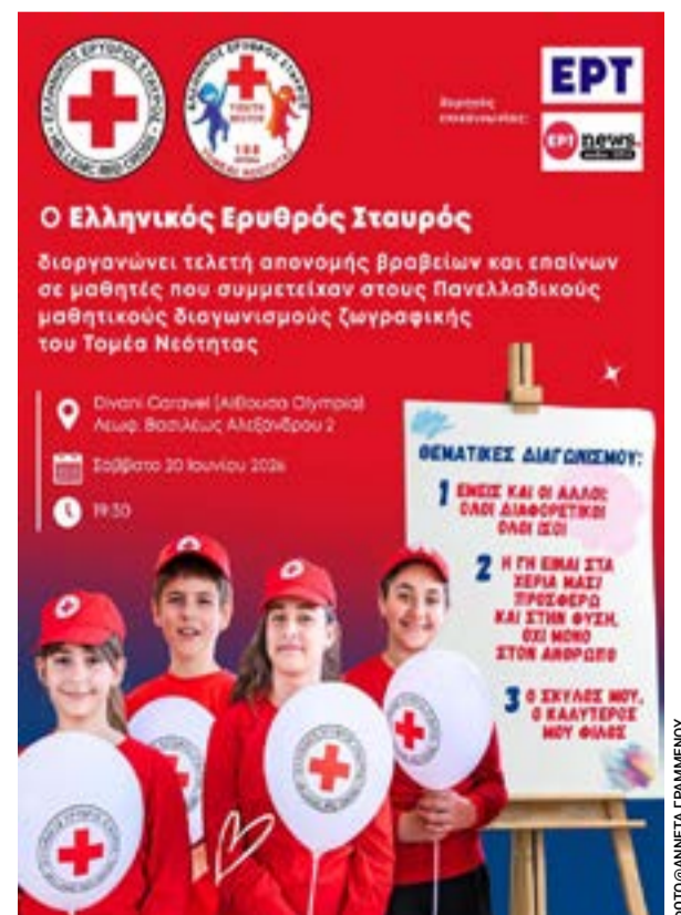
Η αφίσα του Ερυθρού Σταυρού