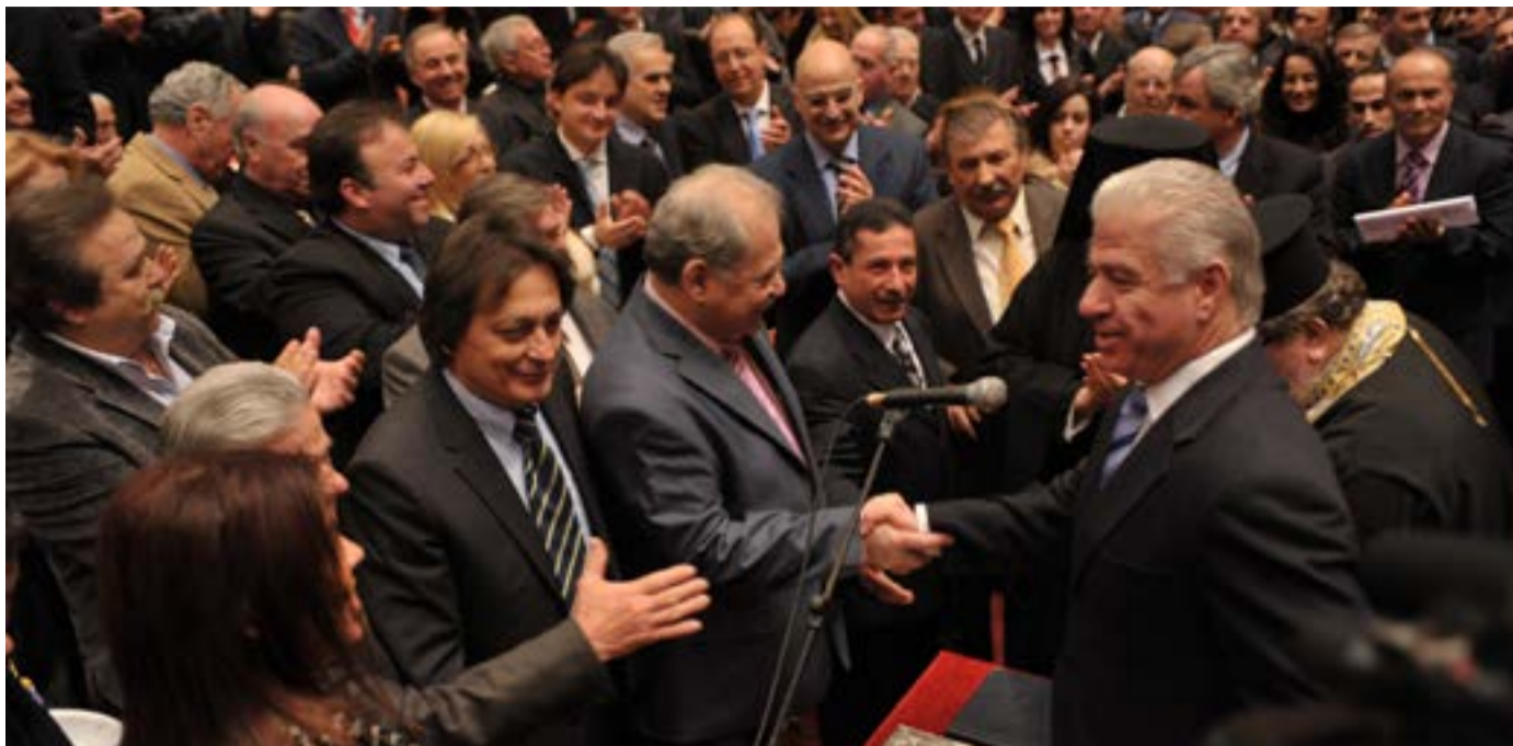
Συνήθως τα πράγματα μετά τις τοπικές εκλογές ξεκινούν κάπως έτσι....