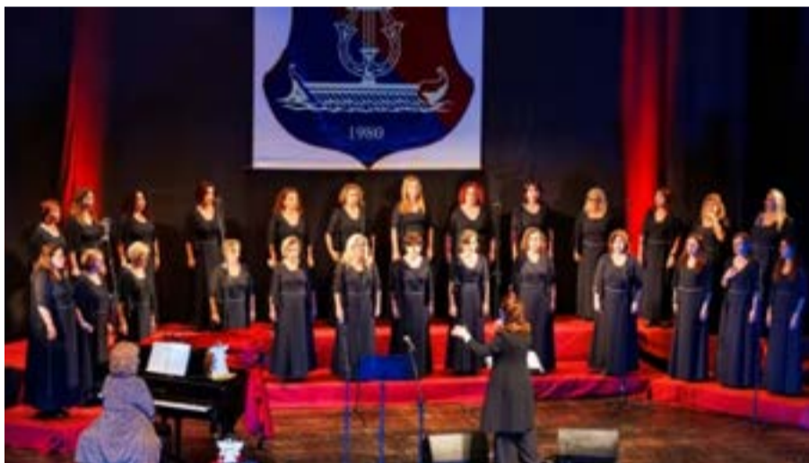
Η Γυναικεία Χορωδία Κέρκυρας