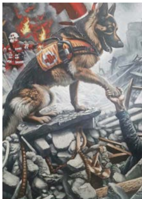
Το έργο της Κατερίνας που εντυπωσίασε