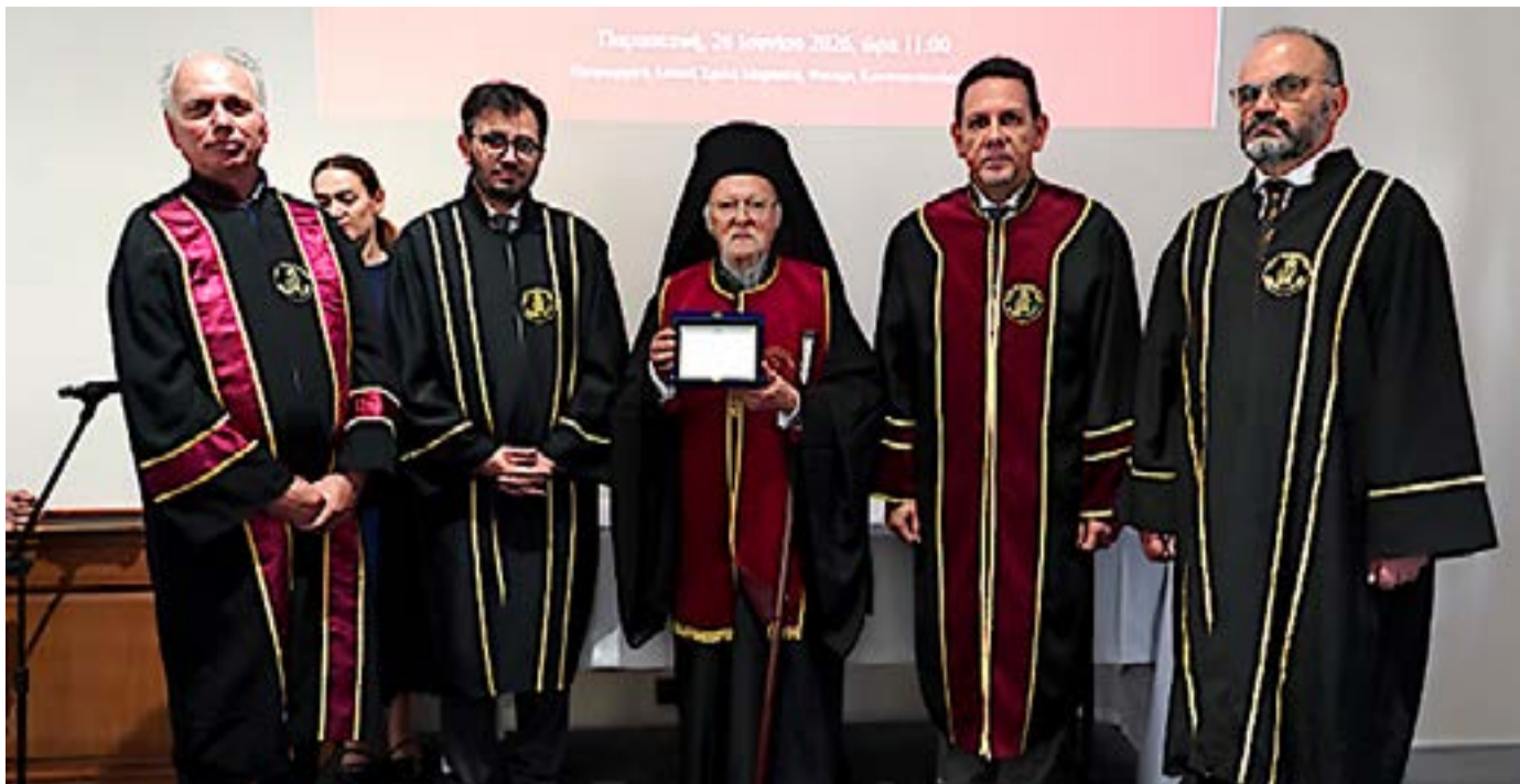
Ο Οικουμενικός Πατριάρχης Βαρθολομαίος αναγορεύτηκε Επίτιμος Καθηγητής του Τμήματος Περιβάλλοντος του Ιονίου Πανεπιστημίου, σε τελετή που πραγματοποιήθηκε στην Πατριαρχική Αστική Σχολή Μαρασλή στο Φανάρι, με επίκεντρο το μήνυμα για την προστασία του περιβάλλοντος και την αντιμετώπιση της κλιματικής κρίσης.

Με απόλυτη επιτυχία ολοκληρώθηκε χθες το μεσημέρι η σύνθετη επιχείρηση στη λίμνη Πηγών Αώου για την ανέλκυση του πυροσβεστικού ελικοπτέρου, το οποίο είχε πέσει στα νερά την προηγούμενη εβδομάδα. Οι δύτες κατάφεραν να δέσουν και να ανασύρουν το βαρύ αεροσκάφος από τον βυθό χωρίς περαιτέρω προβλήματα.