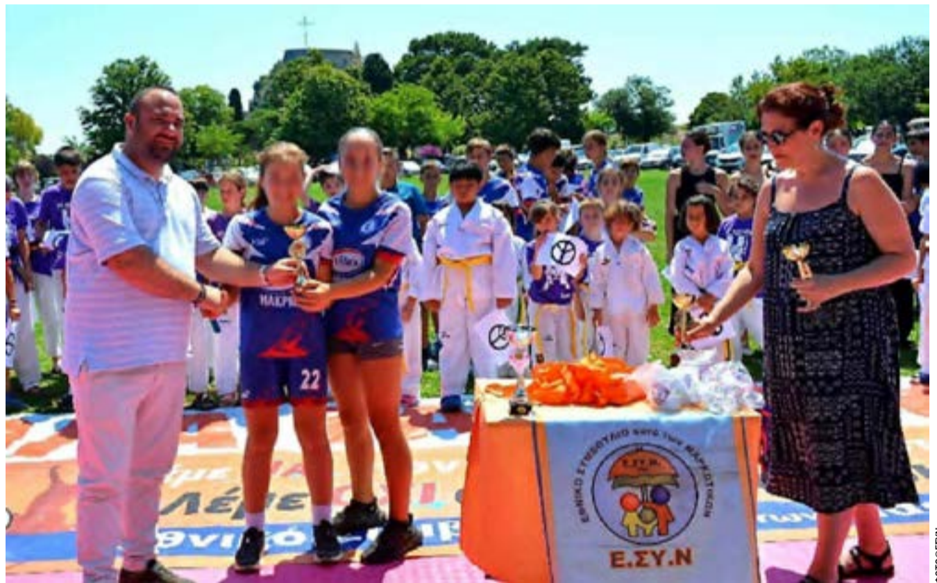
Από τις απονομές των επάθλων