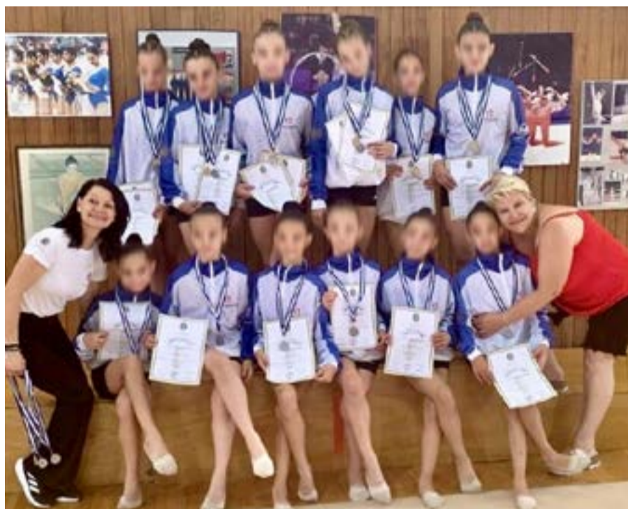
Εξαιρετική εμφάνιση από τα κορίτσια του ΓΟΚ στο ανασάμπλ Κορασίδων - Παγκορασίδων

Με εξαιρετικές εμφανίσεις και σημαντικές διακρίσεις ολοκλήρωσε τη συμμετοχή του ο Γυμναστικός Όμιλος Κέρκυρας στον Περιφερειακό Αγώνα Ρυθμικής Γυμναστικής Ensemble Γ' - Δ' Κατηγοριών (Κορασίδων - Παγκορασίδων) Β' Περιφέρειας, που πραγματοποιήθηκε το Σάββατο 27 Ιουνίου 2026 στο Εθνικό Κλειστό Γυμναστήριο Μίκρας Θεσσαλονίκης, "Ιωάννης Μελισσανίδης".