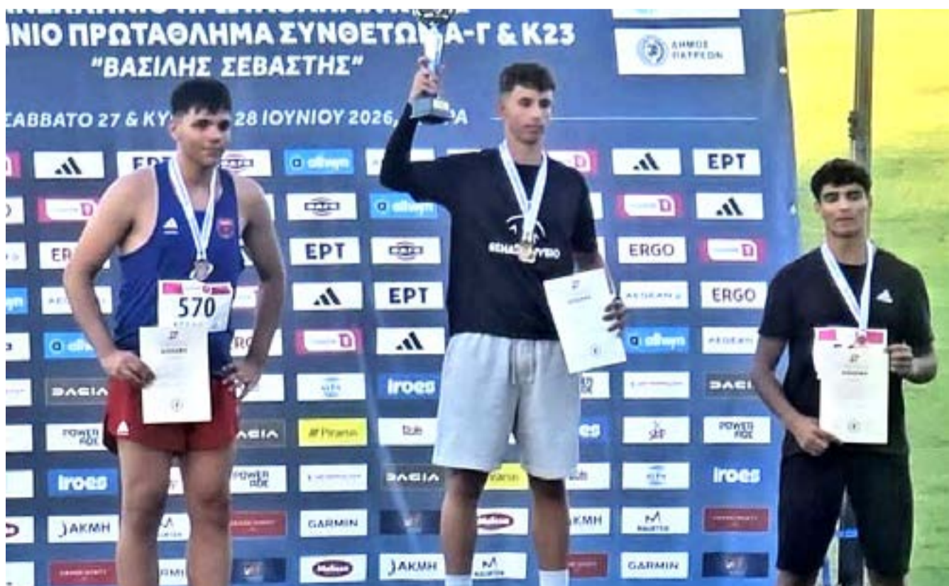
Ασυναγώνιστος στον ακοντισμό ο Χαρίλαος Βασιλείου, έκανε δύο φορές ατομικό ρεκόρ και κατέκτησε το χρυσό μετάλλιο