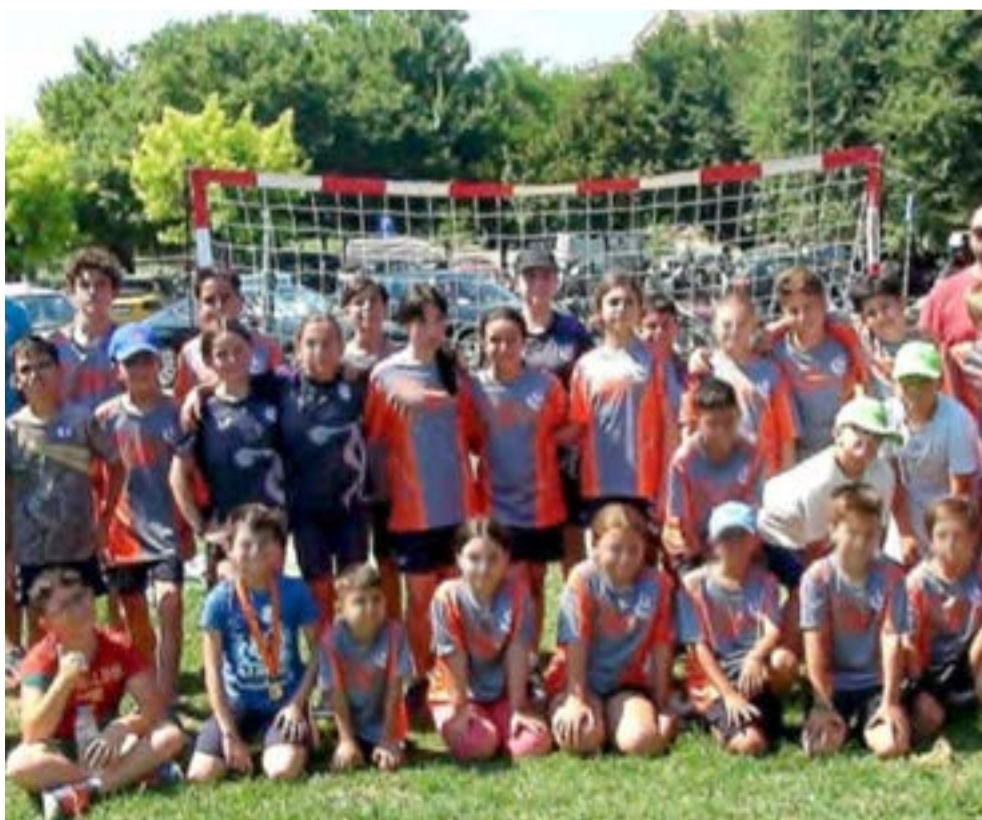
Οι θεατές απόλαυσαν το χάντμπολ στο γρασίδι