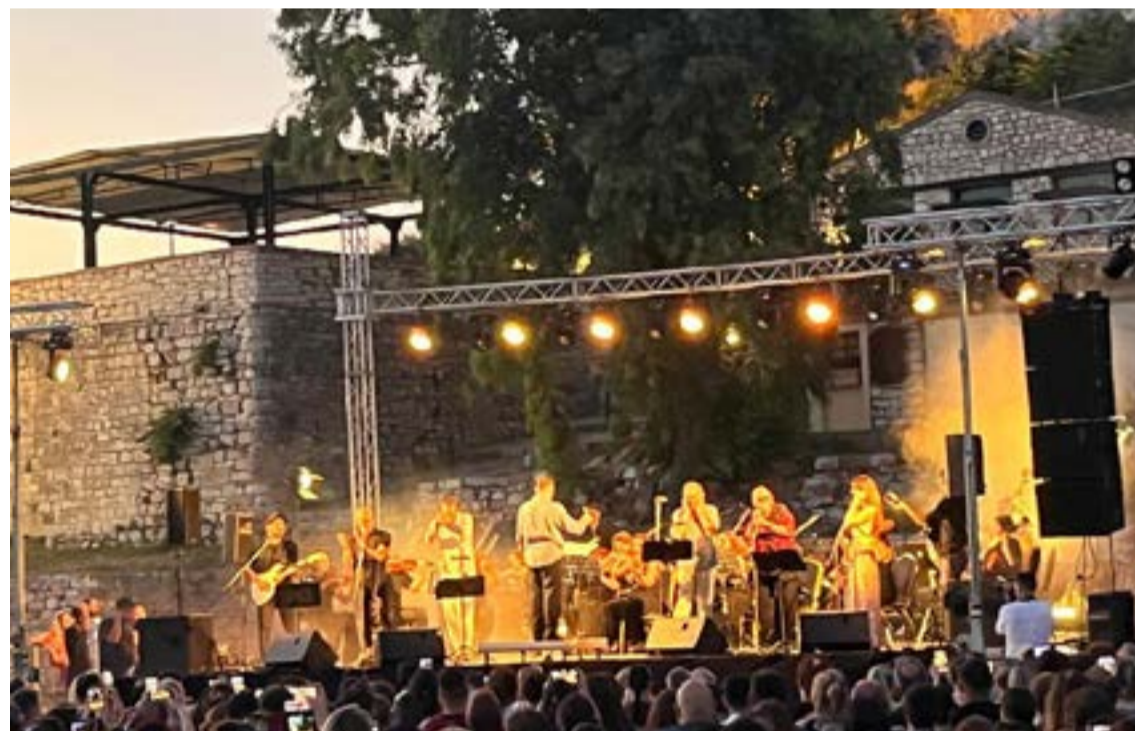
Όλοι οι καλλιτέχνες επί σκηνής

Η συναυλία τελούσε υπό την αιγίδα της Βουλής των Ελλήνων και του Ελληνικού Οργανισμού Τουρισμού.