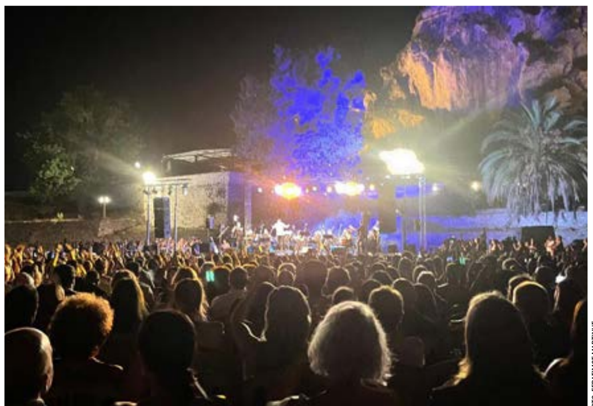
Πλήθος Κερκυραίων παρακολούθησε τη συναυλία στο Παλαιό Φρούριο