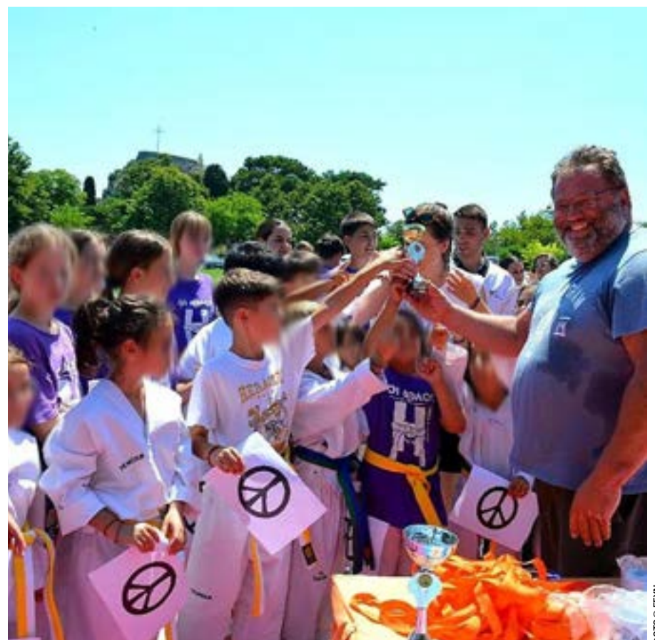
Ο πρόεδρος του Εργατικού Κέντρου Στ. Πελάης