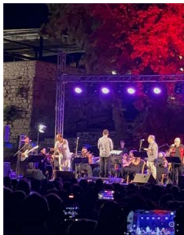
Η συναυλία έβαλε «κόκκινο στη νύχτα»