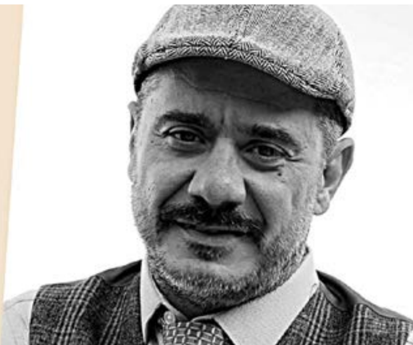
ΦΩΤΟ: ΠΑΝΟΣ ΜΟΥΧΤΕΡΟΣ-ΕΚΔΟΣΕΙΣ ΚΑΣΤΑΝΙΩΤΗ

Ο συγγραφέας και το εξώφυλλο του βιβλίου