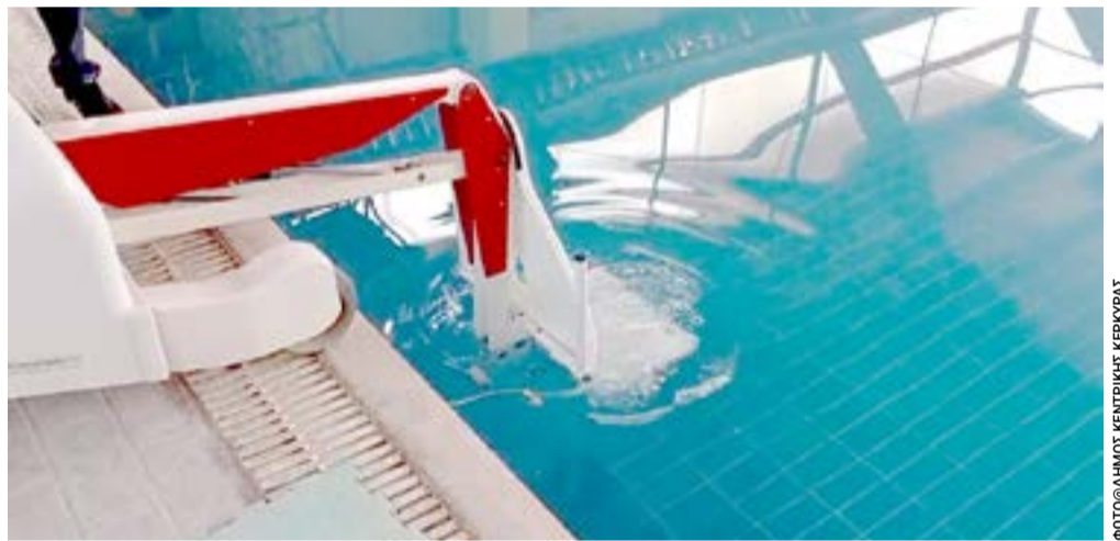
Το αναβατόριο στην πισίνα του ΕΑΚΚ

* Η σύμπτωση με πρόσωπα και πράγματα δεν είναι καθόλου τυχαία.