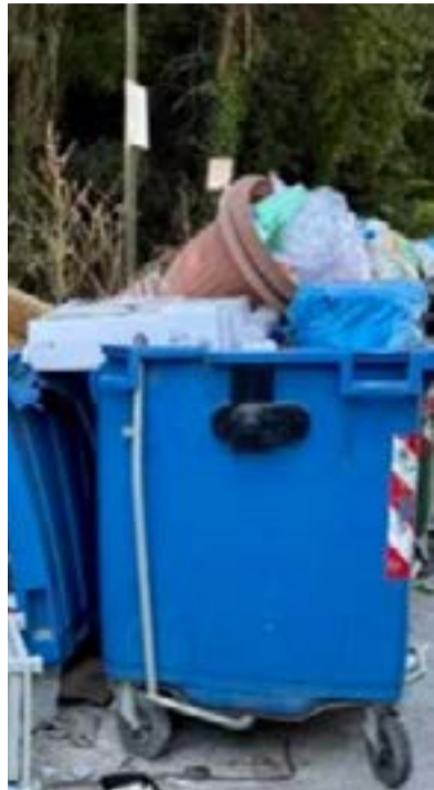
Όχι άλλες τέτοιες εικόνες, λέει ο δήμος