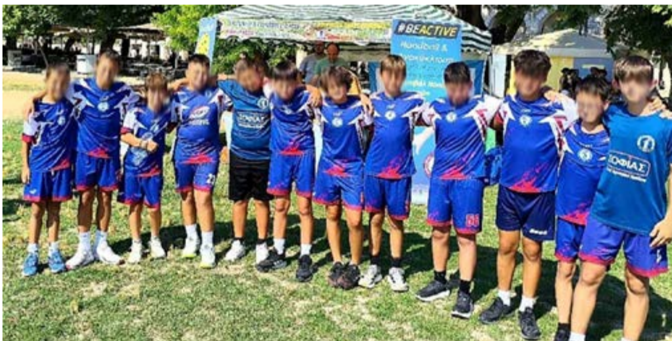
Τα παιδιά μετέφεραν το ηχηρό μήνυμα της ζωής

ΚΕΡΚΥΡΑ. Μια ακόμη πολύ επιτυχημένη εκδήλωση έγινε από το ΕΣΥΝ το Σάββατο στην Κ. Πλατεία, με συμμετοχή δεκάδων παιδιών (από Κέρκυρα και Ηγουμενίτσα) που έπαιξαν χάντμπολ στο γρασίδι, ενώ υπήρχε και επίδειξη του Ολυμπιακού αθλήματος τσεκβοντό από τα παιδιά του Ηρακλή Κέρκυρας. Τα μηνύματα που έχουν σχέση με τον αγώνα ενάντια στα ναρκωτικά (κάθε είδους), αλλά και για την παγκόσμια ειρήνη να κυριαρχούν. Εξαιρετική εκδήλωση η 2η φέτος, θα ακολουθήσει τον επόμενο μήνα στον Αγ. Ματθαίο μια ακόμα εκδήλωση, καλλιτεχνική αυτή τη φορά.