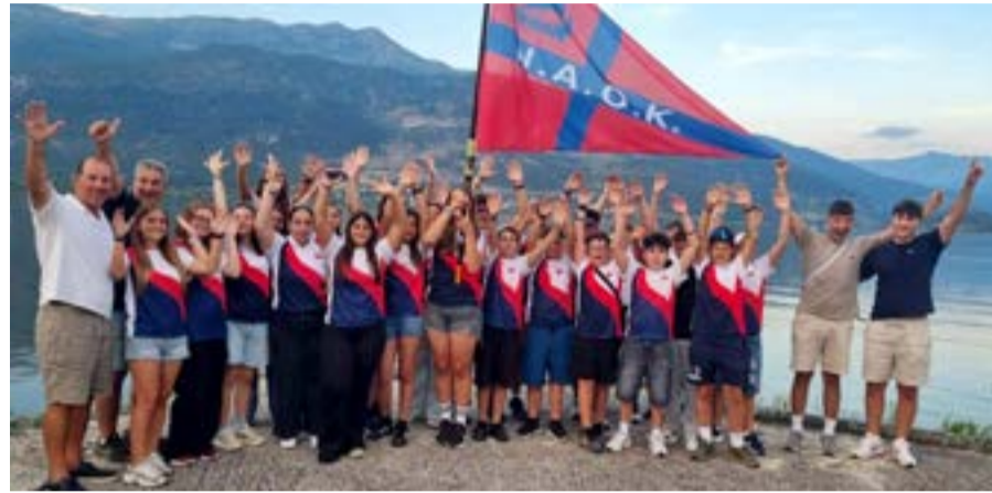
Τα παιδιά του ΝΑΟΚ κράτησαν ψηλά τη σημαία του ομίλου

λια ανάμεσα σε 22 σωματεία! Πίσω από αυτή τη σπουδαία συλλογική προσπάθεια βρίσκονται οι άνθρωποι που καθοδηγούν και στηρίζουν καθημερινά τα παιδιά μας: