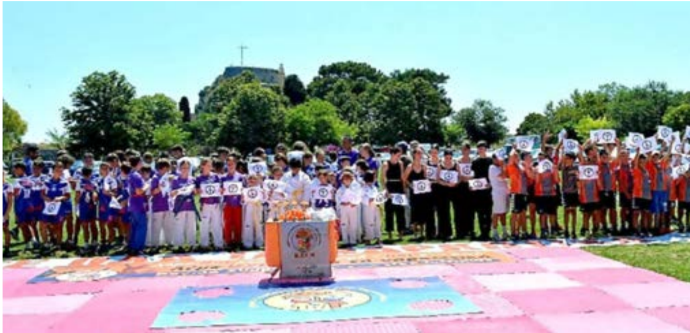
Από τη γιορτή της ζωής και του αθλητισμού στην Κάτω Πλατεία

Θα ακολουθήσει τον επόμενο μήνα στον Αγ. Ματθαίο μια ακόμα εκδήλωση, καλλιτεχνική αυτή τη φορά.