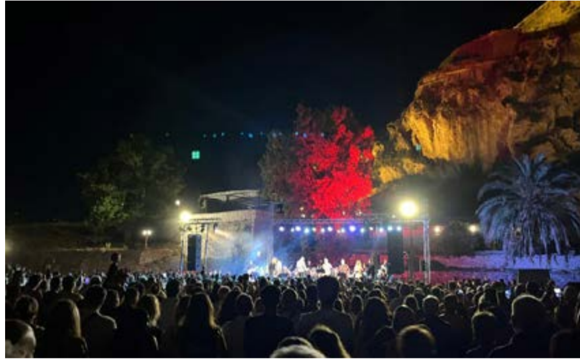
Η συναυλία ήταν μια γιορτή στη μνήμη του Λαυρέντη Μαχαιρίτσα