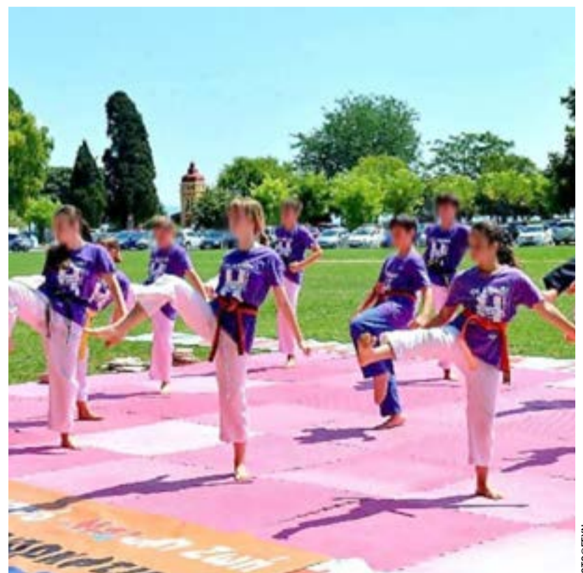
Από την επίδειξη τσεκβοντό της ομάδας του Ηρακλή