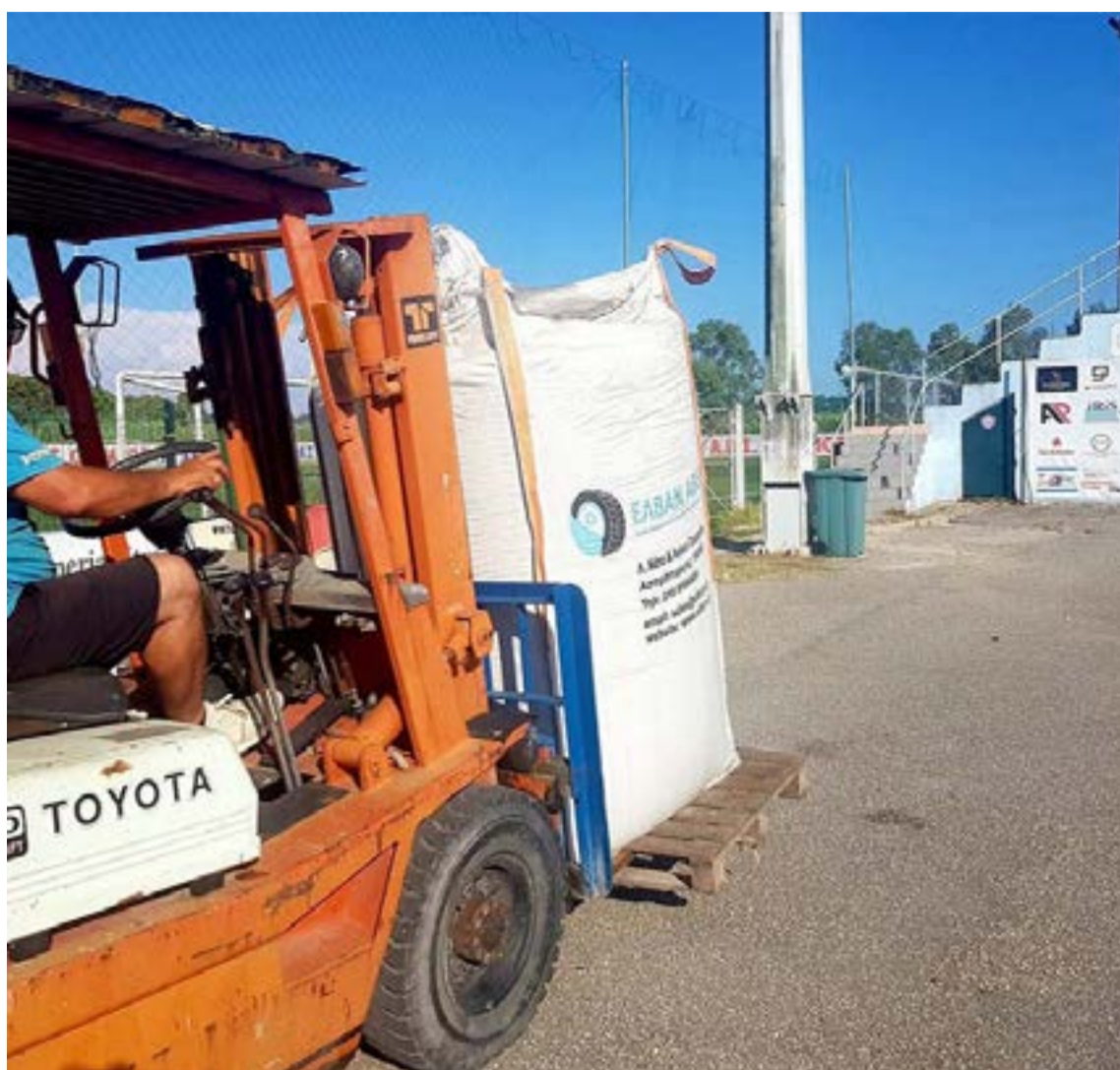
Συnergείο από την Πάτρα εργάζεται ήδη στο χώρο του γηπέδου