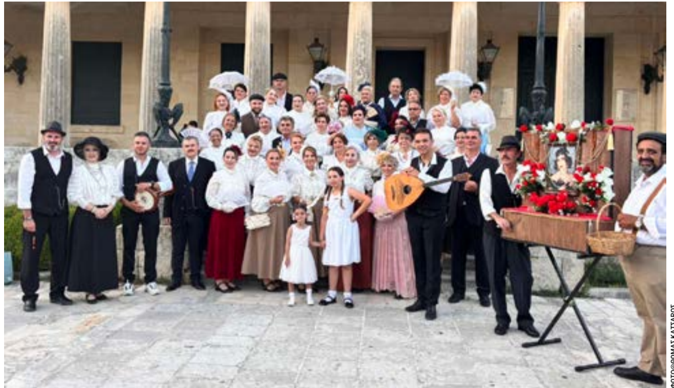
Το συγκρότημα και οι μουσικοί της παράστασης

Φεύγοντας από την εκδήλωση ένιωσα περήφανος. Περήφανος γιατί στον τόπο μας υπάρχουν άνθρωποι που κρατούν αναμμένη τη φλόγα της παράδοσης και αποδεικνύουν ότι οι γειτονιές της μνήμης συνεχίζουν να ζουν μέσα στις καρδιές μας. Θωμάς Κατσαρός, Πρόεδρος Συνδέσμου Ιδιοκτητών Λεωφορείων Υπεραστικού ΚΤΕΛ Κέρκυρας.