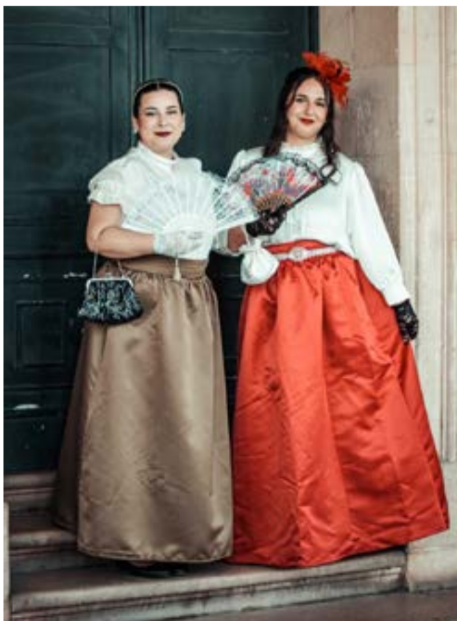
Ο φορεσιές των κυράδων στην δύο πόλεων