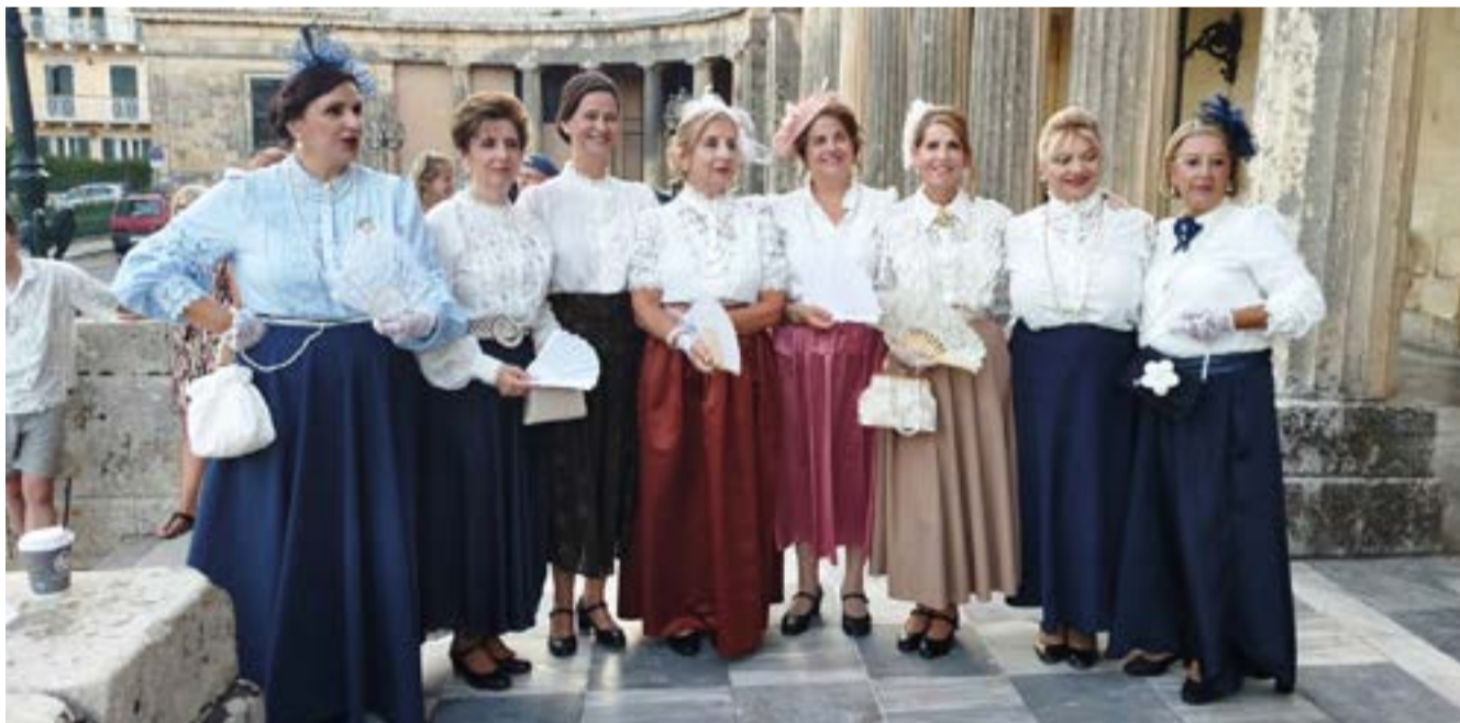
Η Χορευτική Ομάδα Υπεραστικού ΚΤΕΛ Κέρκυρας «Ο Άγιος Χριστόφορος»