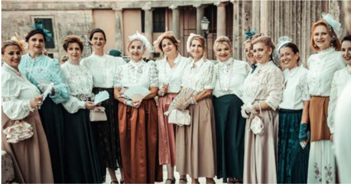
Τα κορίτσια του συγκροτήματος «Ο Άγιος Χριστόφορος»