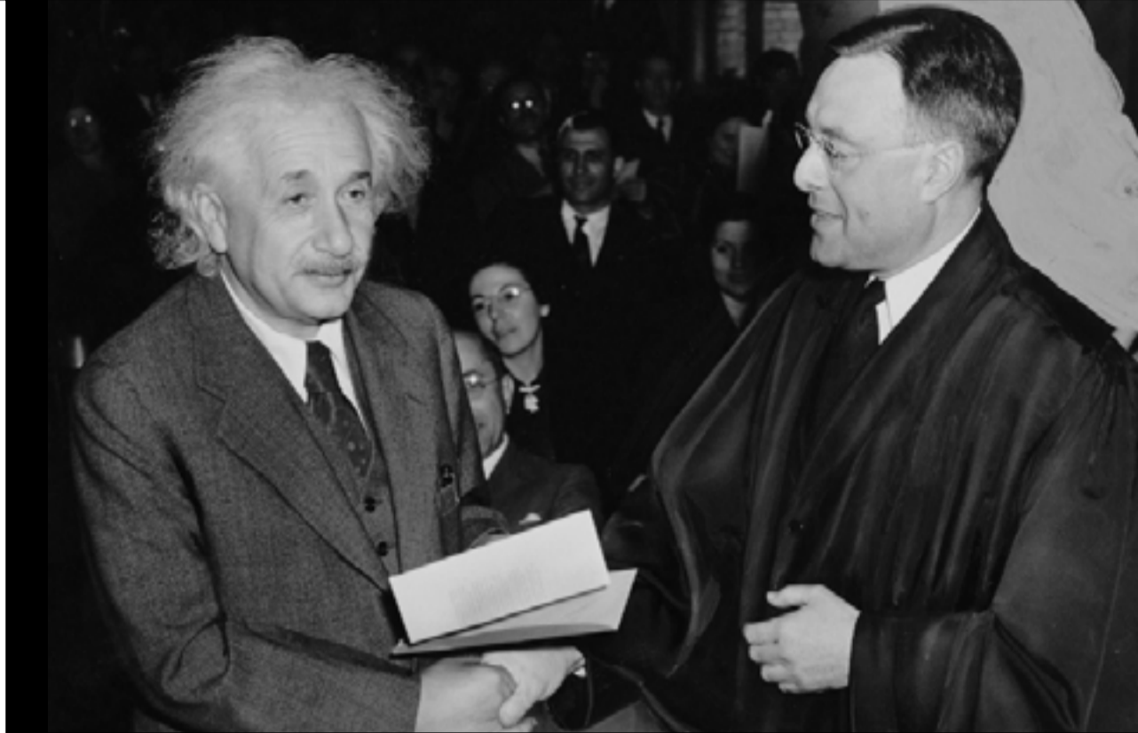
Ο Άλμπερτ Αϊνστάιν δεν έκανε ποτέ επίσημο τεστ νοημοσύνης, σύμφωνα με ιστορικές εκτιμήσεις ειδικών, υπολογίζεται γύρω στο 160.

Ο δεύτερος λόγος είναι πιο διαχρονικός. Η διαστρωμάτωση του πληθυσμού με βάση το μετρούμενο νοητικό πηλίκιο καταλήγει πάντοτε στο ίδιο συμπέρασμα, ότι οι άνθρωποι δεν είναι μεταξύ τους ίσοι ως