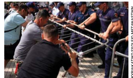
ΚΥΡΙΑΚΑΚΙΟ ΣΚΟΛΕΙΟ ΜΕΤΑΝΑΣΤΩΝ

ΚΕΡΚΥΡΑ. Υπάρχουν κάποιες βραδιές που δεν τελειώνουν όταν σβήσουν τα φώτα. Μένουν μέσα σου. Σε ακολουθούν στον δρόμο της επιστροφής, γίνονται σκέψη, συγκίνηση και, τελικά, ευγνωμοσύνη. Μια τέτοια βραδιά είχα την τύχη να ζήσω παρακολουθώντας το 2ο Φεστιβάλ Παραδοσιακών Χορών της Χορευτικής Ομάδας Υπεραστικού ΚΤΕΛ Κέρκυρας «Ο Άγιος Χριστόφορος». Η ΕΛΕΝΗ ΚΟΡΩΝΑΚΗ. ΣΕΛΙΔΕΣ 10&11