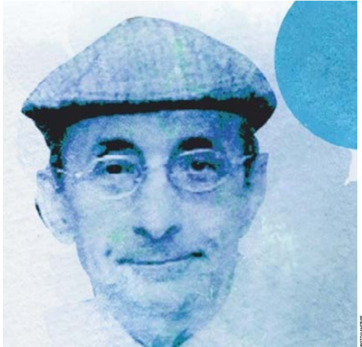
Η αφίσα της παράστασης