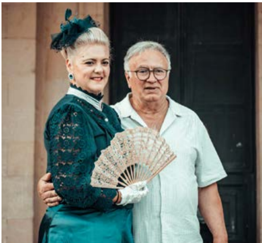
Η ιστορία δεν βρίσκεται μόνο στα βιβλία, αλλά ζει μέσα στα τραγούδια, στους χορούς και στις μνήμες που περνούν από γενιά σε γενιά