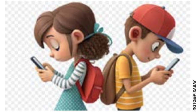
Δευτέρα 6 Ιουλίου 2026 στις 6.30 μ.μ. στο Ιατροκοινωνικό Κέντρο Κέρκυρας

- ίδρυση ενός δημόσιου ΚΔΑΠ στο Δήμο μας με προσωρινή στέγαση σε κατάλληλο κτίριο (π.χ 4ο ΓΕΛ) και εύρεση νέου χώρου στέγασης την επόμενη χρονιά.