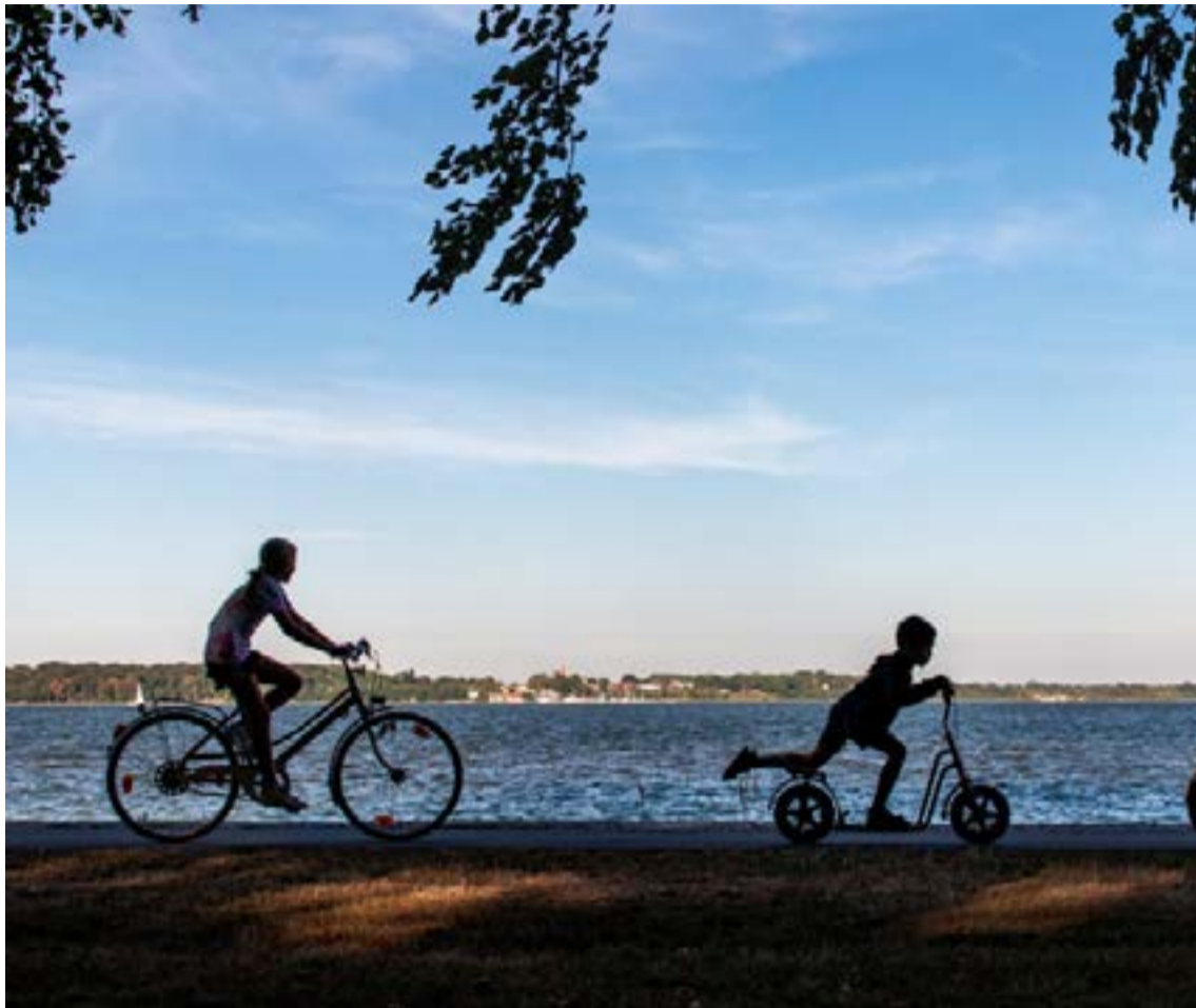
Ως προσωρινή λύση η Ένωση ζητά να ανοίγουν τα απογεύματα τα προαύλια των σχολείων που διαθέτουν αθλητικές εγκαταστάσεις