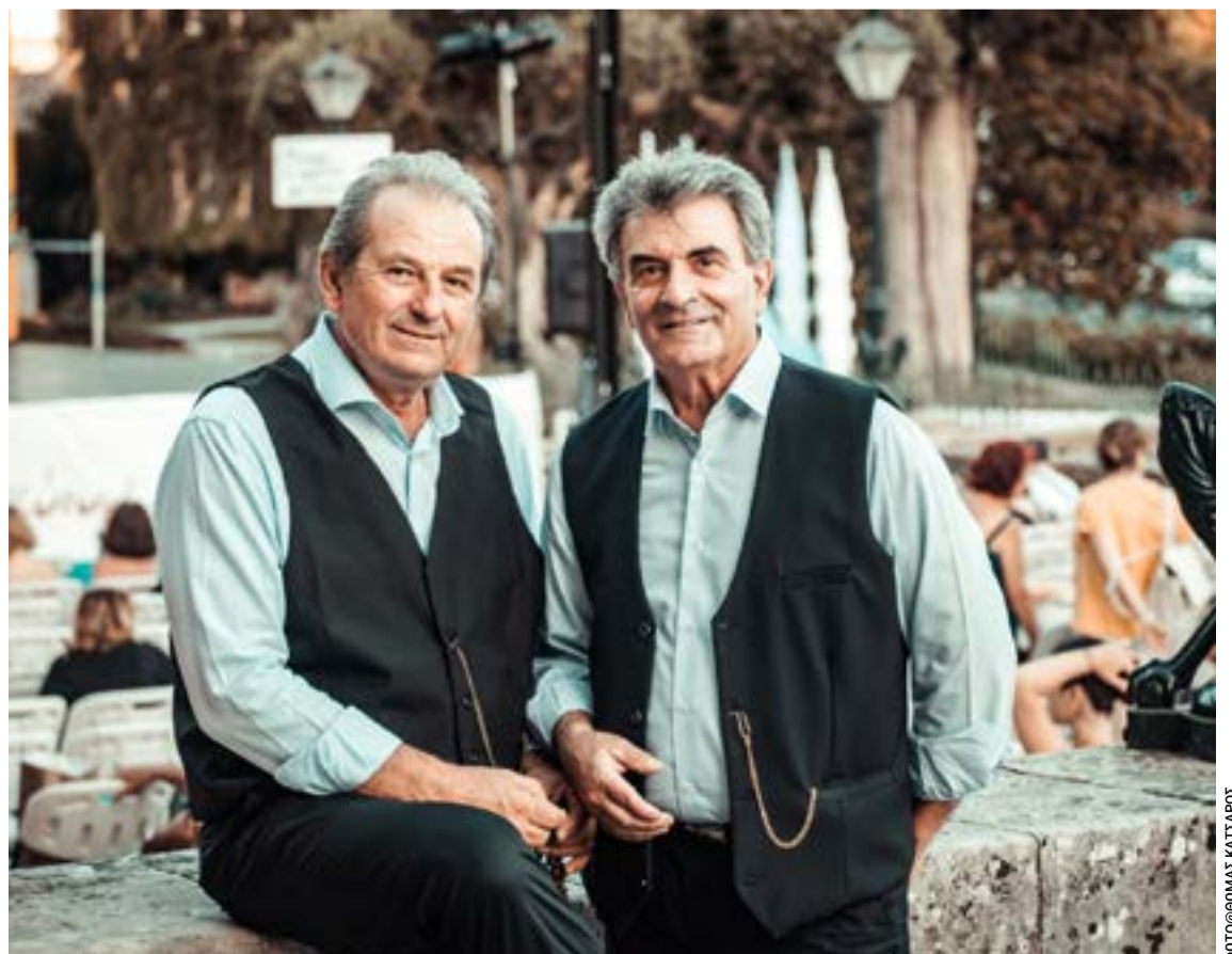
Οι χορευτές του συγκροτήματος