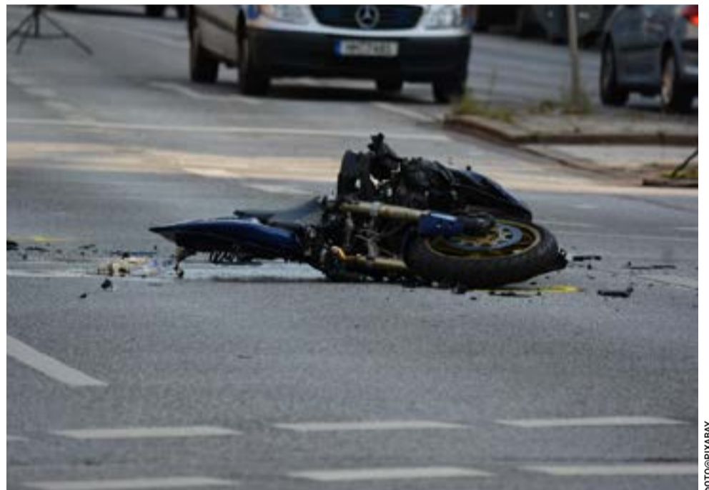
Τα αίτια του δυστυχήματος διερευνά η Τροχαία

Και όσο αυτό συμβαίνει, υπάρχει λόγος να πιστεύουμε ότι το νησί δεν έχει πει ακόμη την τελευταία του λέξη.