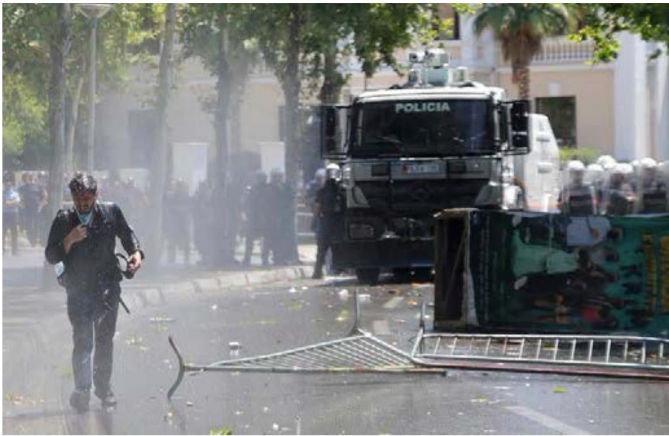
Σε πεδίο μάχης μετατράπηκε ο χώρος έξω από το αλβανικό κοινοβούλιο την Πέμπτη, όταν οι αστυνομικές δυνάμεις επιστράτευαν δακρυγόνα και ρίψεις νερού με πίεση, προκειμένου να απωθήσουν ένα οργισμένο πλήθος αντικυβερνητικών διαδηλωτών.