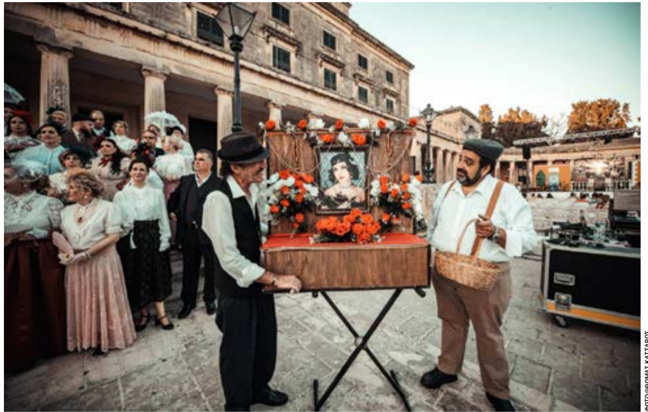
Ταξίδι στο χρόνο και στις γειτονιές της Πόλης και της Σμύρνης