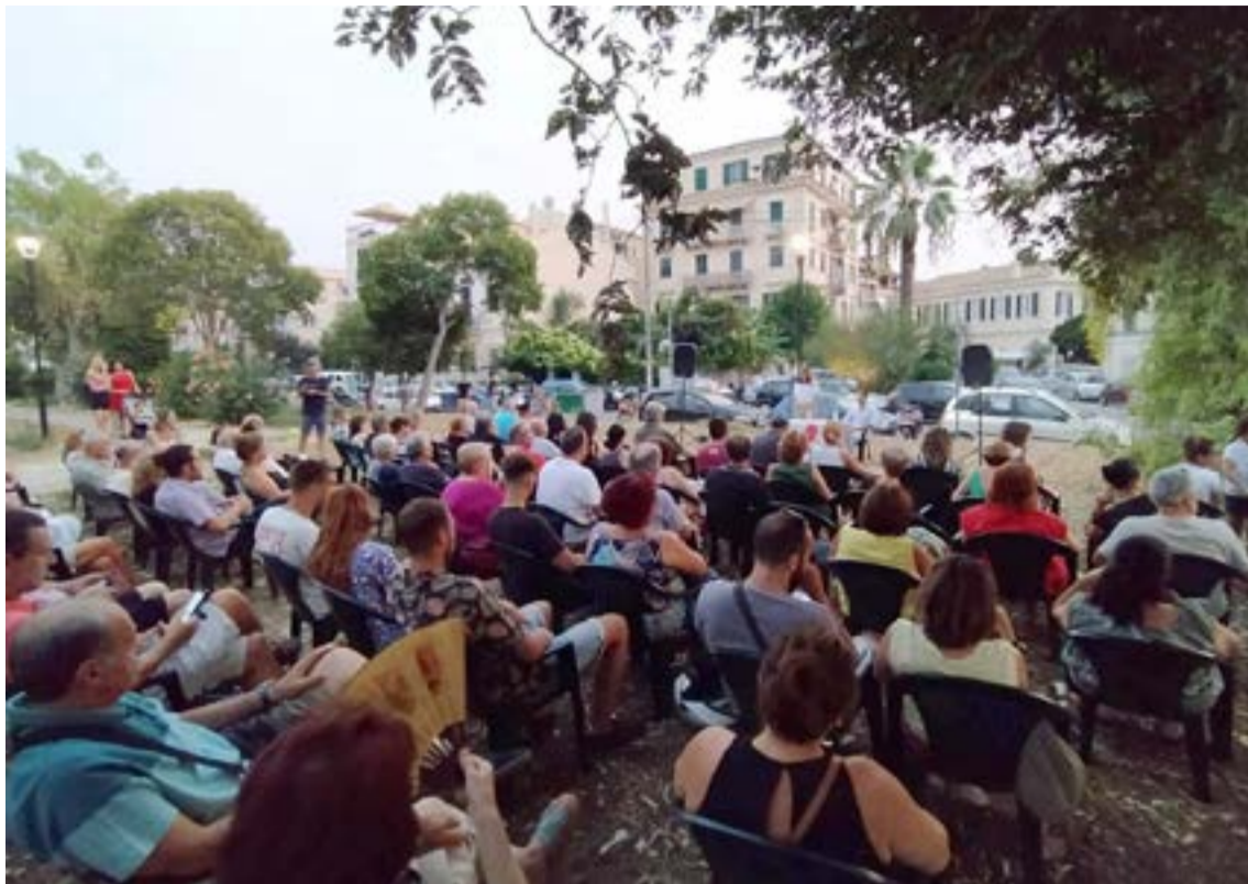
Από εκδήλωση της ΛΑΣΥ για τη Γαρίτσα