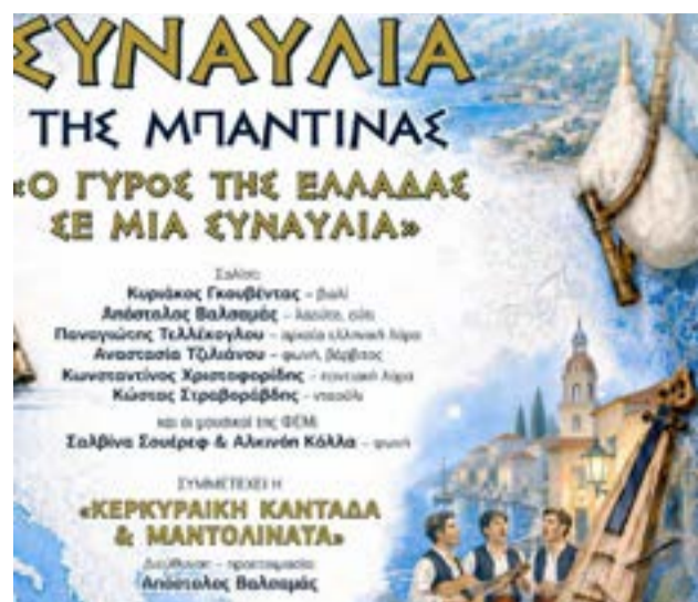
Η αφίσα της συναυλίας