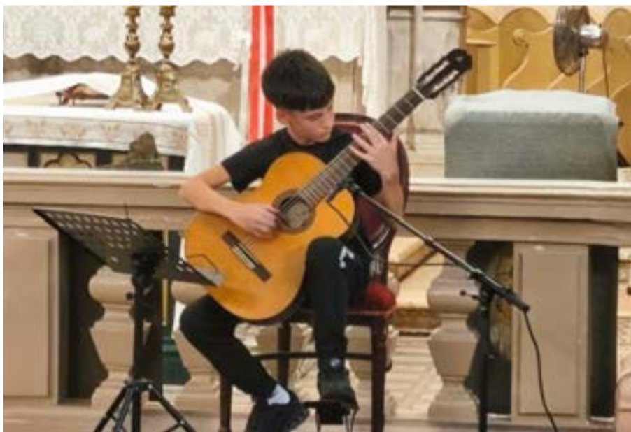
Από τις πτυχιακές εξετάσεις του Ωδείου

Η εκδήλωση θα πραγματοποιηθεί στην αίθουσα της Ιατροχειρουργικής Εταιρείας Κερκύρας, στην οδό Σκαρμαγκαά 4, και απευθύνεται σε επιστήμονες, επαγγελματίες της υγείας, φοιτητές αλλά και σε κάθε πολίτη που ενδιαφέρεται για τις επιπτώσεις της Τεχνητής Νοημοσύνης στη σύγχρονη κοινωνία.