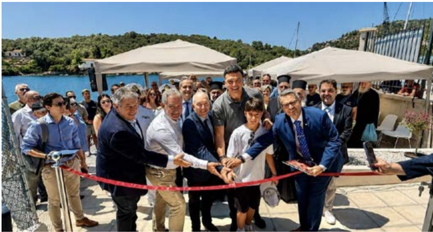
Ο υπουργός Ναυτιλίας Βασίλης Κικίλιας και ο υφυπουργός Στέφανος Γκίκας στα εγκαίνια του νέου Επιβατικού Σταθμού του λιμένα Γαΐου Παξών.