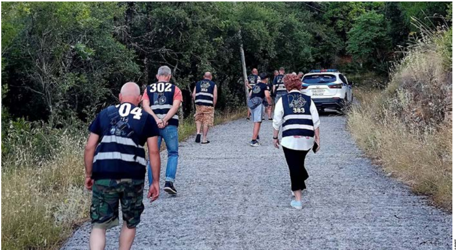
Εθελοντές της ΑΛΜΚΕ στο δρόμο προς το Ραντάρ στους Αγίους Δέκα, όπου, σύμφωνα με τη λέσχη, δεν τους επιτρέπεται η πρόσβαση από τις αρμόδιες υπηρεσίες λόγω της απαγόρευσης κυκλοφορίας που ίσχυε εκείνη την ημέρα εξαιτίας του υψηλού κινδύνου πυρκαγιάς.