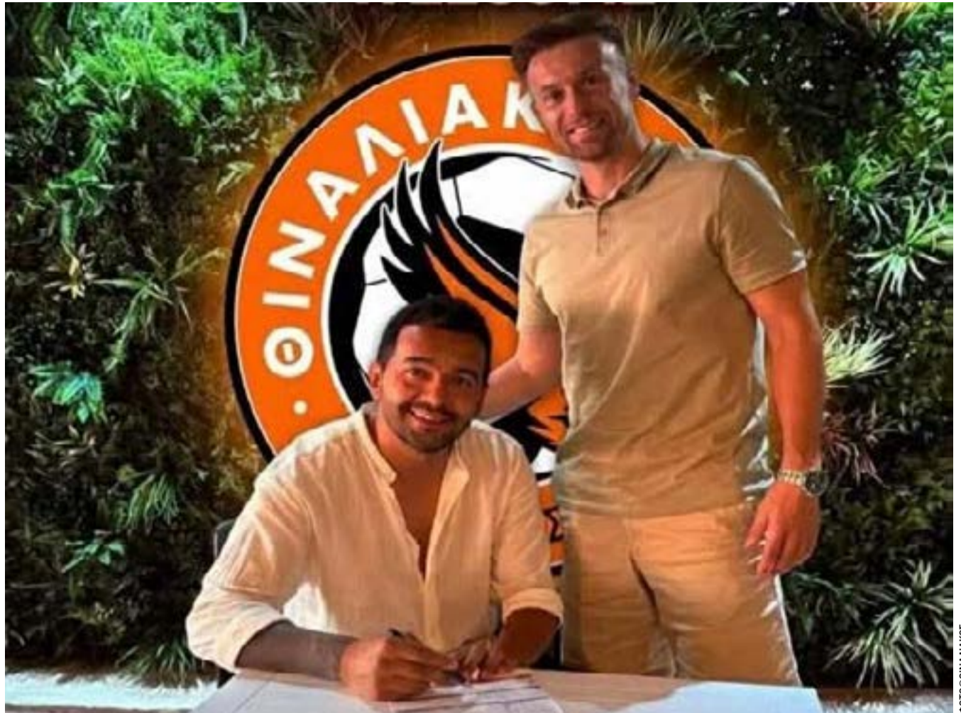
Ο Θιναλιακός καλωσορίζει τον έμπειρο επιθετικό στην οικογένεια του