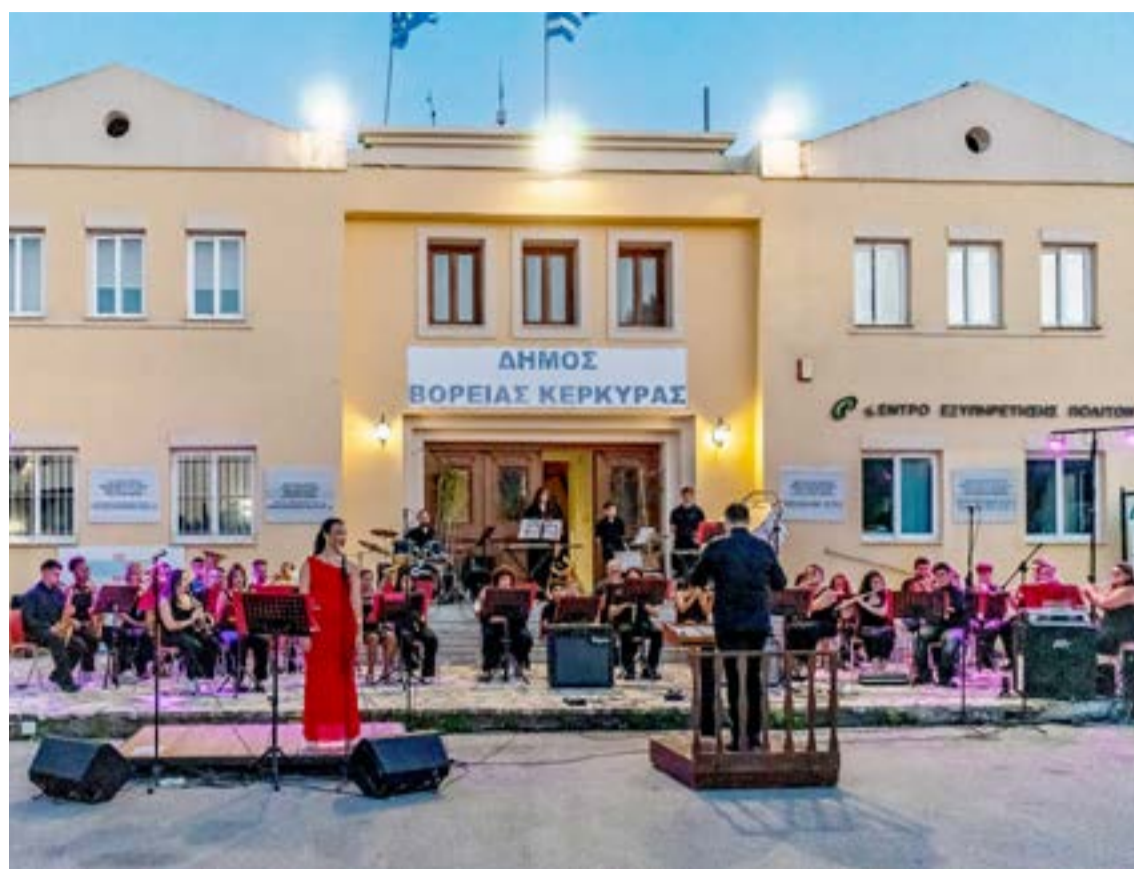
Από τη συναυλία στην πλατεία Δημαρχείου