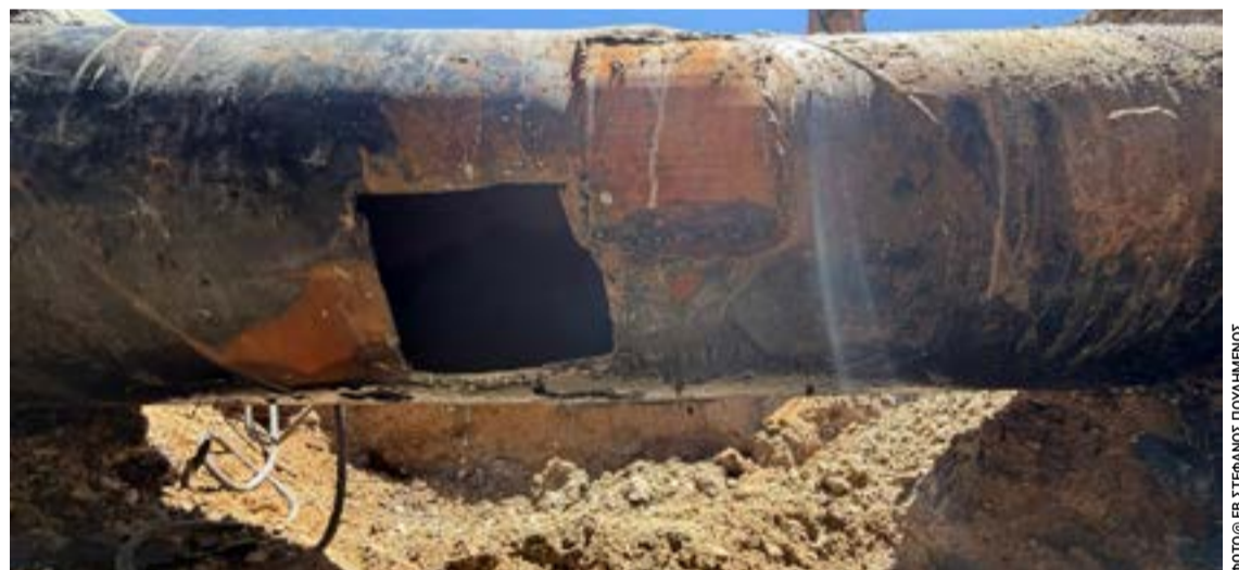
Ο αγωγός νερού από την Χρυσίδα πριν από τις πολλές επισκευές του.

Ένα ενιαίο πρόγραμμα που θα καταγράψει το πραγματικό απόθεμα των υποδομών, θα αξιολογήσει την κατάστασή τους, θα ιεραρχήσει τις παρεμβάσεις με αντικειμενικά κριτήρια και θα δεσμεύσει διαδοχικές δημοτικές, περιφερειακές και κυβερνητικές διοικήσεις ανεξάρτητα από πολιτικές εναλλαγές.