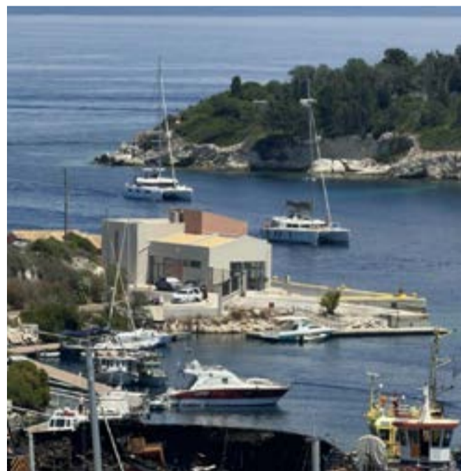
Το κτίριο των 320 τ.μ. αποτελεί τη νέα πύλη εισόδου των Παξών, εξυπηρετώντας ακτοπλοΐα, μικρή κρουαζιέρα και μελλοντικά το υδατοδρόμιο του νησιού.

Ο υπουργός Βασίλης Κικίλιας χαρακτήρισε το έργο μέρος ενός ευρύτερου σχεδίου ενίσχυσης των νησιωτικών υποδομών, υπογραμμίζοντας ότι οι Παξοί χρειάζονται εγκαταστάσεις αντίστοιχες της τουριστικής και αναπτυξιακής δυναμικής